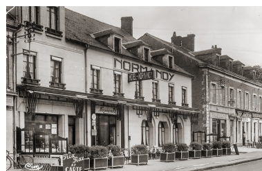
Vue ancienne. IVR26_20195800766NUC4A