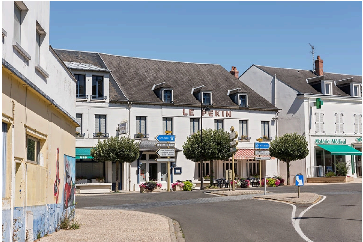
Vue actuelle, prise depuis l'avenue de la Gare.