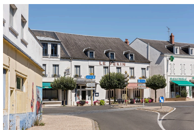
Vue actuelle, prise depuis l'avenue de la Gare. IVR26_20205800521NUC4A