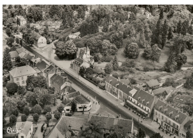
Vue aérienne du carrefour de l'avenue de Paris et de l'avenue de la Gare.