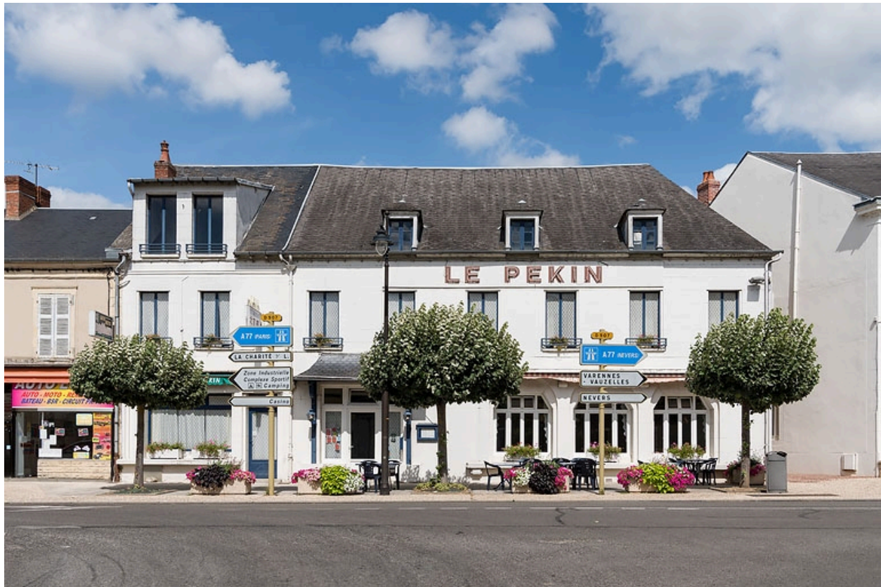
Vue ancienne, prise depuis l'avenue de Paris.