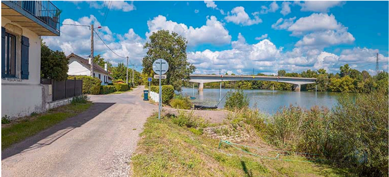
Le port Guillot à Lux (71).