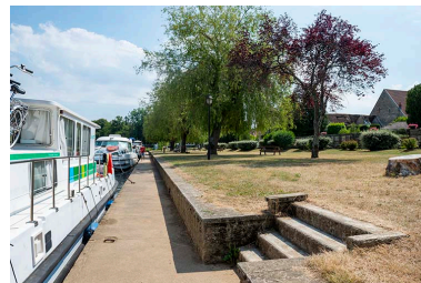
Halte fluviale à Mantoche (70).