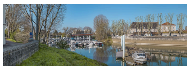
Le port de plaisance de Chalon-sur-Saône.