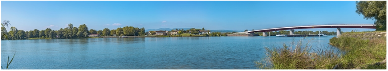
Halte nautique de Crêches-sur-Saône.