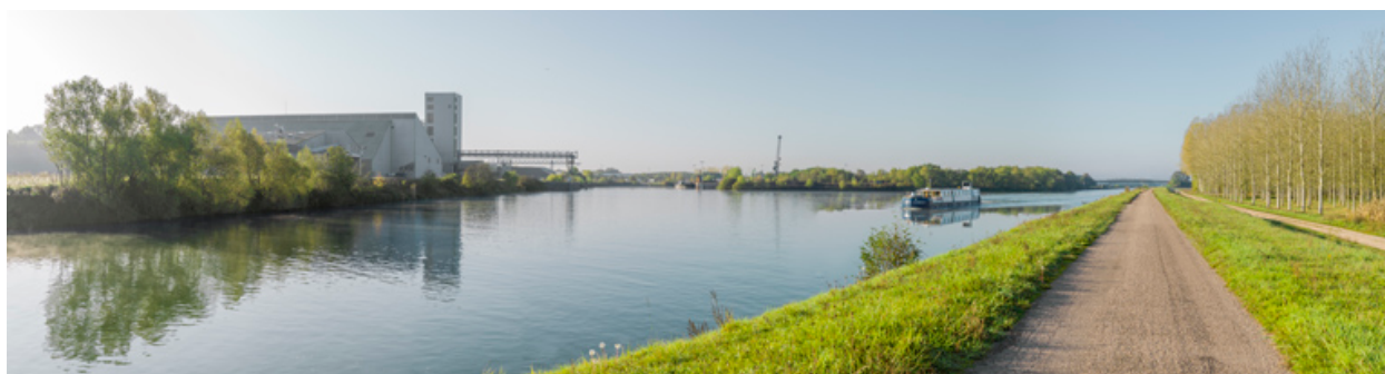
Le Technoport de Pagny, sur la dérivation de Seurre.