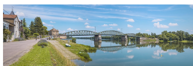
Pont et quai à gradins de Fleurville. IVR26_20217100524NUC4A