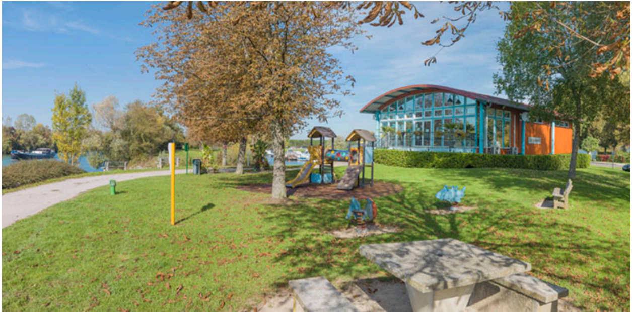
Capitainerie du port de plaisance de Seurre (21).