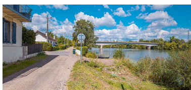
Le port Guillot à Lux (71).