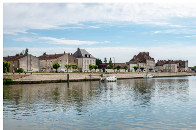
Le quai Villeneuve, Gray.