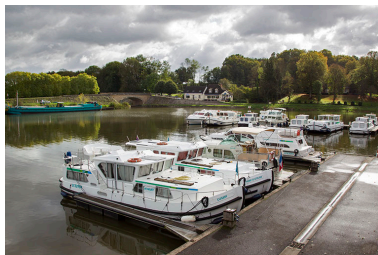
Port de plaisance à SCEy-sur-Saône-et-Saint-Albin (70). IVR43_20167001861NUC2A