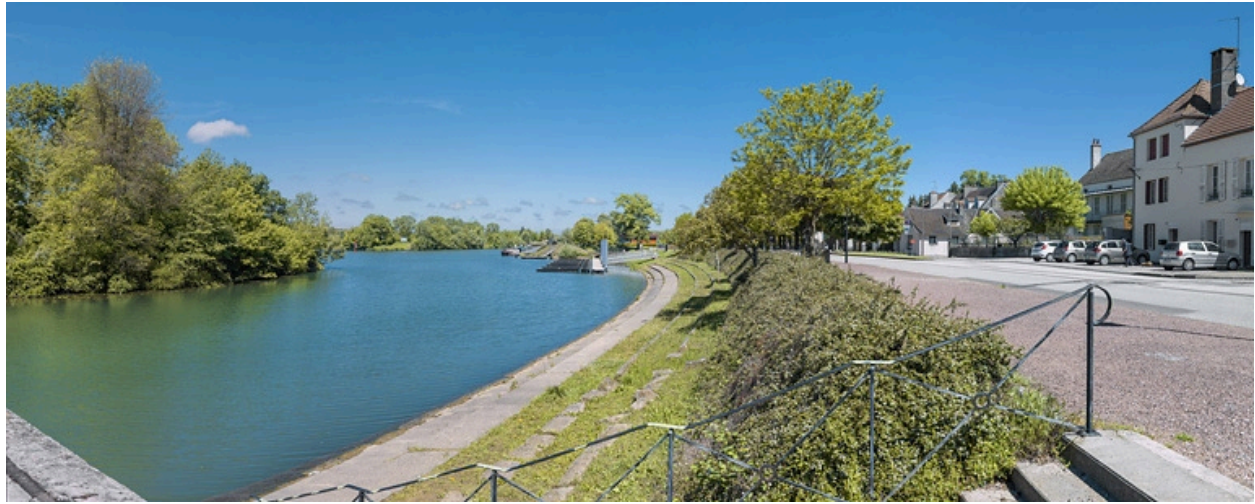
Les quais à gradins de Seurre, avant restauration.