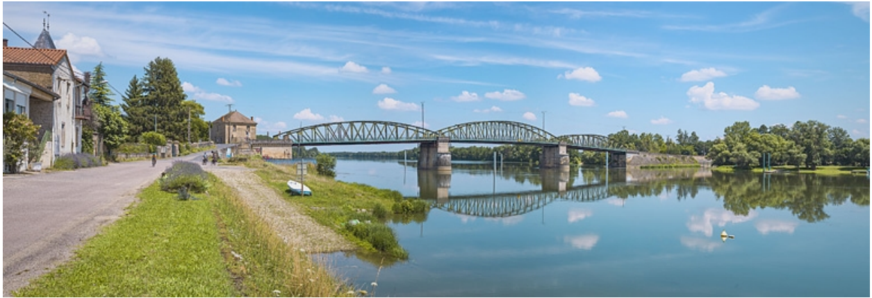
Pont et quai à gradins de Fleurville.