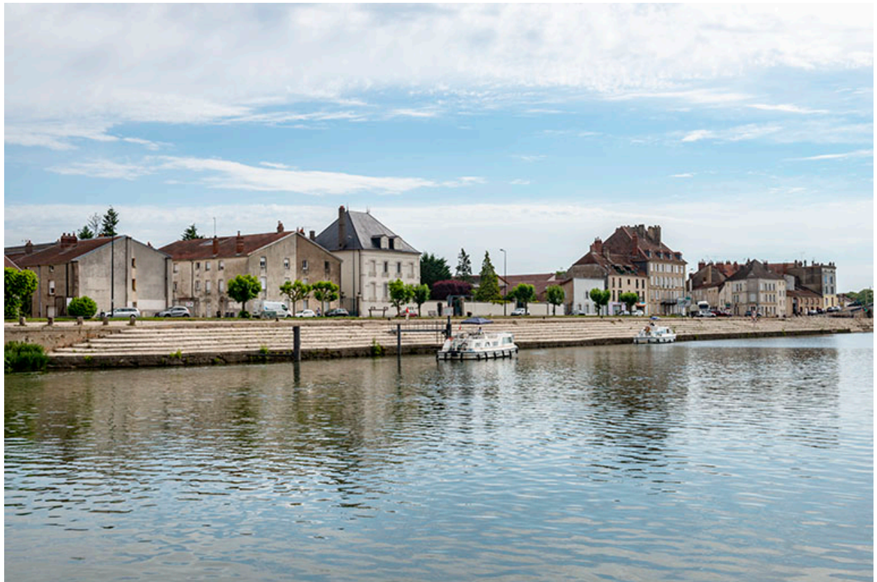
Le quai Villeneuve, Gray.