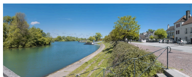
Les quais à gradins de Seurre, avant restauration. IVR26_20172100257NUC4A