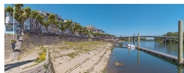
Quai à gradins de Tournus. IVR26_20217100459NUC4A