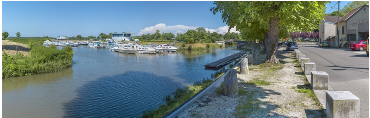
Le port de plaisance de Pontailleur-sur-Saône.