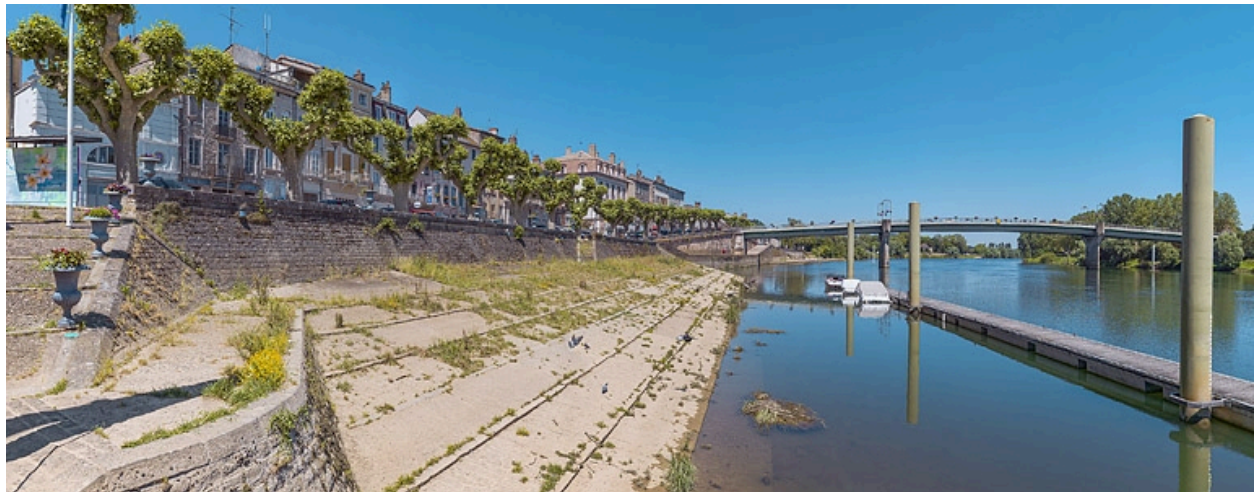
Quai à gradins de Tournus.