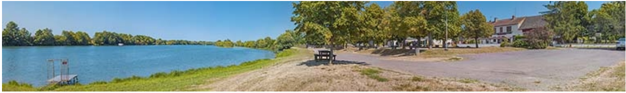
Le port d'Allériot (71).