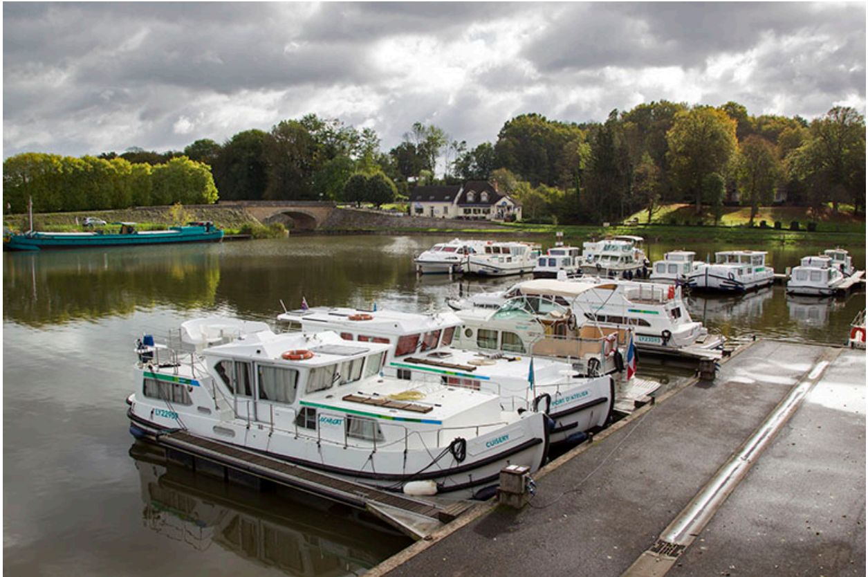
Port de plaisance à SCey-sur-Saône-et-Saint-Albin (70).