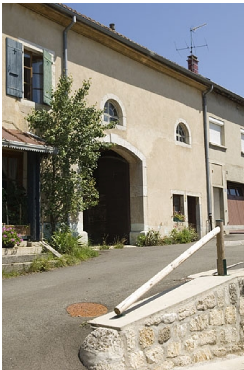
Vue de trois quart rapprochée.