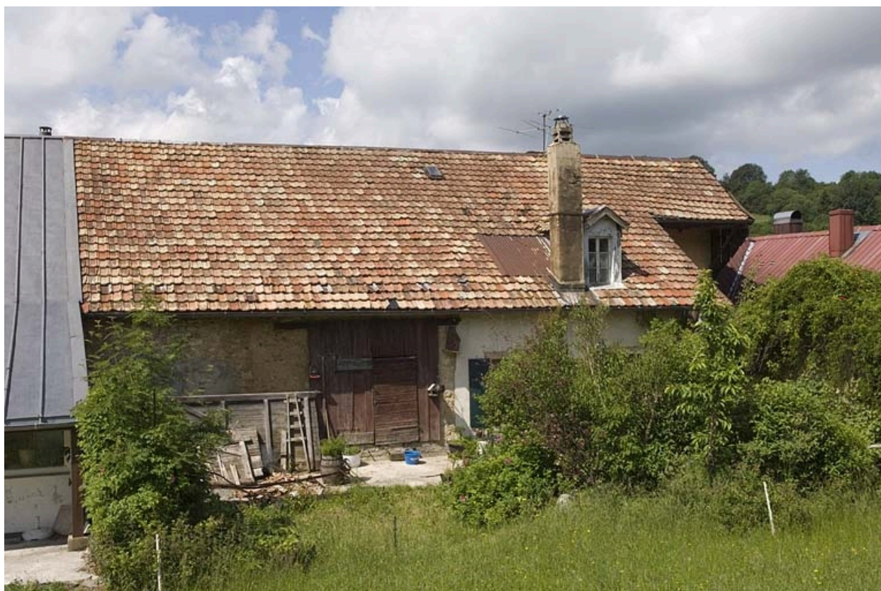
Vue du côté jardin.