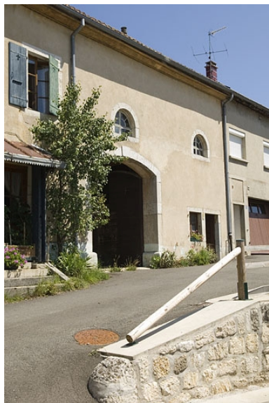
Vue de trois quart rapprochée.