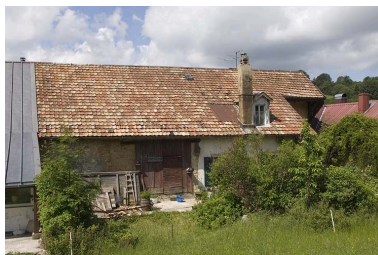
Vue du côté jardin.