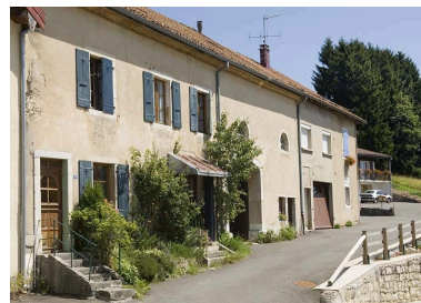
Vue de trois quart gauche. IVR43_20092500965NUC2A