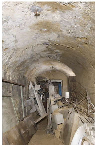
"Cave" derrière la grange. IVR43_20082500796NUC2A