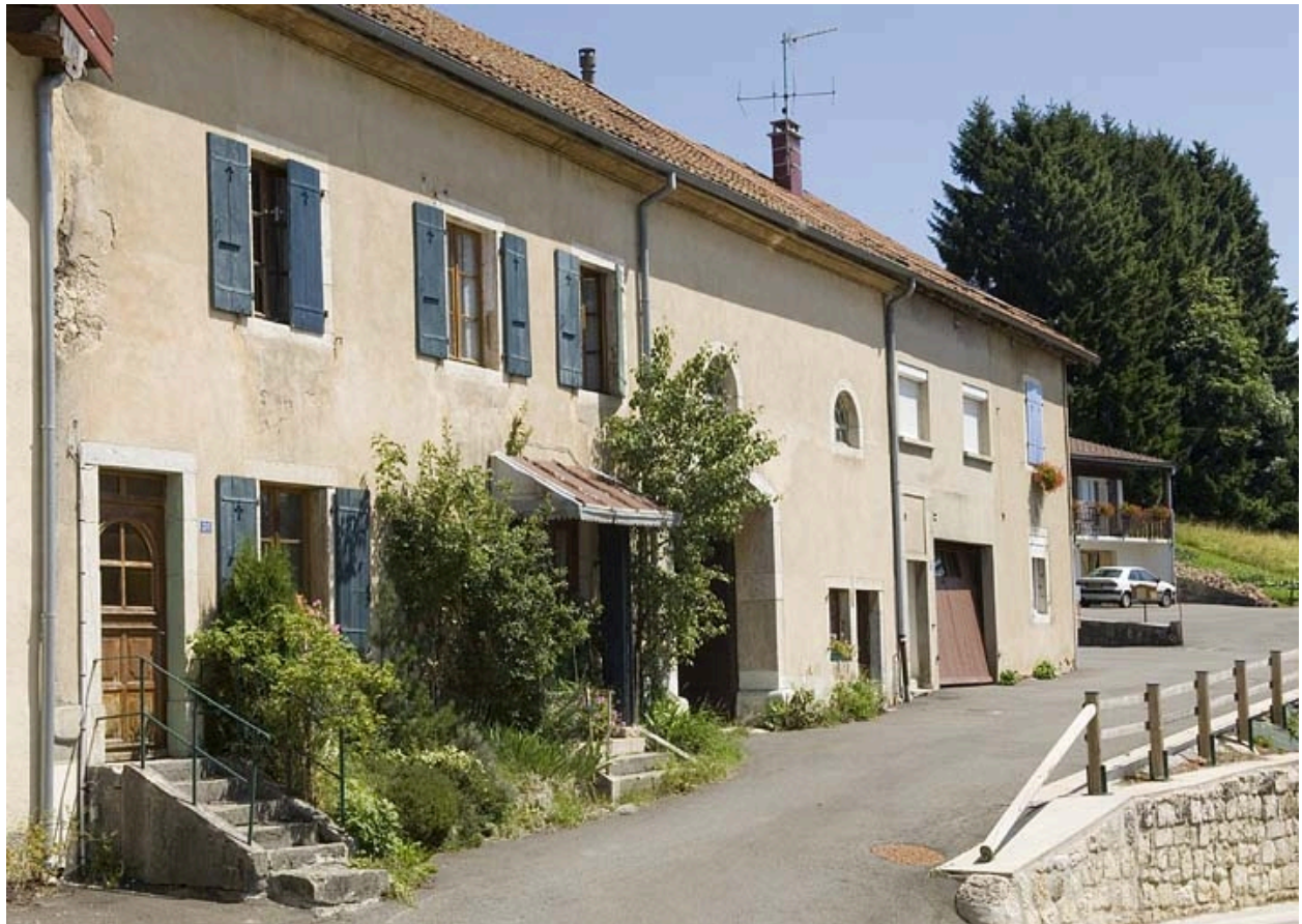
Vue de trois quart gauche.