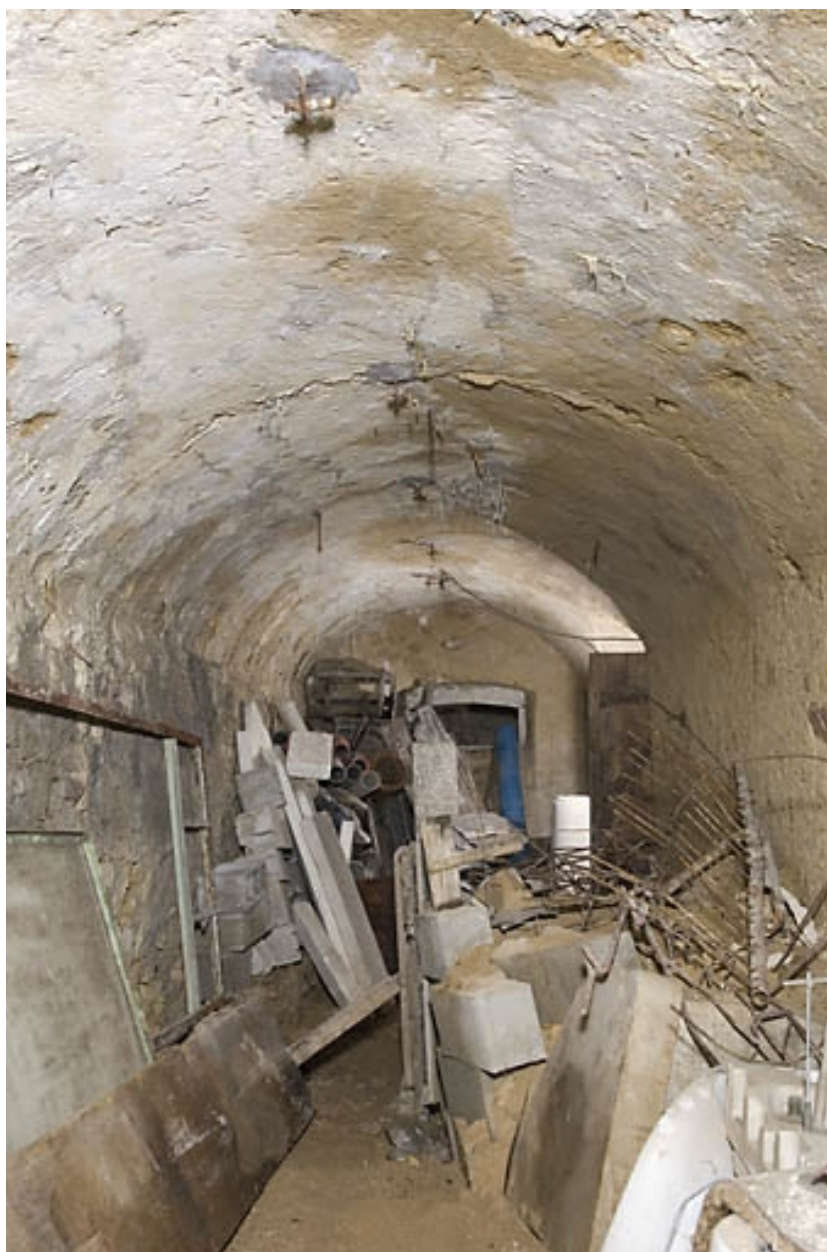
"Cave" derrière la grange.