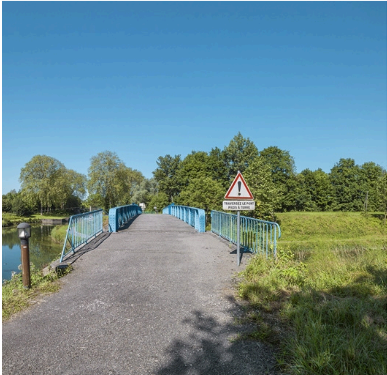
Vue du dessus.