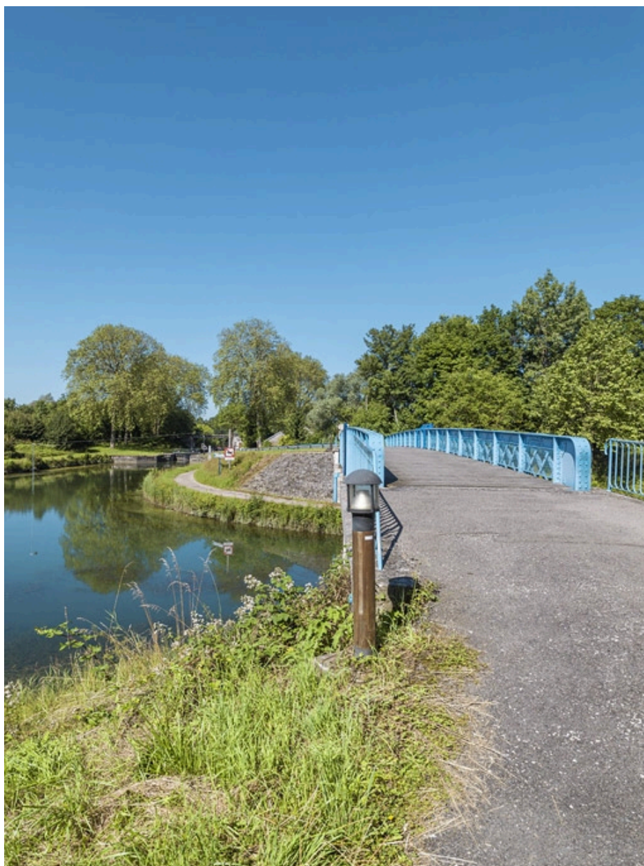
Vue du dessus, avec à gauche le site d'écluse 18.