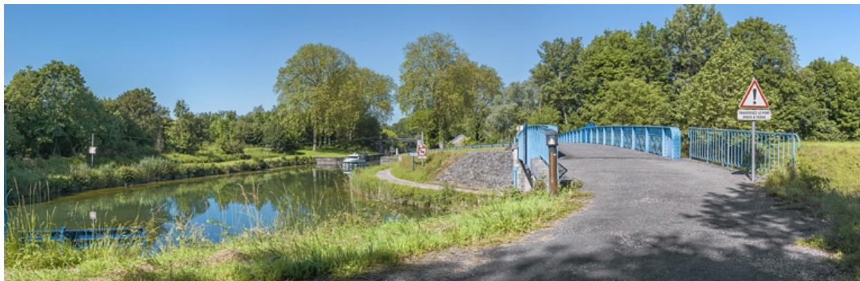
Vue du dessus, avec à gauche le site d'écluse 18.