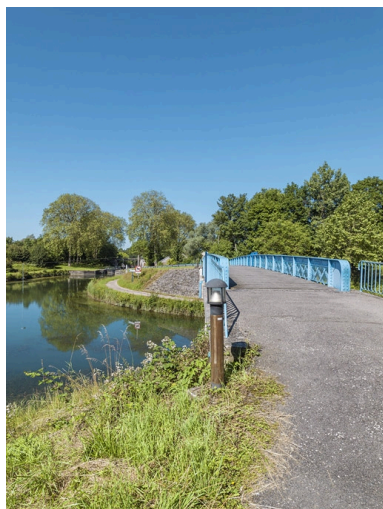
Vue du dessus, avec à gauche le site d'écluse 18. IVR26_20162101276NUC4A