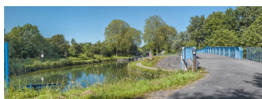
Vue du dessus, avec à gauche le site d'écluse 18.