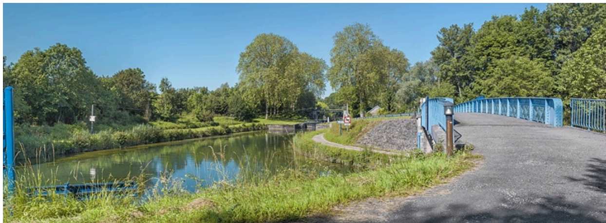
Vue du dessus, avec à gauche le site d'écluse 18.