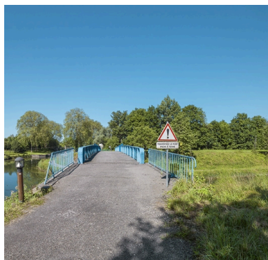
Vue du dessus. IVR26_20162101279NUC4A