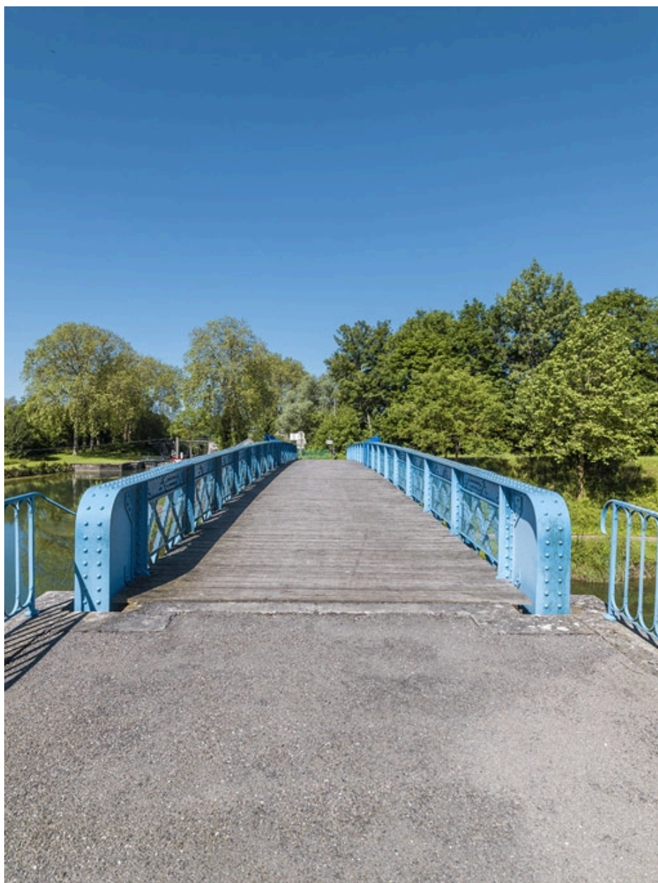
Vue du dessus.