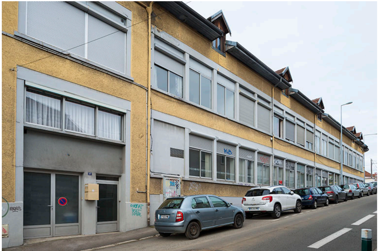
Façade sur la rue Marie-Louise, vue de trois quarts.