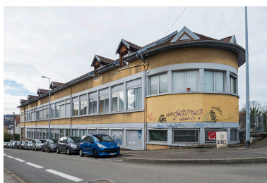
Vue d'ensemble depuis le nord-est. IVR43_20182500591NUC4A