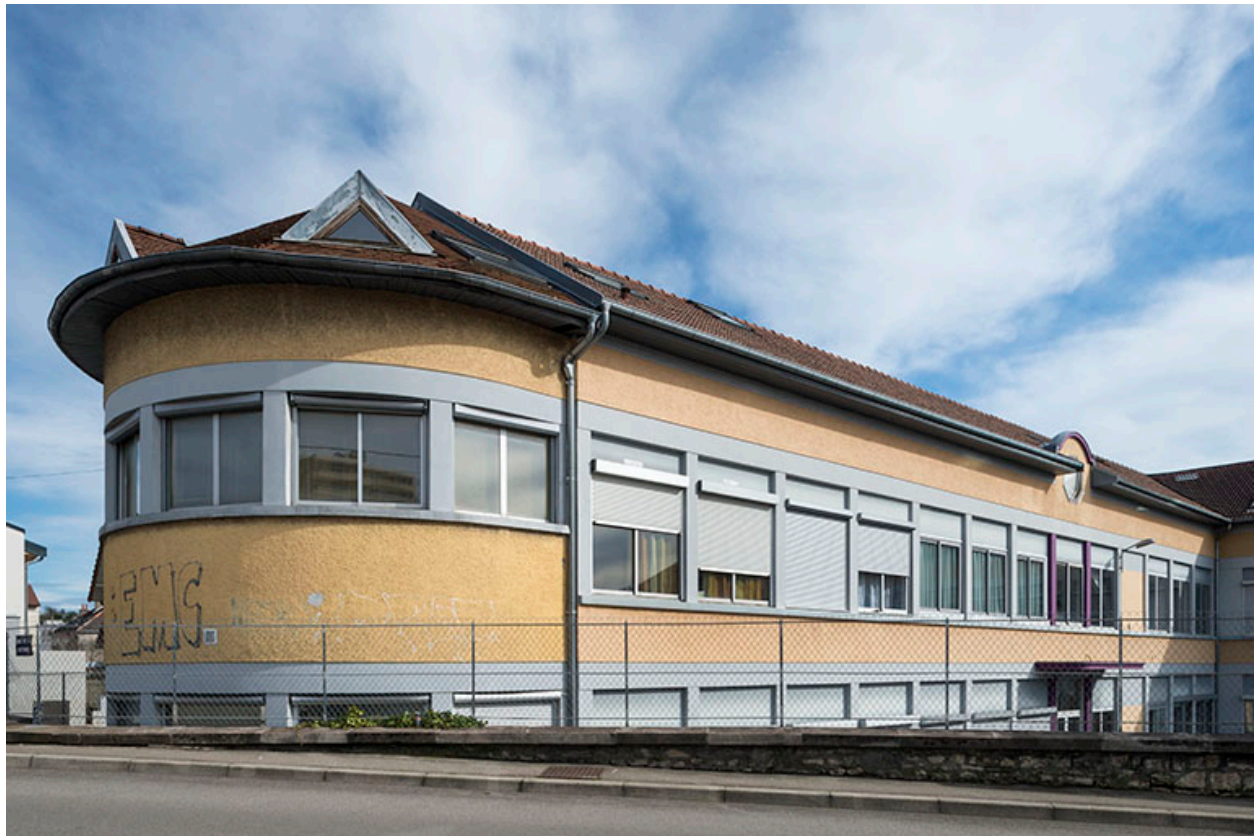
Extrémité nord de l'atelier est, depuis la rue de la Rotonde.