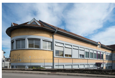
Extrémité nord de l'atelier est, depuis la rue de la Rotonde. IVR43_20182500595NUC4A