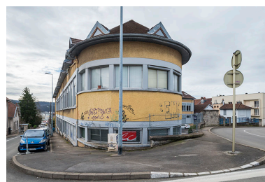
Vue depuis le nord. IVR43_20182500590NUC4A