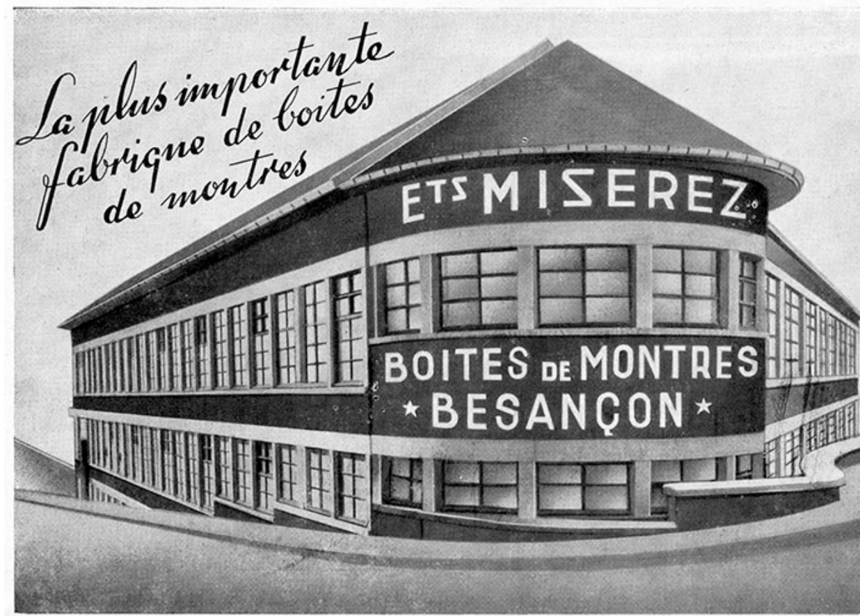
Usine de boîtes de montres Miserez, gravure, s.d. [1951].