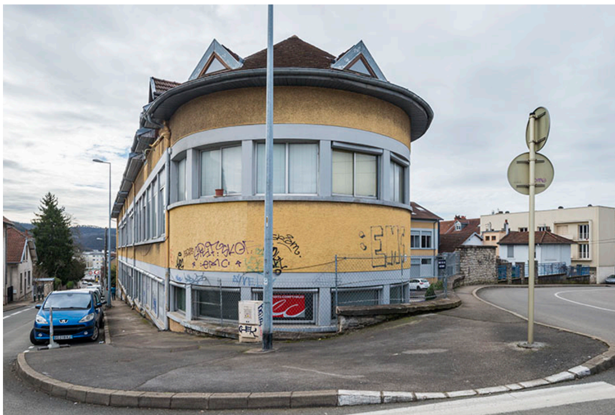
Vue depuis le nord.