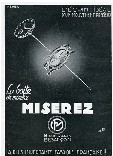
Boîte de montre Miserez, publicité, 1947. IVR43_20182500752NUC4A