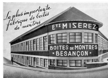
Usine de boîtes de montres Miserez, gravure, s.d. [1951]. IVR43_20182500200NUC4A