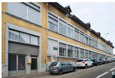
Façade sur la rue Marie- Louise, vue de trois quarts. IVR43_20182500593NUC4A