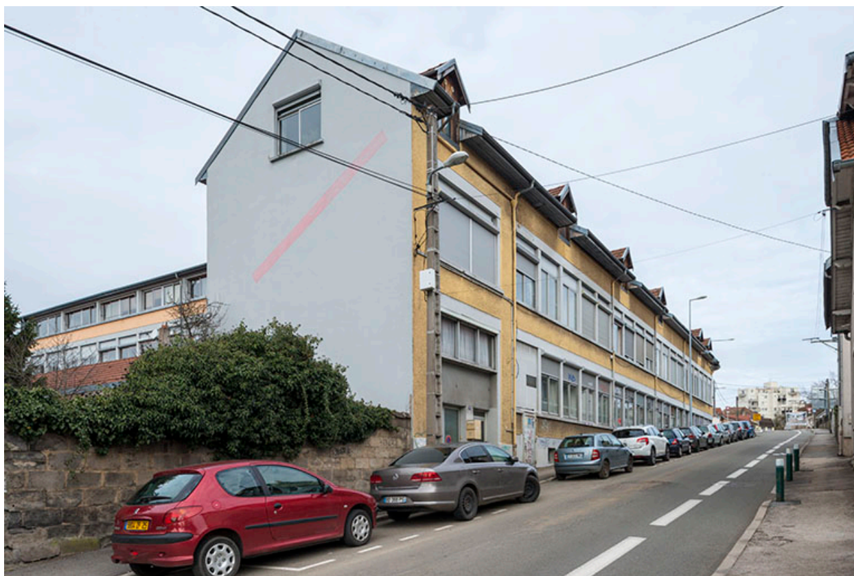
Vue d'ensemble depuis la rue Marie-Louise.