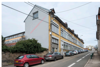
Vue d'ensemble depuis la rue Marie-Louise. IVR43_20182500592NUC4A