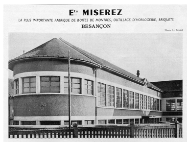
Ets Miserez, photographie, s.d. [1949]. IVR43_20182500203NUC4A