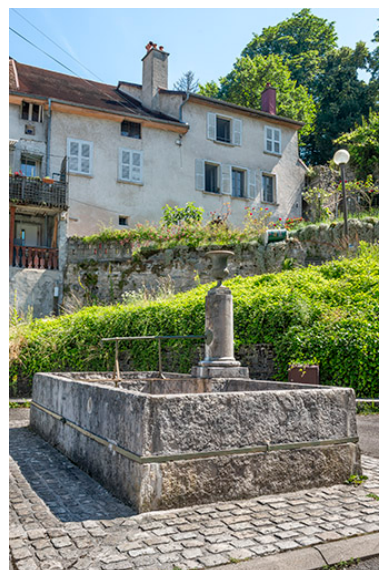
Vue depuis le sud. IVR43_20243900815NUC4A