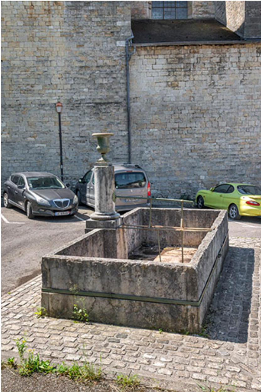
Vue plongeante depuis le nord.