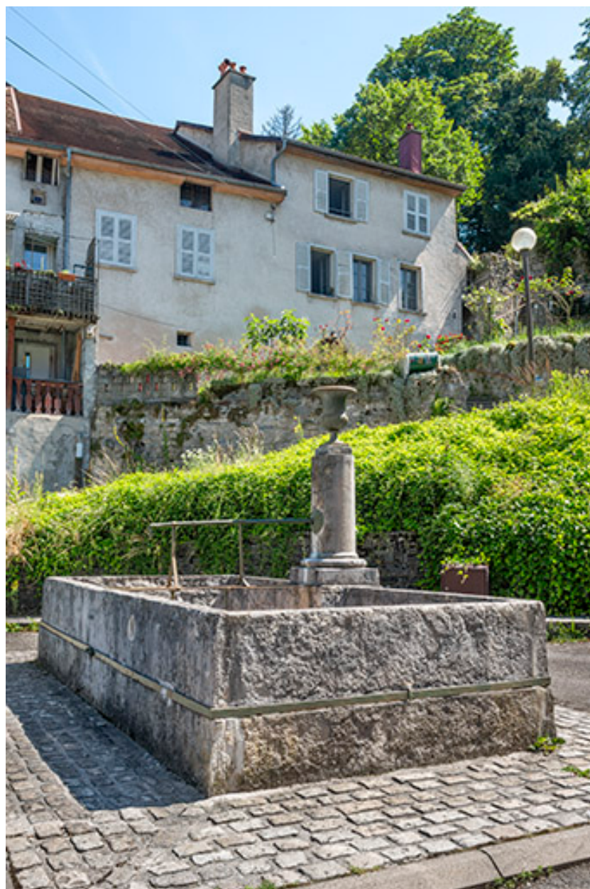
Vue depuis le sud.