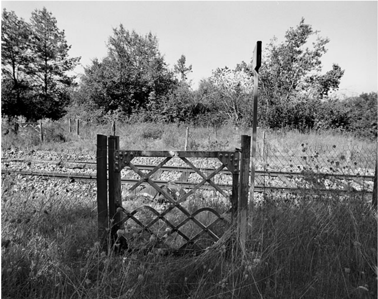
Portillon pour piétons, côté droit de la voie : vue d'ensemble.