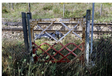
Portillon pour piétons, côté droit de la voie.