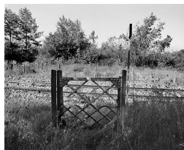
Portillon pour piétons, côté droit de la voie : vue d'ensemble.