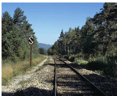
Panneau S annonçant le passage à niveau. Le panneau S impose au mécanicien de siffler (en général avant un passage à niveau non gardé).