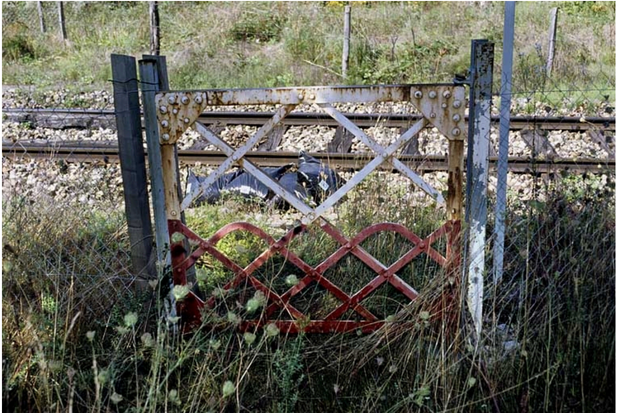
Portillon pour piétons, côté droit de la voie.