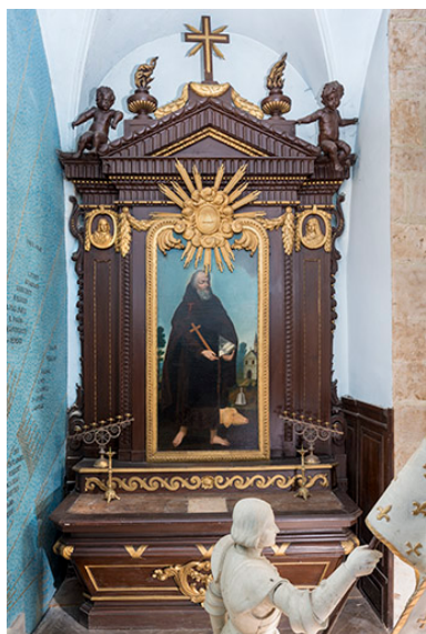
Autel et retable, tableau représentant saint Antoine l'Ermite. IVR43_20187000584NUC4A