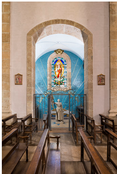
Vue d'ensemble depuis la nef. IVR43_20187000582NUC4A