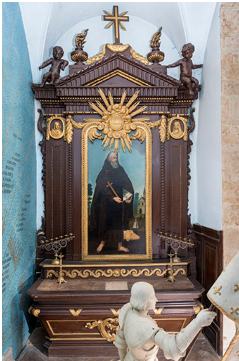
Autel et retable, tableau représentant saint Antoine l'Ermite.