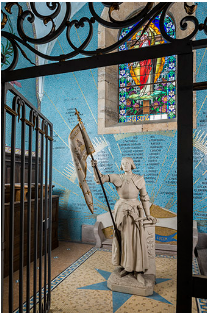
Jeanne d'Arc portant l'étendard.