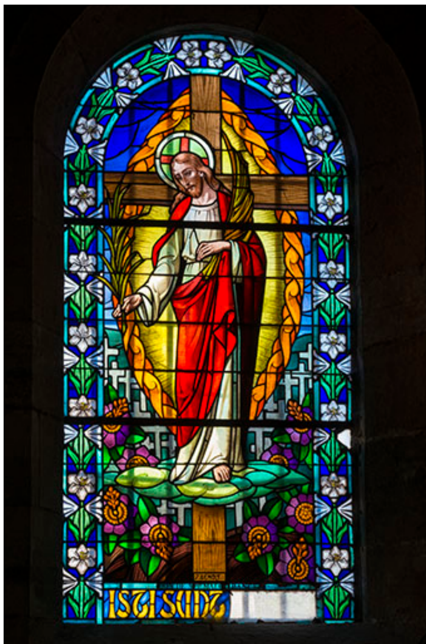
Le Christ distribuant des palmes au milieu d'un cimetière.