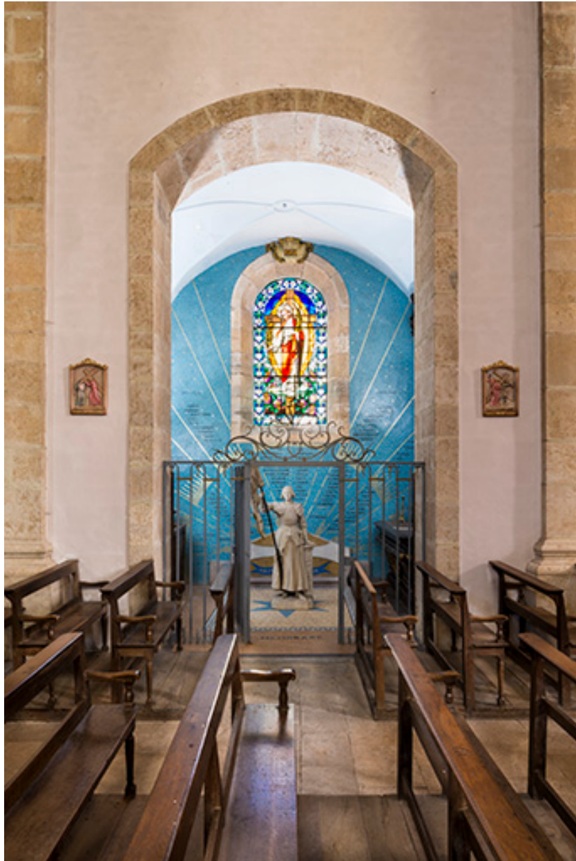
Vue d'ensemble depuis la nef.