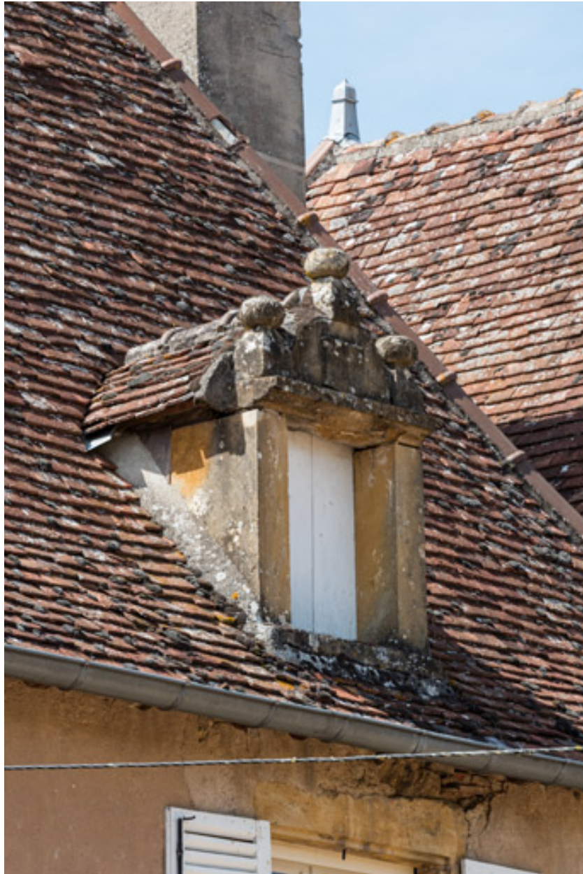
Lucarne ornée de boules