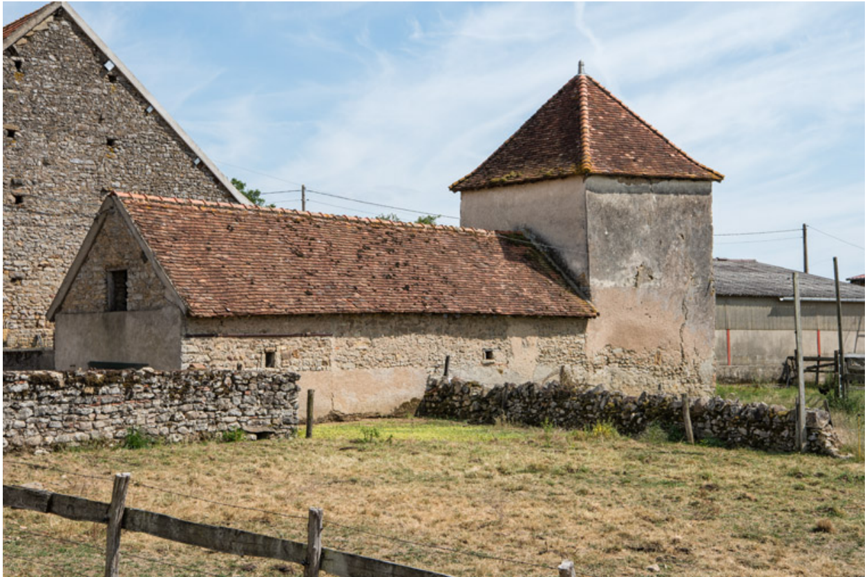
Façade postérieure du même bâtiment. En arrière-plan, un des murs-pignons de la grange.