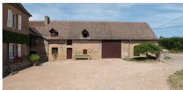
Aile de dépendance, fermant la cour au nord IVR26_20197100153NUC4AQ