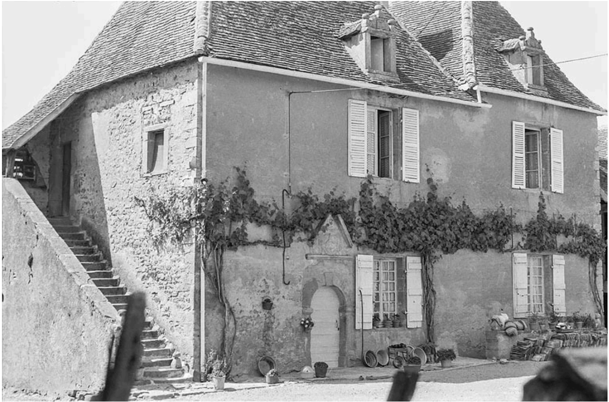
Vue de la demeure vers 1970