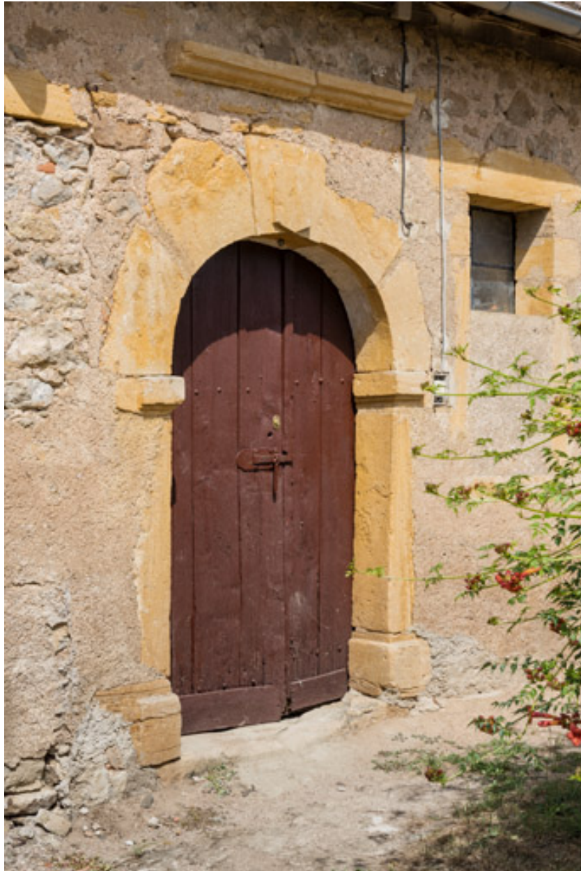
Porte de l'aile nord des dépendances, dont la clef est ornée d'une table d'attente