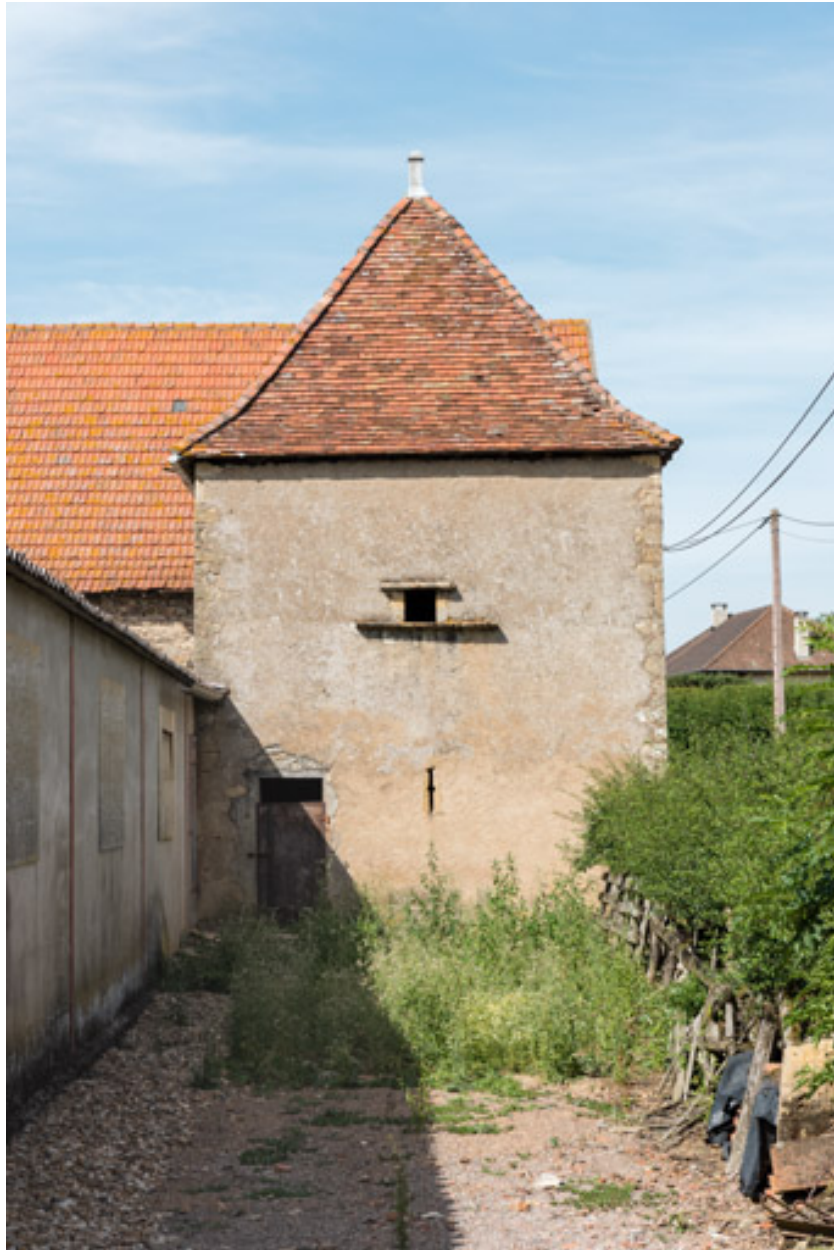
Pigeonnier à l'arrière de la grange