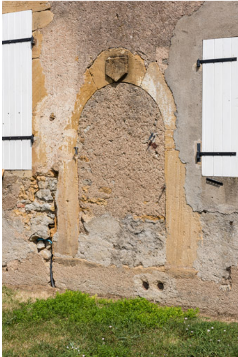
Porte bouchée sur la façade postérieure de la maison, dont la clef est ornée d'une table d'attente (blason nu)