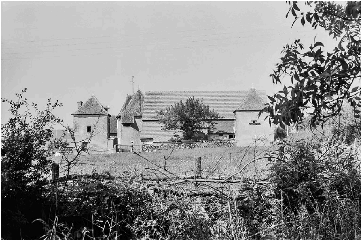
Vue de la ferme depuis le sud, avec ses deux pigeonniers, vers 1970.