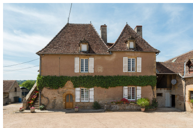
Façade antérieure de la demeure IVR26_20197100154NUC4A