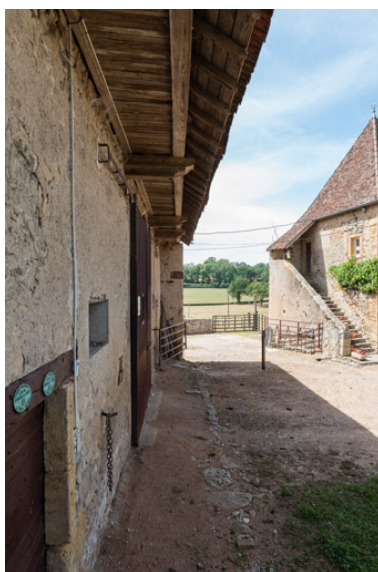
La façade de la grange est protégée par un débord de toit, soutenu par le dépassement des murs-pignons