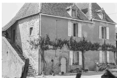
Vue de la demeure vers 1970 IVR26_20207100076NUC2