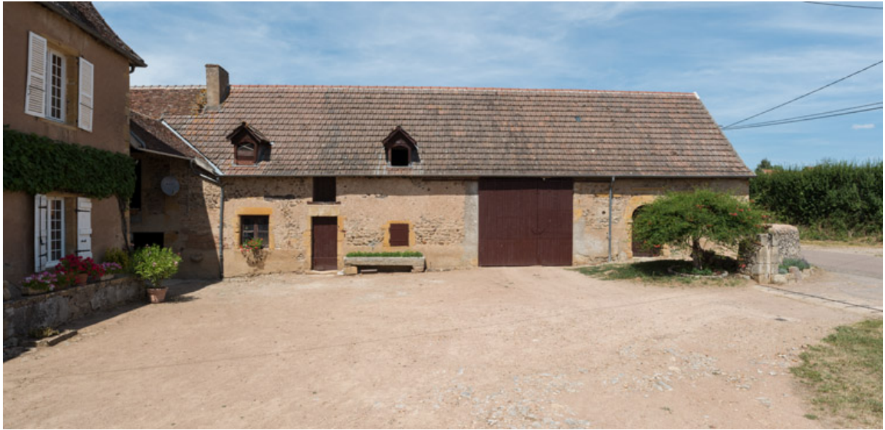
Aile de dépendance, fermant la cour au nord