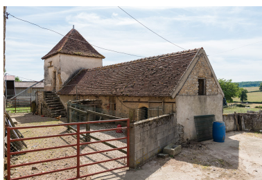
Bâtiment de dépendance composé d'un pigeonnier, d'un four à pain et de soues à cochons et poulailler IVR26_20197100168NUC4A