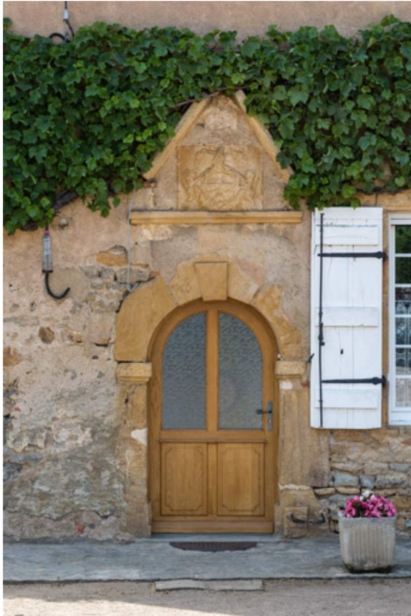
Porte d'entrée de la demeure avec son décor mouluré (impostes et agrafe), surmontée d'une table ornée d'un blason