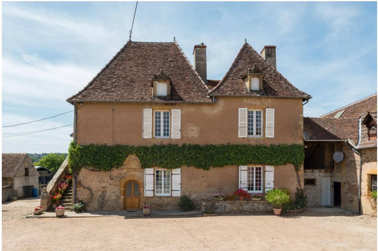
Façade antérieure de la demeure