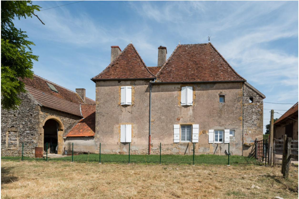
Façade postérieure de la maison