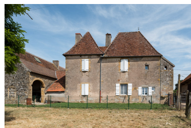
Façade postérieure de la maison IVR26_20197100165NUC4A