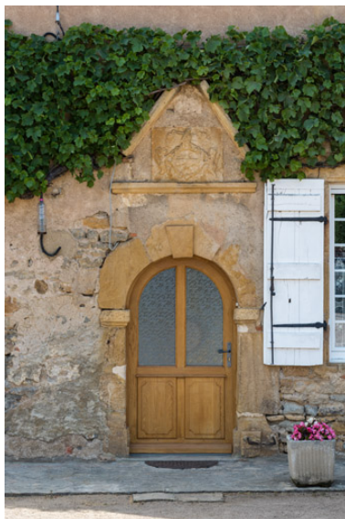
Porte d'entrée de la demeure avec son décor mouluré (impostes et agrafe), surmontée d'une table ornée d'un blason IVR26_20197100162NUC4A