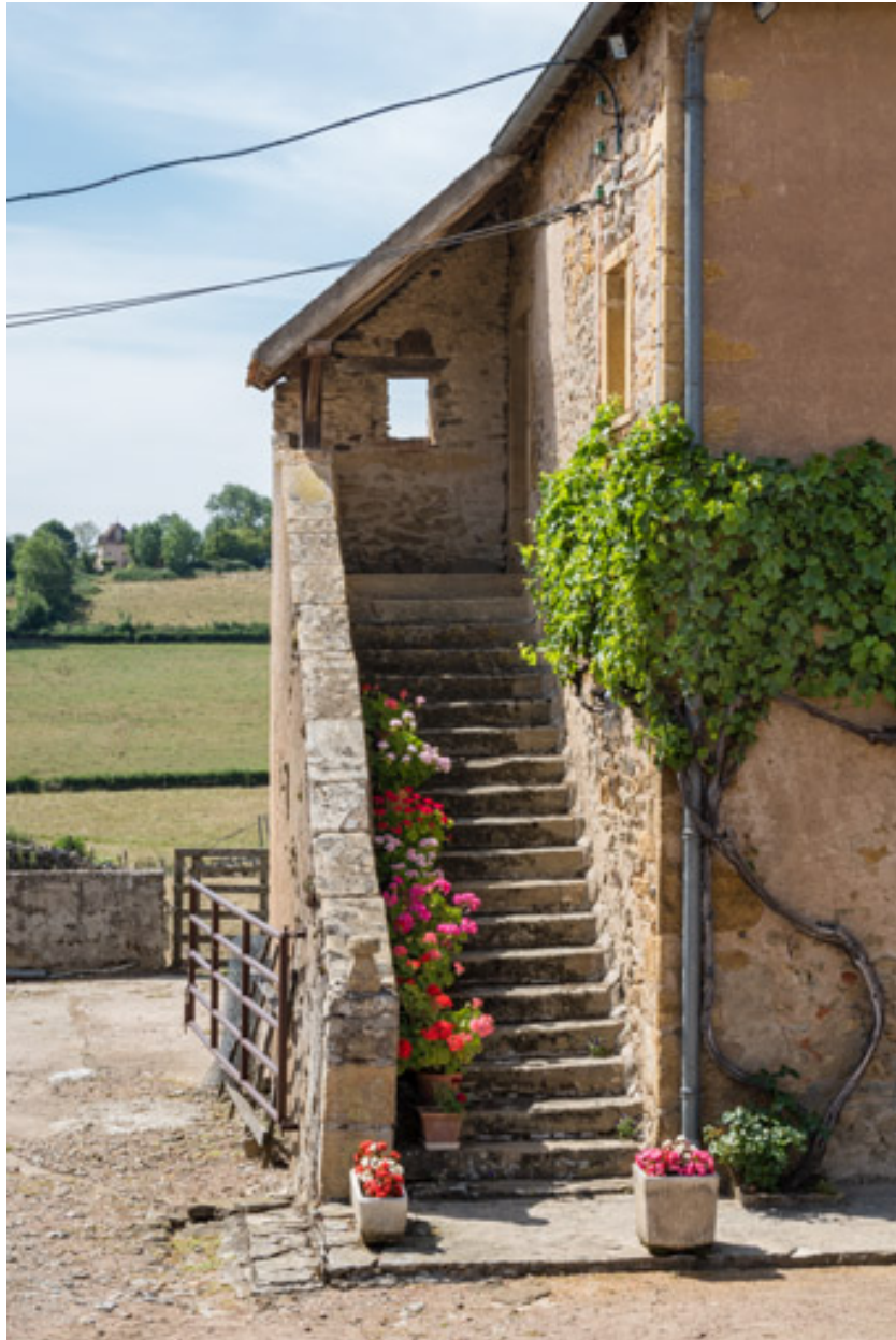
Escalier extérieur, sur la façade latérale de la maison, qui donnait accès à l'étage