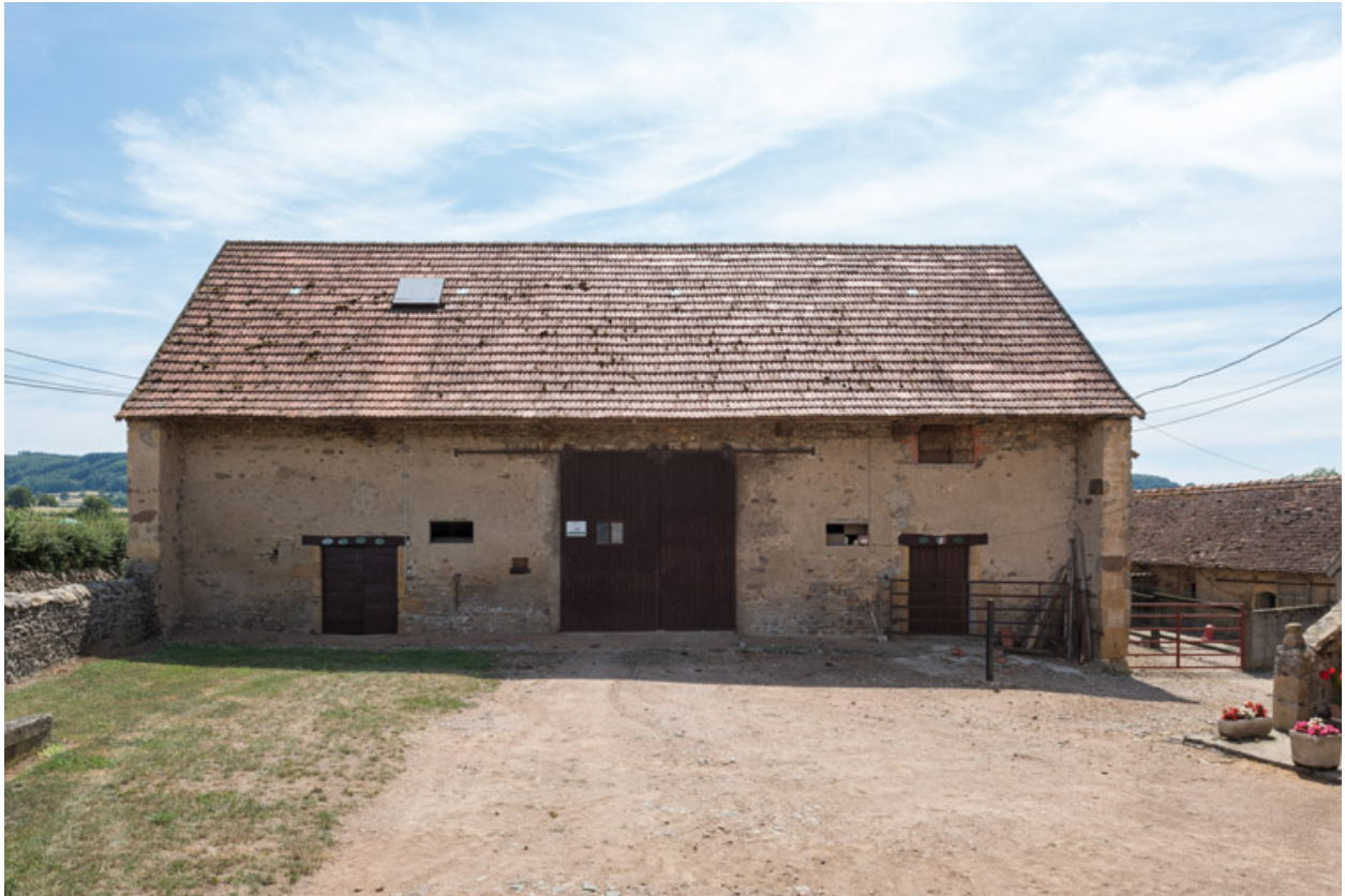
Grange, au sud de la cour