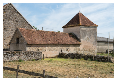
Façade postérieure du même bâtiment. En arrière-plan, un des murs-pignons de la grange. IVR26_20197100167NUC4A