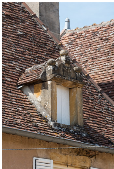
Lucarne ornée de boules IVR26_20197100159NUC4A