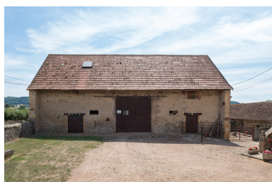
Grange, au sud de la cour