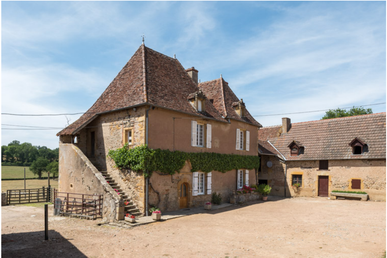
Vue de la demeure : façade antérieure et façade latérale avec l'escalier