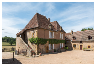
Vue de la demeure : façade antérieure et façade latérale avec l'escalier