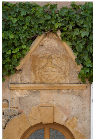
Blason avec les armoiries de la famille Guillevert, au-dessus de la porte d'entrée de la maison. La date de 1678 est gravée sur la clef de l'arc en plein cintre de l'ouverture.