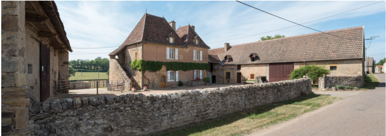
Vue d'ensemble des bâtiments du domaine, dit "des Pères"