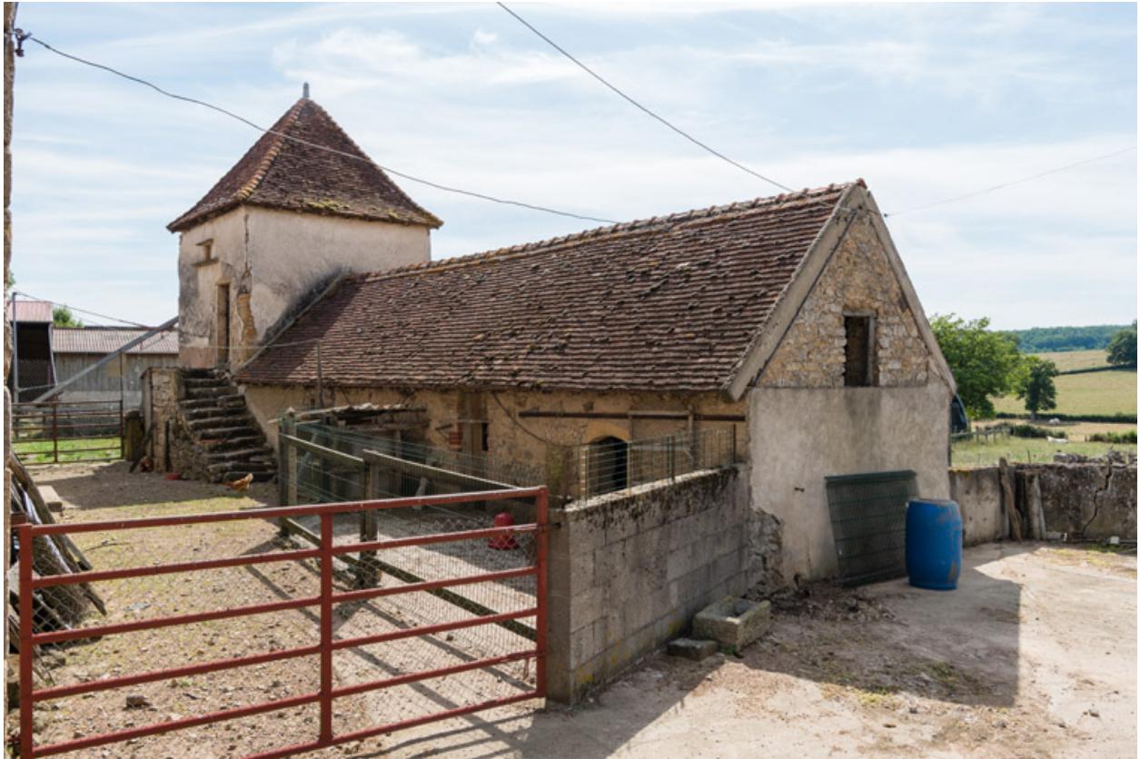
Bâtiment de dépendance composé d'un pigeonnier, d'un four à pain et de soues à cochons et poulailler