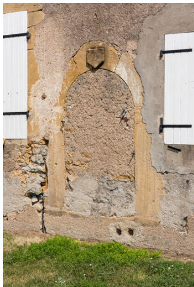
Porte bouchée sur la façade postérieure de la maison, dont la clef est ornée d'une table d'attente (blason nu)