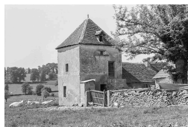
Vue d'un des deux pigeonniers, vers 1970. IVR26_20207100077NUC2