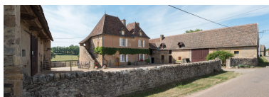
Vue d'ensemble des bâtiments du domaine, dit "des Pères" IVR26_20197100170NUC4AQ