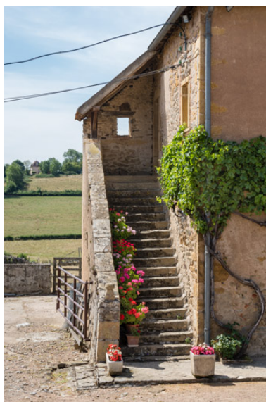
Escalier extérieur, sur la façade latérale de la maison, qui donnait accès à l'étage IVR26_20197100160NUC4A