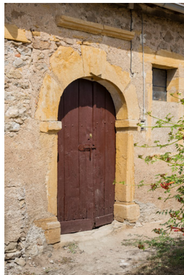
Porte de l'aile nord des dépendances, dont la clef est ornée d'une table d'attente IVR26_20197100163NUC4A