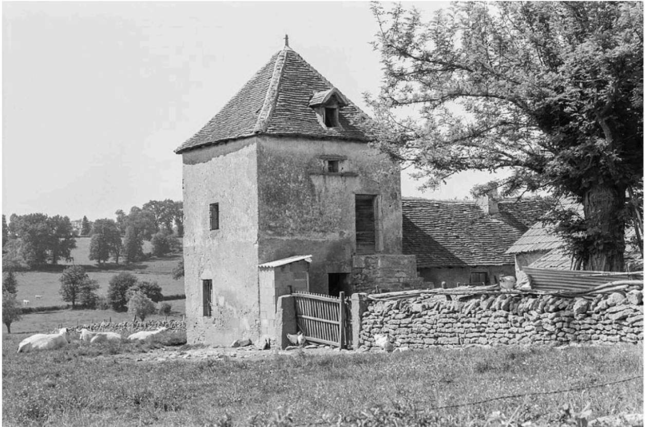
Vue d'un des deux pigeonniers, vers 1970.