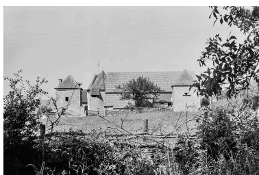
Vue de la ferme depuis le sud, avec ses deux pigeonniers, vers 1970.