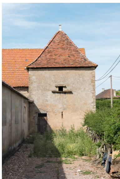
Pigeonnier à l'arrière de la grange IVR26_20197100169NUC4A