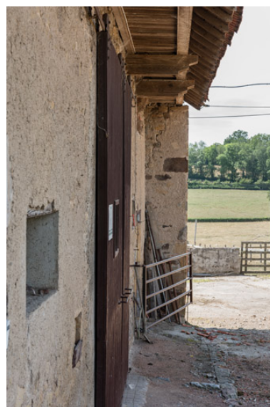
La façade de la grange est protégée par un débord de toit, soutenu par le dépassement des murs-pignons IVR26_20197100158NUC4A