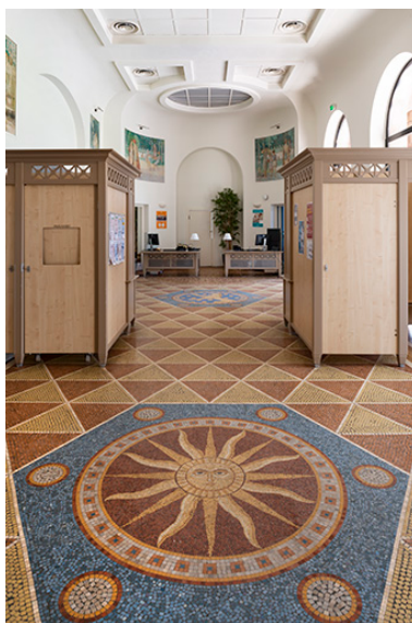
Vue du vestibule en direction de l'est. IVR43_20207000239NUC4A