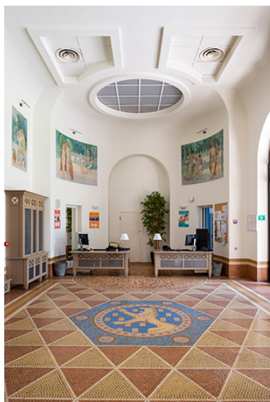
Vue du vestibule en direction de l'est. IVR43_20207000238NUC4A