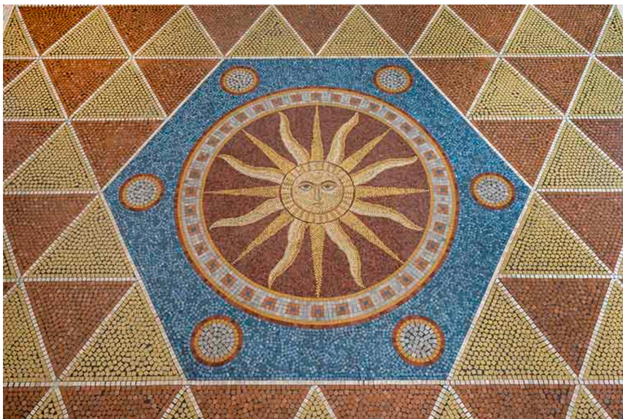
Médaille ornée des armes de Luxeuil : "De gueules au soleil d'or".