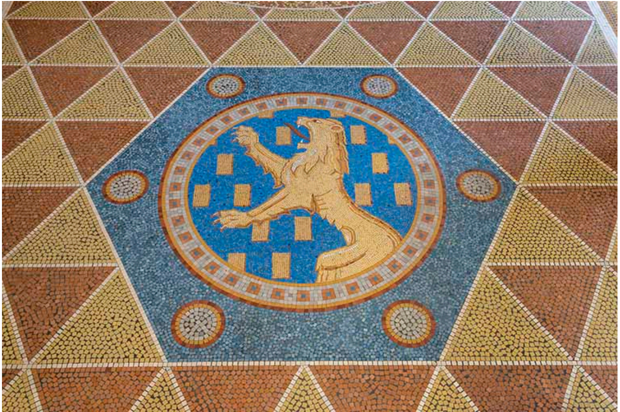
Médaille ornée des armes de Franche-Comté : "D'azur semé de billettes d'or, au lion d'or, armé et lampassé de gueules".