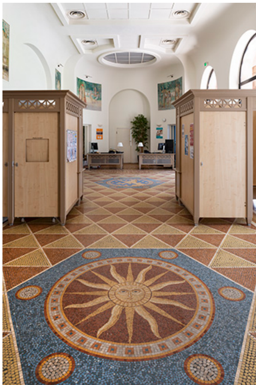
Vue du vestibule en direction de l'est.