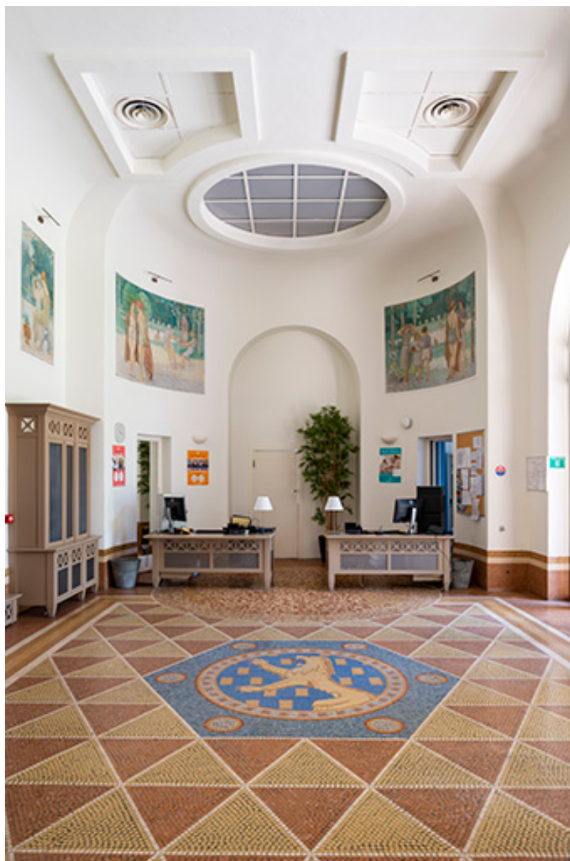
Vue du vestibule en direction de l'est.