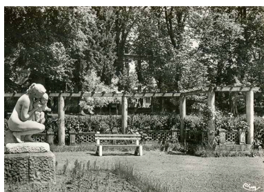
vue ancienne de la statue dans la roseraie du parc thermal.

Autr. auteur inconnu IVR43_20207000756NUC4A