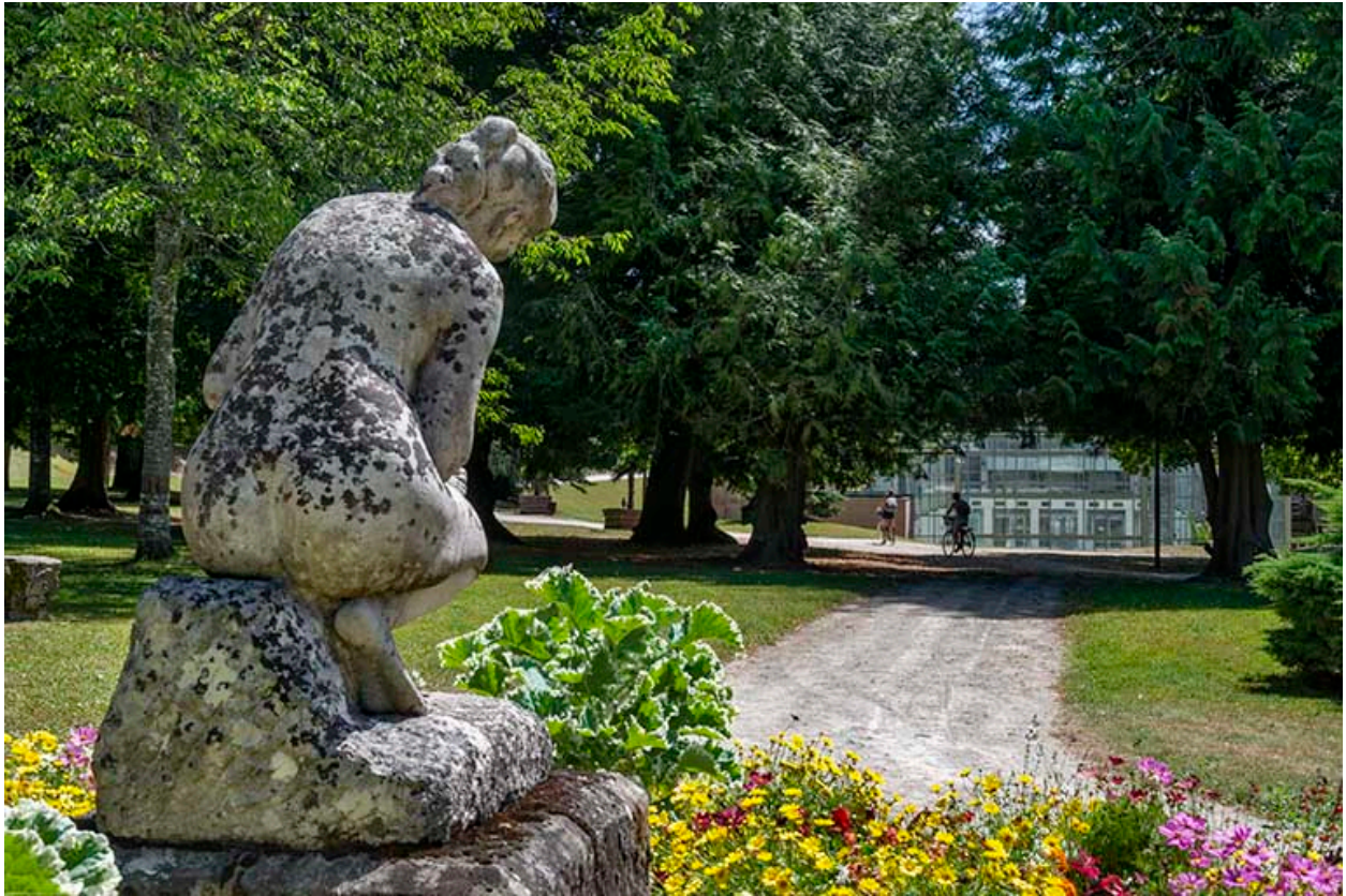
Vue de dos.