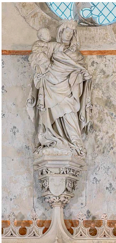
Statue de la Vierge à l'Enfant. IVR26_20202100085NUC4A