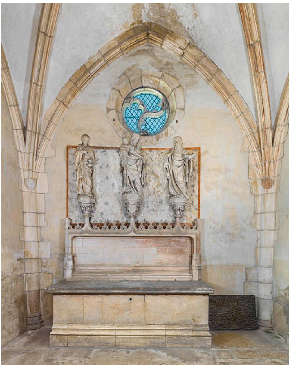
Chapelle de la famille Mâchefoing, vue en direction de l'autel.