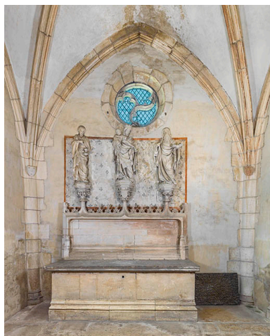
Chapelle de la famille Mâchefoing, vue en direction de l'autel.