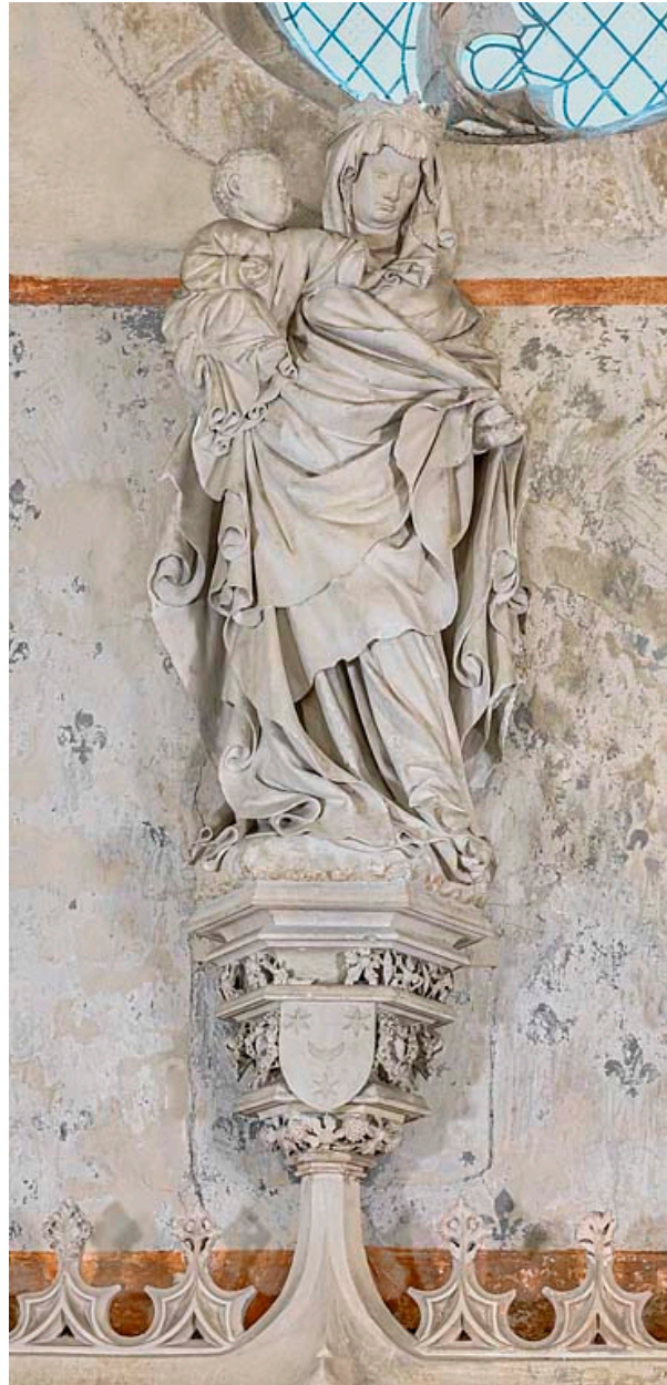
Statue de la Vierge à l'Enfant.