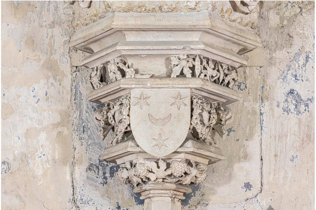
Console de la statue de la Vierge à l'Enfant aux armes des Mâchefoing.