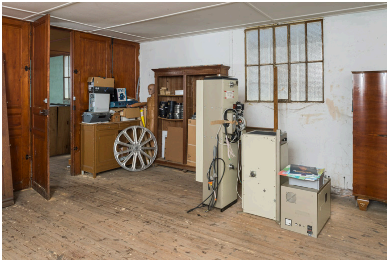
Kinoton FP 30 démonté.