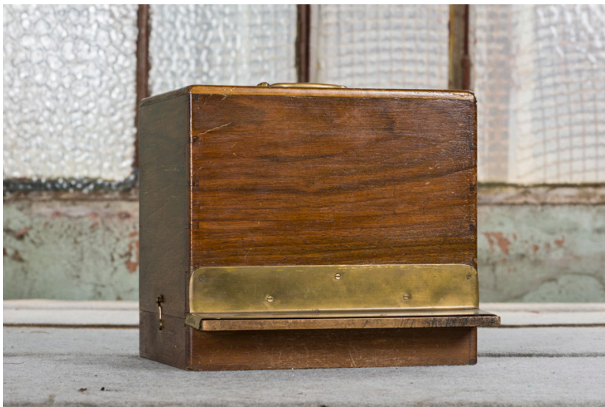
Machine à contrôler des quantités (distributeur de tickets de cinéma).