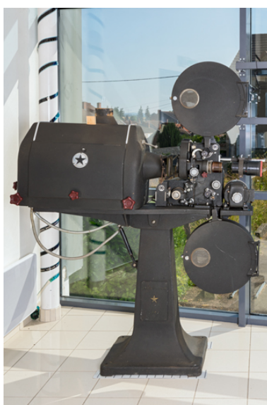
1er projecteur Etoile Film. IVR26_20257100696NUC4A