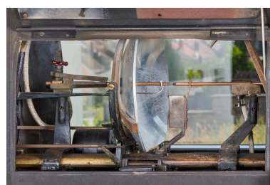
1er projecteur Etoile Film : lanterne avec sa lampe à arc.