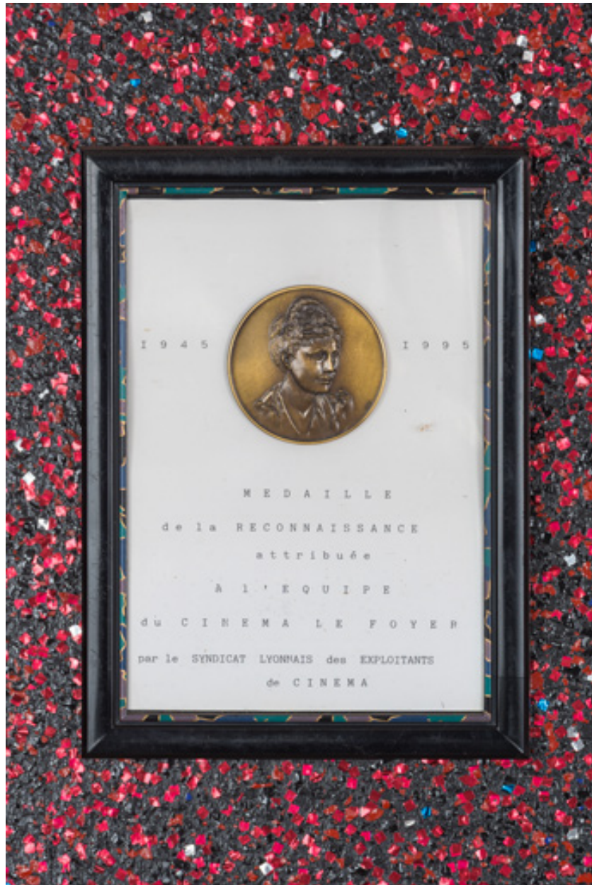
1945-1995 Médaille de la Reconnaissance attribuée à l'équipe du cinéma le Foyer par le Syndicat lyonnais des Exploitants de Cinéma.