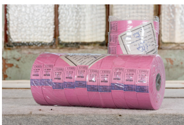
Rouleaux de tickets. IVR26_20257100724NUC4A