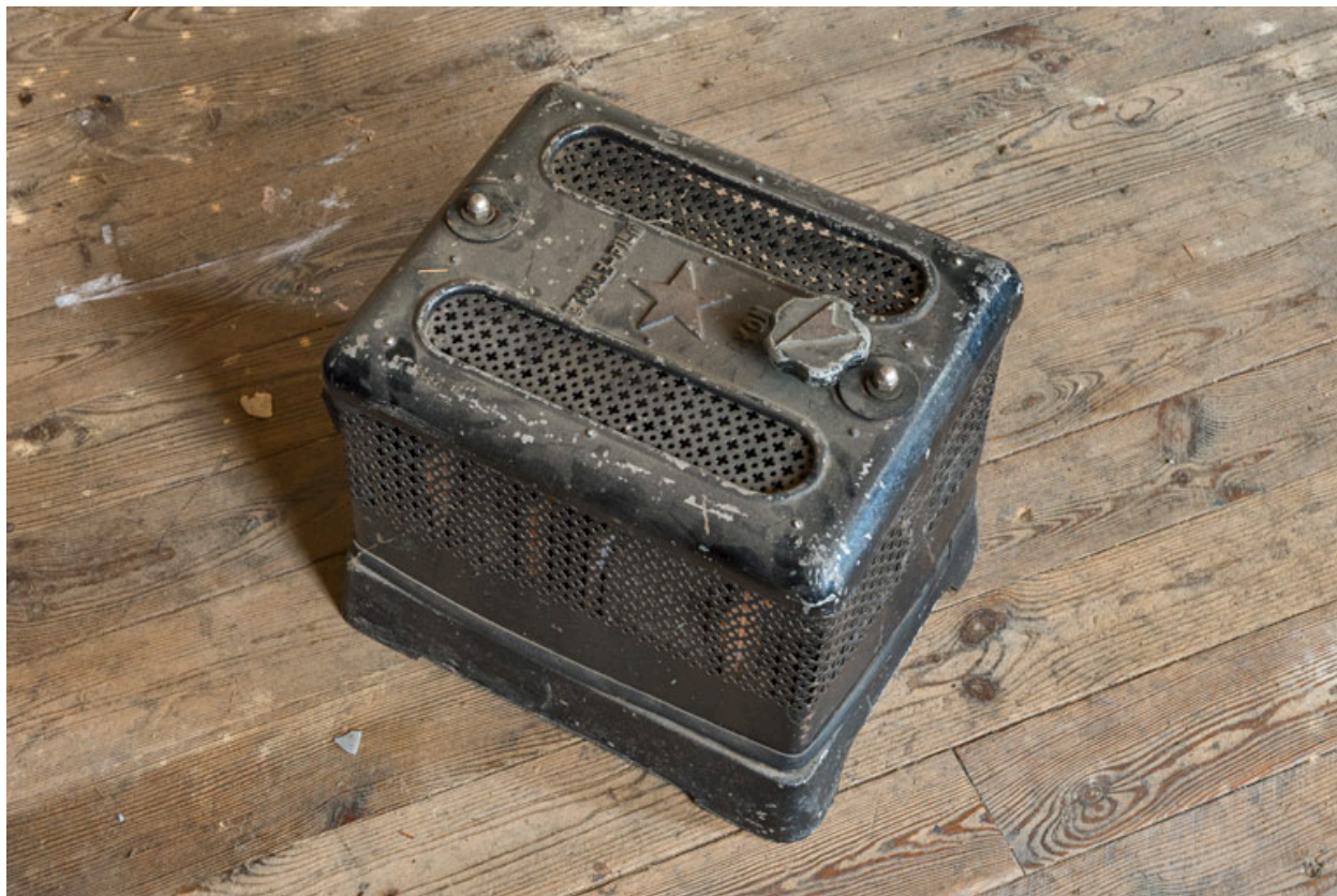
Redresseur Etoile Film.