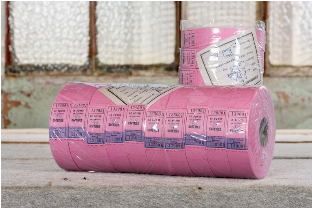
Rouleaux de tickets.