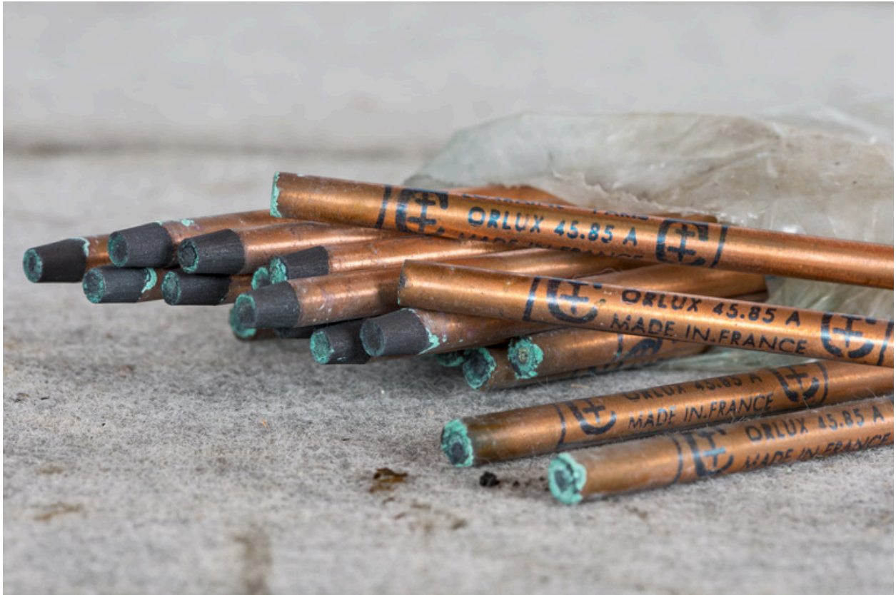
Electrodes pour lampe à arc.