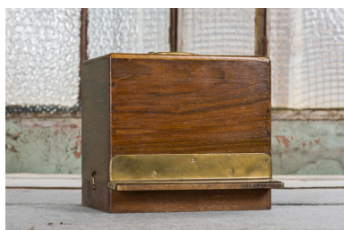
Machine à contrôler des quantités (distributeur de tickets de cinéma). IVR26_20257100728NUC4A