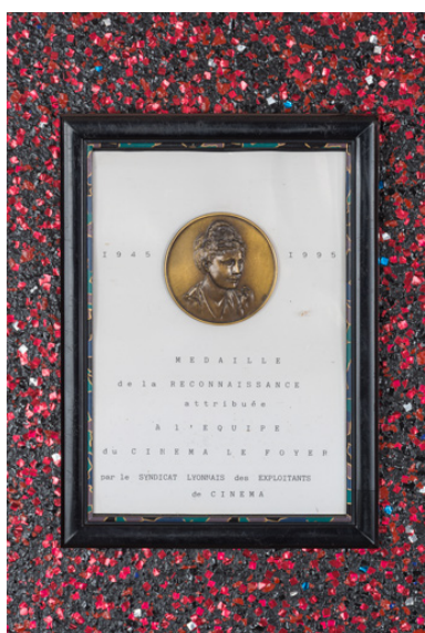
1945-1995 Médaille de la Reconnaissance attribuée à l'équipe du cinéma le Foyer par le Syndicat lyonnais des Exploitants de Cinéma. IVR26_20257100707NUC4A