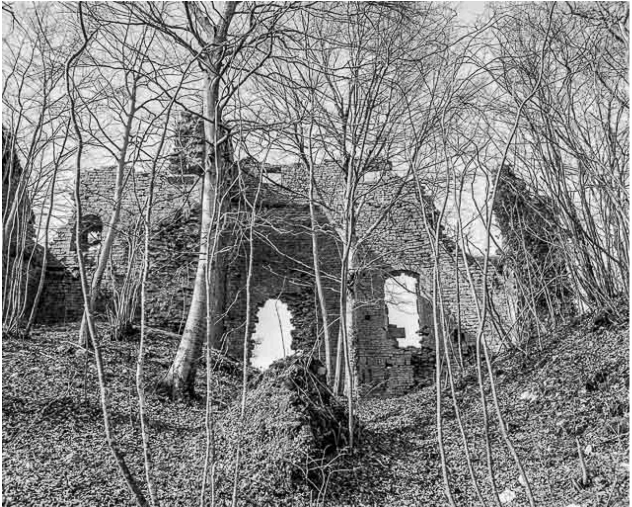
Vue générale des ruines du donjon.