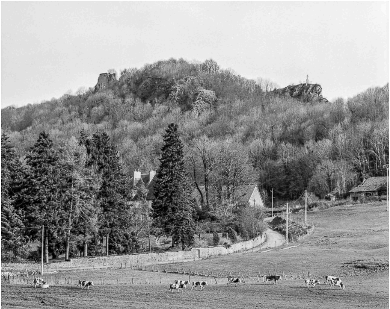
Vue de situation.