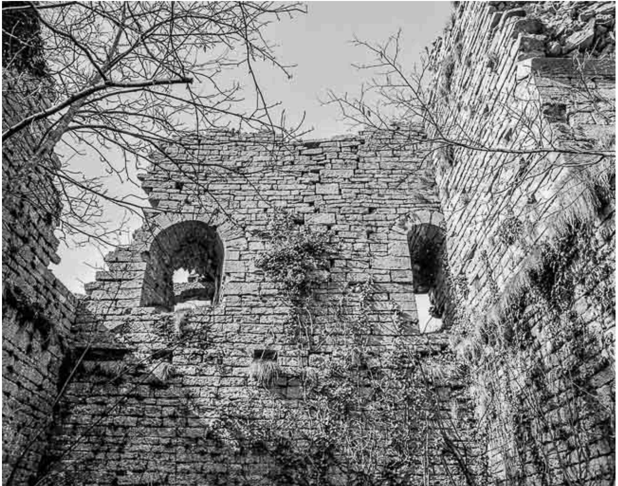
Vue générale des ruines du donjon depuis l'intérieur.