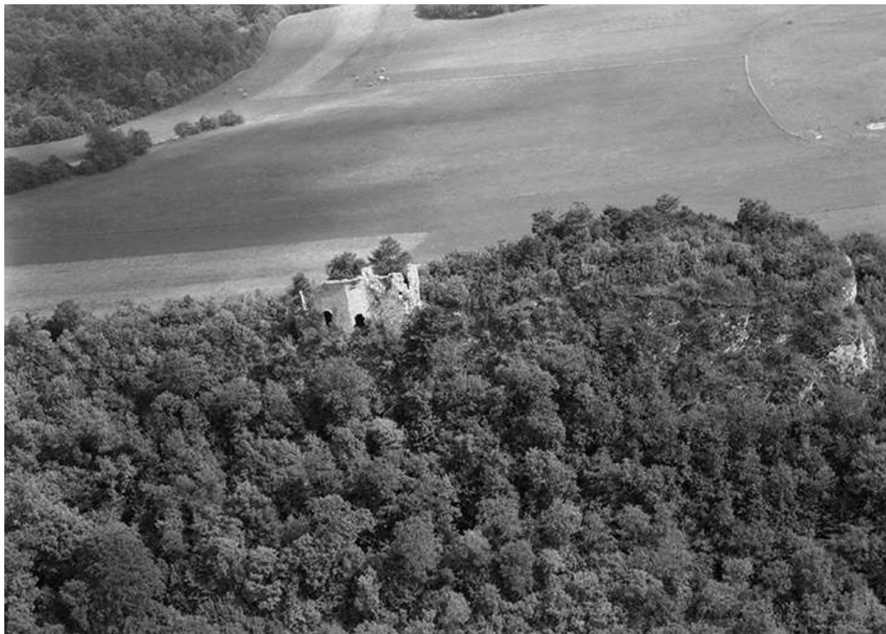
Vue aérienne en 1956.