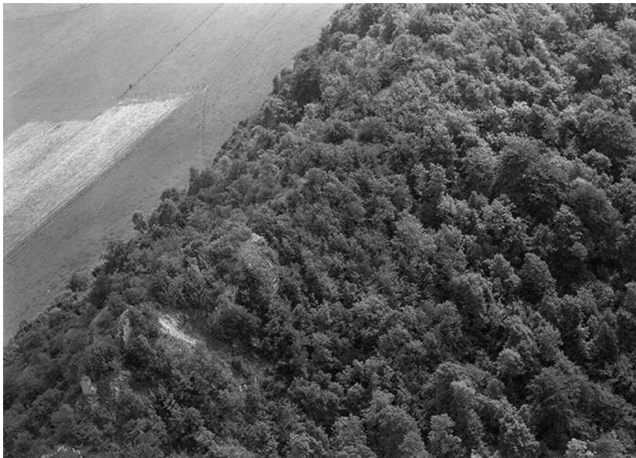
Vue aérienne du site du château fort en 1956.