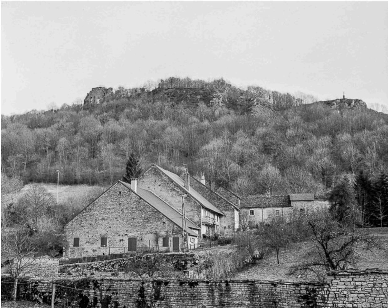
Vue de situation.