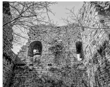
Vue générale des ruines du donjon depuis l'intérieur. IVR43_19833900046X