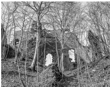
Vue générale des ruines du donjon.