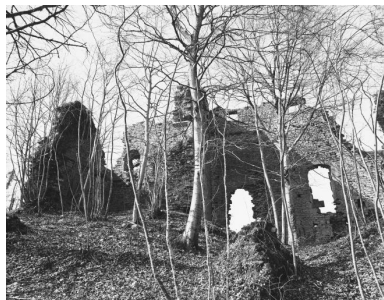
Vue générale des ruines du donjon.