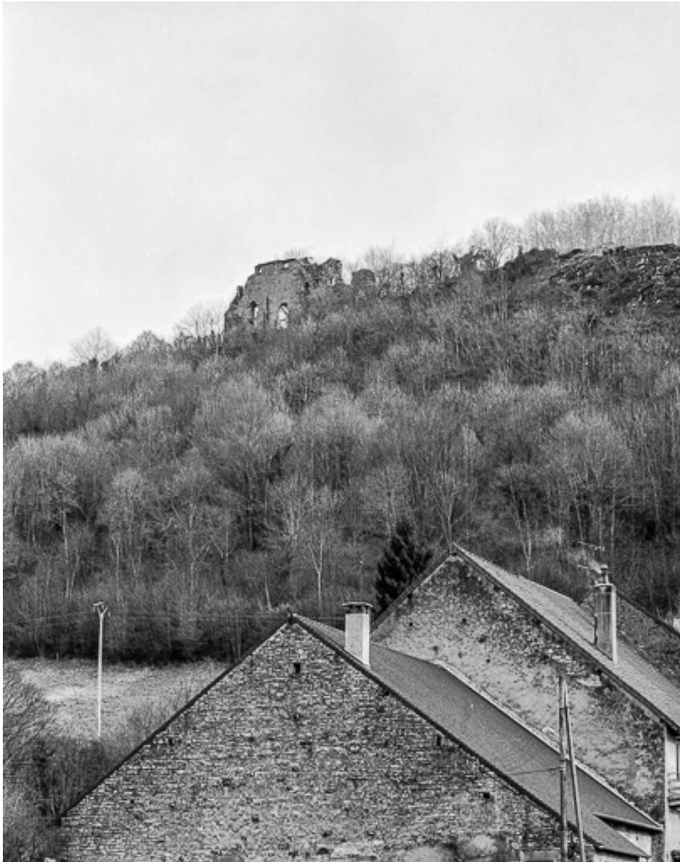
Vue de situation.