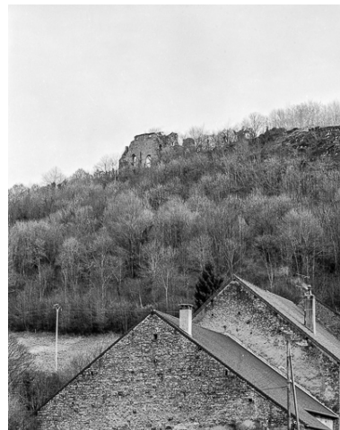
Vue de situation. IVR43_19833900043X