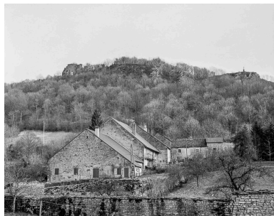
Vue de situation. IVR43_19833900042X