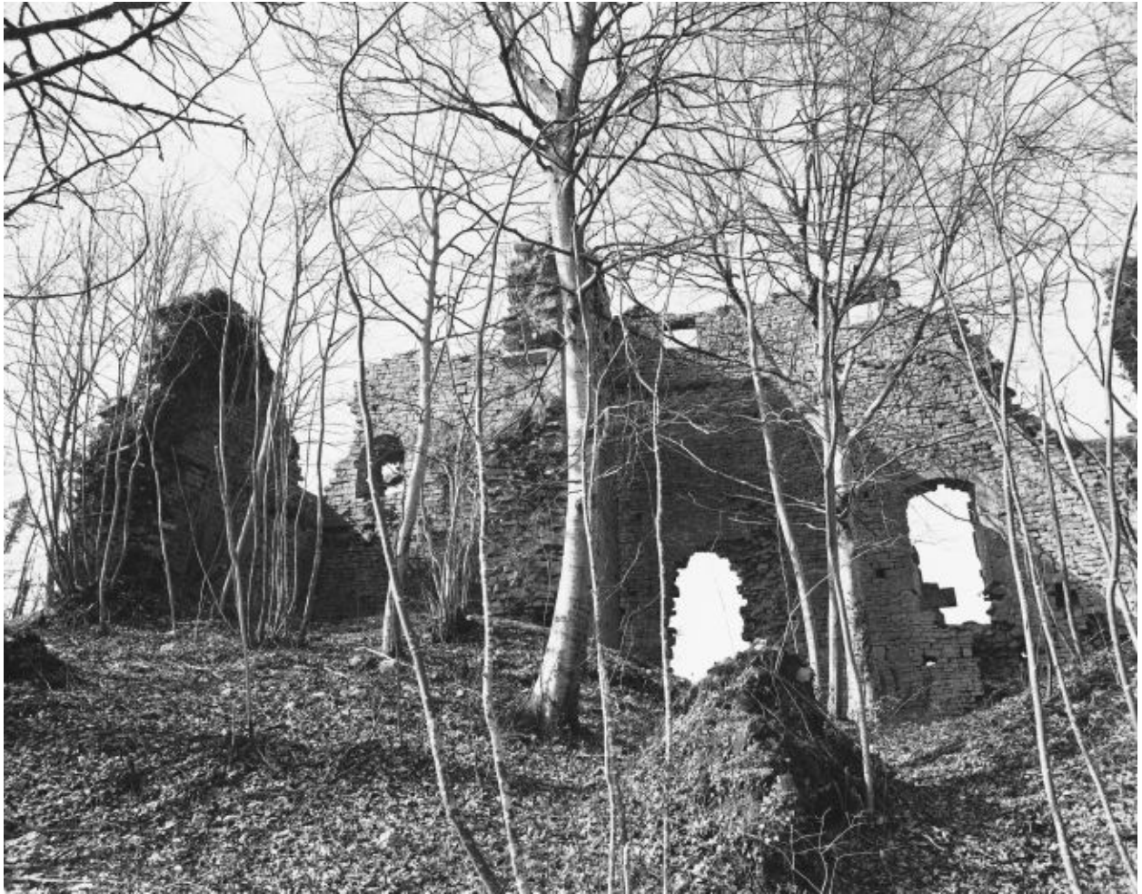
Vue générale des ruines du donjon.