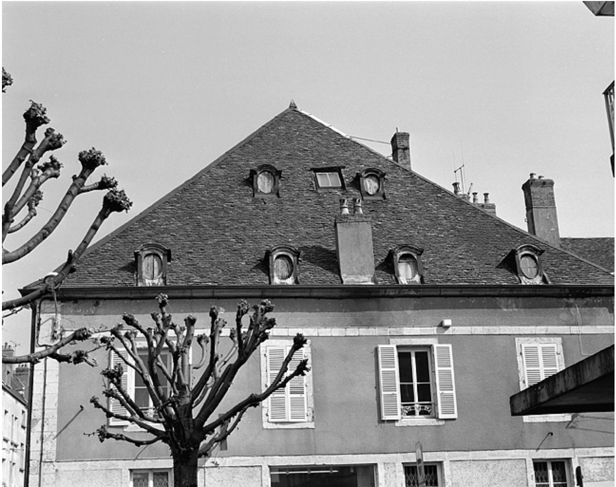
Toiture et façade latérale droite de la maison donnant rue Gambetta.