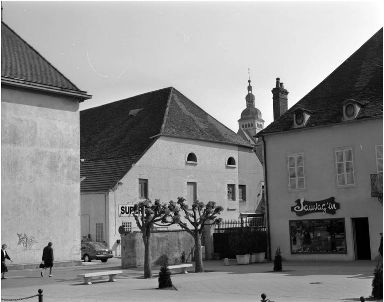
Vue des parties commerciales à gauche de la maison.