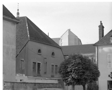
Détail du premier étage de la façade antérieure de l'entrepôt commercial.