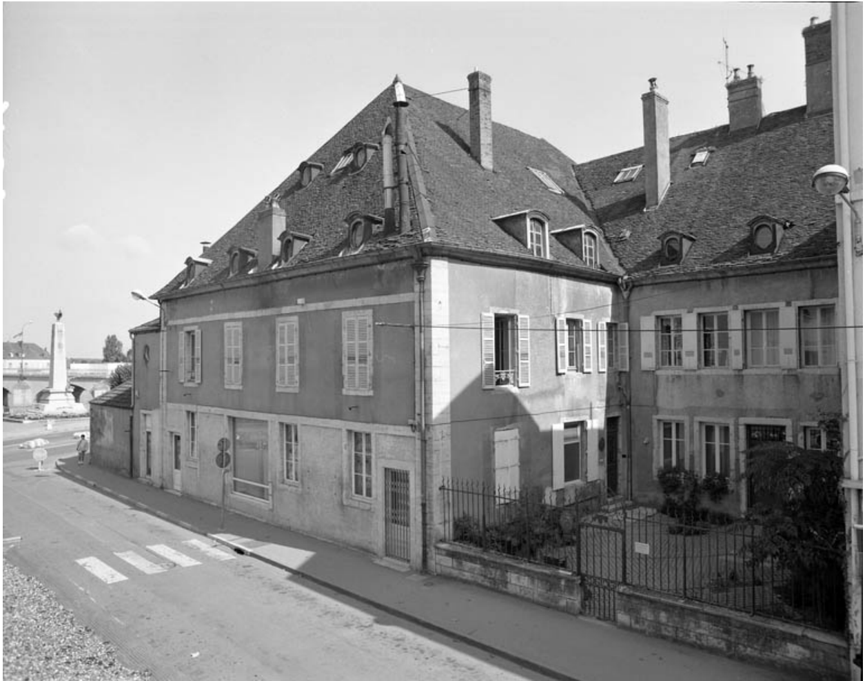
Façade latérale droite de trois quarts droit, avant restauration.