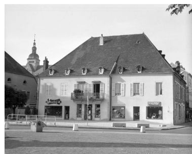
Façade antérieure de la maison, de trois quarts droit.