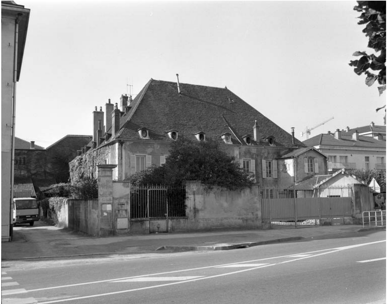
Vue d'ensemble de la maison depuis la rue, avant restauration.