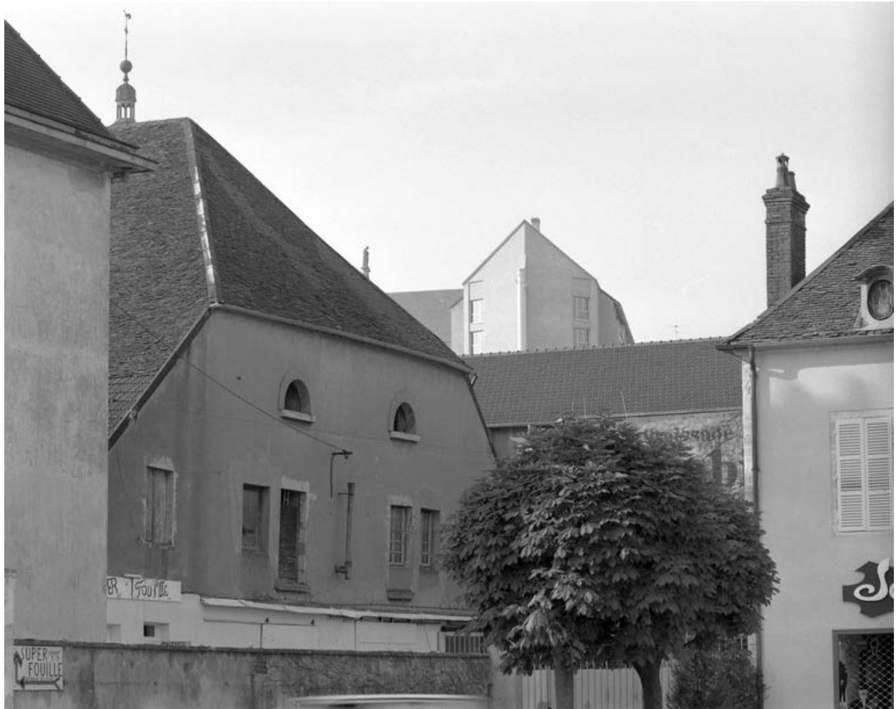
Détail du premier étage de la façade antérieure de l'entrepôt commercial.