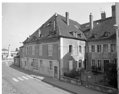
Façade latérale droite de trois quarts droit, avant restauration.