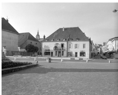
Vue d'ensemble de la maison.