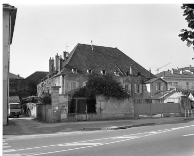
Vue d'ensemble de la maison depuis la rue, avant restauration.

Phot. Yves Sancey, Phot. C. Bournot IVR43_19947000118X