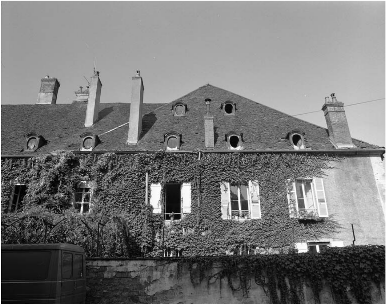
Façade latérale gauche de la maison : détail du premier étage et de la toiture, avant restauration.