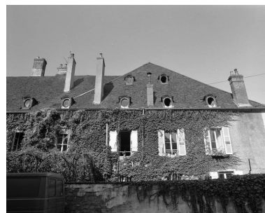
Façade latérale gauche de la maison : détail du premier étage et de la toiture, avant restauration.