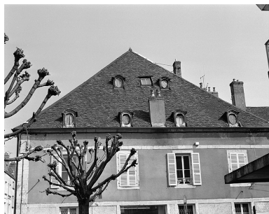
Toiture et façade latérale droite de la maison donnant rue Gambetta.