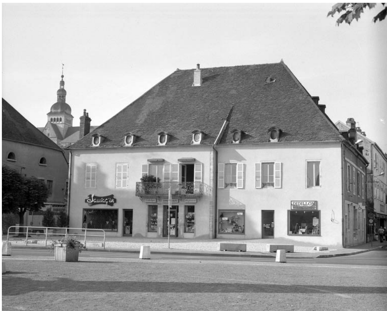
Façade antérieure de la maison, de trois quarts droit.