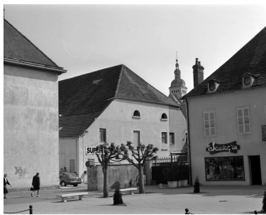
Vue des parties commerciales à gauche de la maison.