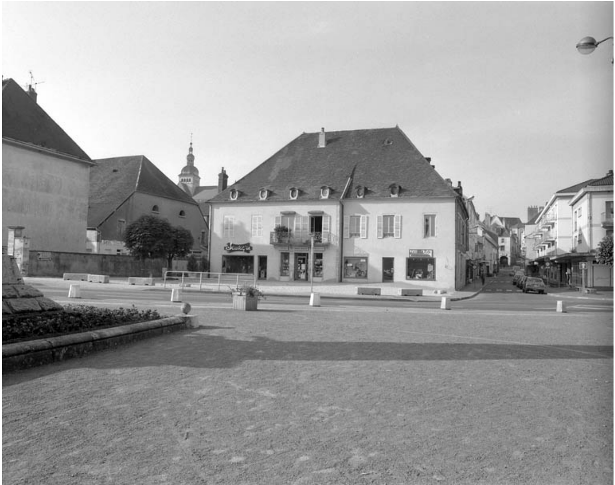
Vue d'ensemble de la maison.