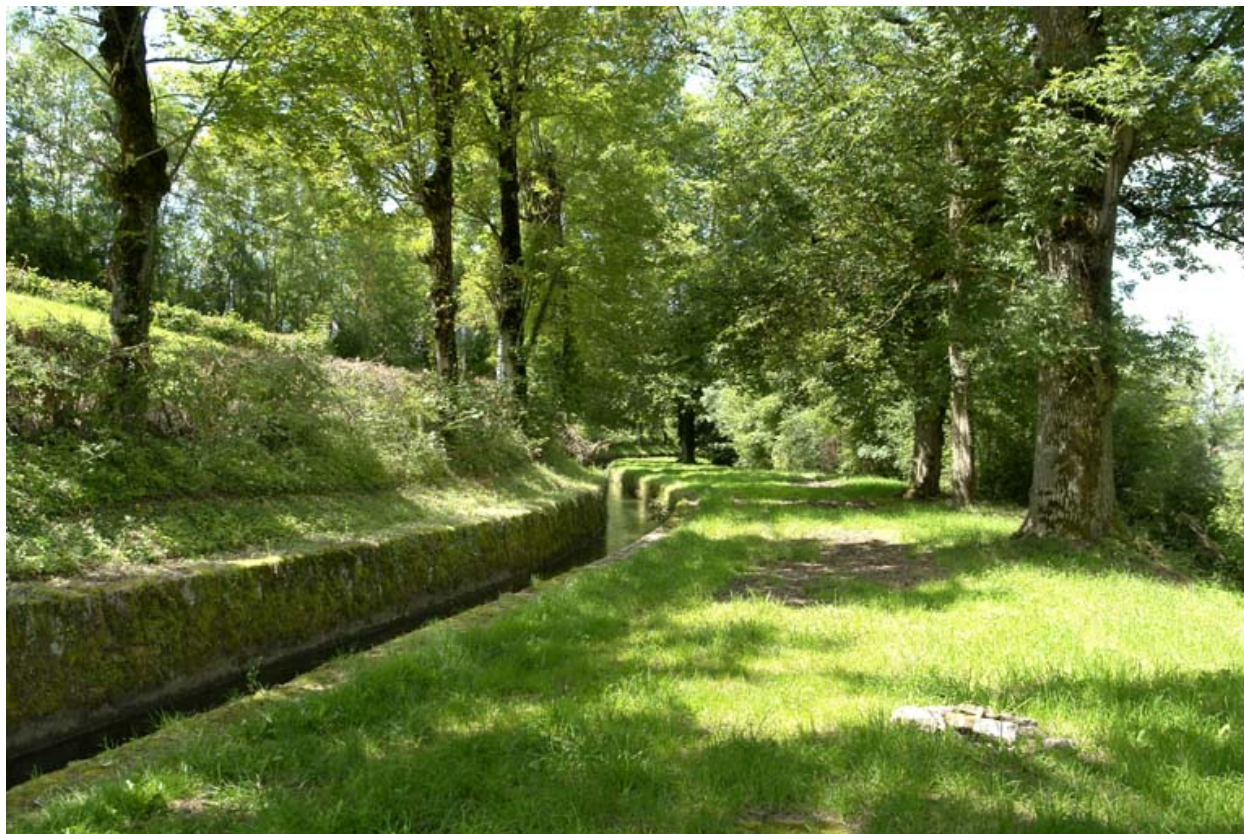
Rigole d'alimentation du canal en sortie du contre-réservoir.