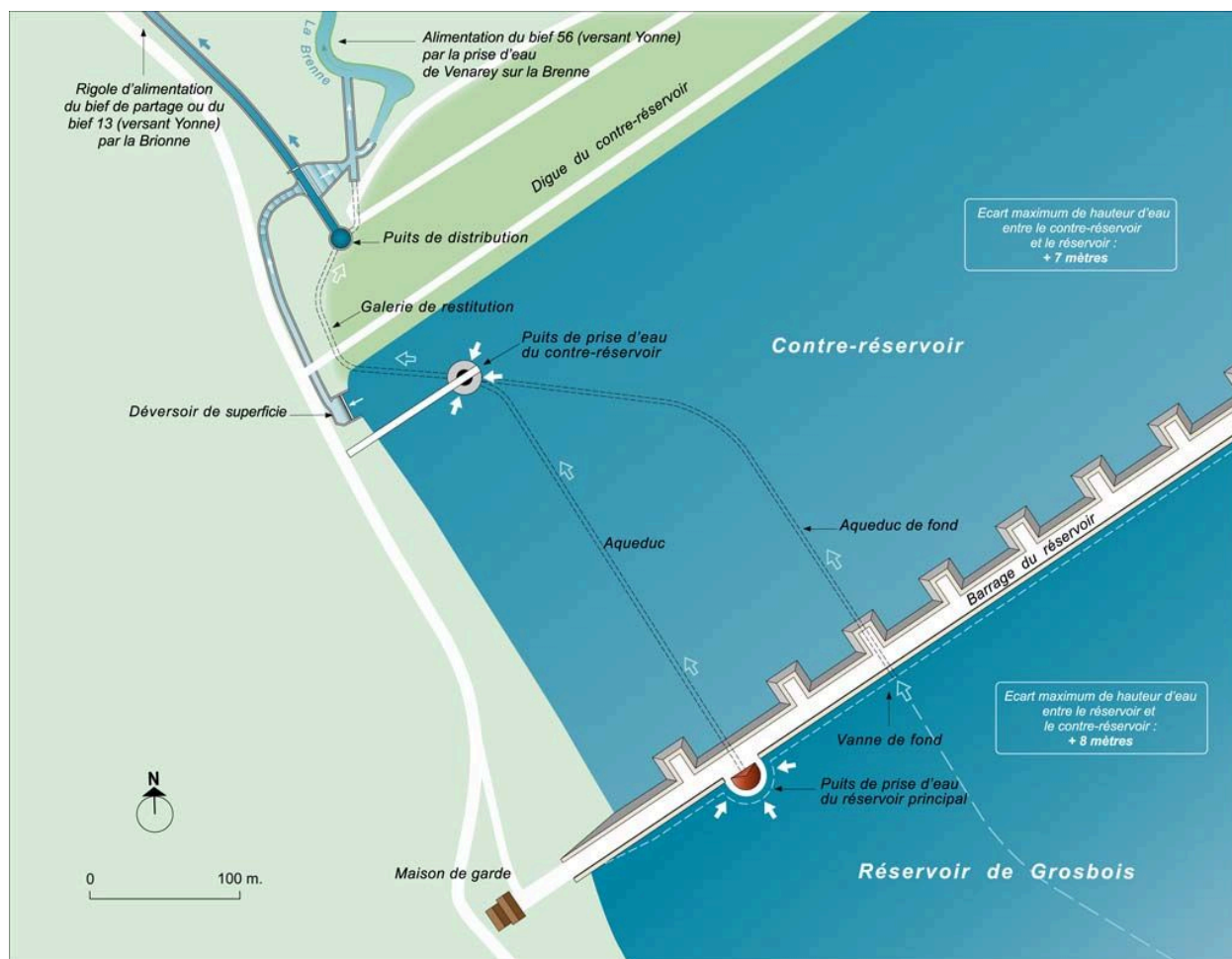
Plan schématique du réservoir de Grosbois, détail du barrage et du contre-réservoir.