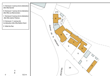
Plan-masse et de situation, extrait du plan cadastral (2023). IVR26_20237100008NUDA