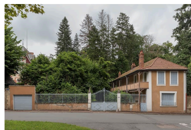
Vue d'ensemble (aujourd'hui). IVR26_20217100234NUC4A