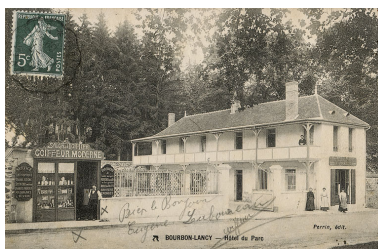
Vue d'ensemble (début du 20e siècle).