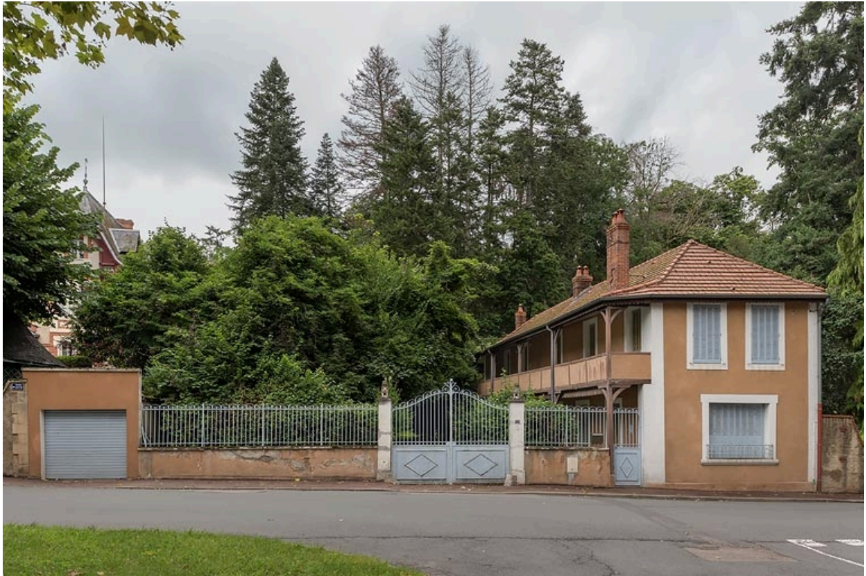
Vue d'ensemble (aujourd'hui).