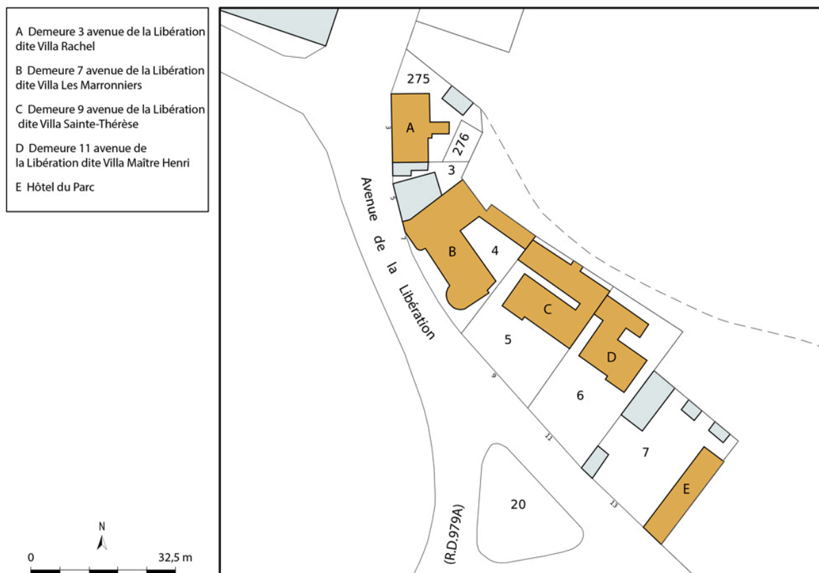
Plan-masse et de situation, extrait du plan cadastral (2023).