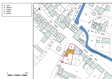
Plan-masse et de situation. Extrait du plan cadastral, 2019. IVR43_20197000218NUDA