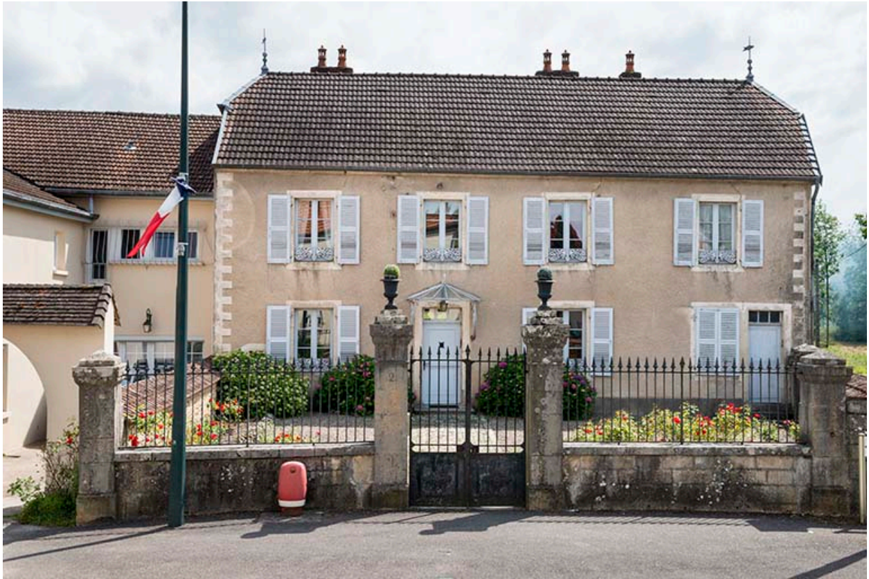
Façade principale, vue de face.