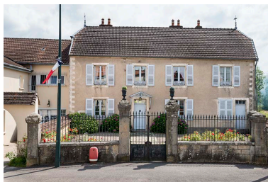
Façade principale, vue de face.