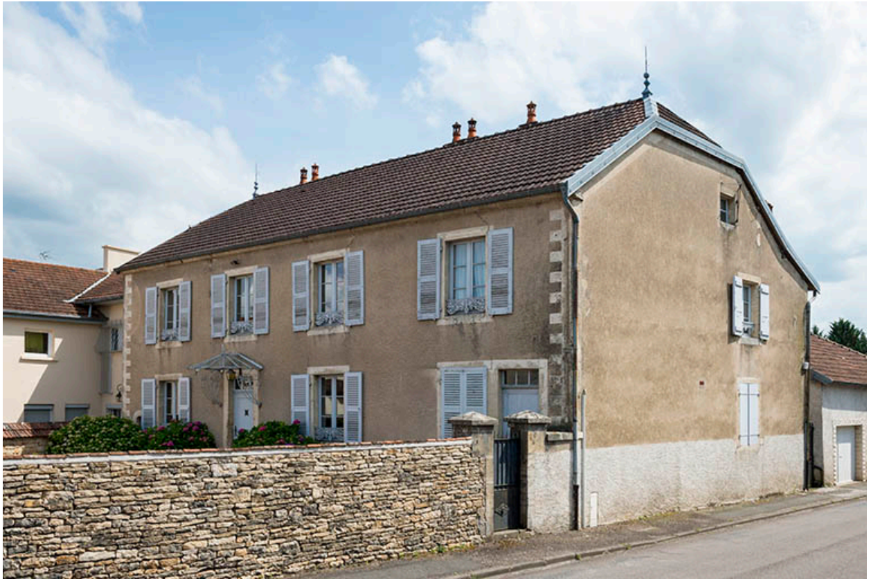
Façade principale, vue de trois-quarts.