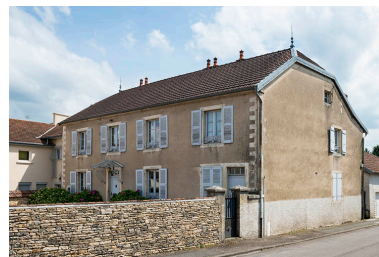
Façade principale, vue de trois-quarts. IVR43_20187000390NUC4A