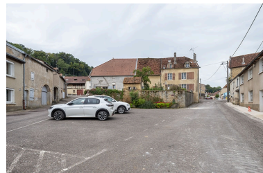
Les deux côtés de la rue aux environs de la fontaine.

IVR43_20097000018NUC2A