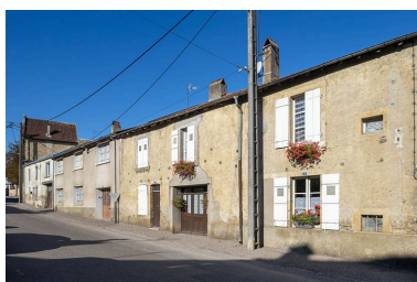
Trois quarts droit des façades des maisons, 7, 5 et suivants, vers le sud-ouest.

IVR43_20217000673NUC4A