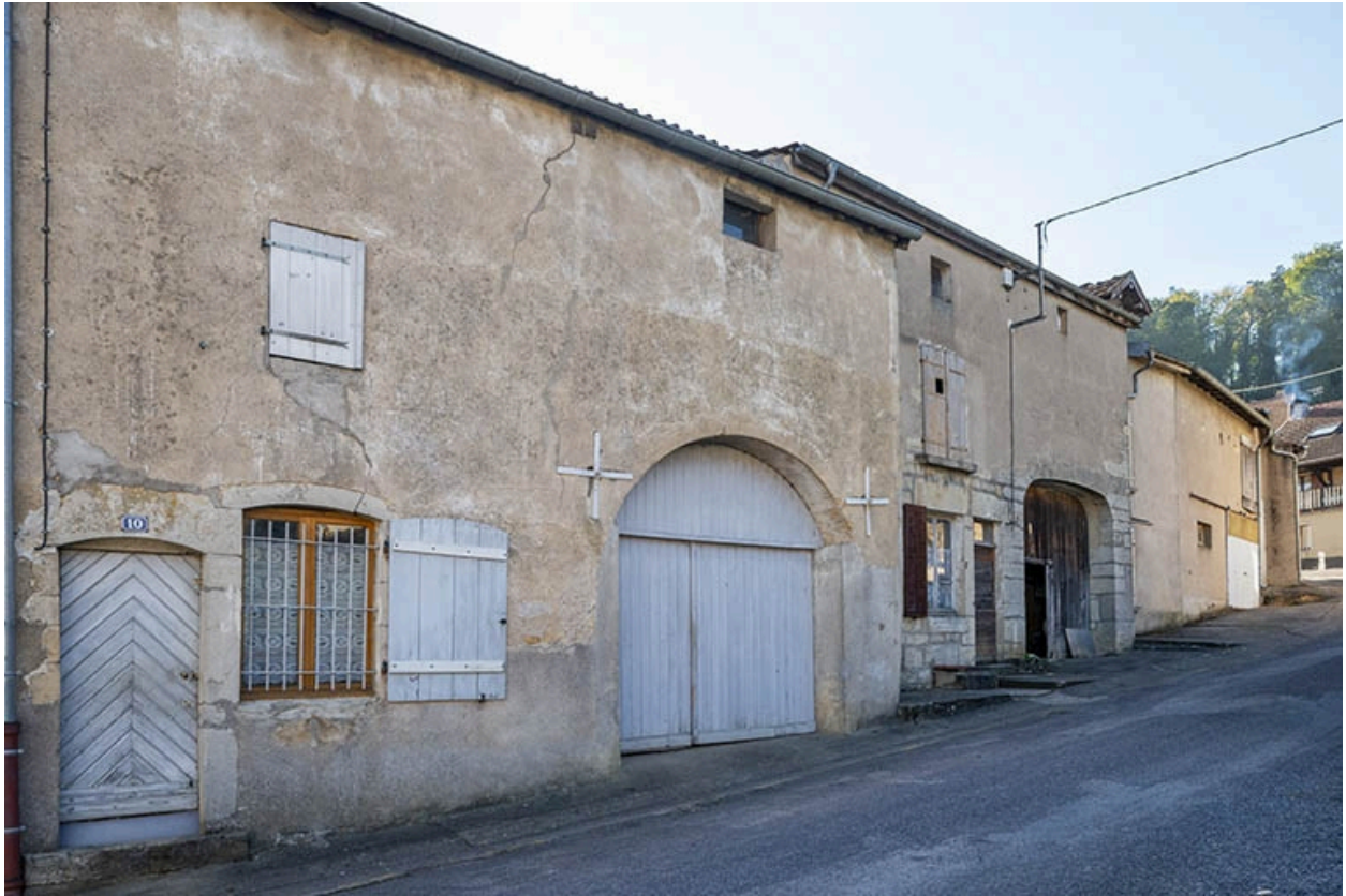
Trois quarts gauche des façades des maisons et fermes, 10, 8 et suivants, vers le sud.