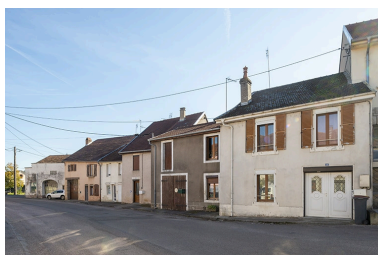
Trois quarts droit des façades des maisons, 16, 18 et suivants, vers le nord-est.

IVR43_20217000667NUC4A