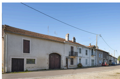
Trois quarts gauche des façades des fermes et maisons, 44, 42 et suivants, vers le nord-ouest.

IVR43_20217000669NUC4A