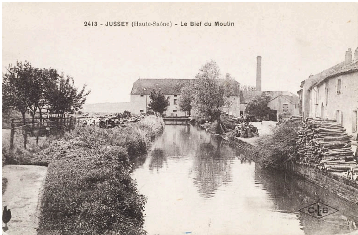
Le bief du Moulin. Carte postale.