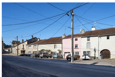
Trois quarts droit des façades des maisons et fermes, 15, 13 et suivants, vers le sud-ouest.

IVR43_20217000671NUC4A