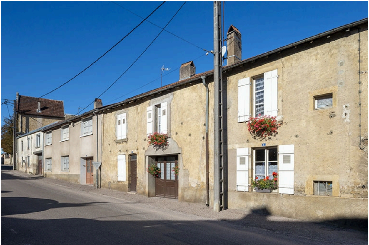
Trois quarts droit des façades des maisons, 7, 5 et suivants, vers le sud-ouest.