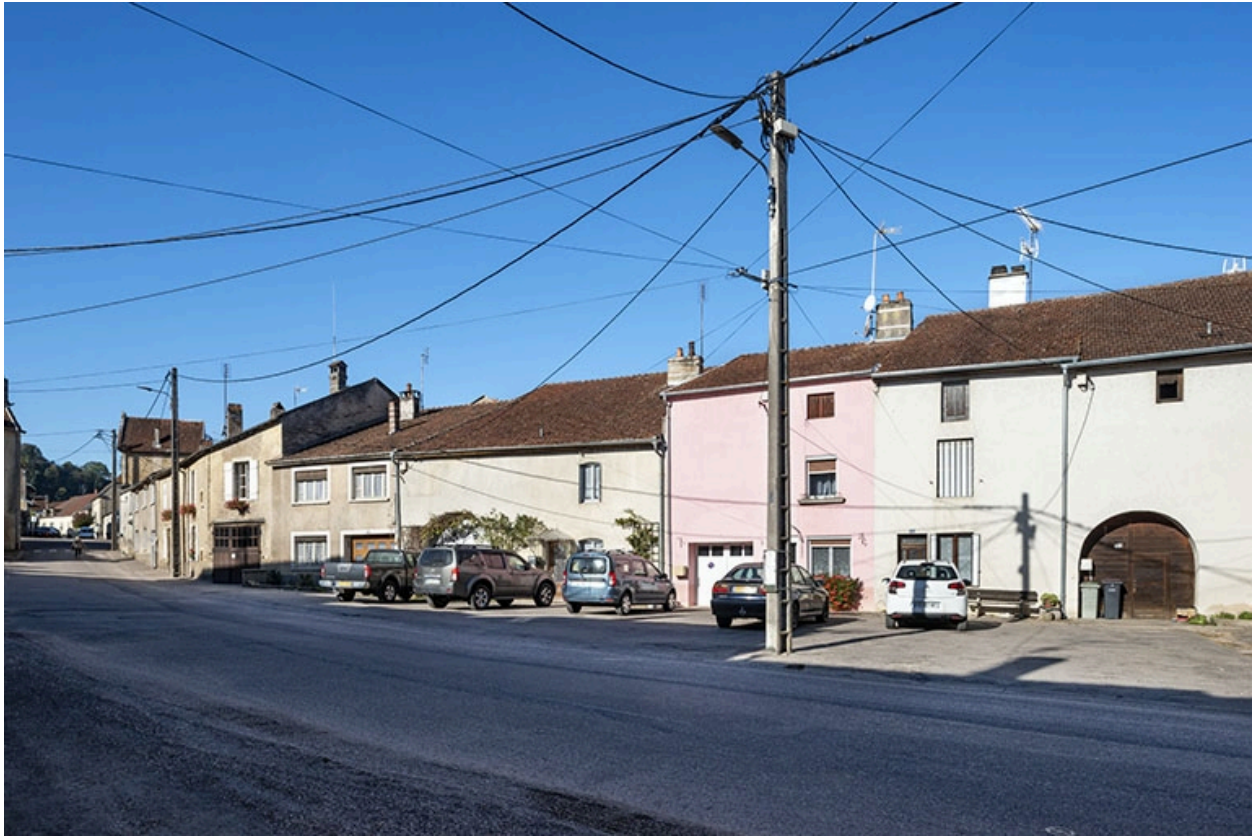
Trois quarts droit des façades des maisons et fermes,15,13 et suivants, vers le sud-ouest.