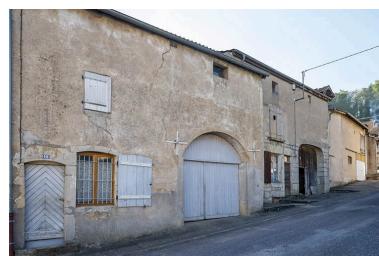
Trois quarts gauche des façades des maisons et fermes, 10, 8 et suivants, vers le sud.

IVR43_20217000668NUC4A