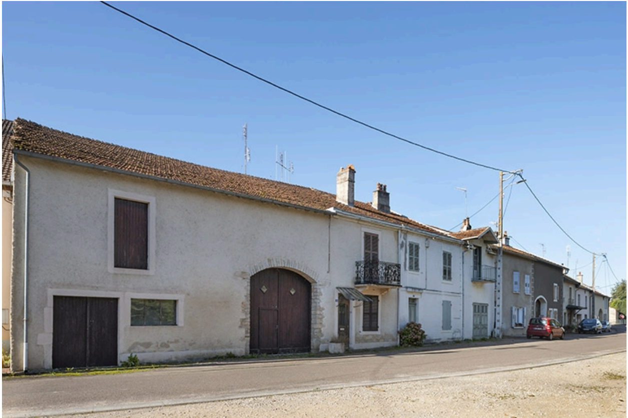
Trois quarts gauche des façades des fermes et maisons, 44, 42 et suivants, vers le nord-ouest.