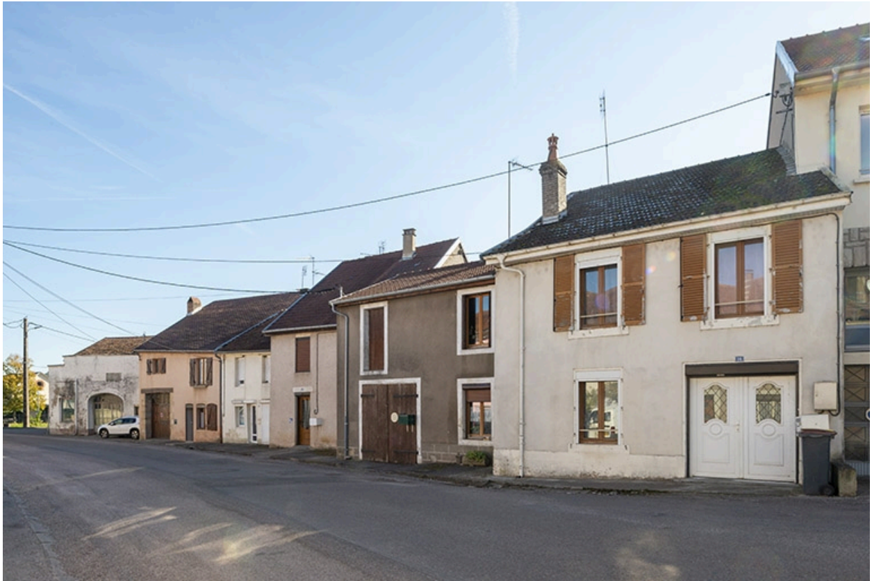
Trois quarts droit des façades des maisons, 16, 18 et suivants, vers le nord-est.