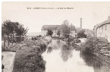
Le bief du Moulin. Carte postale.

Dess. Aline Thomas IVR43_20257000063NUDA