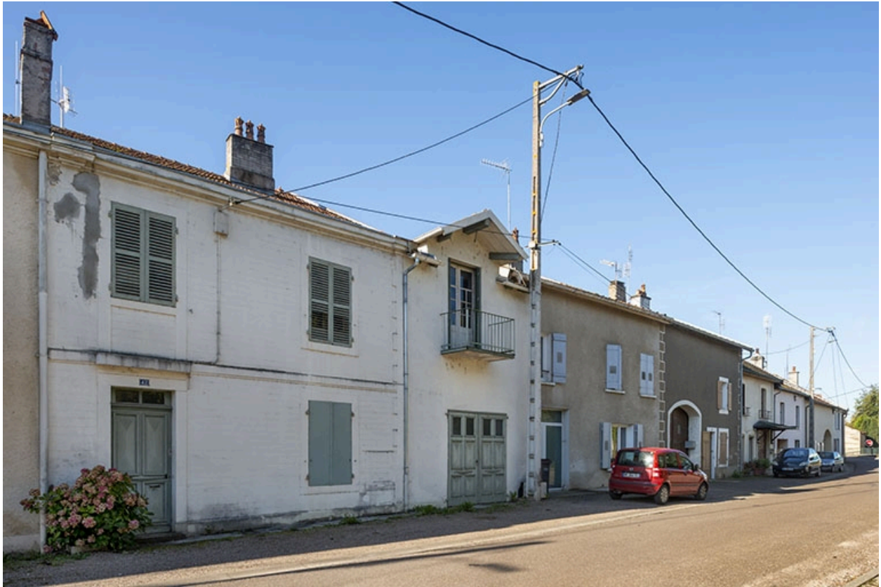
Trois quarts gauche des façades des maisons, 42, 40 et suivants, vers le nord-ouest.