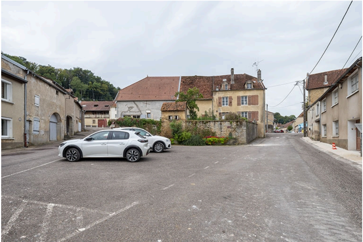
Les deux côtés de la rue aux environs de la fontaine.