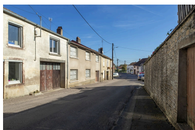
Trois quarts gauche des façades des maisons, 1, 3 et suivants, vers le nord-est.

IVR43_20217000539NUC4A