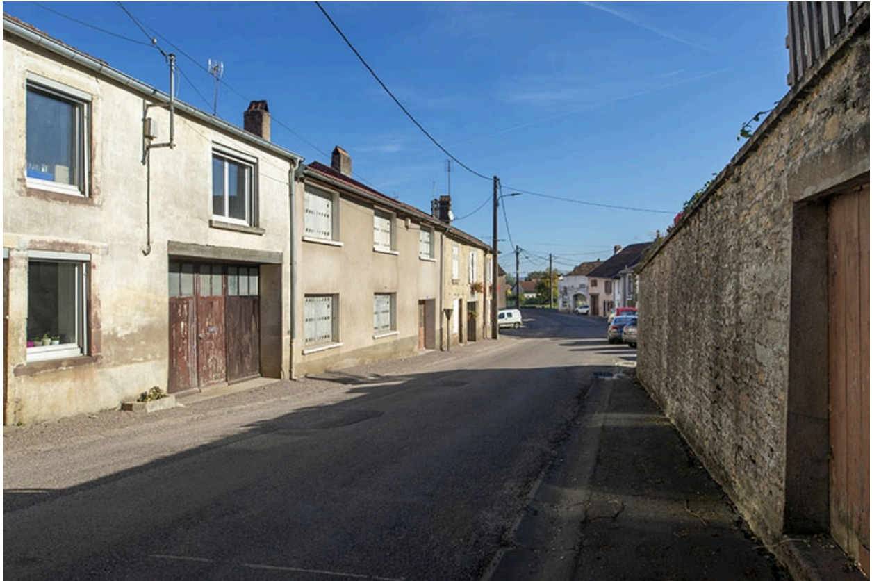
Trois quarts gauche des façades des maisons, 1, 3 et suivants, vers le nord-est.