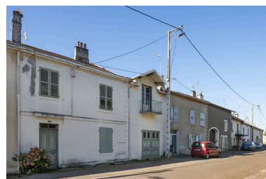
Trois quarts gauche des façades des maisons, 42, 40 et suivants, vers le nord-ouest.

IVR43_20217000672NUC4A