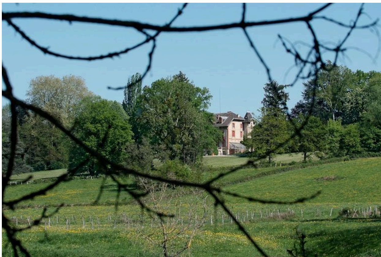
Château de Saint-Romain.