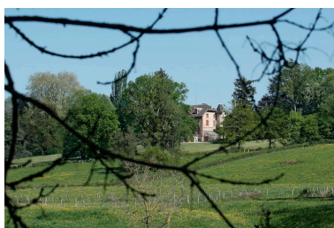
Château de Saint-Romain.