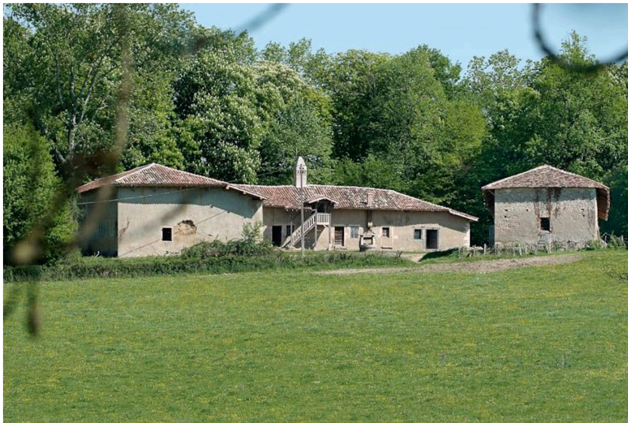
Ferme du château de Saint-Romain, avec cheminée sarrasine.