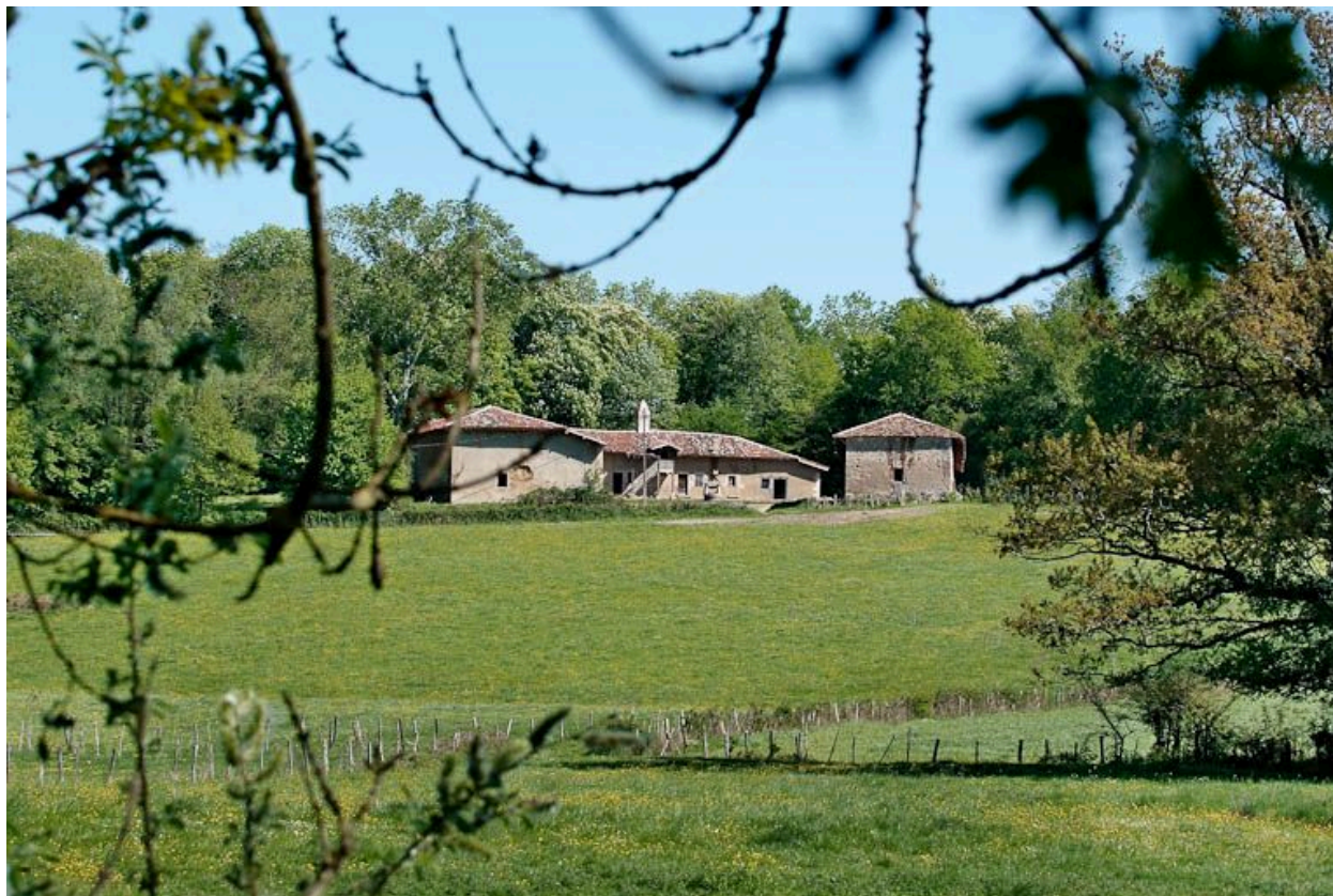
Ferme du château de Saint-Romain, avec cheminée sarrasine.