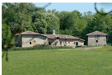
Ferme du château de Saint-Romain, avec cheminée sarrazine.