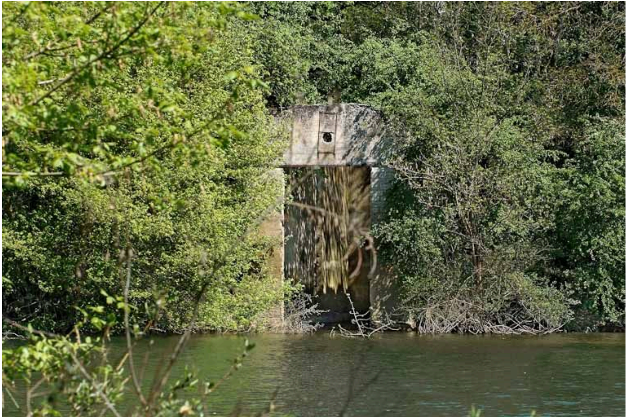
Un garage à bateau (?) sur la rive gauche de la Seille, en bas du parc du château de Saint-Romain.