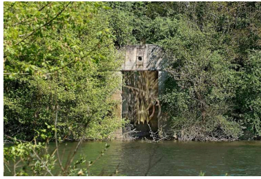
Un garage à bateau (?) sur la rive gauche de la Seille, en bas du parc du château de Saint-Romain.