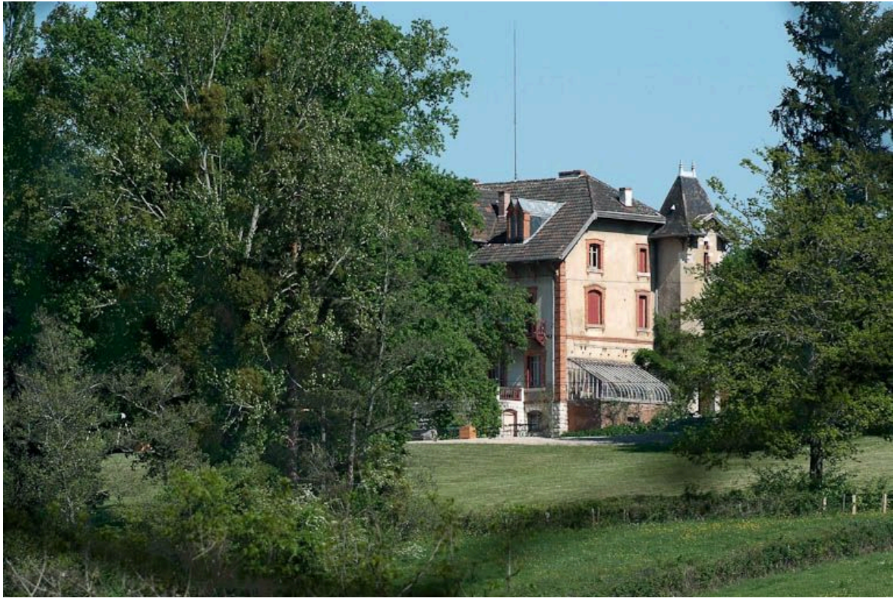
Château de Saint-Romain.