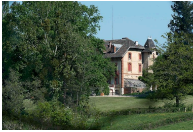
Château de Saint-Romain.