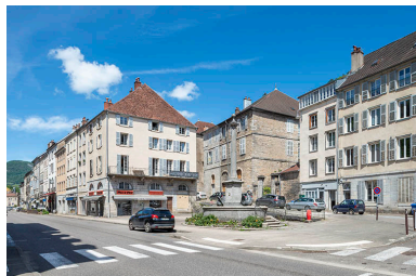
Vue d'ensemble depuis la rue de la République.