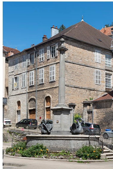
Vue rapprochée depuis le sud-ouest. IVR43_20243900677NUC4A