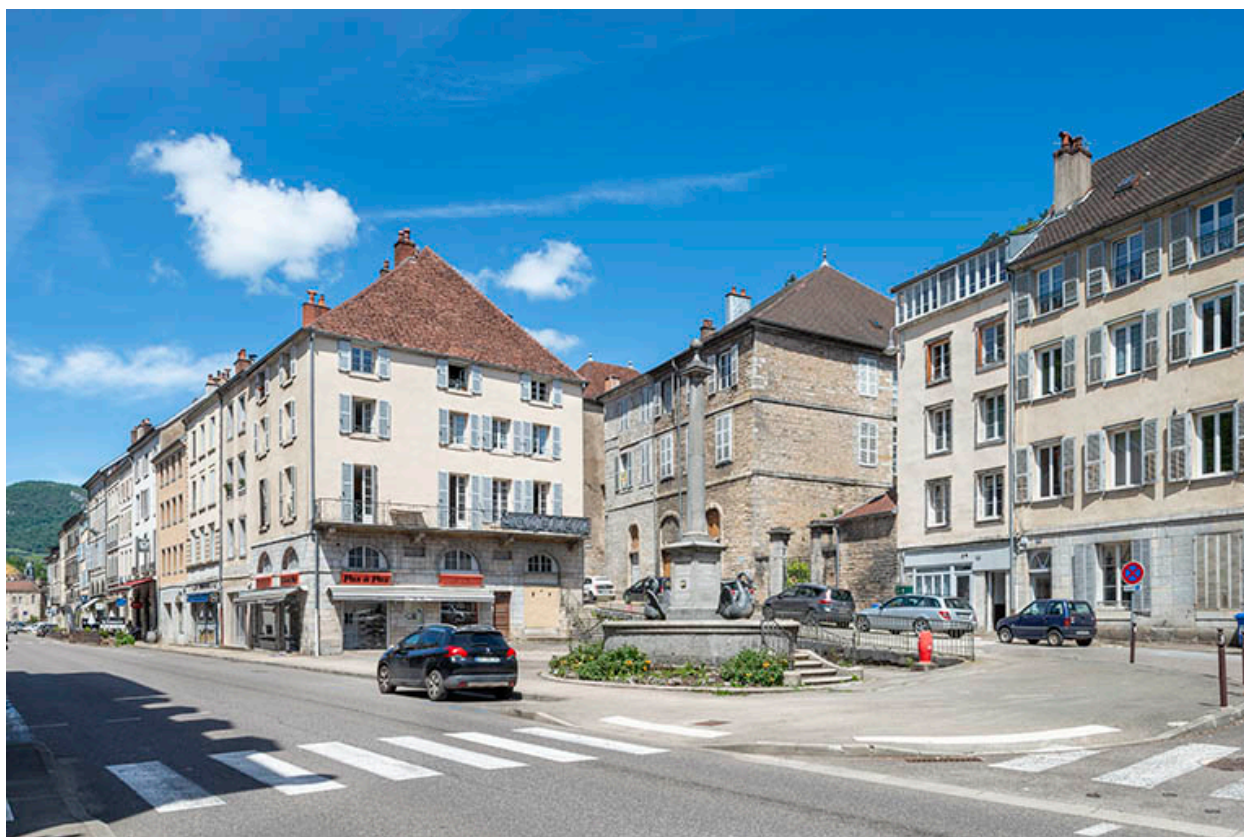
Vue d'ensemble depuis la rue de la République.