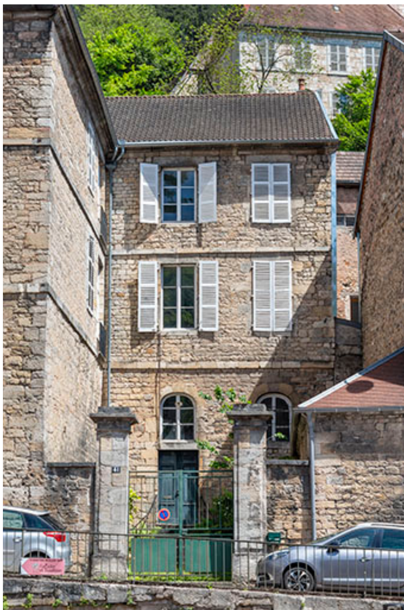
Façade ouest du bâtiment sur cour.