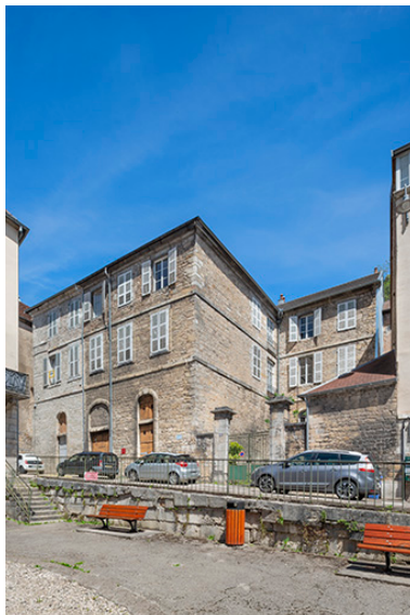
Vue d'ensemble depuis la place dite des Cygnes.