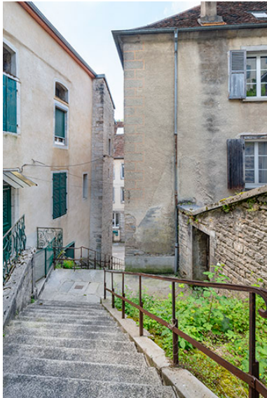
Façade nord (à gauche) depuis l'escalier des Sires de Poupet.