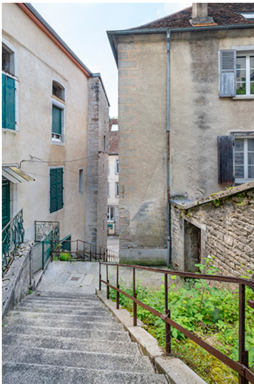
Façade nord (à gauche) depuis l'escalier des Sires de Poupet.