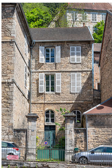
Façade ouest du bâtiment sur cour.