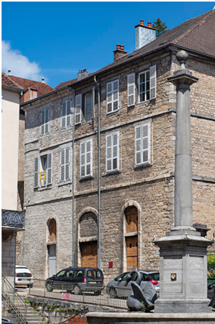
Bâtiment sur rue vu de trois quarts droite.