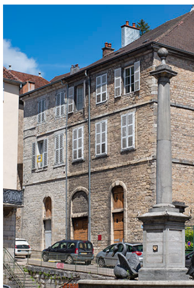
Bâtiment sur rue vu de trois quarts droite. IVR43_20243900676NUC4A