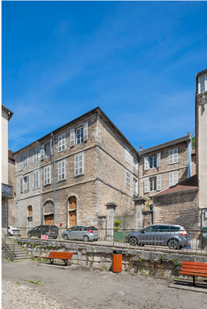
Vue d'ensemble depuis la place dite des Cygnes.