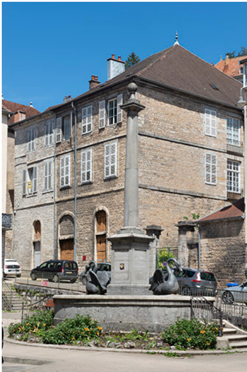
Vue rapprochée depuis le sud-ouest.