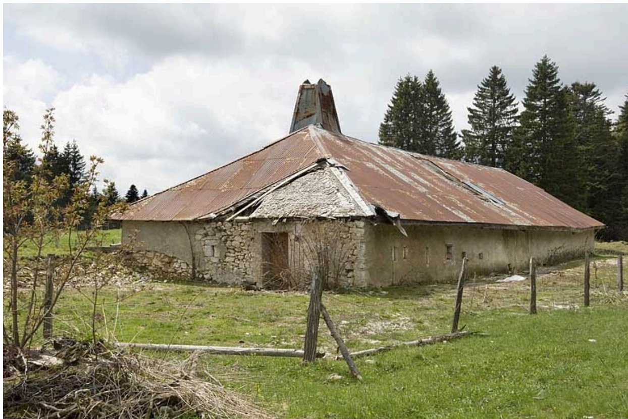
Façade latérale droite et façade postérieure.