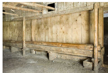
Intérieur, l'étable à vaches ou "écurie", détail : les mangeoirs ou "crêches". IVR43_20092500819NUC2A