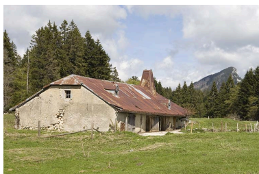
Vue générale de la Bécasse et de l'Aiguillon de Baulmes.