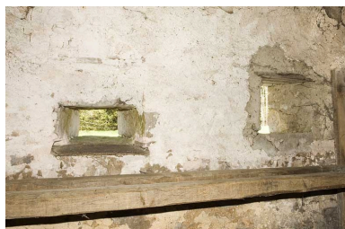
Intérieur, la chambre à lait ou "laitier" et deux baies fromagères.