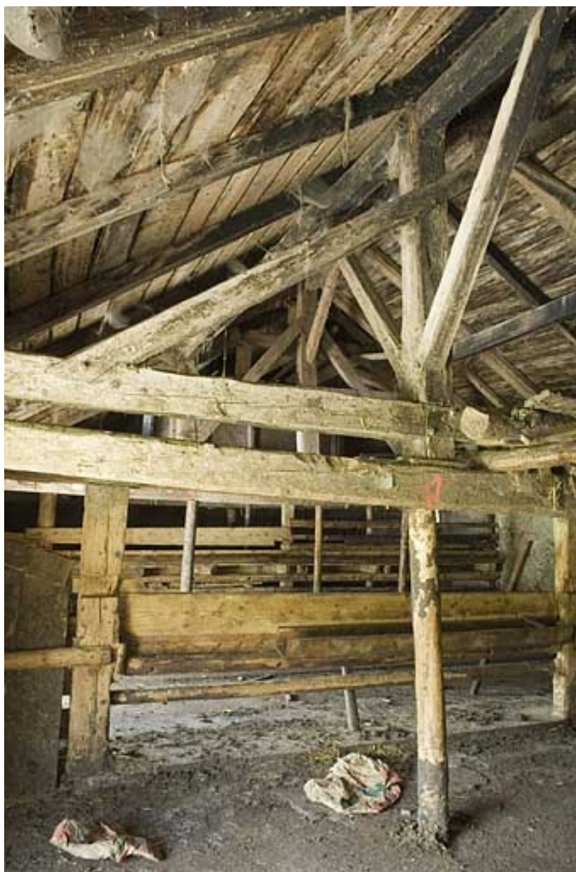
Détail de la charpente.