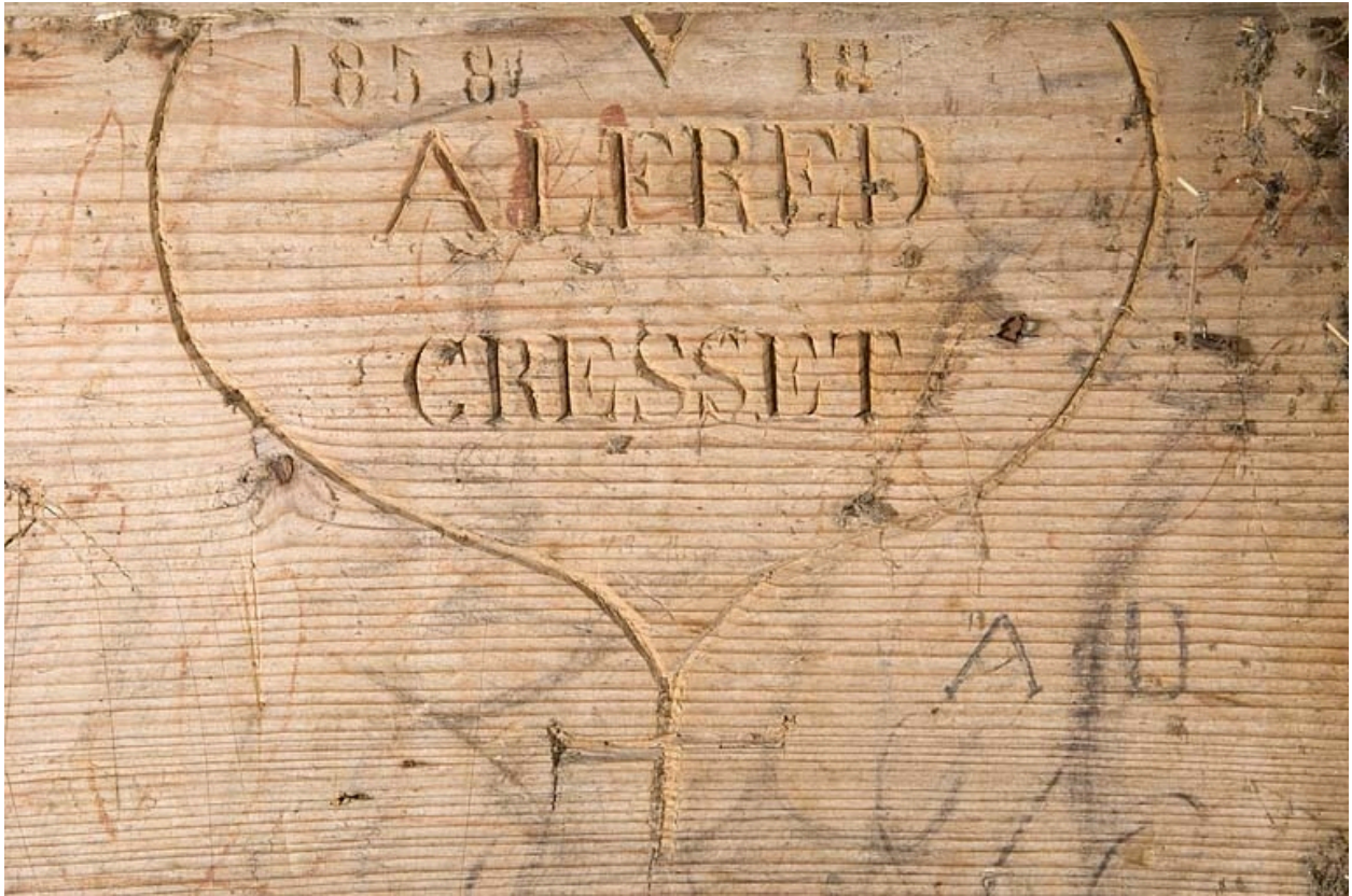
Intérieur, la chambre du berger, détail : inscription portant la date 1858.