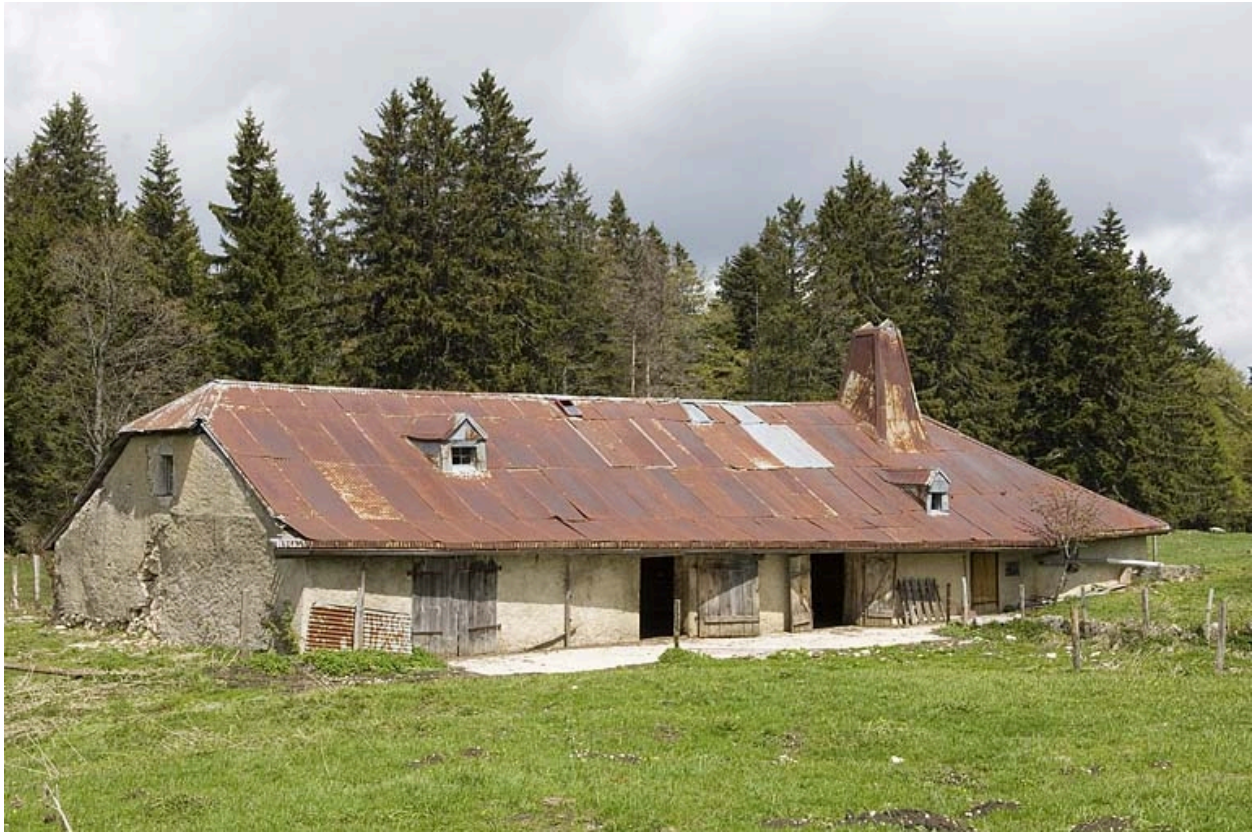
Vue générale de trois quart gauche.