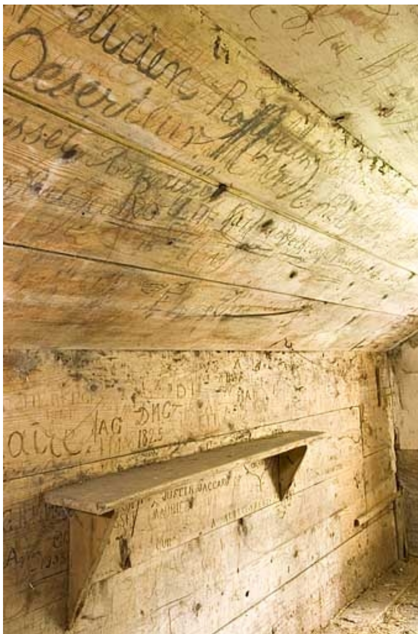
Intérieur, la chambre du berger, détail des inscriptions.