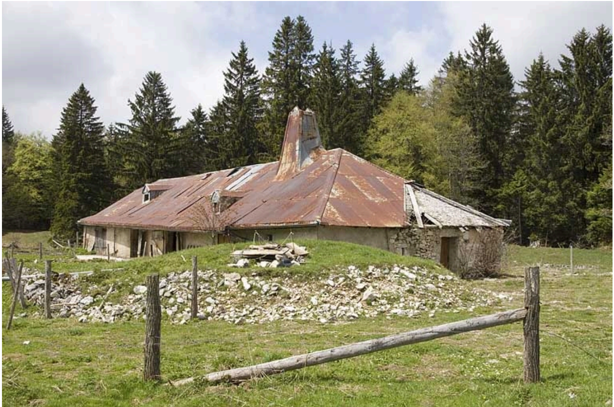
Vue générale de trois quart droit avec la citerne au premier plan.