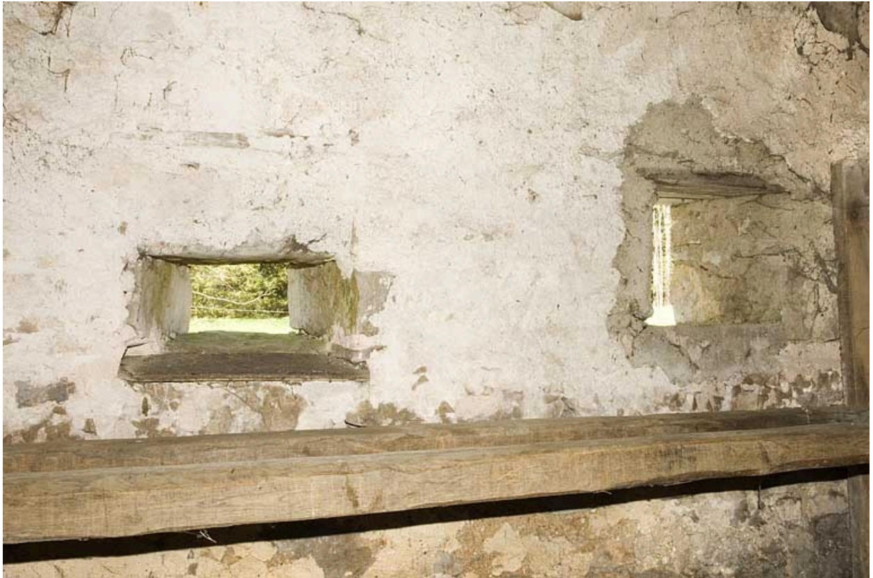
Intérieur, la chambre à lait ou "laitier" et deux baies fromagères.