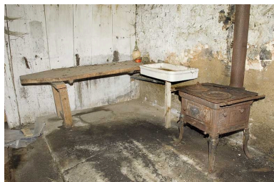
Intérieur, poêle en fonte. IVR43_20092500822NUC2A