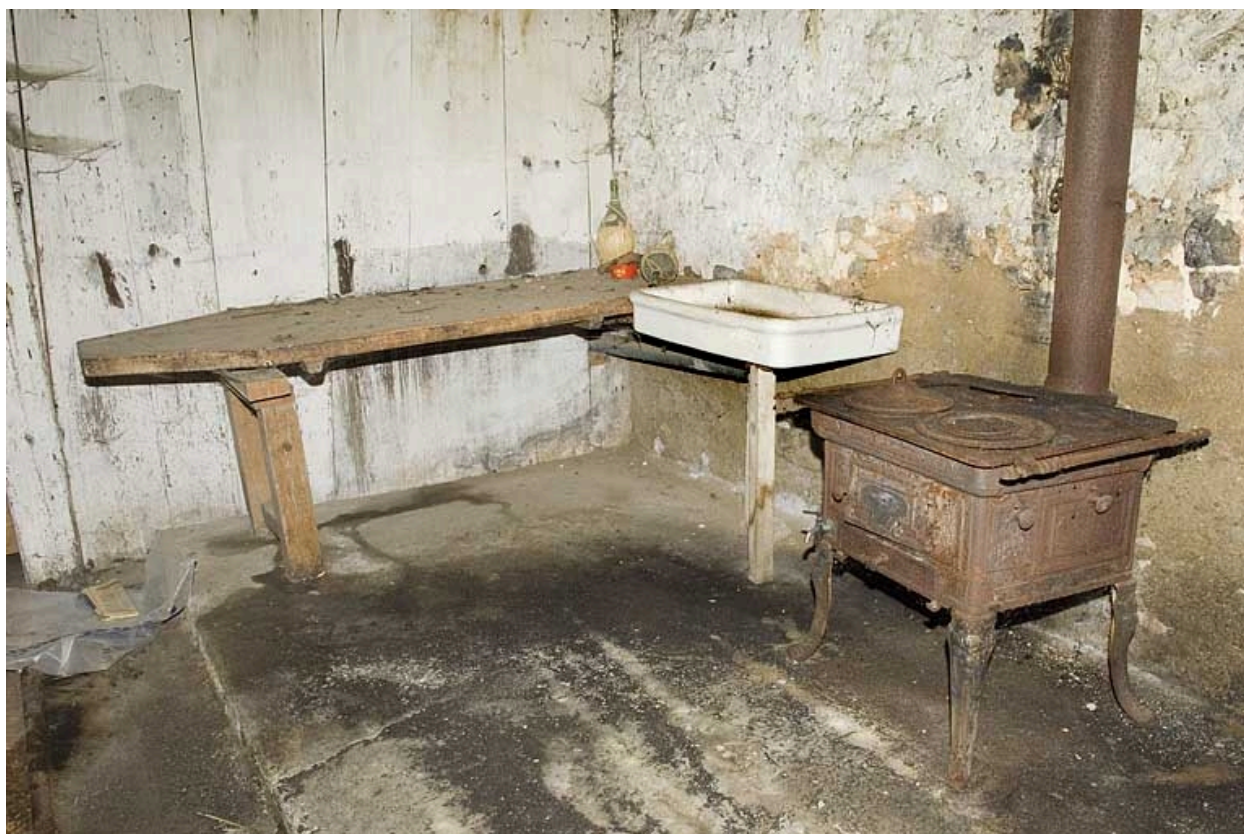
Intérieur, poêle en fonte.