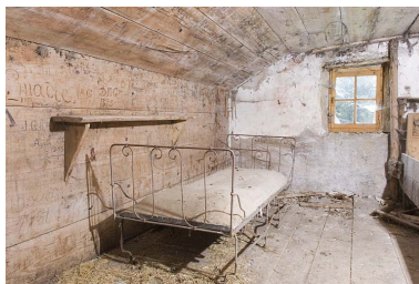
La chambre du berger. IVR43_20092500475NUC2A