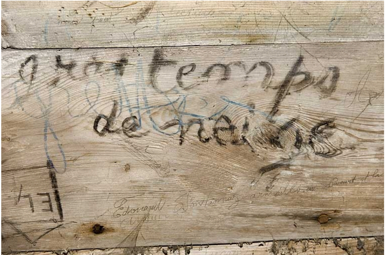
Intérieur, la chambre du berger, détail : inscription.