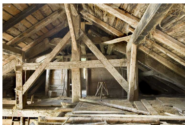
Vue générale de la charpente et, au fond, la porte ouvrant sur la chambre du berger.