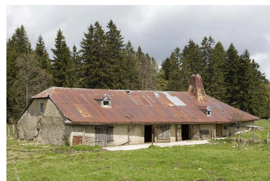
Vue générale de trois quart gauche.