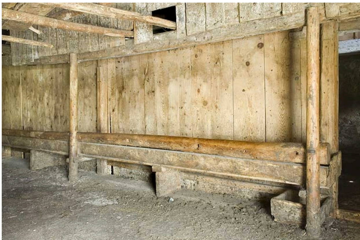
Intérieur, l'étable à vaches ou "écurie", détail : les mangeoirs ou "crèches".