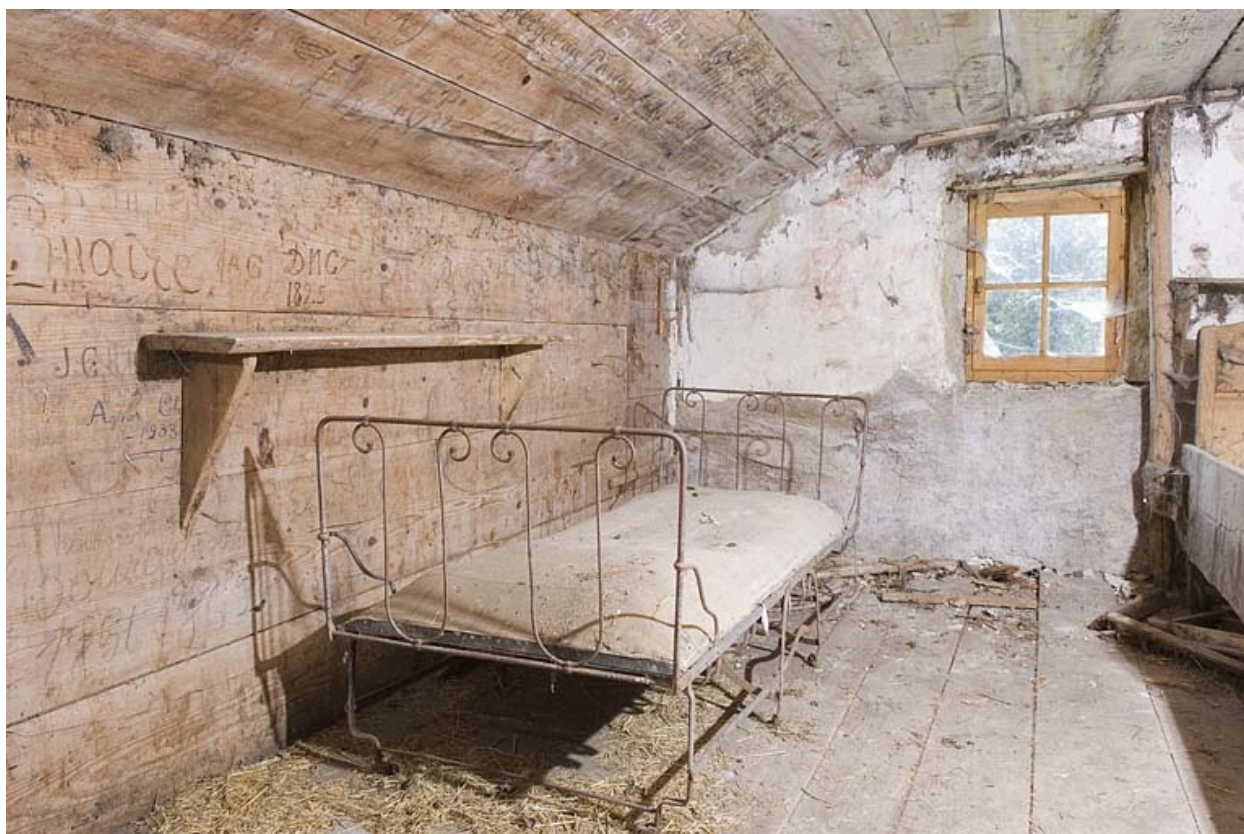
La chambre du berger.