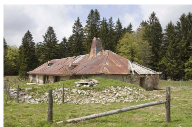
Vue générale de trois quart droit avec la citerne au premier plan.