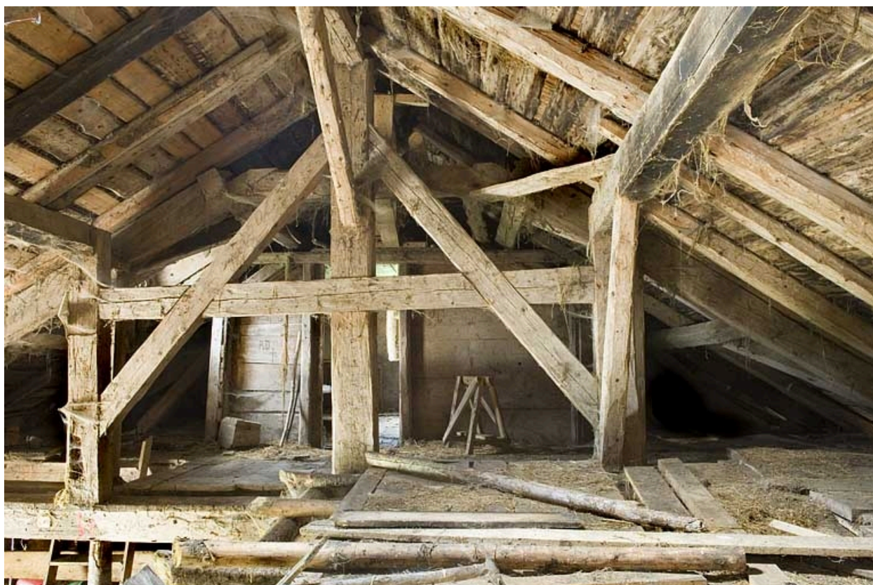
Vue générale de la charpente et, au fond, la porte ouvrant sur la chambre du berger.