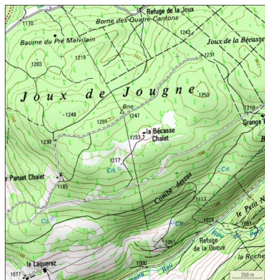
Carte de localisation. Extrait de la carte IGN, échelle 1/12 500.