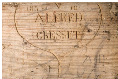
Intérieur, la chambre du berger, détail : inscription portant la date 1858.