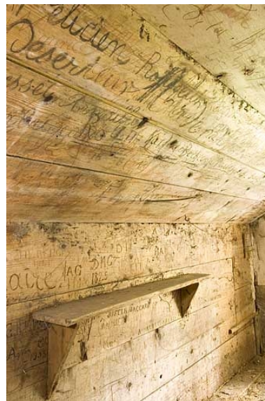
Intérieur, la chambre du berger, détail des inscriptions.