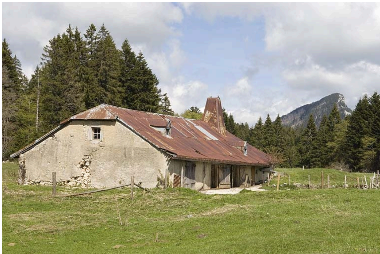
Vue générale de la Bécasse et de l'Aiguillon de Baulmes.