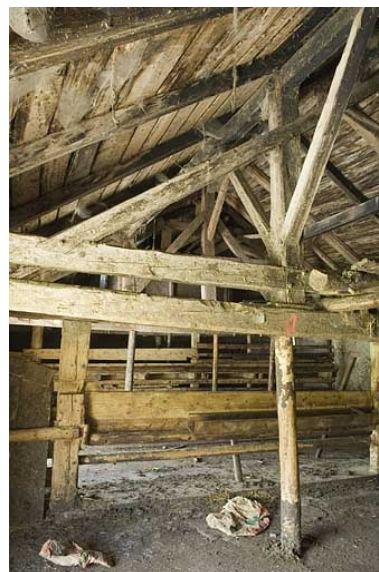
Détail de la charpente.