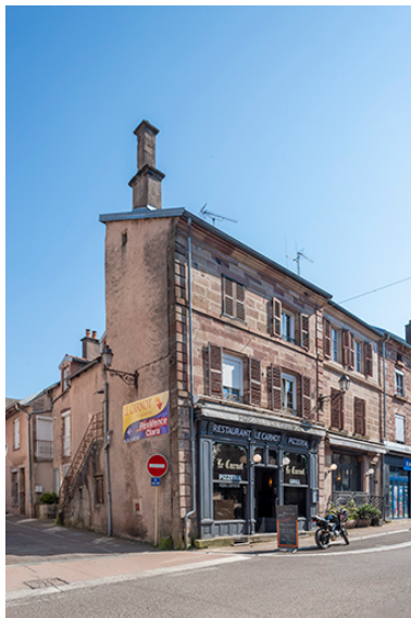
Vue actuelle. IVR43_20227000117NUC4A