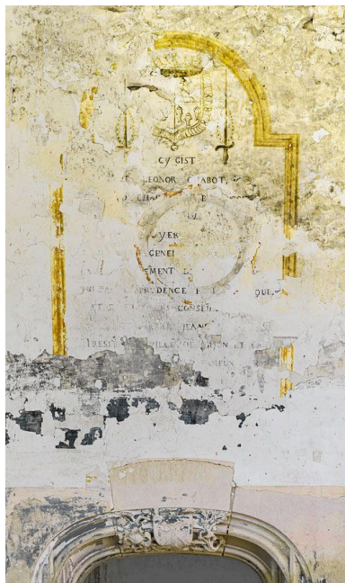
Vue d'ensemble. IVR26_20182100350NUC4A