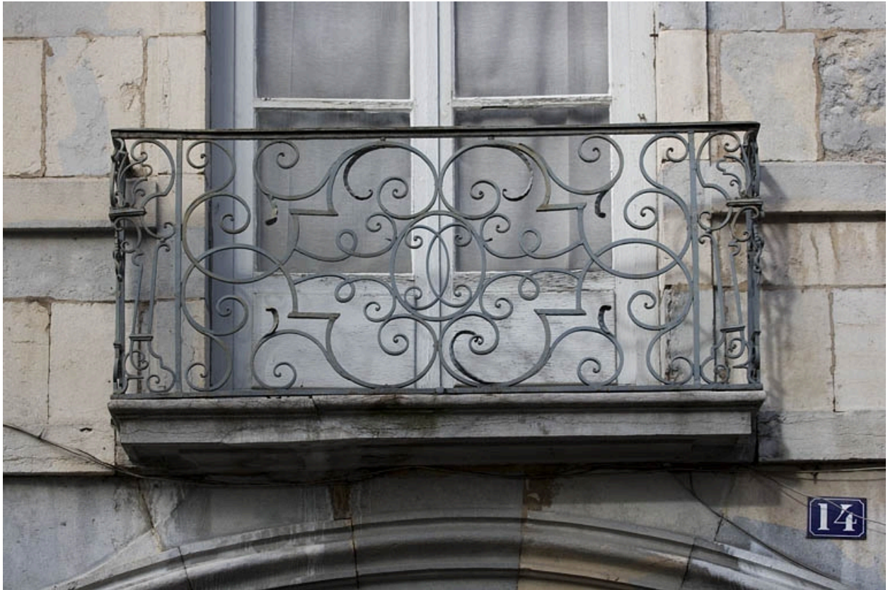
Détail du balcon en fer forgé.