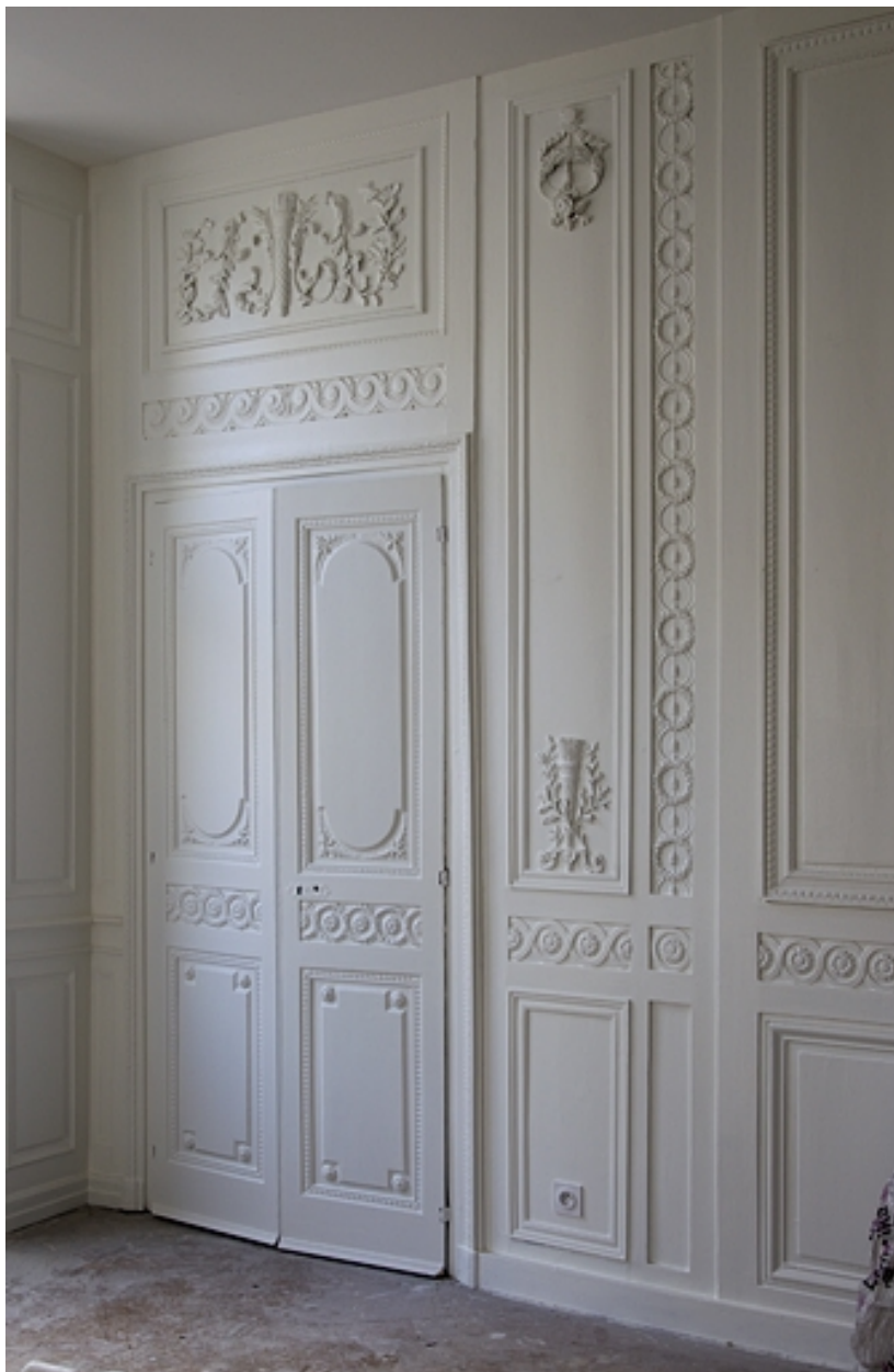
Intérieur : détail d'une partie des lambris d'un salon, au rez-de-chaussée de l'aile gauche.