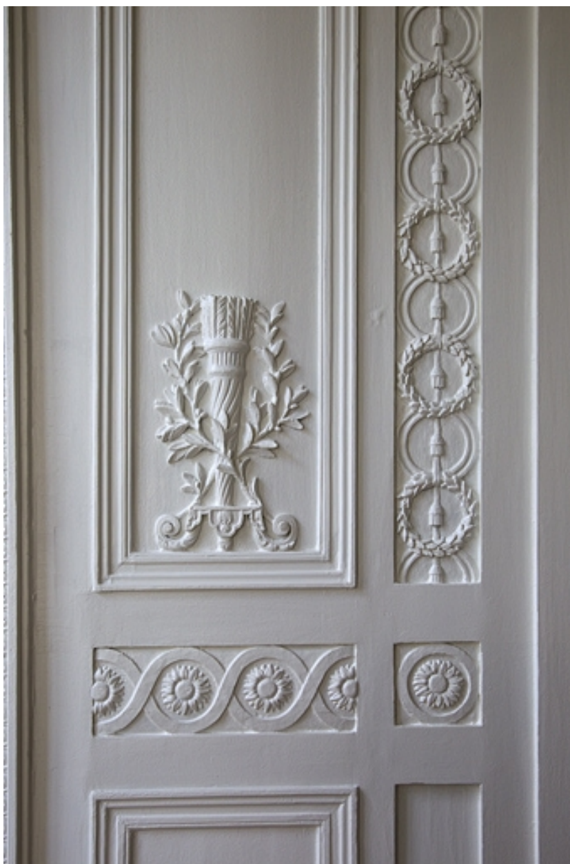
Intérieur, salon du rez-de-chaussée de l'aile gauche : détail du décor d'un panneau de lambris.