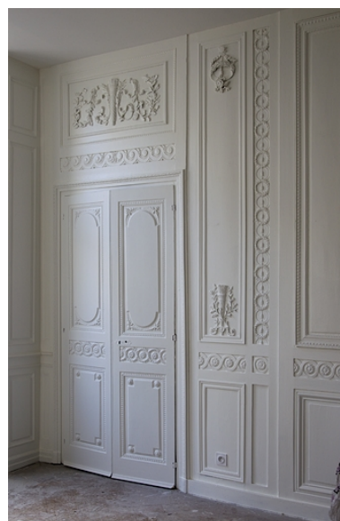
Intérieur : détail d'une partie des lambris d'un salon, au rez- de-chaussée de l'aile gauche.