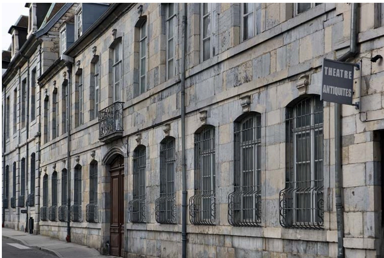
Détail de la façade de trois quarts droit.