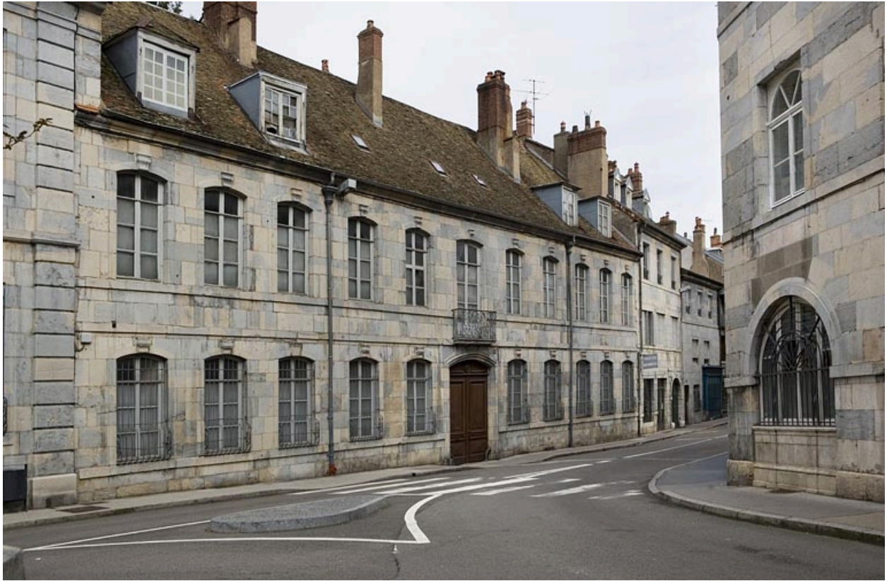
Vue d'ensemble de la façade de trois quarts gauche.