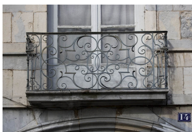
Détail du balcon en fer forgé. IVR43_20072500170NUCA