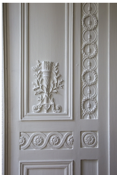
Intérieur, salon du rez-de- chaussée de l'aile gauche : détail du décor d'un panneau de lambris.