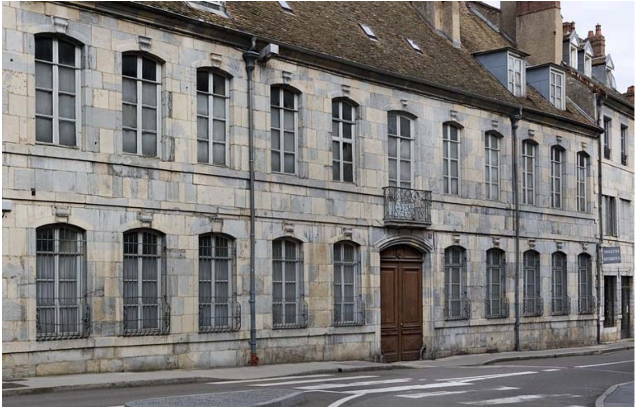
Vue rapprochée de la façade de trois quarts gauche.