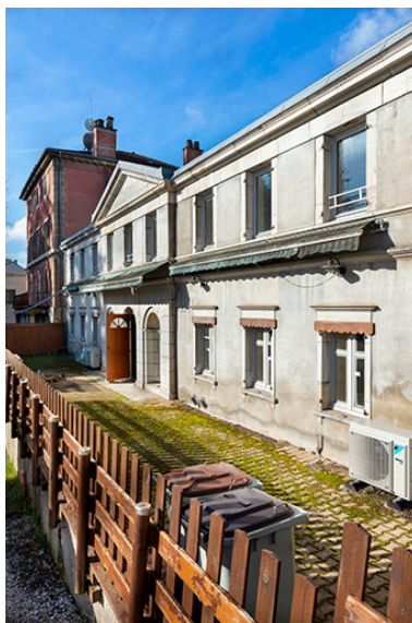
Façade est. IVR43_20233900068NUC4A