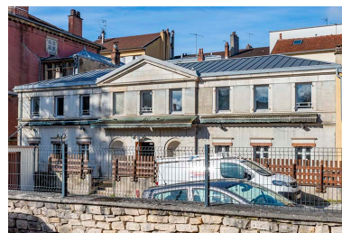
Façade est. IVR43_20233900069NUC4A