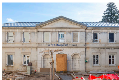
Façade ouest. IVR43_20233900070NUC4A