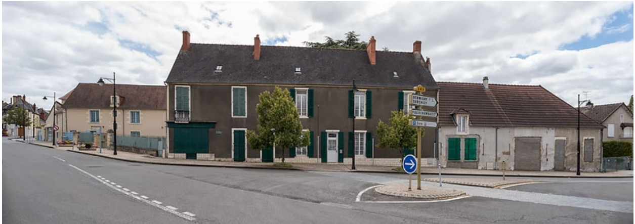
Vue d'ensemble, depuis le croisement de l'avenue de Paris et de l'avenue de la Gare.