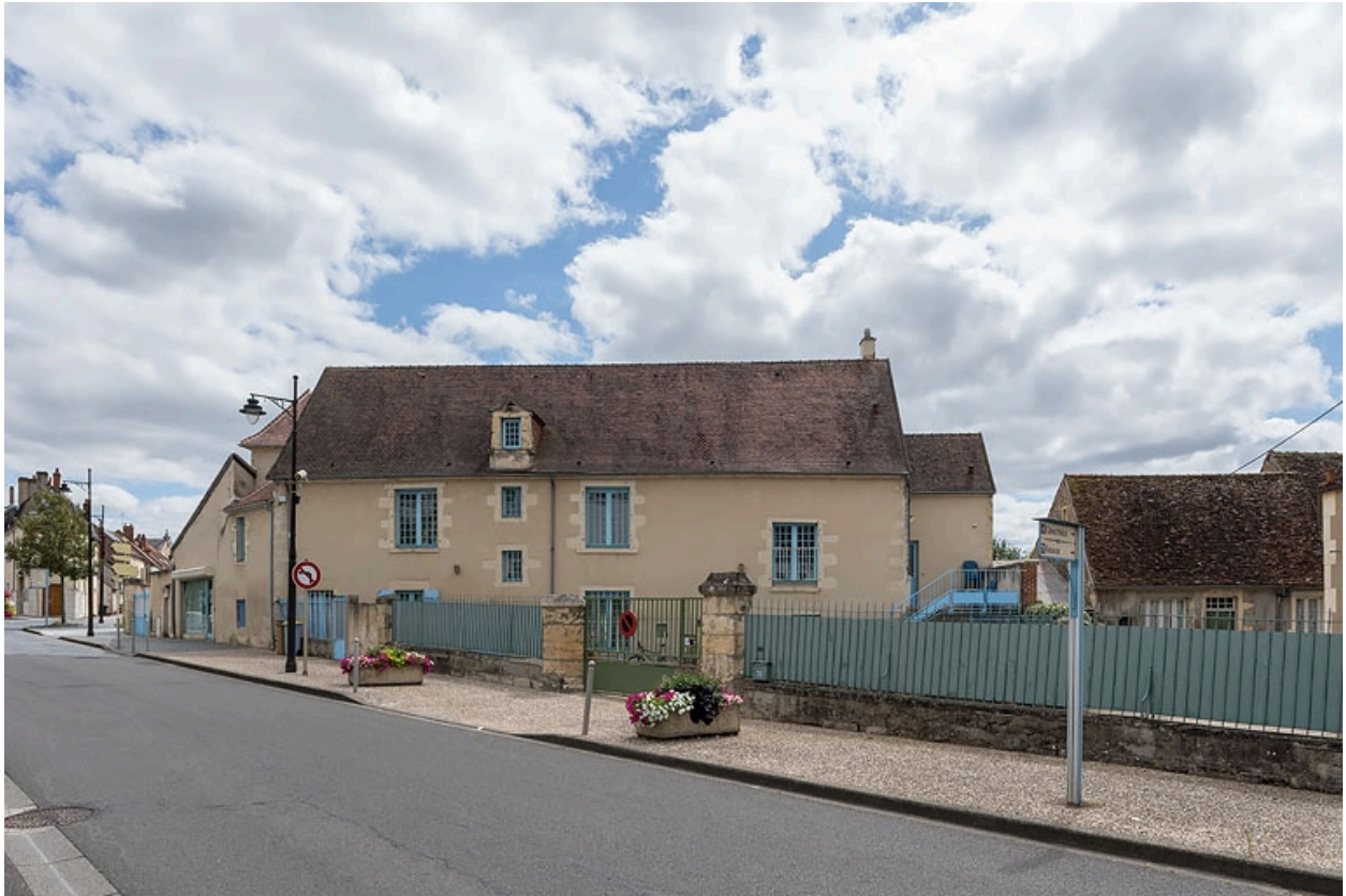
Vue depuis l'avenue de Paris.