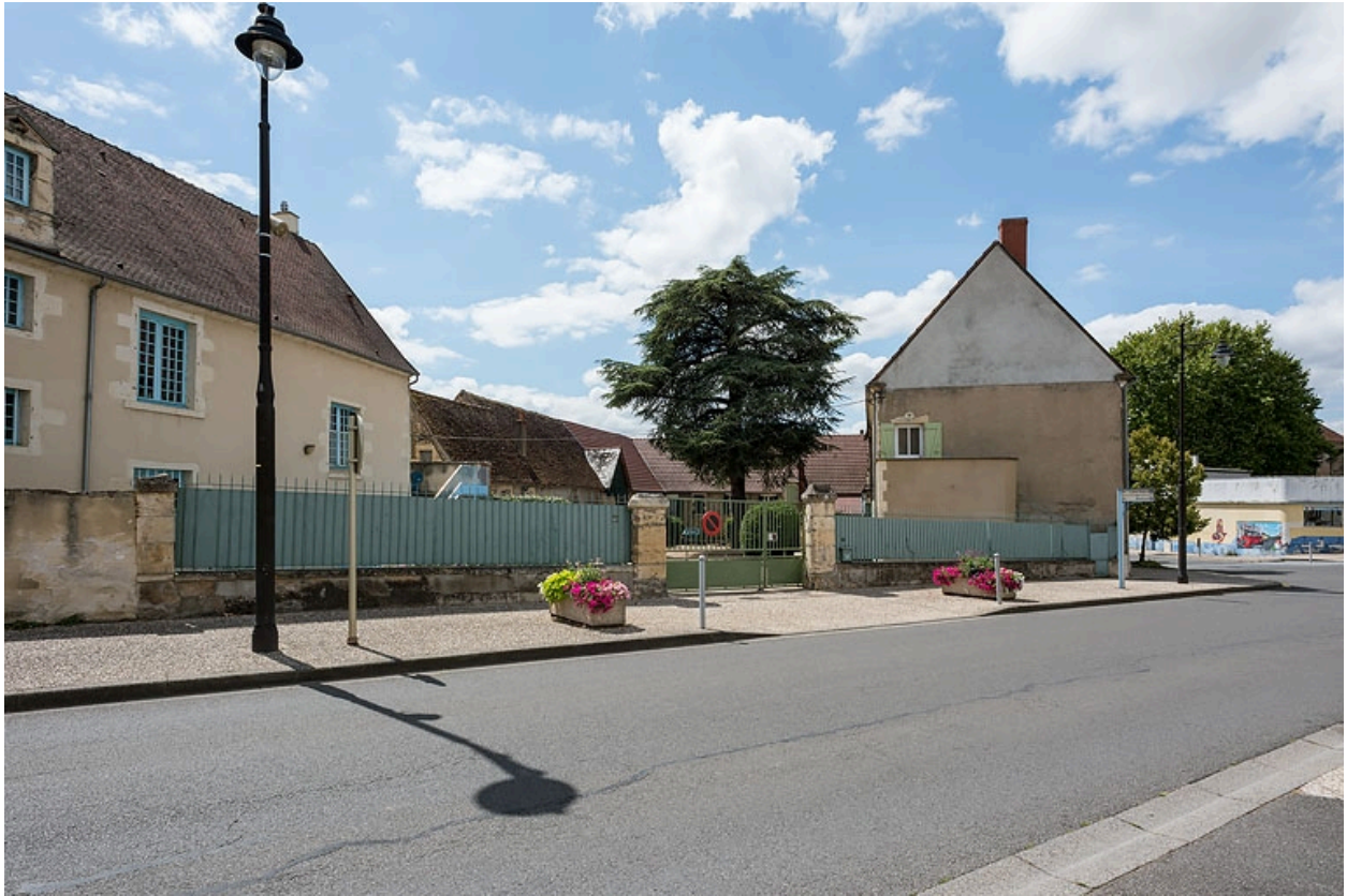
Vue depuis l'avenue de Paris.