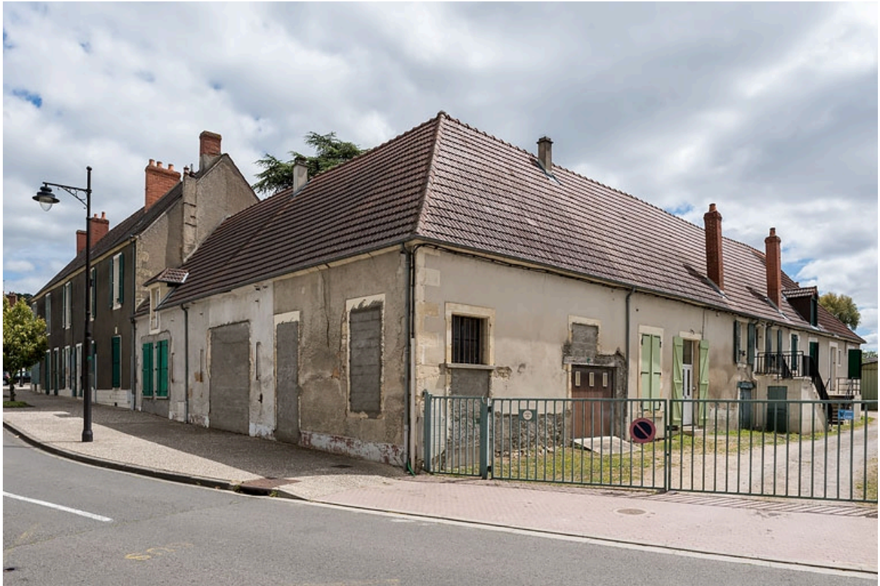
Vue depuis l'avenue de la Gare.