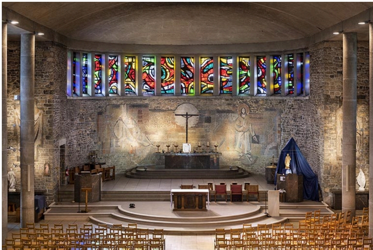
Vue du chœur aménagé après la réforme liturgique de Vatican II.