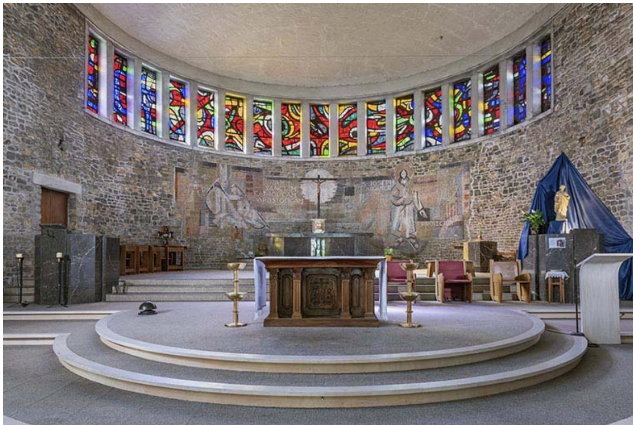
Vue du chœur et de son mobilier.