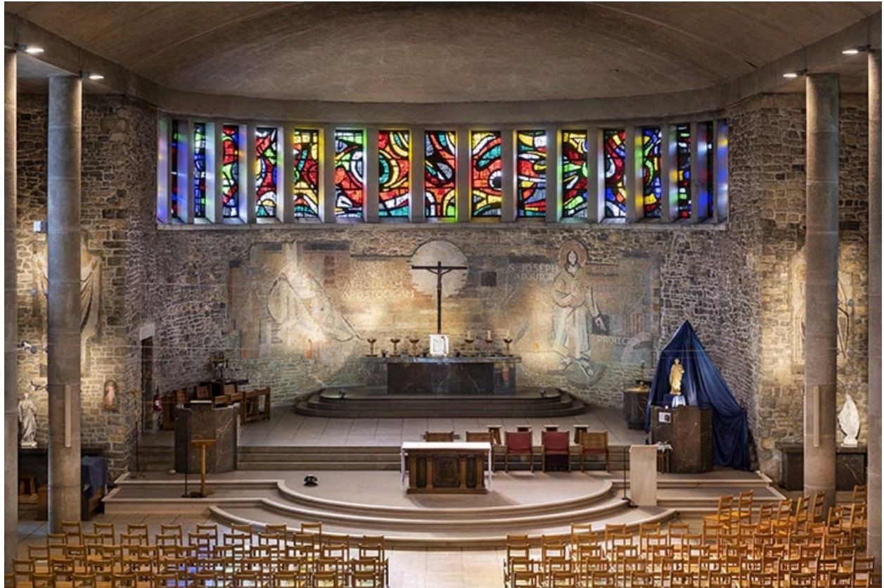
Vue du chœur aménagé après la réforme liturgique de Vatican II.