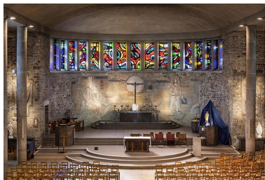
Vue du chœur aménagé après la réforme liturgique de Vatican II.