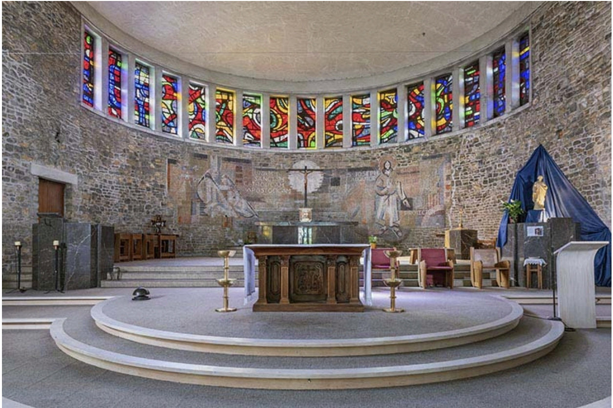
Vue du chœur et de son mobilier.