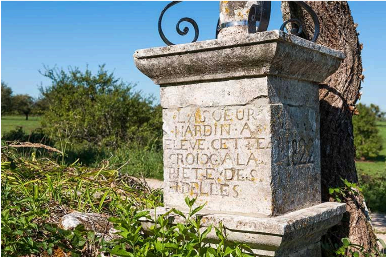
Détail du socle