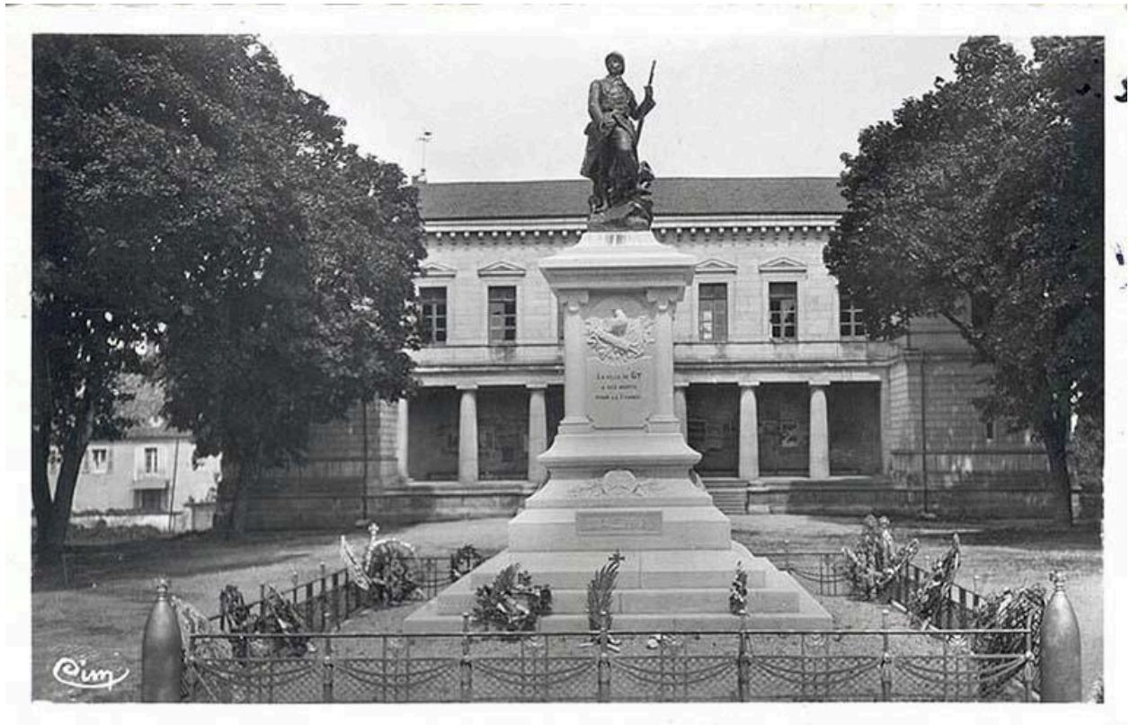
Le monument aux morts avant son déplacement