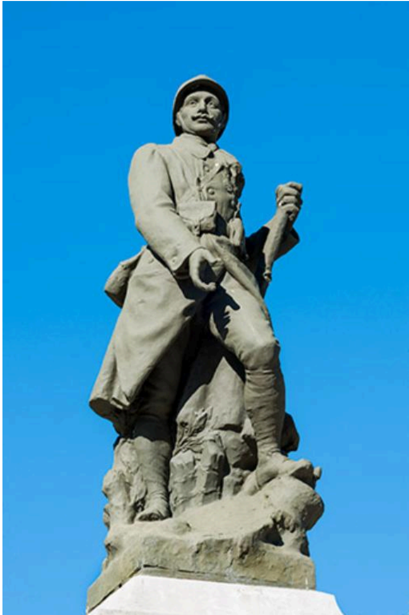
Statue du monument aux morts