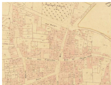
Emplacement du couvent de Capucins sur le cadastre de 1837 (feuille de section F2) IVR43_20137000786NUC2A