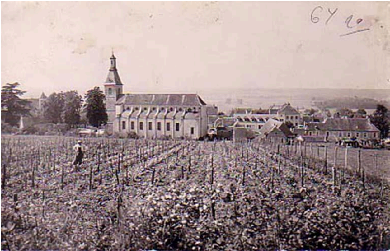
Vue sud de l'église, carte postale ancienne