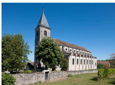
Vue générale sud-ouest de l'église IVR43_20137000250NUCA