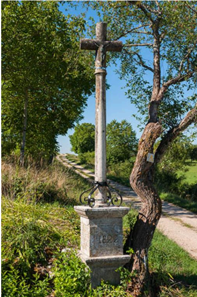
Détail de la croix