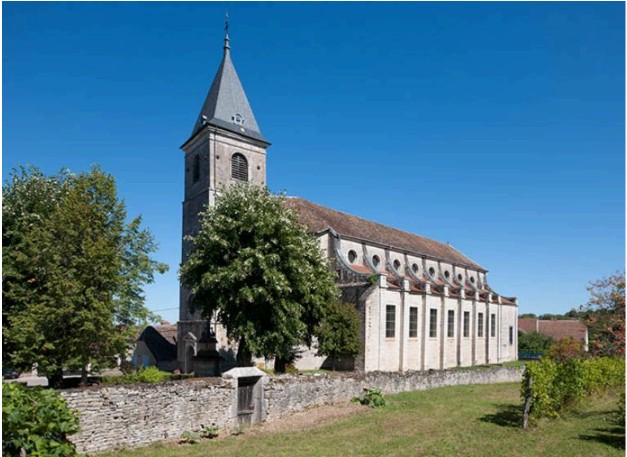
Vue générale sud-ouest de l'église