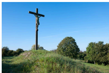
Croix située à l'ouest du château IVR43_20137000419NUCA