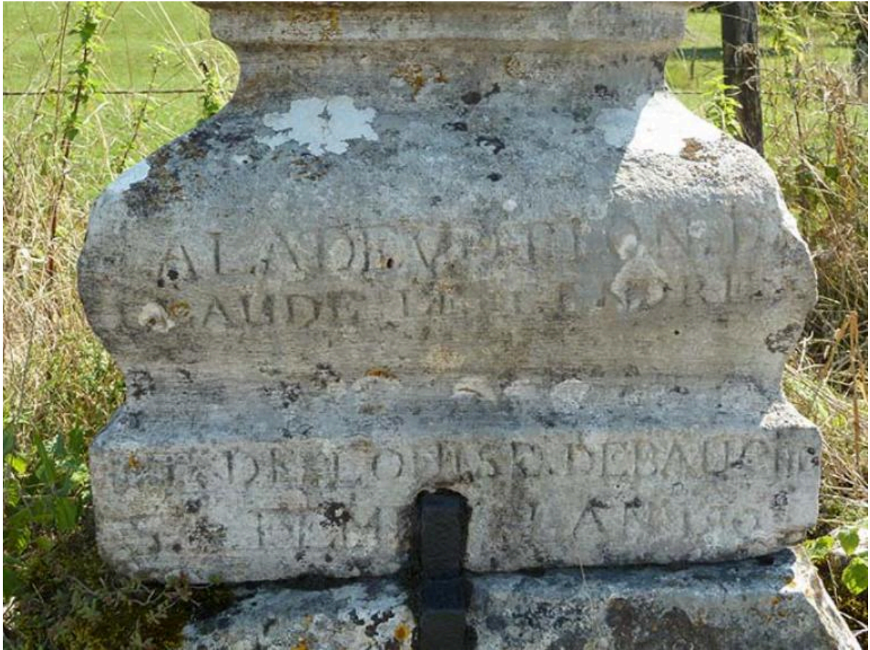
Détail du socle