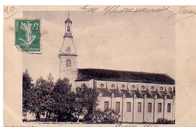
L'église sur une carte postale ancienne IVR43_20137000773NUC2A