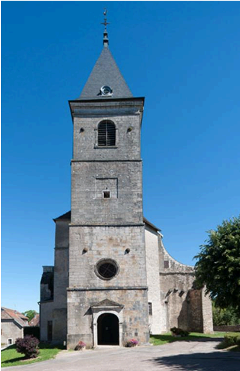
Façade ouest de l'église