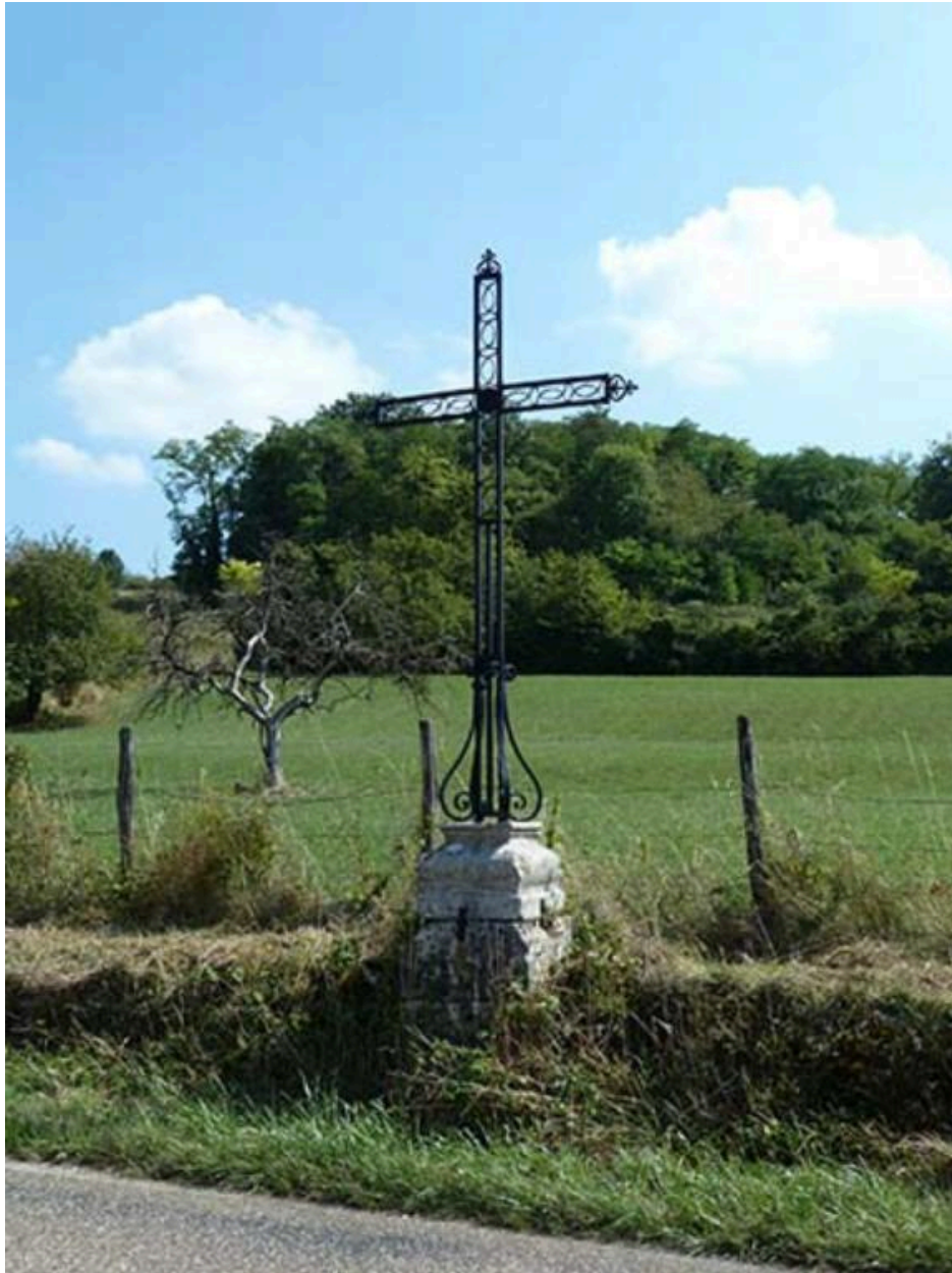
Croix, Vignes au Loup