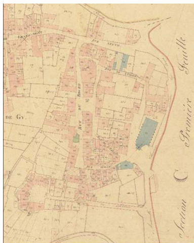
L'église sur le cadastre de 1837 IVR43_20137000883NUC2A