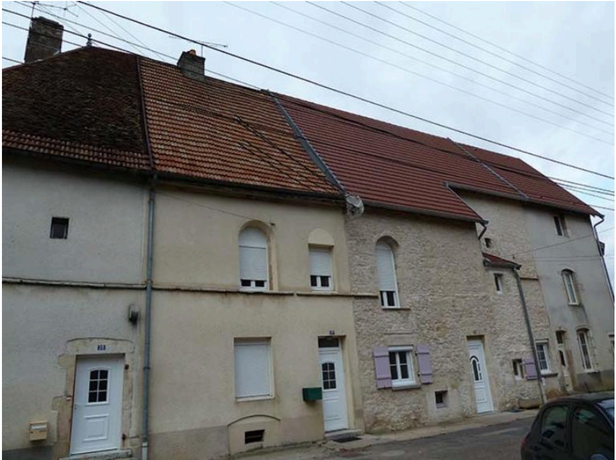
Vestiges des bâtiments du couvent des Capucins