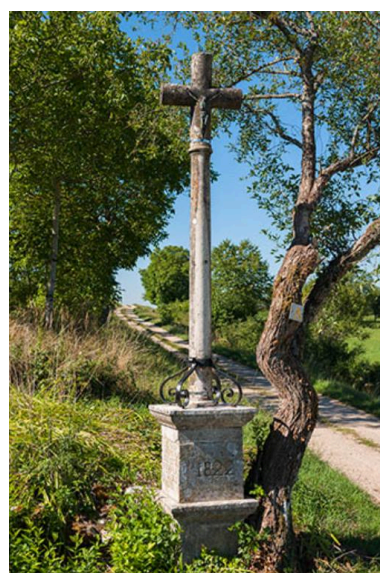
Détail de la croix IVR43_20137000195NUCA