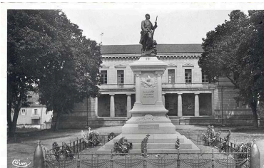
Le monument aux morts avant son déplacement IVR43_20137000760NUC2A