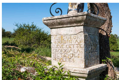
Détail du socle IVR43_20137000196NUCA