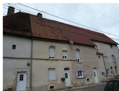
Vestiges des bâtiments du couvent des Capucins