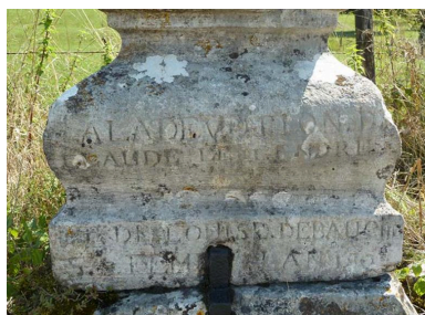
Détail du socle IVR43_20137000793NUC2A