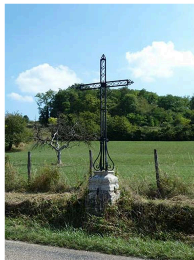
Croix, Vignes au Loup IVR43_20137000792NUC2A