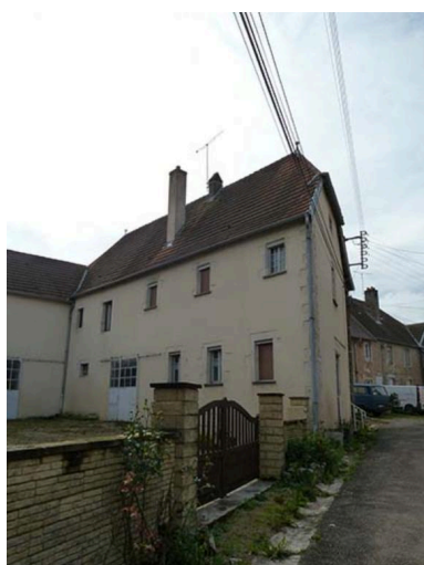
Vestiges des bâtiments du couvent des Capucins