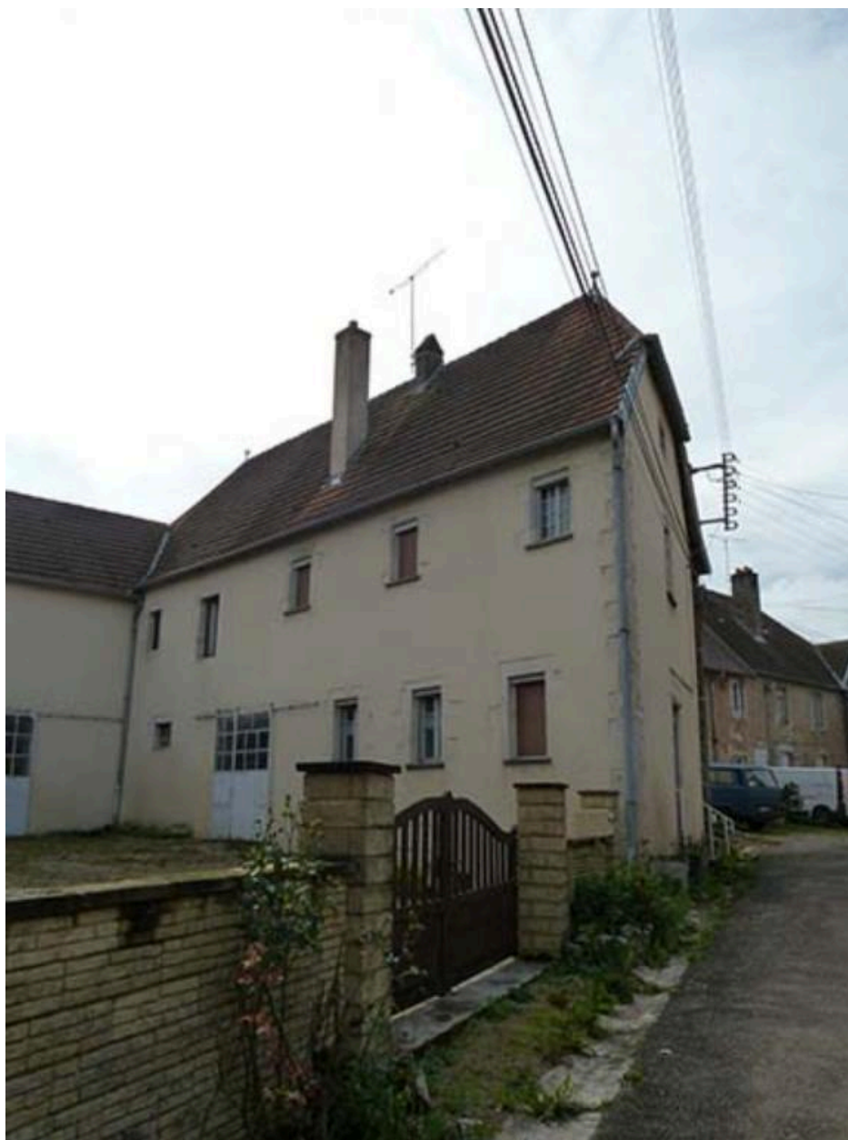
Vestiges des bâtiments du couvent des Capucins