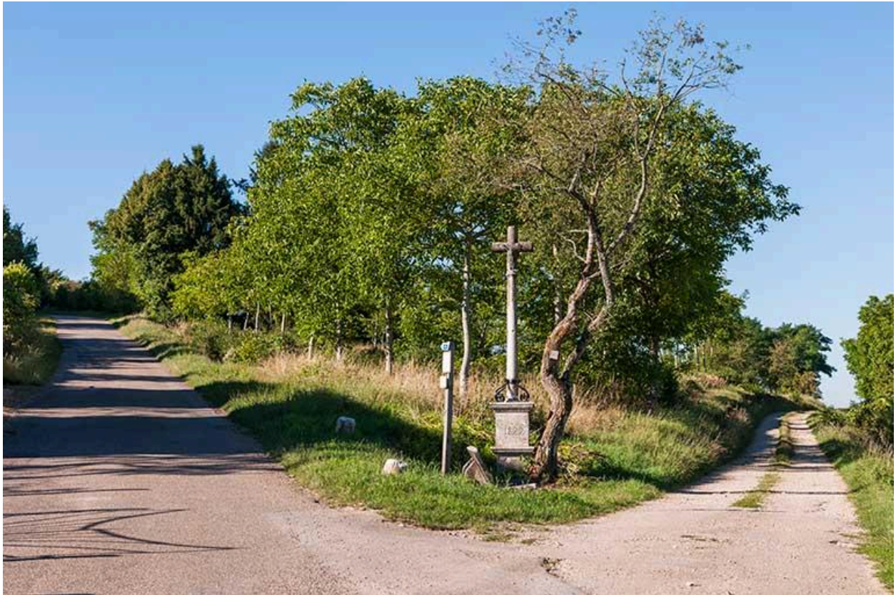
Croix située sur la route du cimetière