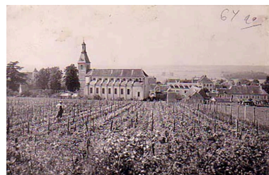
Vue sud de l'église, carte postale ancienne IVR43_20137000767NUC2A