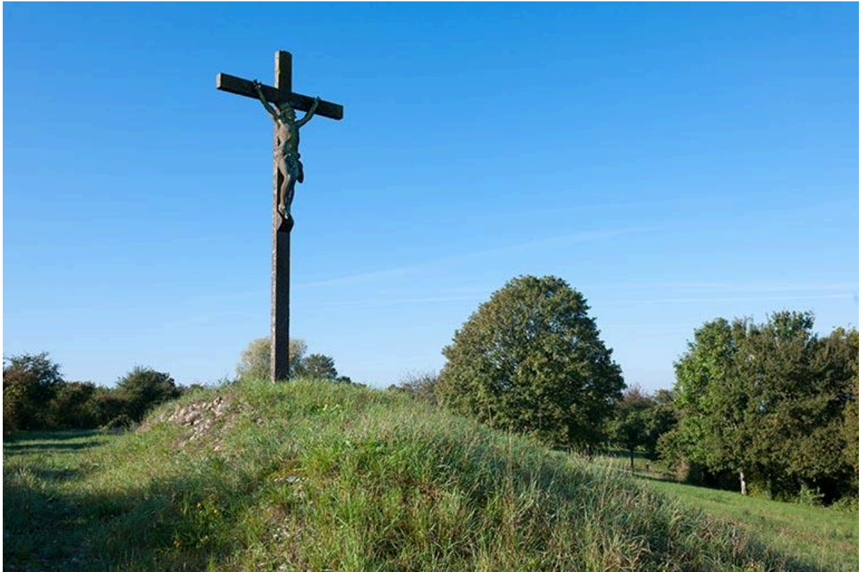
Croix située à l'ouest du château