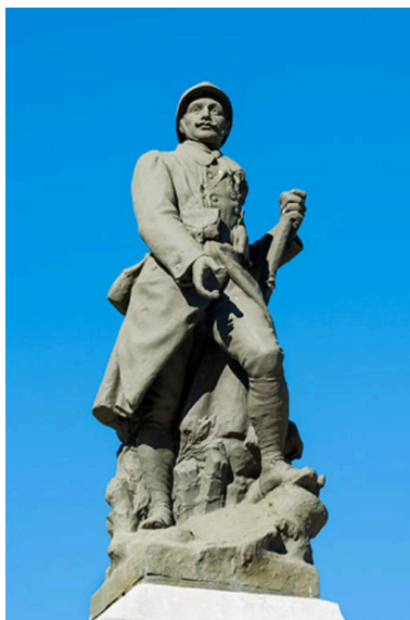
Statue du monument aux morts