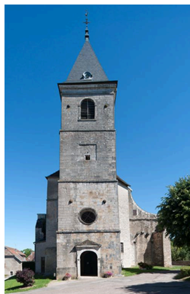
Façade ouest de l'église