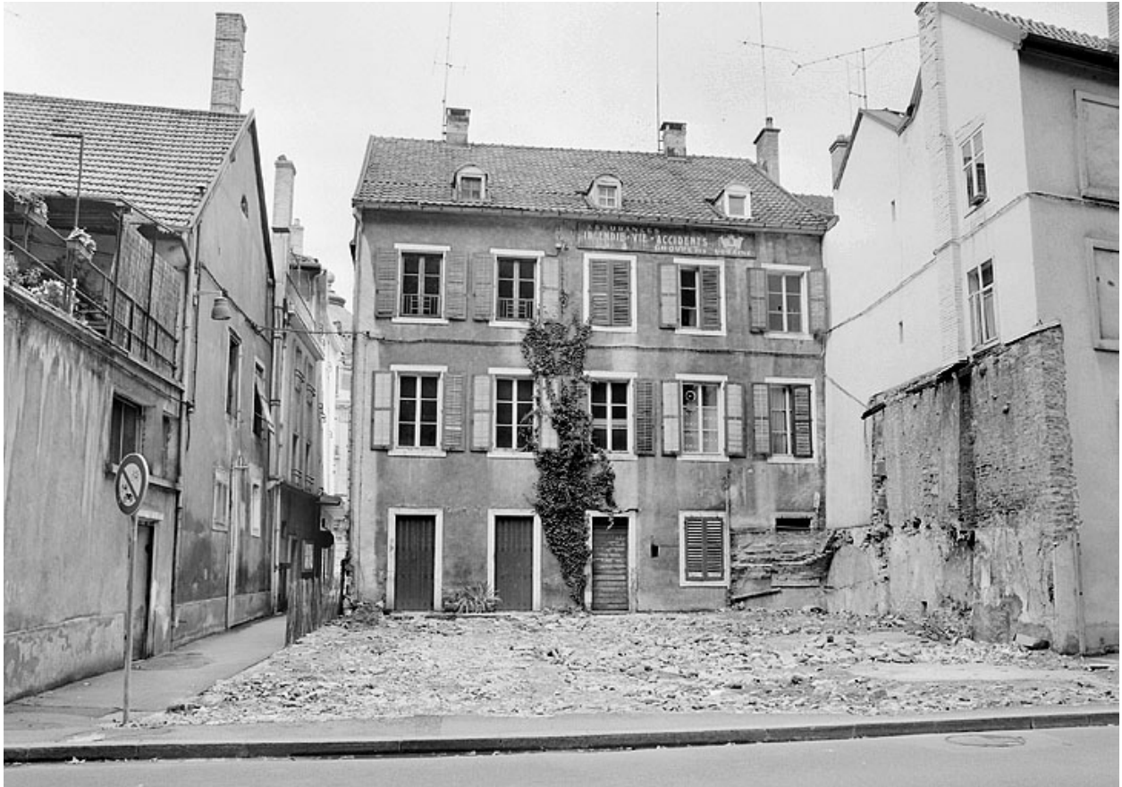
Façade sur jardin.