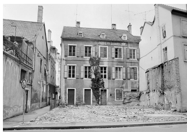
Façade sur jardin.

IVR43_19872500927X