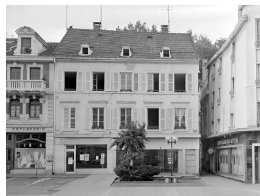
Façade principale. IVR43_19872501092V