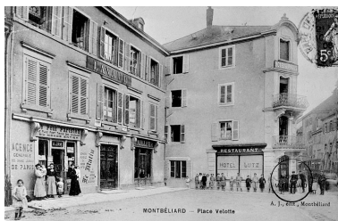
Montbéliard. Place Velotte, entre 1904 et 1908.

IVR43_19862500504V