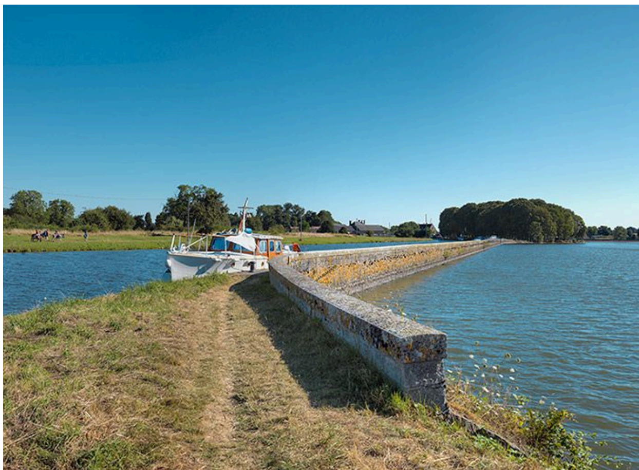
Vue de la digue séparant le canal et l'étang de Baye.