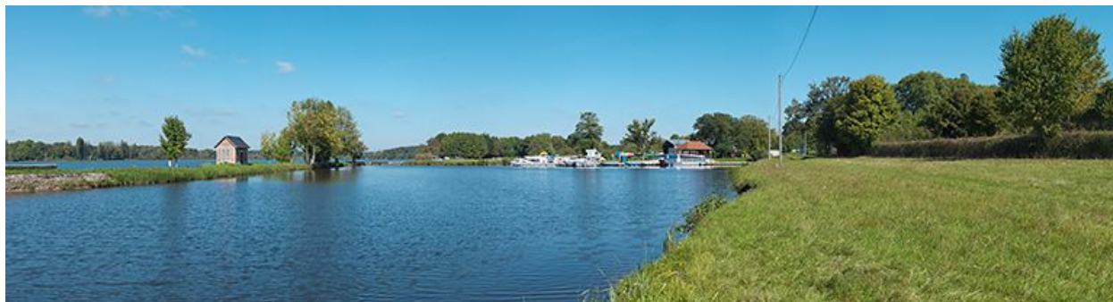
Vue du port : à gauche, sur la digue, la lampisterie et au fond l'écluse de garde.