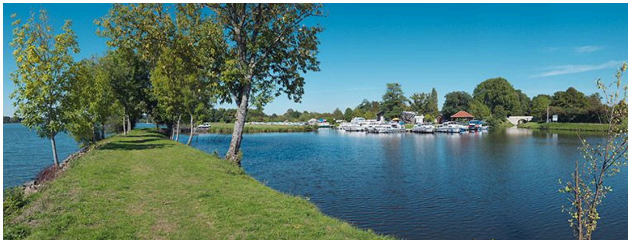
Vue du port depuis la digue avec sur la droite le pont routier des Poujats.