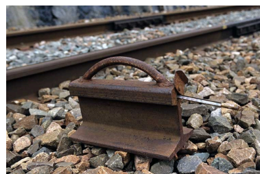
Vue d'ensemble. IVR43_20053900674ZA