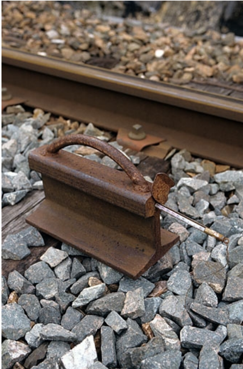
Vue d'ensemble plongeante.