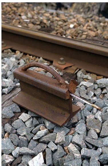
Vue d'ensemble plongeante. IVR43_20053900675ZA