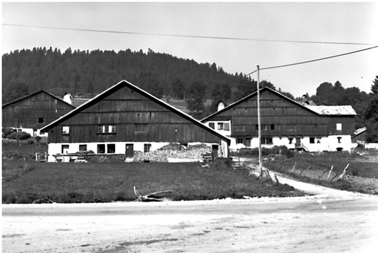
hameau des Cordiers : façades antérieures des fermes.