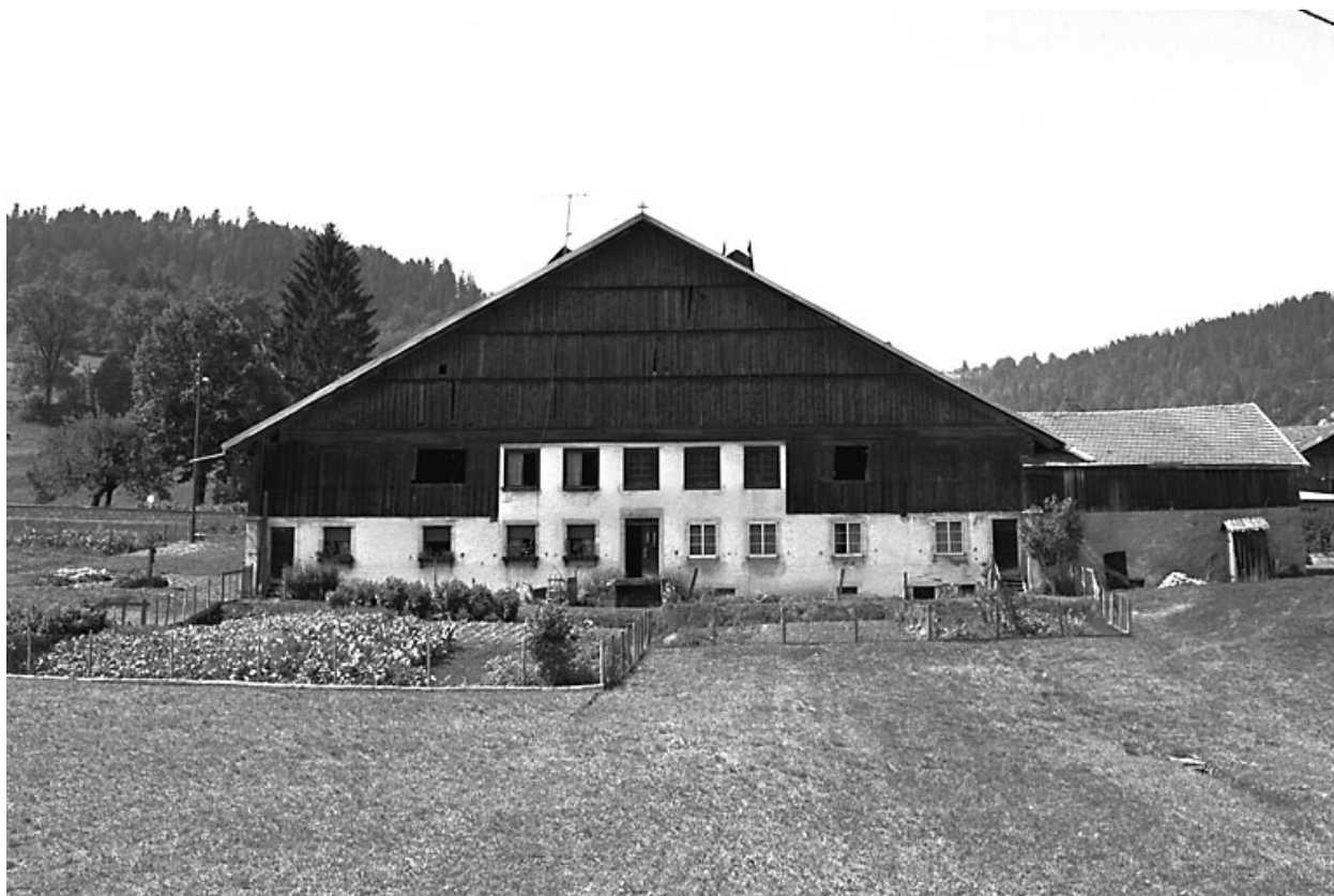
Ferme située au lieu-dit Les Cordiers.