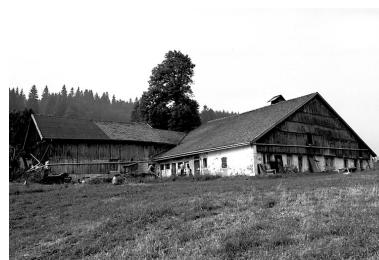
Ferme située au lieu- dit Chauveresche.