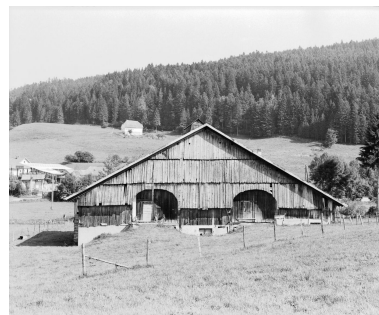
Ferme située au lieudit Cornabey : façade postérieure : deux " levées de grange " et " lambréchure ".