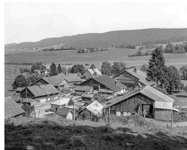
Hameau des Cordiers : façades postérieures des fermes.