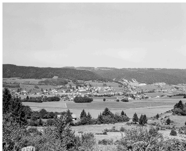
Village vu depuis la route de Chauveresche.