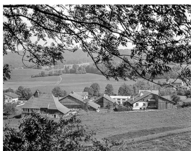
Hameau des Cordiers : façades postérieures des fermes.