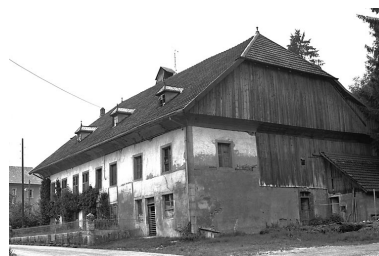
Ferme située en village.