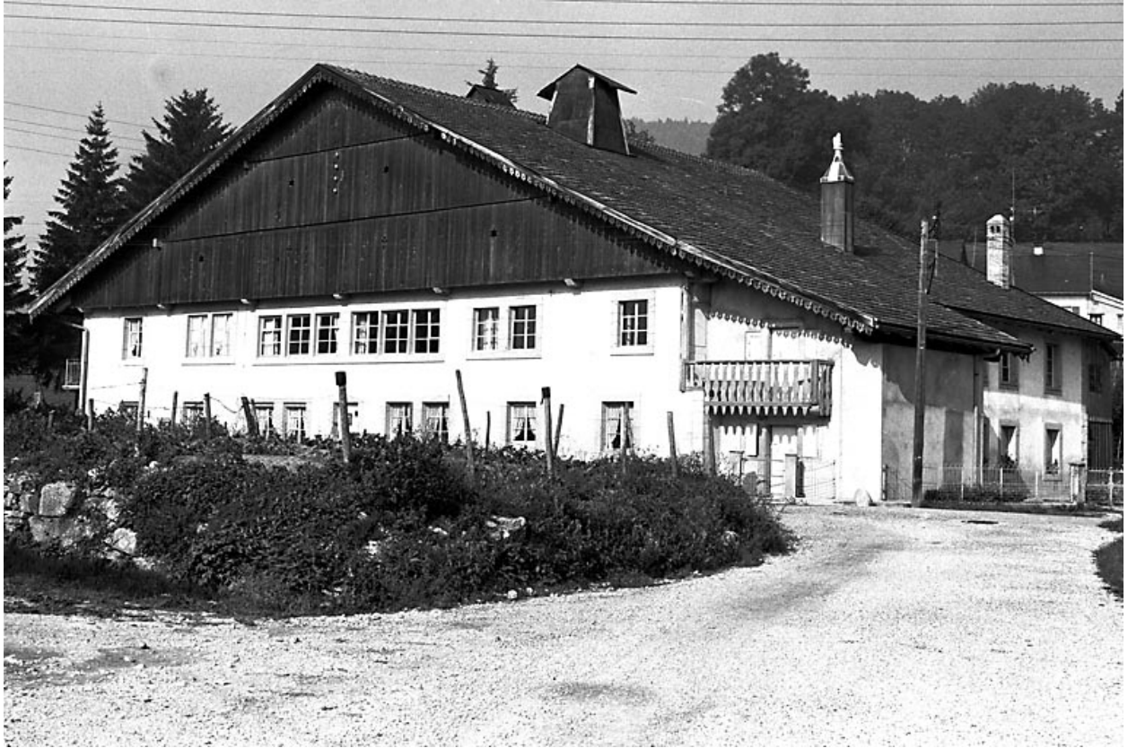
Ferme située en village.