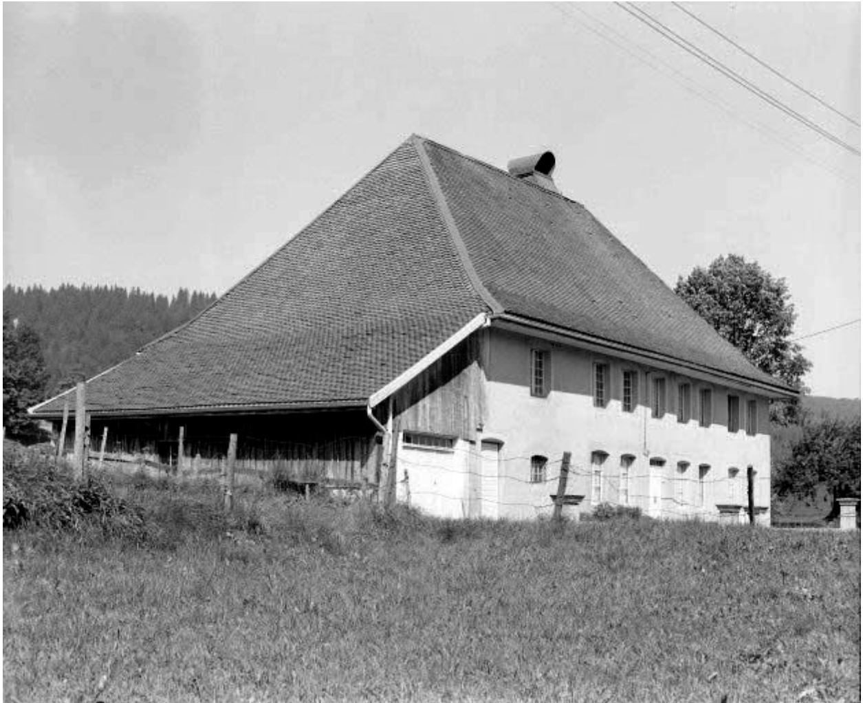
Ferme située au lieu-dit Les Cordiers.