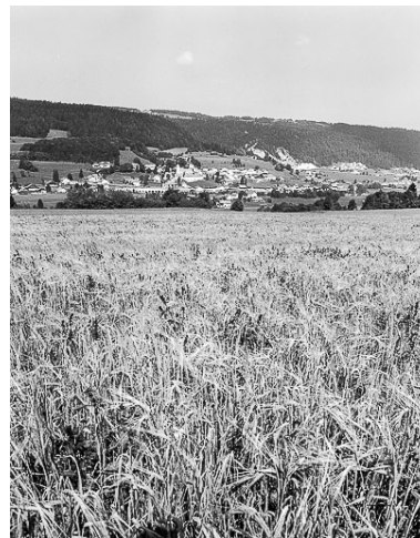
Village vu depuis la route de Chauveresche. IVR43_19762500730X