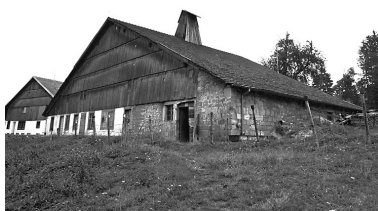
Ferme située au lieu- dit Le Bois du Four. IVR43_19762500628X