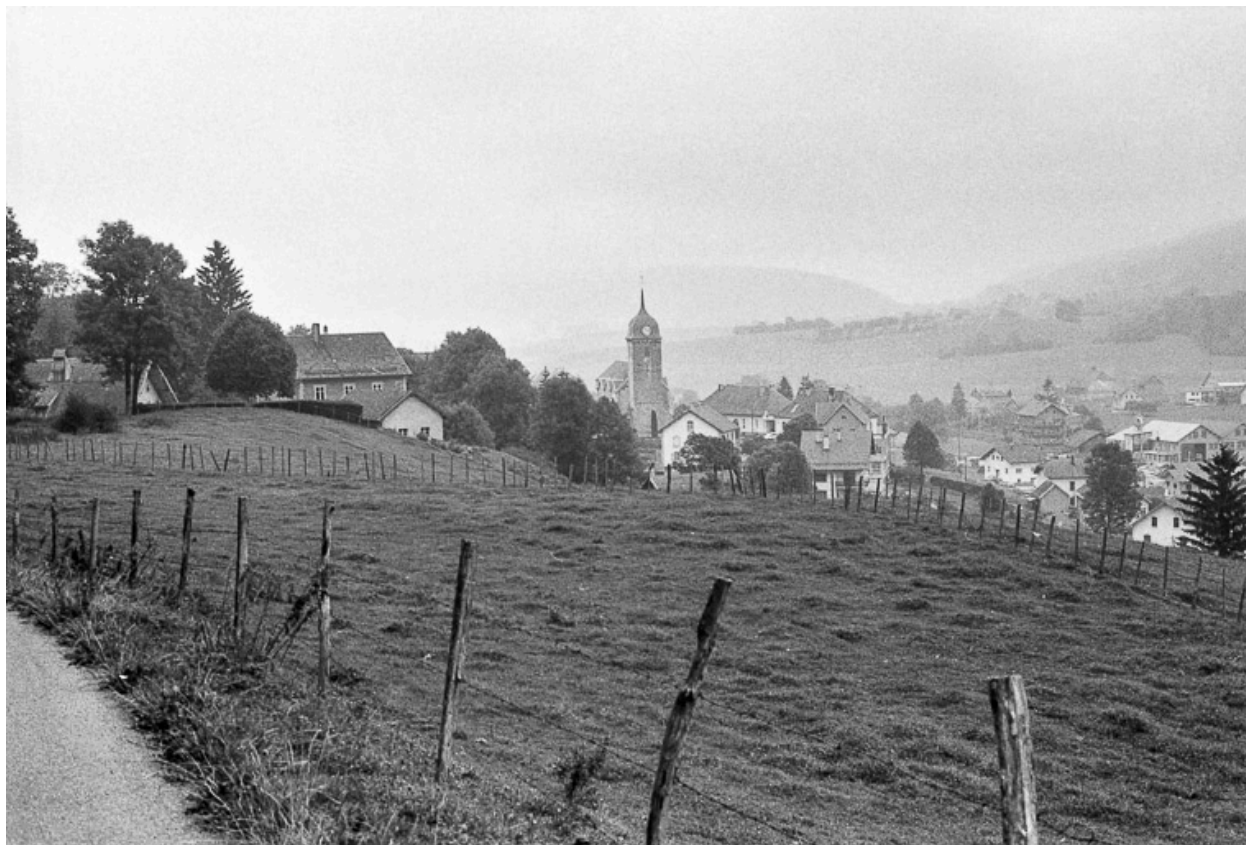
Village vu du sud-ouest.