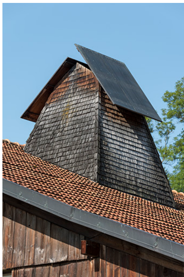
Ferme située au lieu-dit Les Cordiers (cadastre 2018 AD 49) : souche de tué. IVR43_20172501602NUC4A