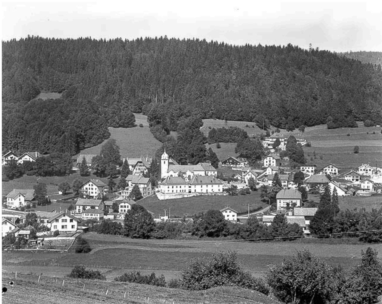
Village vu depuis Morestans.