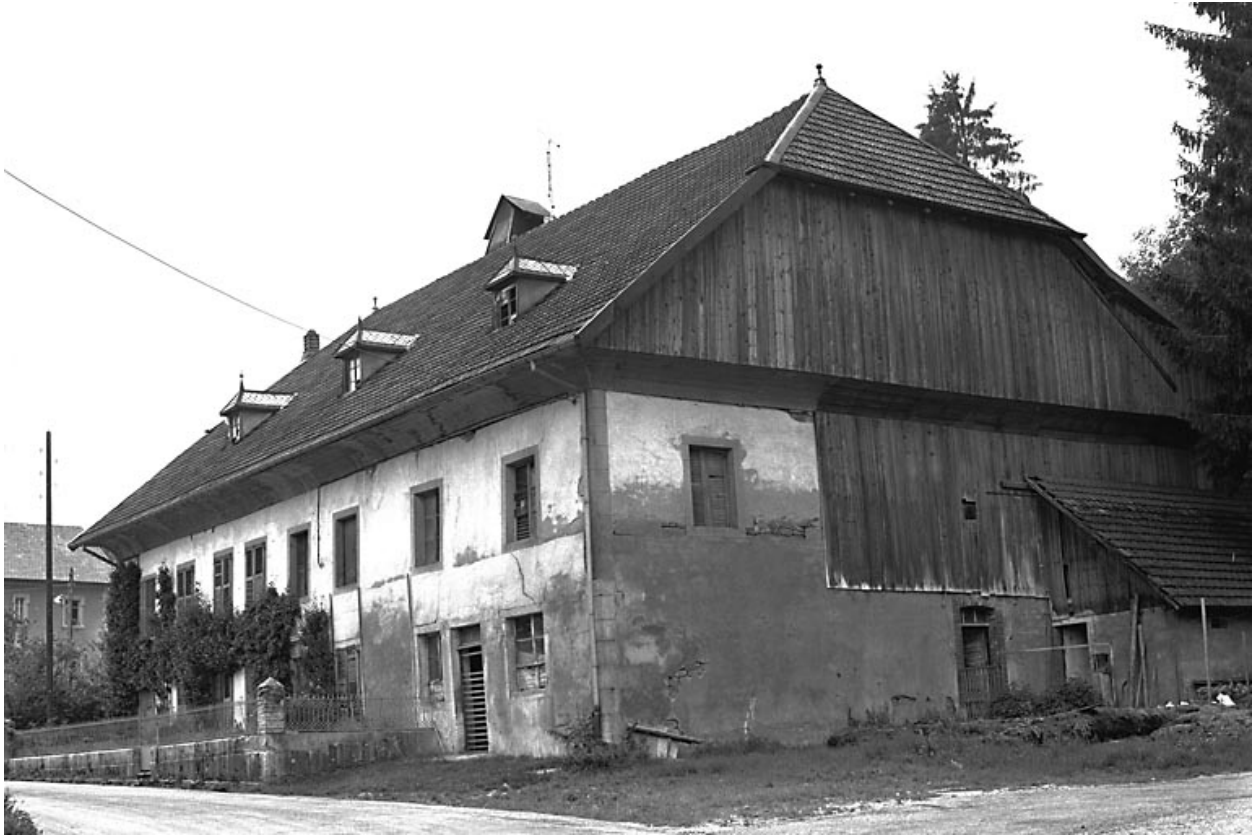
Ferme située en village.