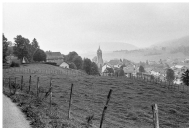
Village vu du sud-ouest. IVR43_19742500692Z