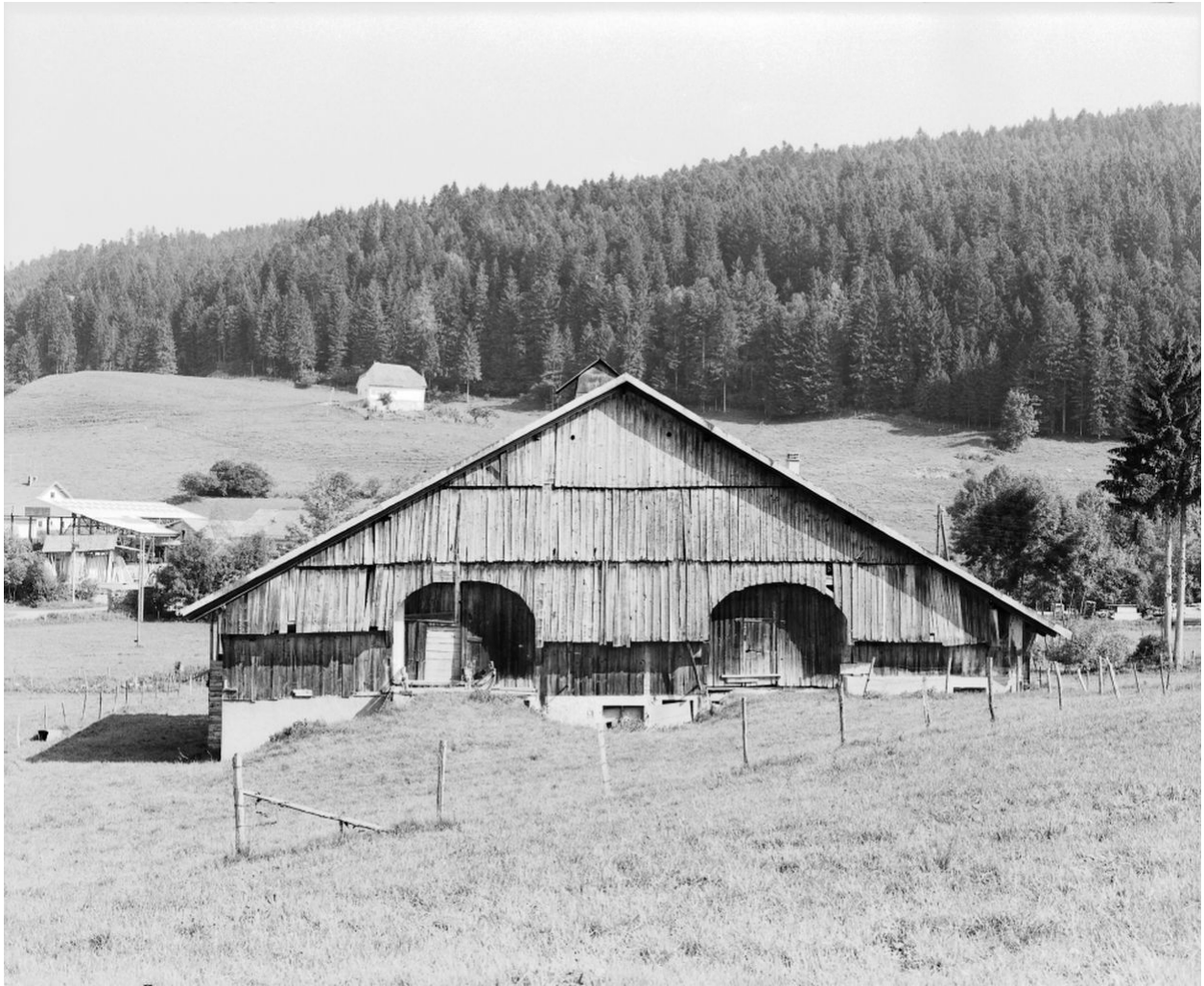
Ferme située au lieudit Cornabey : façade postérieure : deux " levées de grange " et " lambréchure ".