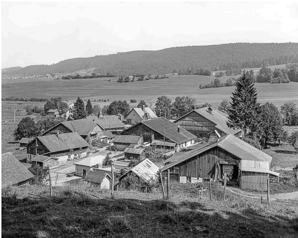
Hameau des Cordiers : façades postérieures des fermes.