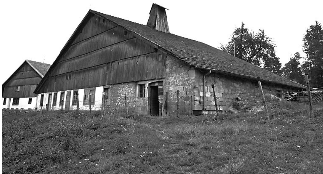
Ferme située au lieu-dit Le Bois du Four.