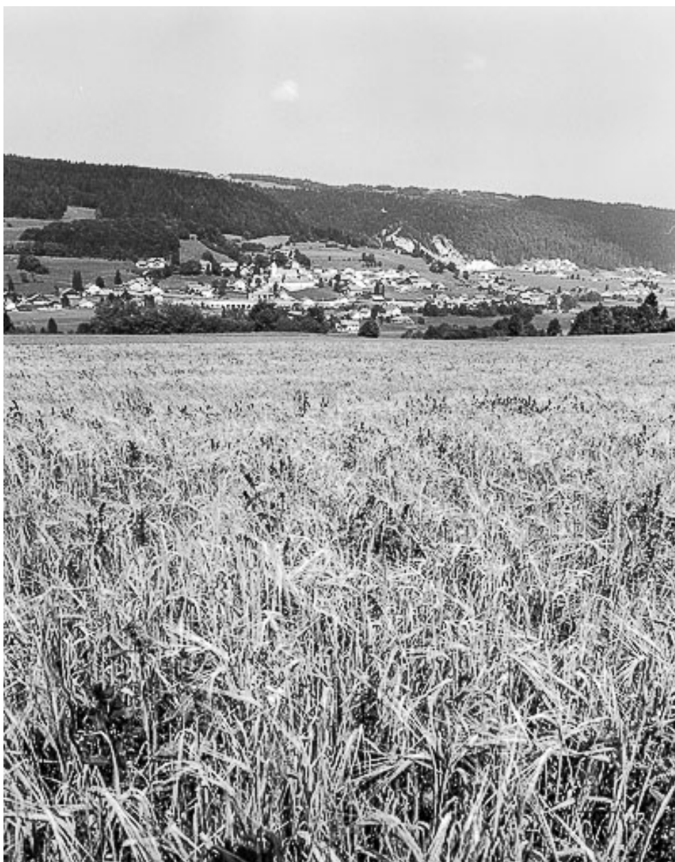
Village vu depuis la route de Chauveresche.