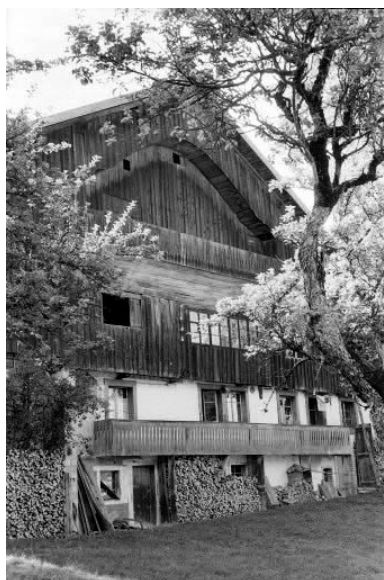
Ferme située au lieu-dit Cornabey.