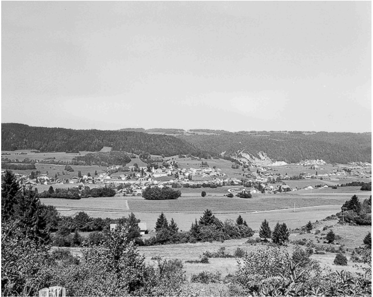
Village vu depuis la route de Chauveresche.