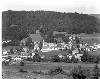
Village vu depuis Morestans.