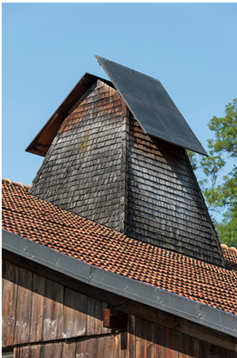
Ferme située au lieu-dit Les Cordiers (cadastre 2018 AD 49) : souche de tué.