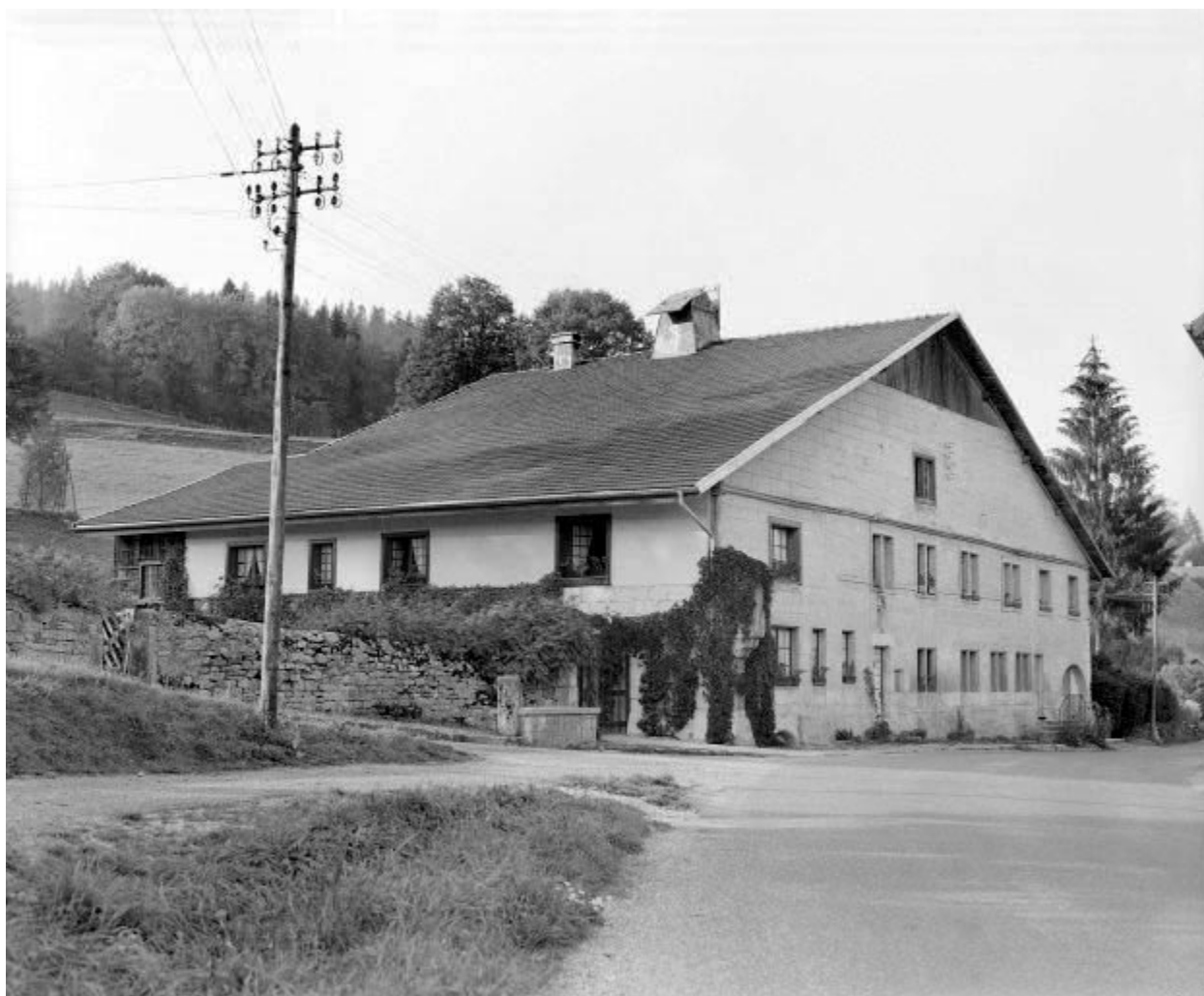
Ferme située en village.