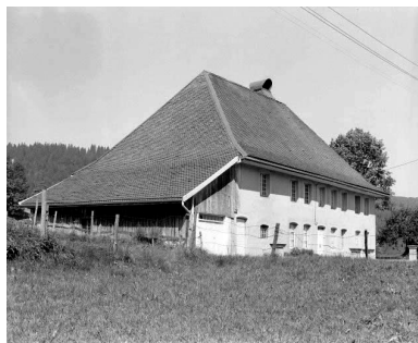
Ferme située au lieu-dit Les Cordiers. IVR43_19762500651X