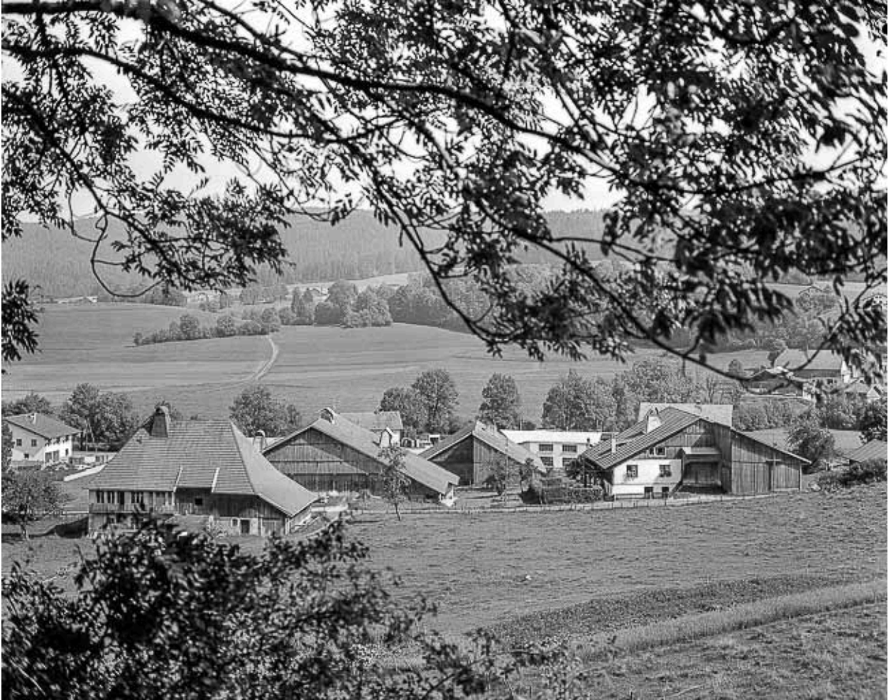
Hameau des Cordiers : façades postérieures des fermes.