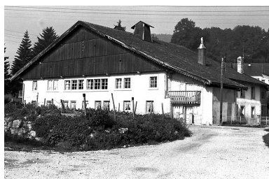
Ferme située en village.