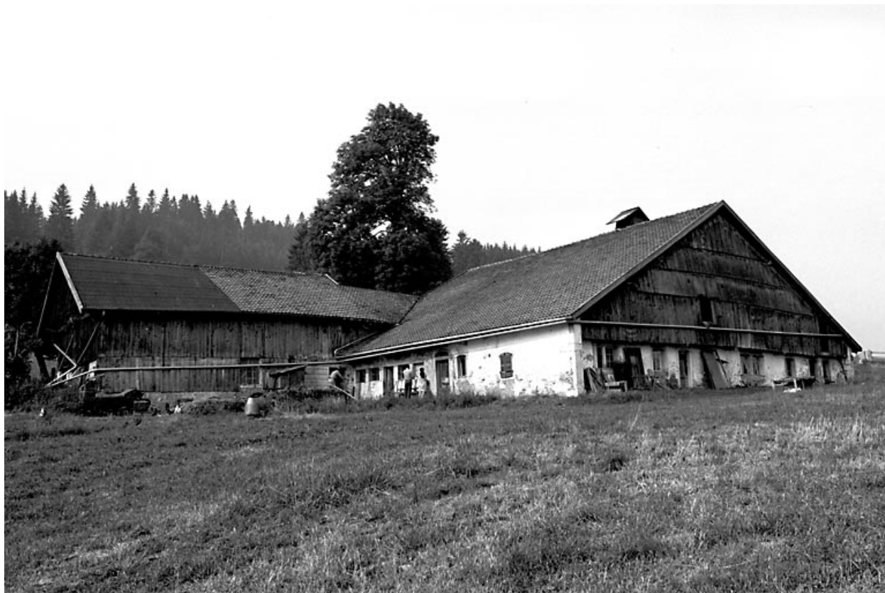
Ferme située au lieu-dit Chauveresche.