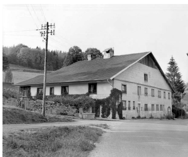
Ferme située en village.