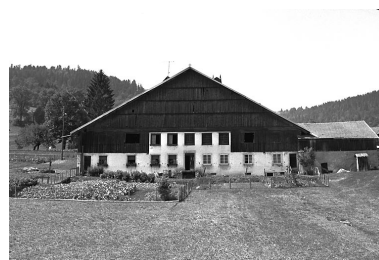
Ferme située au lieu-dit Les Cordiers.