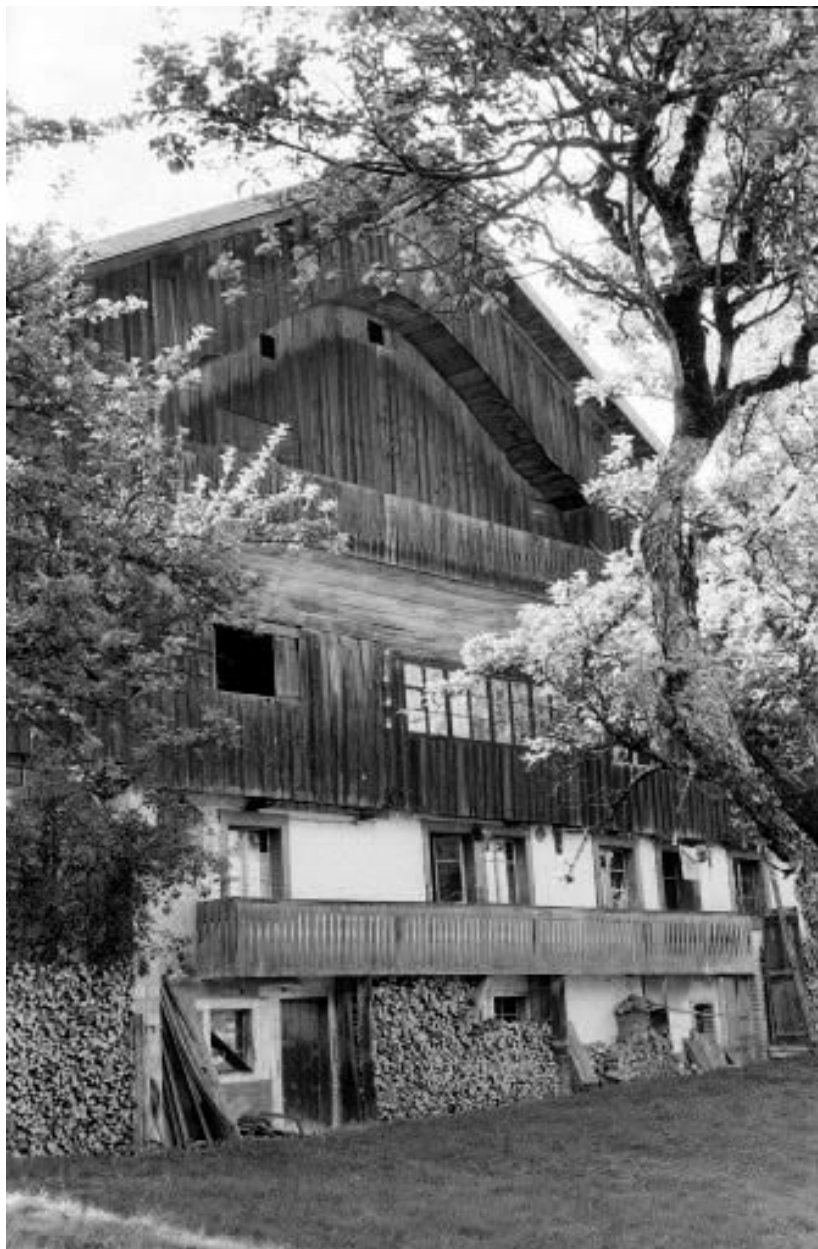
Ferme située au lieu-dit Cornabey.