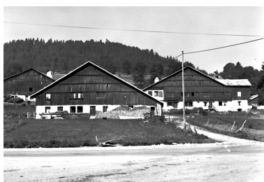
hameau des Cordiers : façades antérieures des fermes.