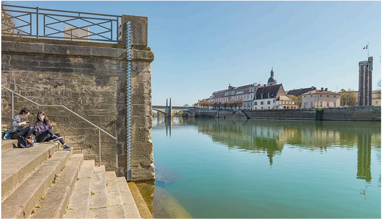
Le quai de l'Hôpital, vu depuis le port Villiers, rive droite.