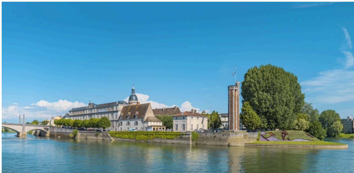
Le quai vu depuis la rive droite.