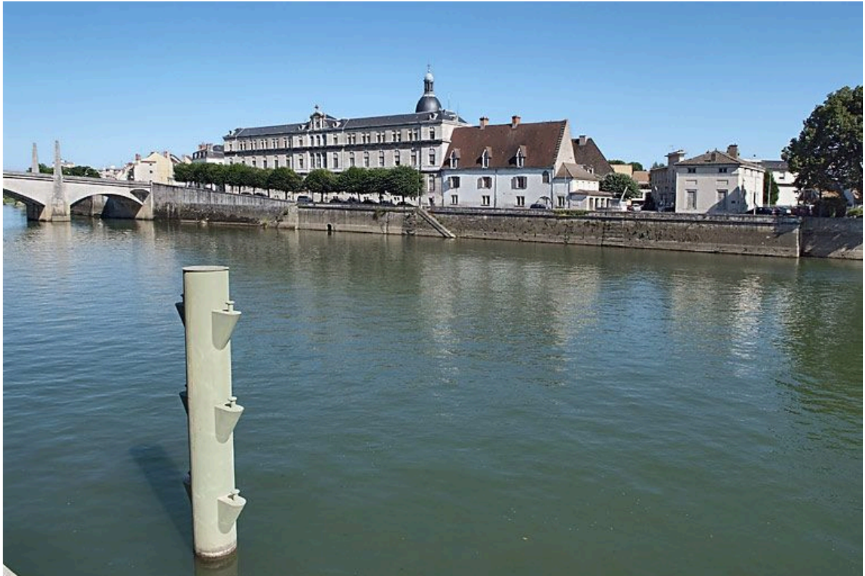
Le quai vu d'aval et depuis la rive droite en 2008.