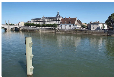
Le quai vu d'aval et depuis la rive droite en 2008. IVR26_20087100346NUC2A