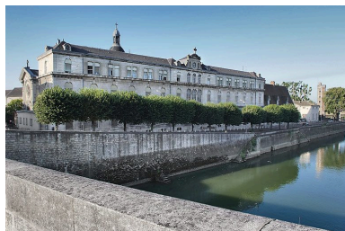
Le quai vu depuis le pont Saint-Laurent en 2008.