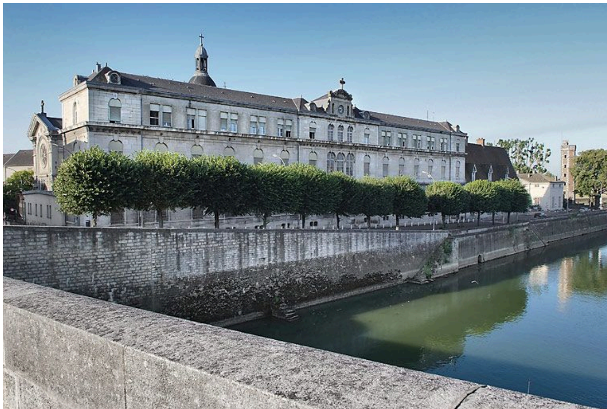
Le quai vu depuis le pont Saint-Laurent en 2008.