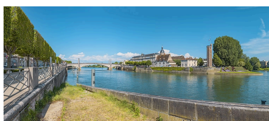
Vue d'ensemble du quai depuis la rive droite. Au premier plan, la rampe du quai des Messageries.