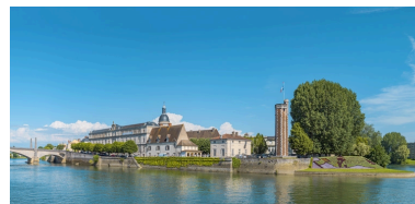
Le quai vu depuis la rive droite. IVR26_20217100267NUC4A