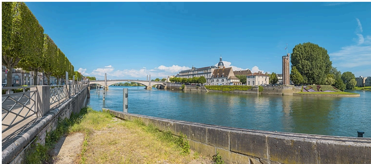
Vue d'ensemble du quai depuis la rive droite. Au premier plan, la rampe du quai des Messageries.