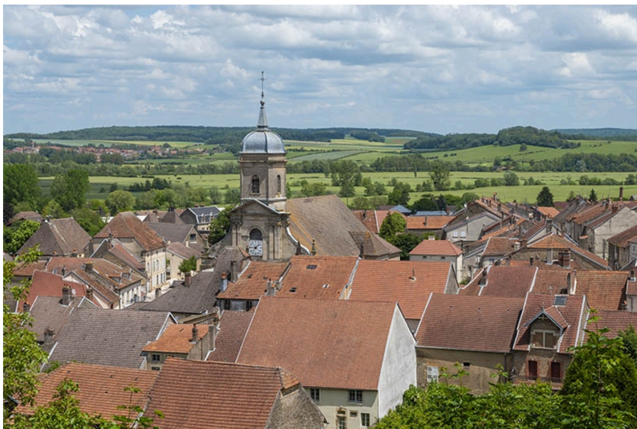
Vue du village dans son paysage, depuis le sud-ouest.