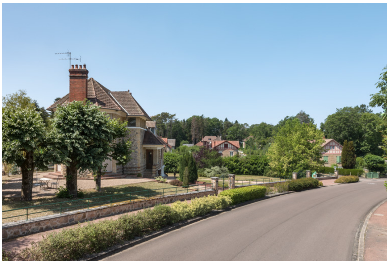
Avenue Eugène Collin.