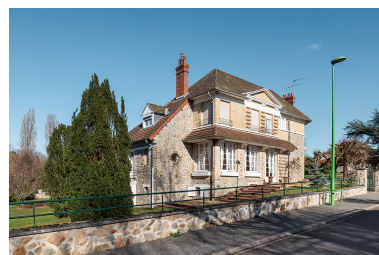
Façade sud-ouest. IVR26_20205800293NUC4A