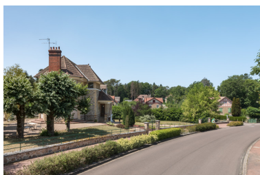
Avenue Eugène Collin.