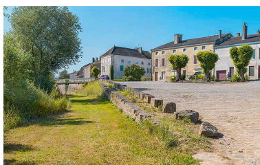
Les quais vus d'aval. IVR26_20207100214NUC4A