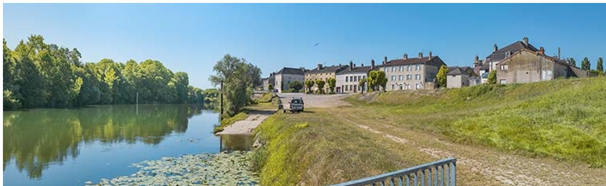
Quais et port vus d'aval.