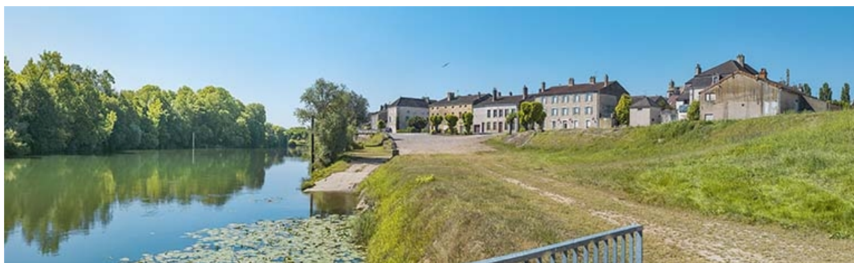
Quais et port, avec rampe d'accès, vus d'aval.