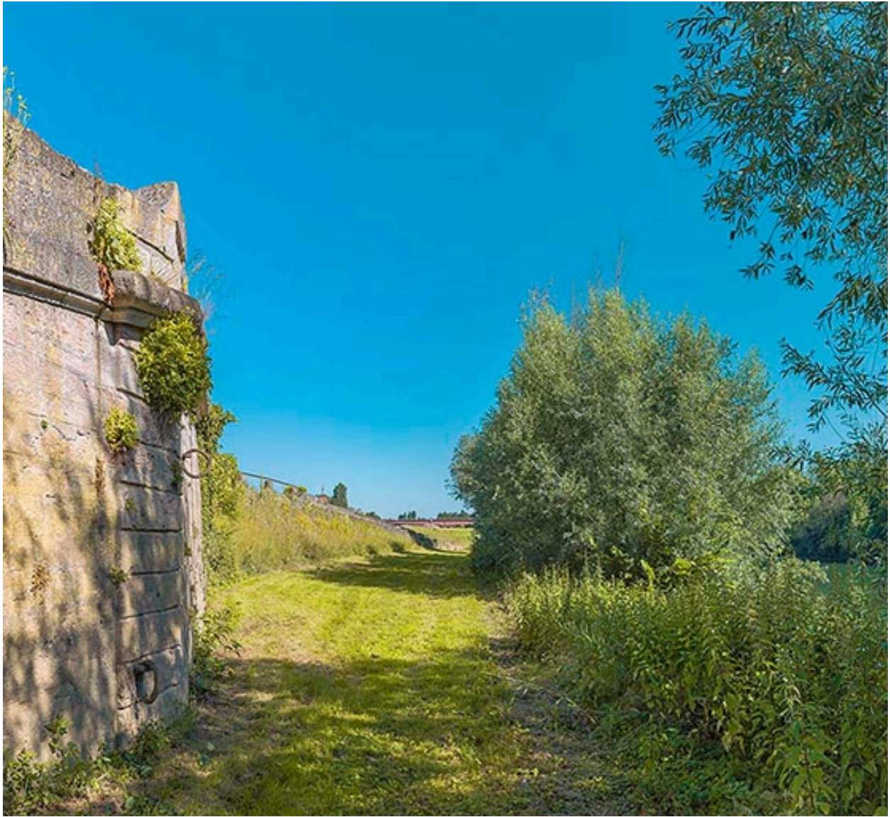
Les quais, en direction du pont de Bragny.