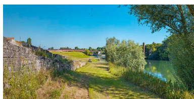
Quais et port de Verdun. Le pont de Bragny en arrière-plan. IVR26_20207100210NUC4A