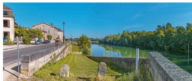
Quais de Verdun : la double rampe. IVR26_20207100207NUC4A