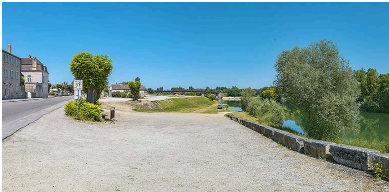
Le port de Verdun : rampe d'accès et escaliers de service.