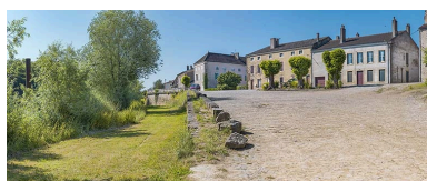
Les quais vus d'aval. IVR26_20207100213NUC4A