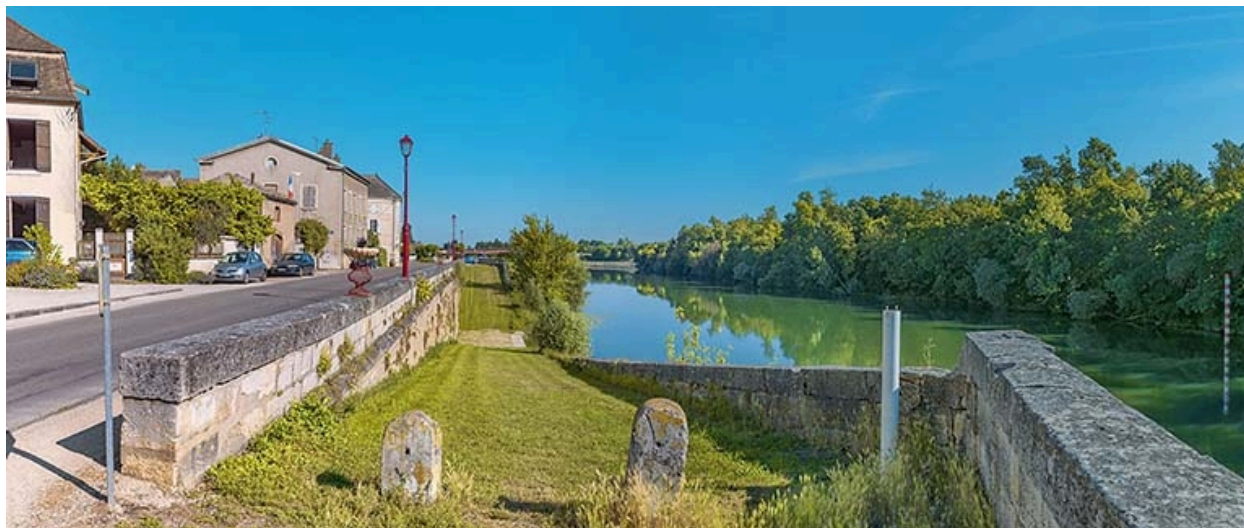
Quais de Verdun : la double rampe.