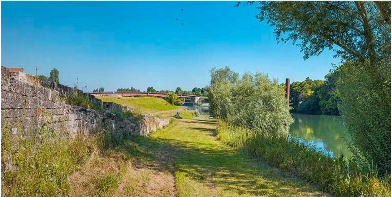
Quais et port de Verdun. Le pont de Bragny en arrière-plan.