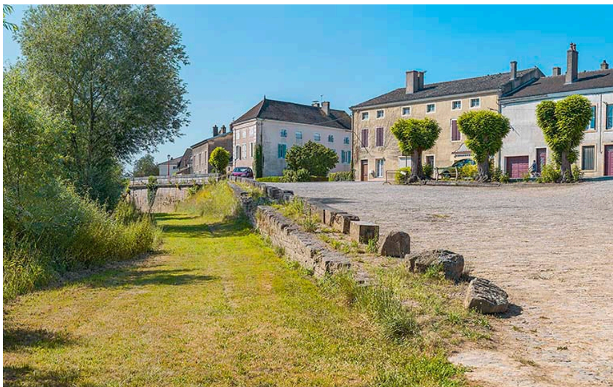
Les quais vus d'aval.