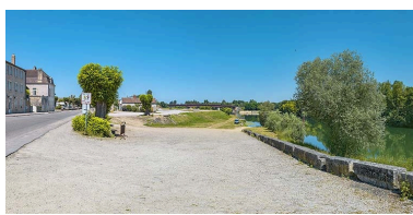
Le port de Verdun : rampe d'accès et escaliers de service. IVR26_20207100211NUC4A