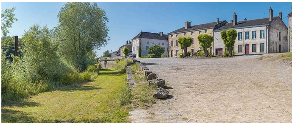
Les quais vus d'aval.