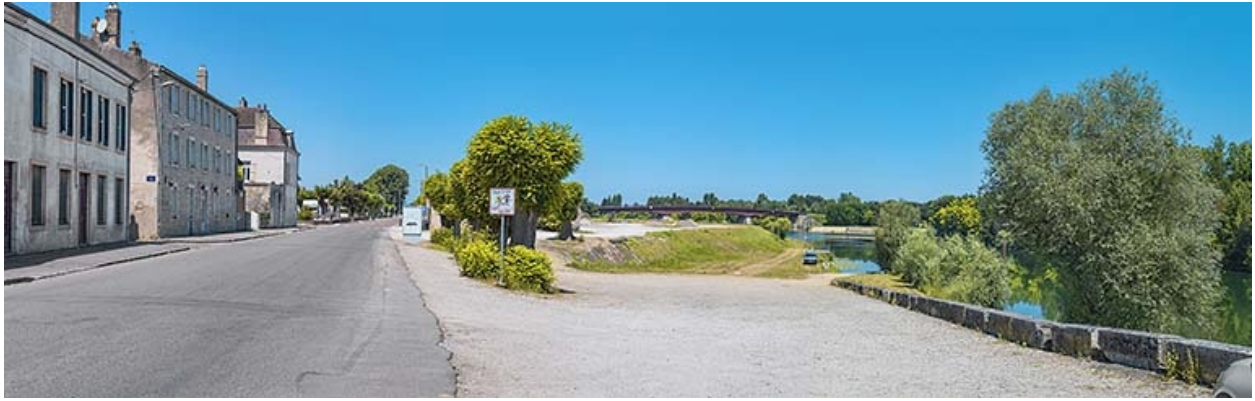
Le port de Verdun : rampe d'accès et escaliers de service.