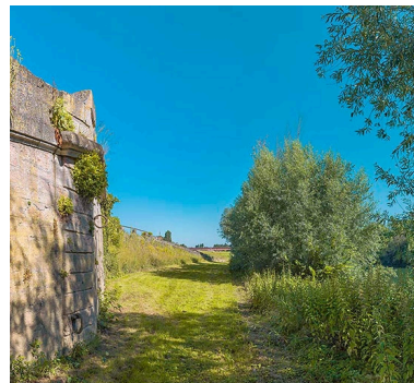
Les quais, en direction du pont de Bragny. IVR26_20207100209NUC4A