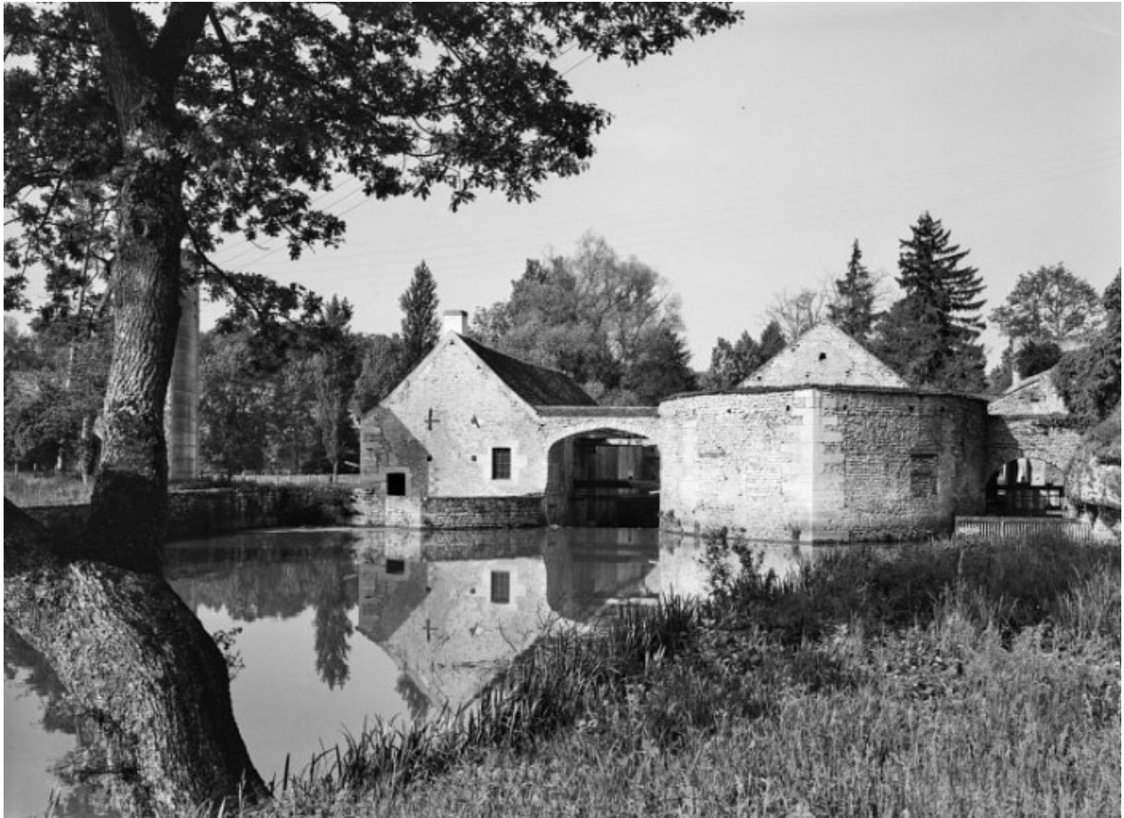
Vue prise du bief d'amont : à gauche la fenderie, à droite la forge.