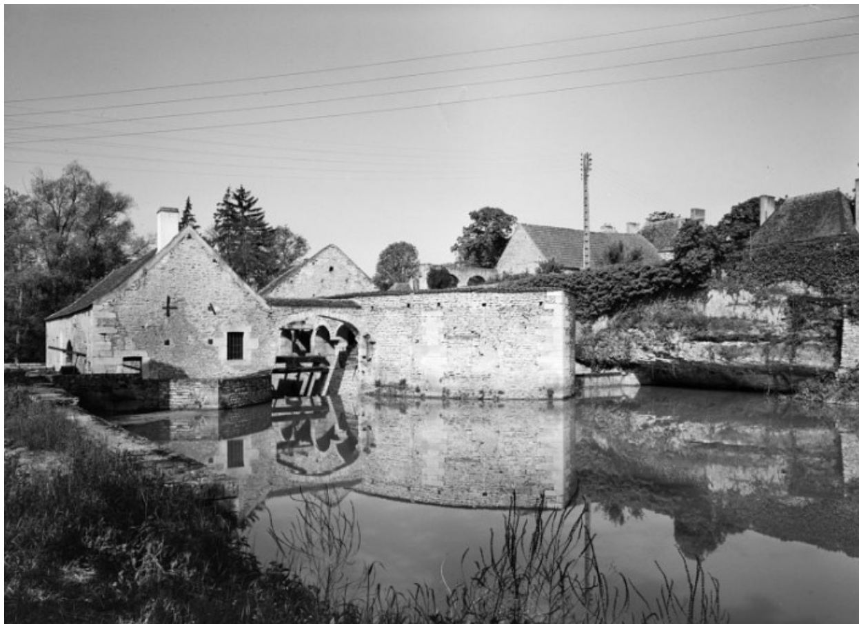
Vue prise du bief d'amont : à gauche la fenderie, à droite la forge.