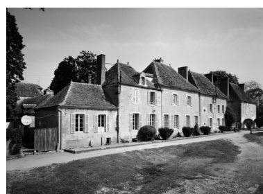
Chapelle et logis du maître de forges, élévation est.