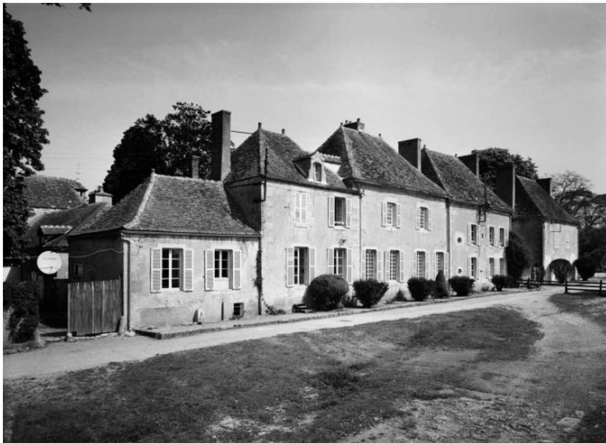
Chapelle et logis du maître de forges, élévation est.