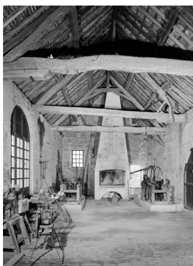
Bâtiment de la fenderie, vue intérieure prise du sud.