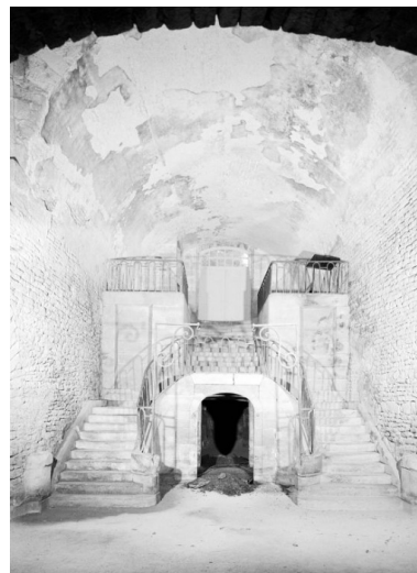
Haut fourneau, escalier d'honneur vu depuis la halle de coulée. IVR26_19932100922V