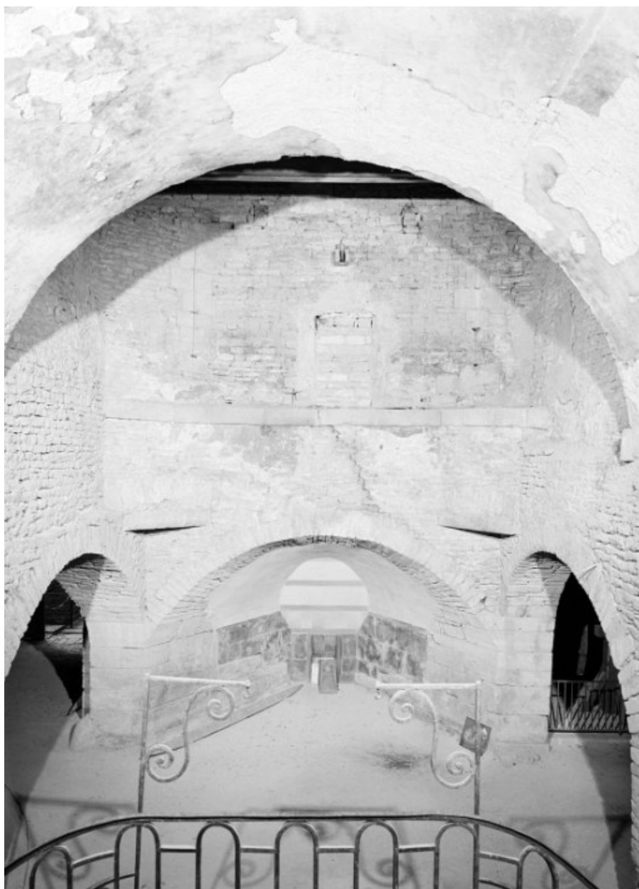
Haut fourneau, halle de coulée, vue prise de l'escalier d'honneur.