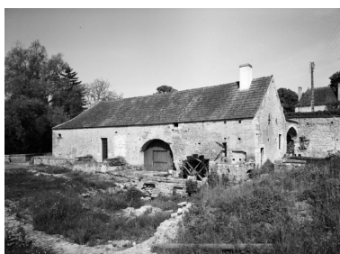
Bâtiment de la fenderie, élévation est.