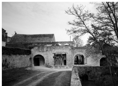
Elévation sud de l'usine prise de la rampe d'accès.