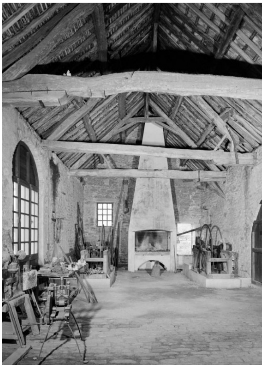
Bâtiment de la fenderie, vue intérieure prise du sud.