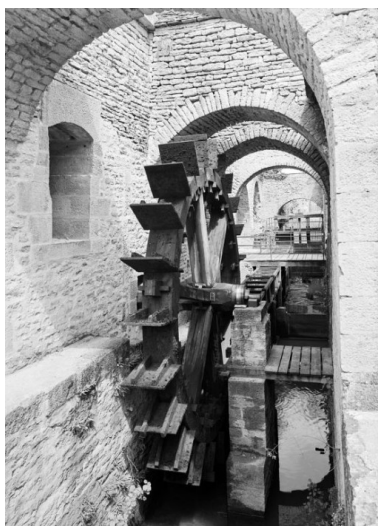
Haut fourneau, roue hydraulique reconstituée.