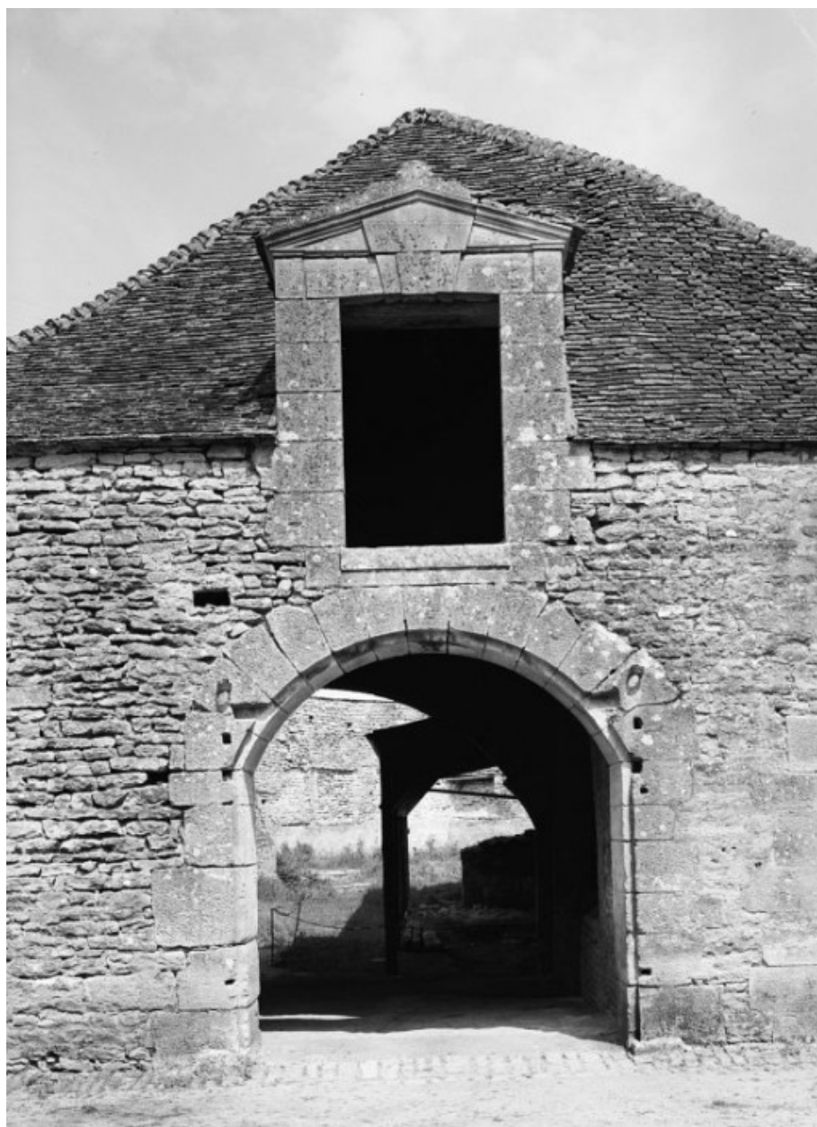
Entrée du bâtiment de la forge d'affinerie, élévation sud.