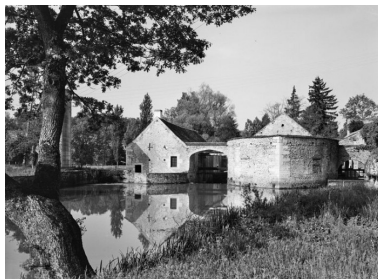
Vue prise du bief d'amont : à gauche la fenderie, à droite la forge. IVR26_19932100894V