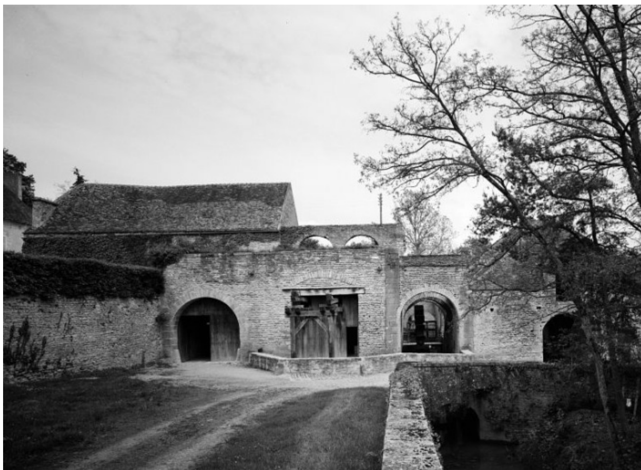
Elévation sud de l'usine prise de la rampe d'accès.