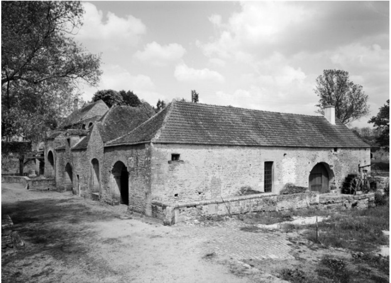
Bâtiment de la fenderie, vue prise du sud-est.