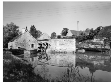
Vue prise du bief d'amont : à gauche la fenderie, à droite la forge.