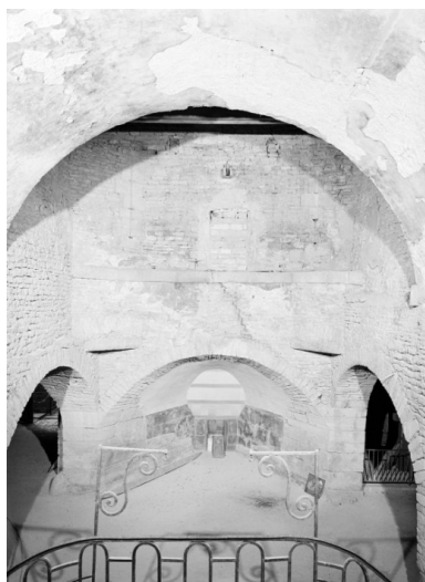
Haut fourneau, halle de coulée, vue prise de l'escalier d'honneur.