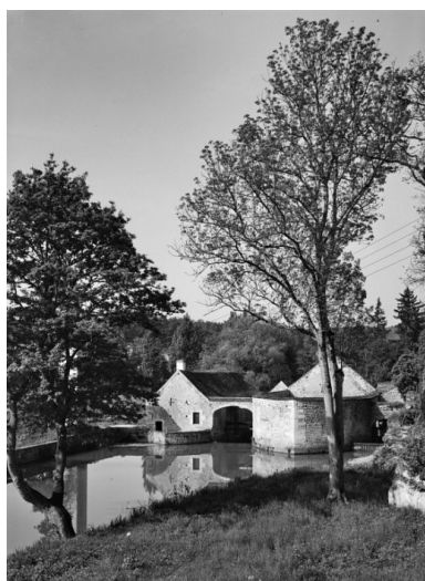
Vue prise du bief d'amont : à gauche la fenderie, à droite la forge.