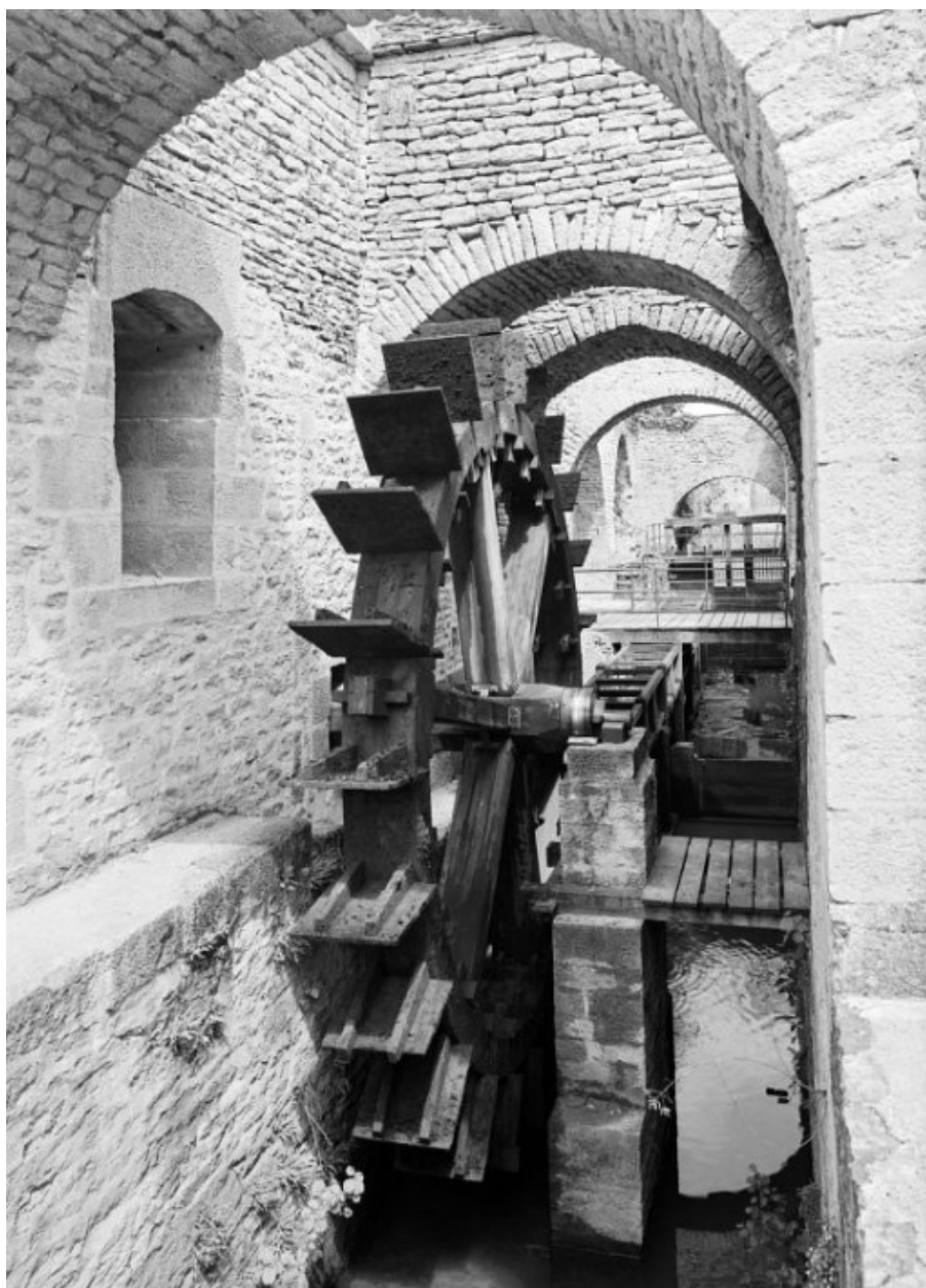
Haut fourneau, roue hydraulique reconstituée.