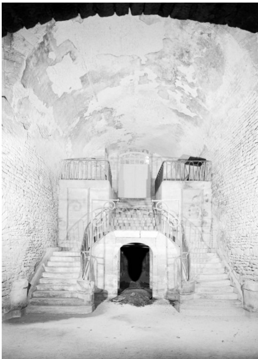
Haut fourneau, escalier d'honneur vu depuis la halle de coulée.