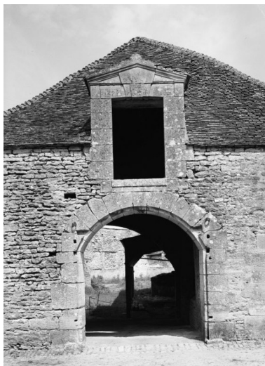
Entrée du bâtiment de la forge d'affinerie, élévation sud.