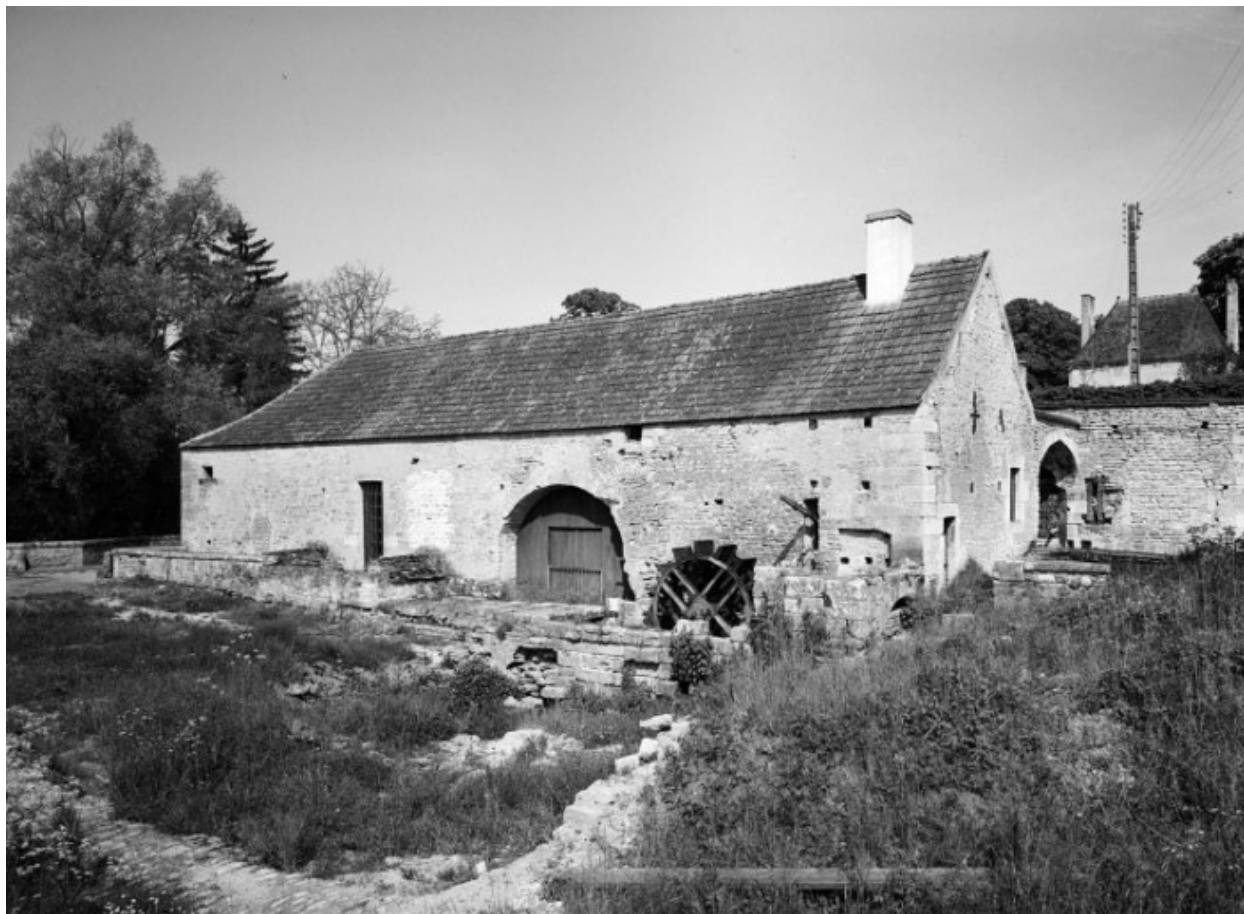
Bâtiment de la fenderie, élévation est.