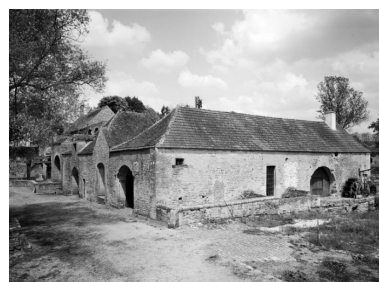
Bâtiment de la fenderie, vue prise du sud-est. IVR26_19932100900V