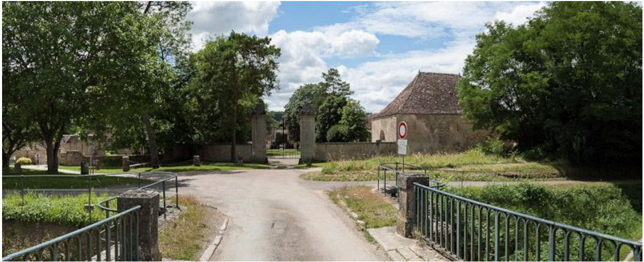
Entrée des forges.