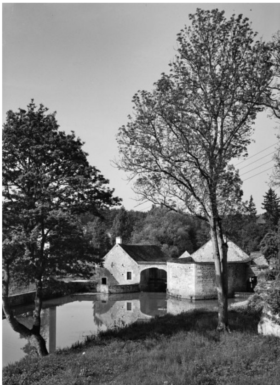
Vue prise du bief d'amont : à gauche la fenderie, à droite la forge.