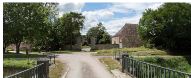
Entrée des forges. IVR26_20122101982NUC4AQ