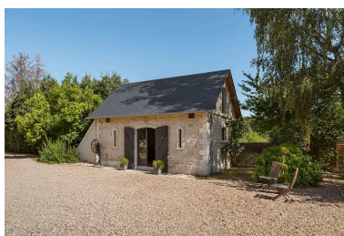
Dépendance (remise-écurie) côté nord.

Phot. Pierre-Marie Barbe-Richaud IVR26_20205800531NUC4A