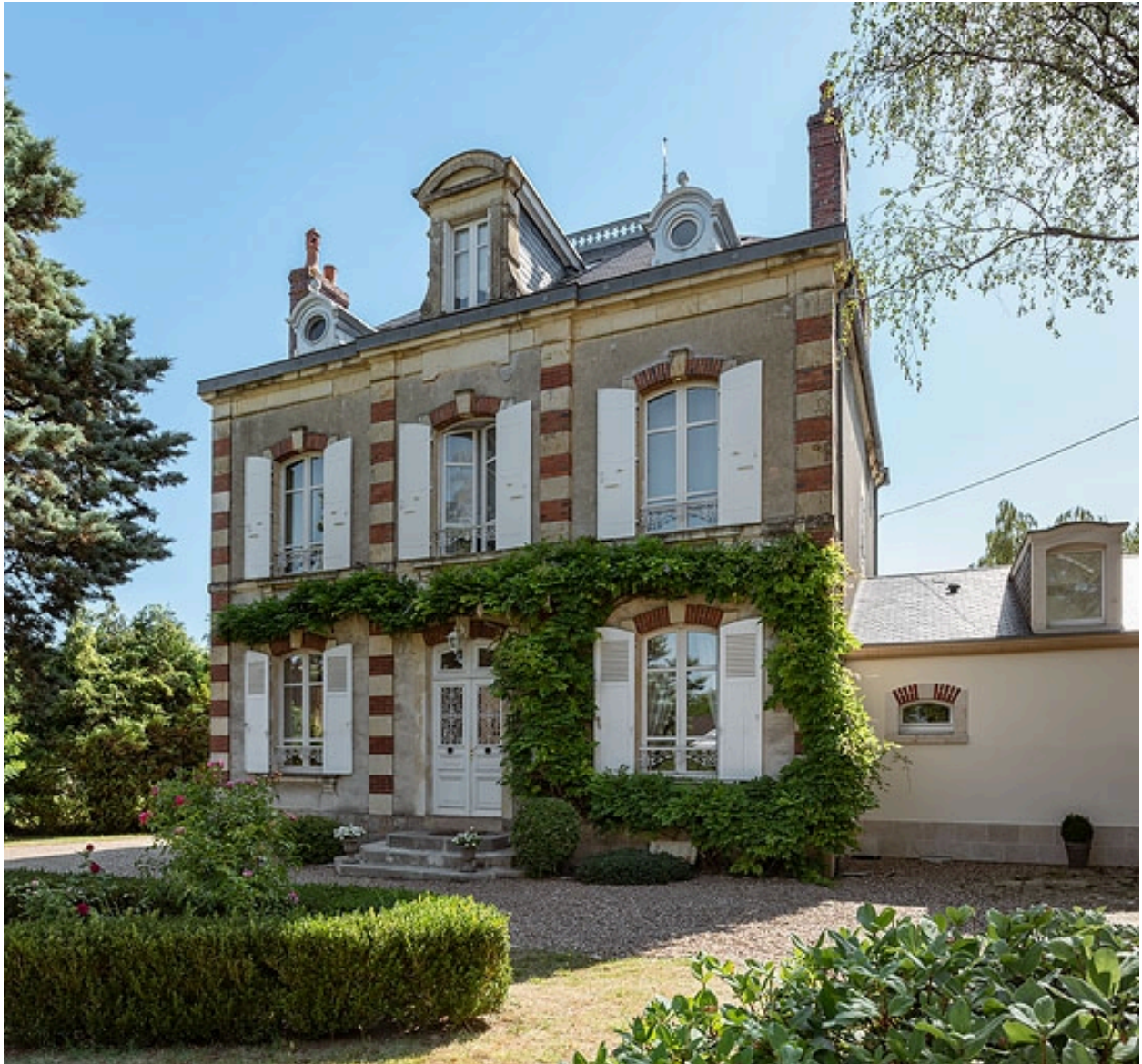
Façade sur l'avenue.