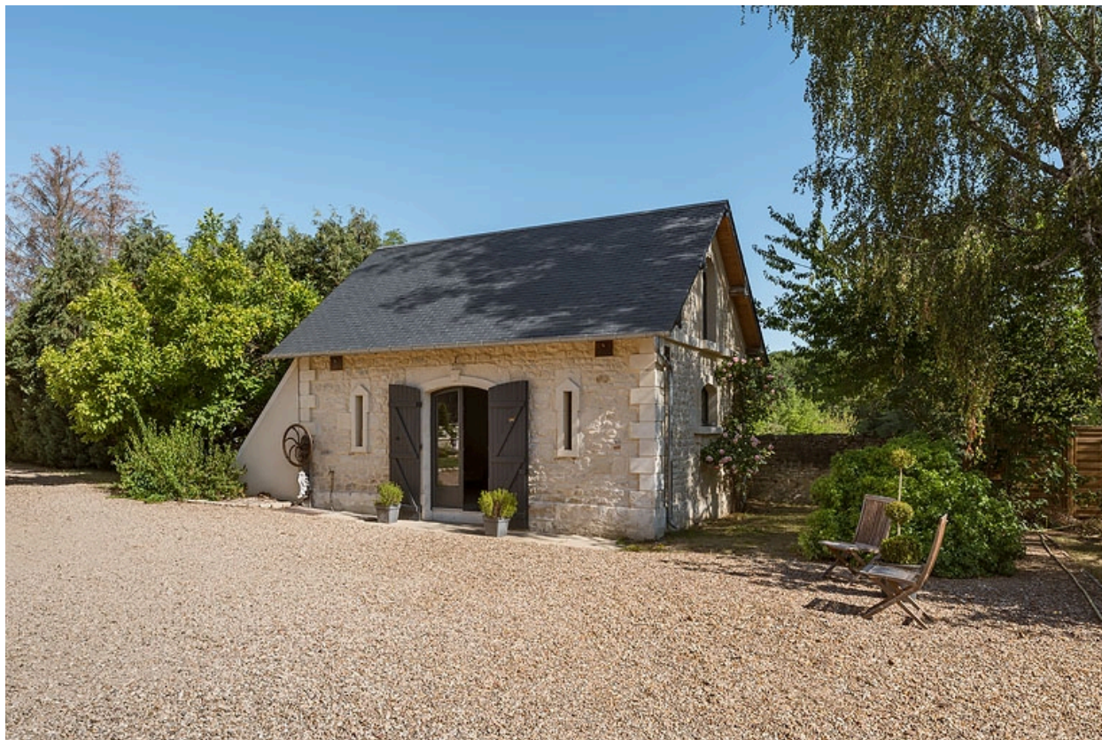
Dépendance (remise-écurie) côté nord.