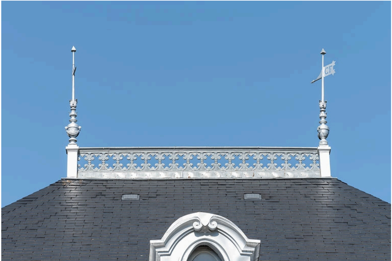
Crête et épis de faîtage.