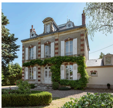
Façade sur l'avenue.