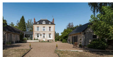
Façade sur le jardin. IVR26_20205800530NUC4AQ