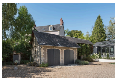
Dépendance (remise-écurie) côté sud.

IVR26_20205800533NUC4A