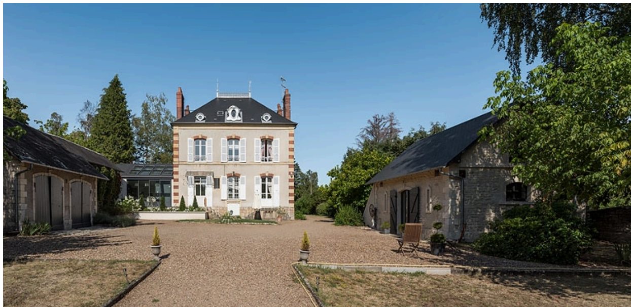
Façade sur le jardin.