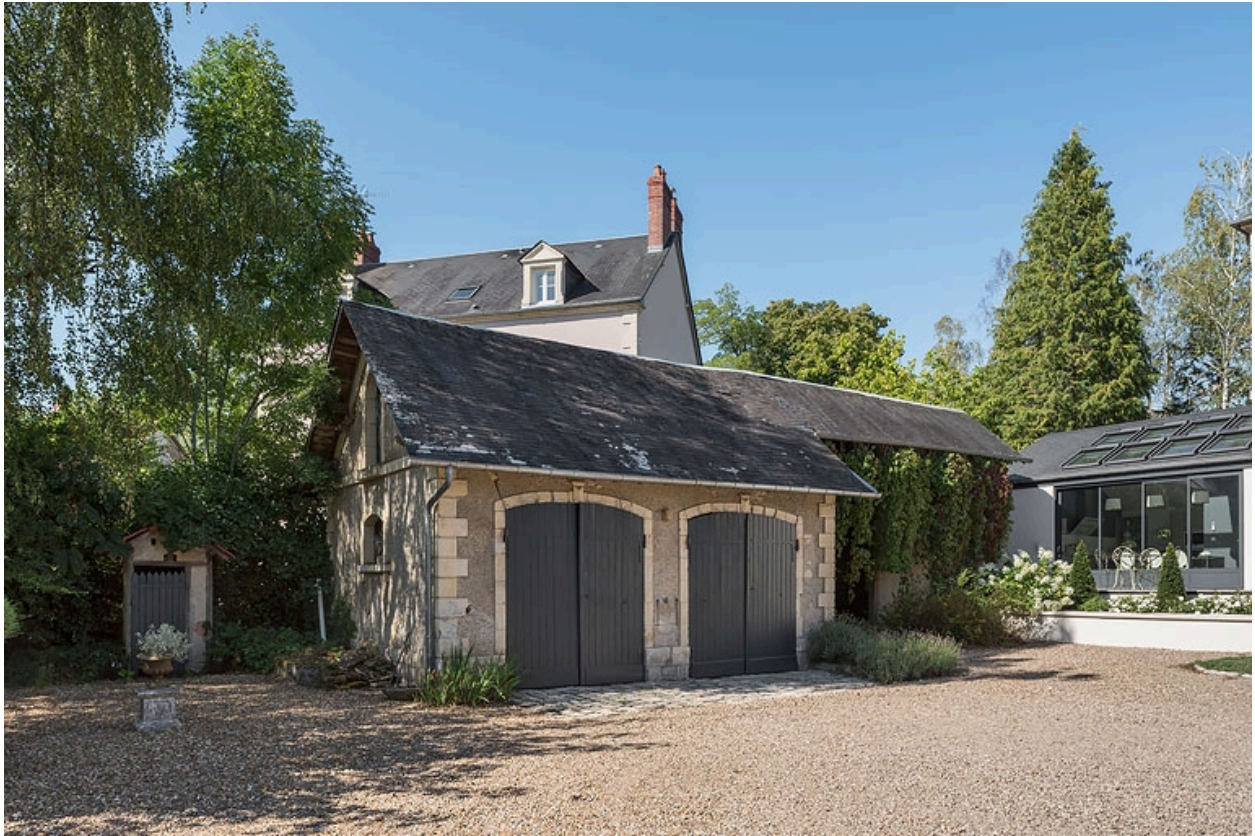
Dépendance (remise-écurie) côté sud.