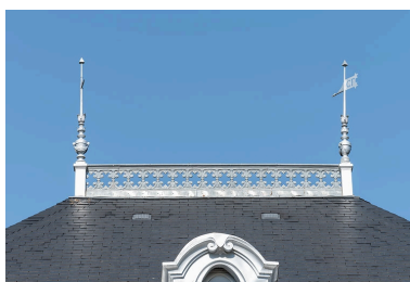
Crête et épis de faîtage.

Phot. Pierre-Marie Barbe-Richaud IVR26_20205800534NUC4A