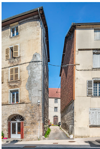
Entrée de la cour depuis la rue de la Liberté.