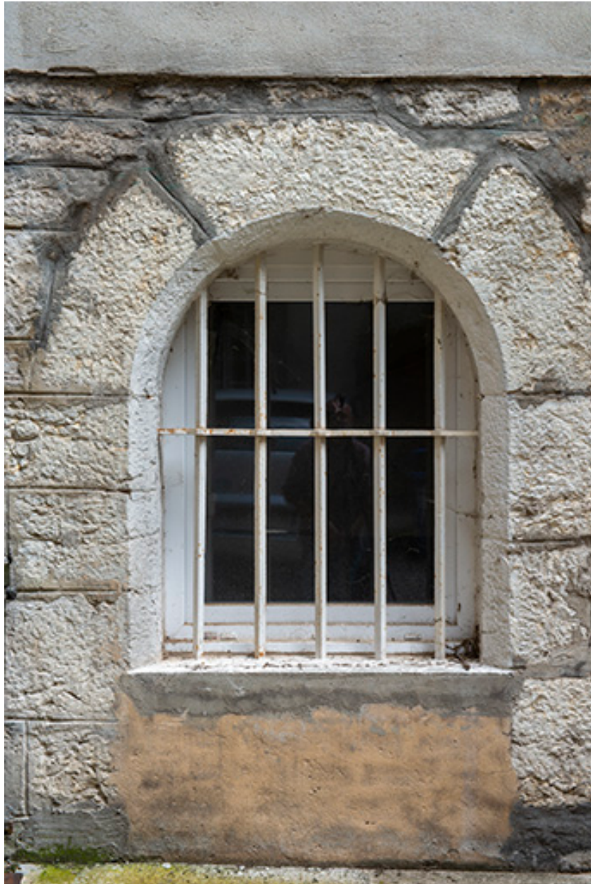
Façade est. Baie en plein-cintre du rez-de-chaussée.