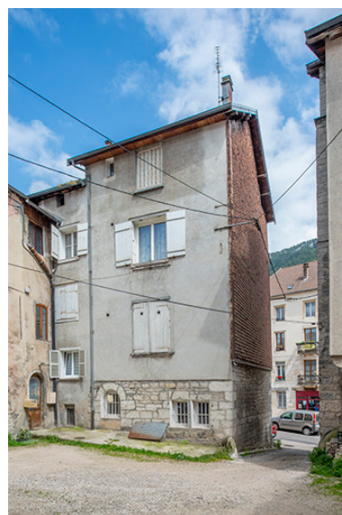
Vue d'ensemble depuis le sud-ouest. IVR43_20233900445NUC4A