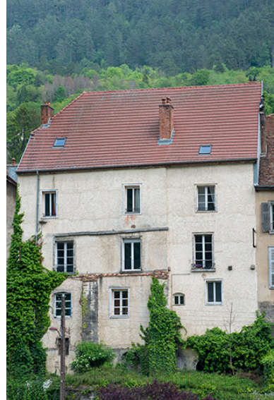
Façade ouest (n°3).