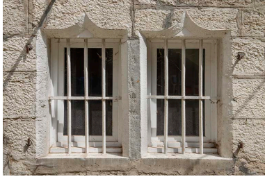
Façade est. Ouvertures du rez-de-chaussée. IVR43_20233900446NUC4A