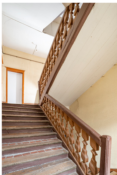
Escalier (n°3). Vue depuis le premier étage. IVR43_20233900090NUC4A