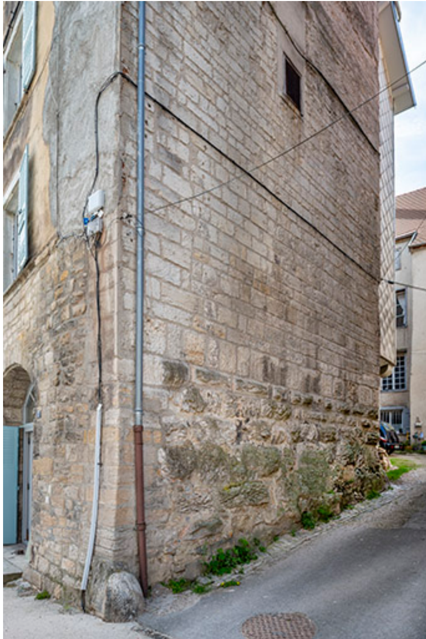
Mur nord d'accès à la cour.