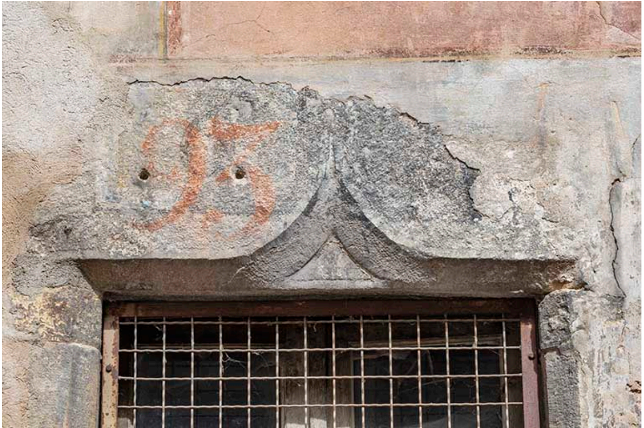
Façade sud. Linteau portant l'inscription peinte (ancienne numérotation).