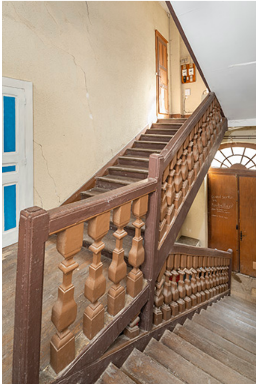
Escalier (n°3). Vue depuis l'entresol.