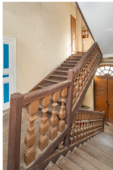
Escalier (n°3). Vue depuis l'entresol. IVR43_20233900089NUC4A