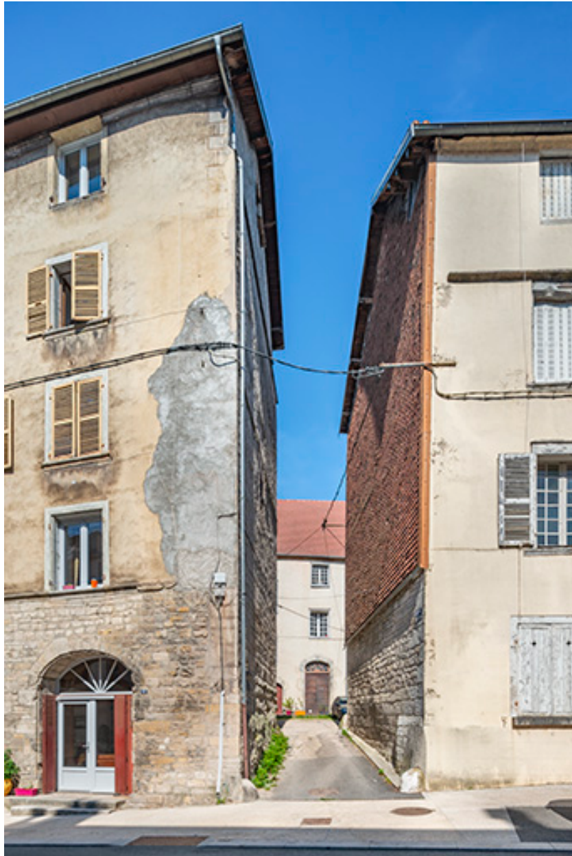
Entrée de la cour depuis la rue de la Liberté.