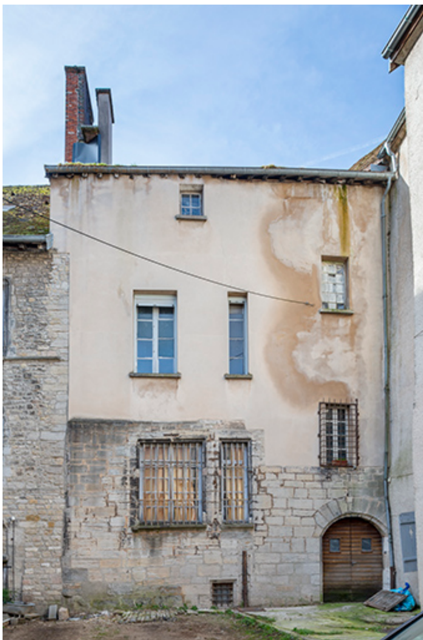
Façade nord (façade postérieure de l'hôtel de Falletans).