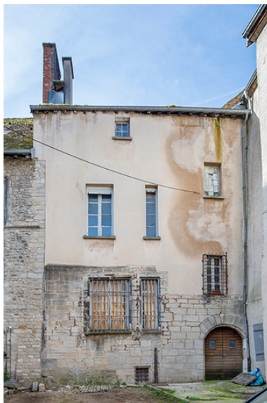
Façade nord (façade postérieure de l'hôtel de Falletans). IVR43_20233900085NUC4A