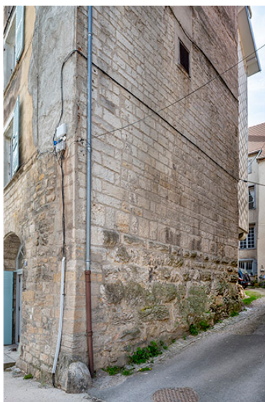
Mur nord d'accès à la cour. IVR43_20243900562NUC4A