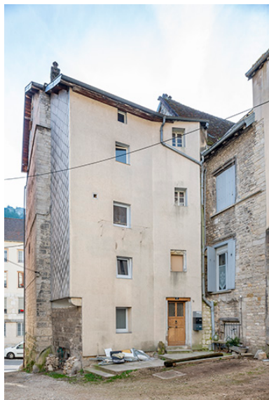
Vue d'ensemble depuis le nord-ouest. IVR43_20233900087NUC4A