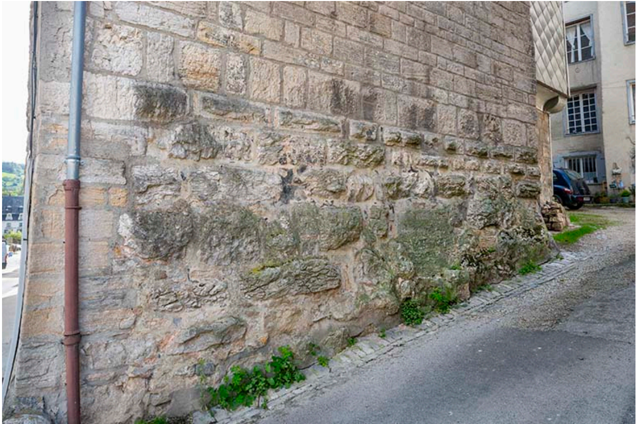
Base du mur nord (bossage en boules ?).