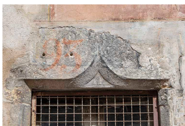
Façade sud. Linteau portant l'inscription peinte (ancienne numérotation).