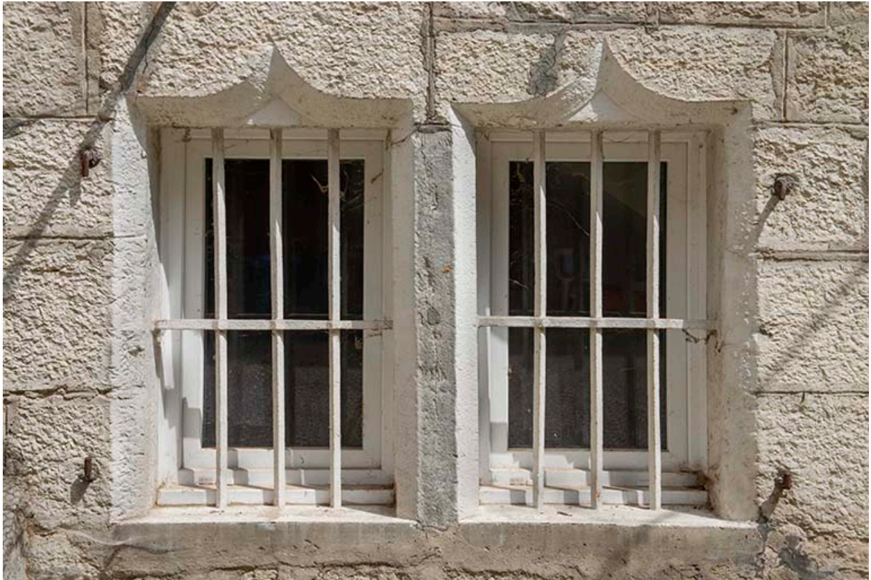
Façade est. Ouvertures du rez-de-chaussée.