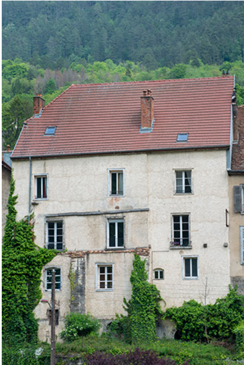
Façade ouest (n°3).