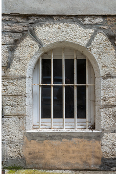
Façade est. Baie en plein- cintre du rez-de-chaussée. IVR43_20233900447NUC4A