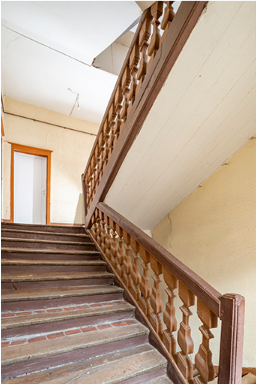
Escalier (n°3). Vue depuis le premier étage.