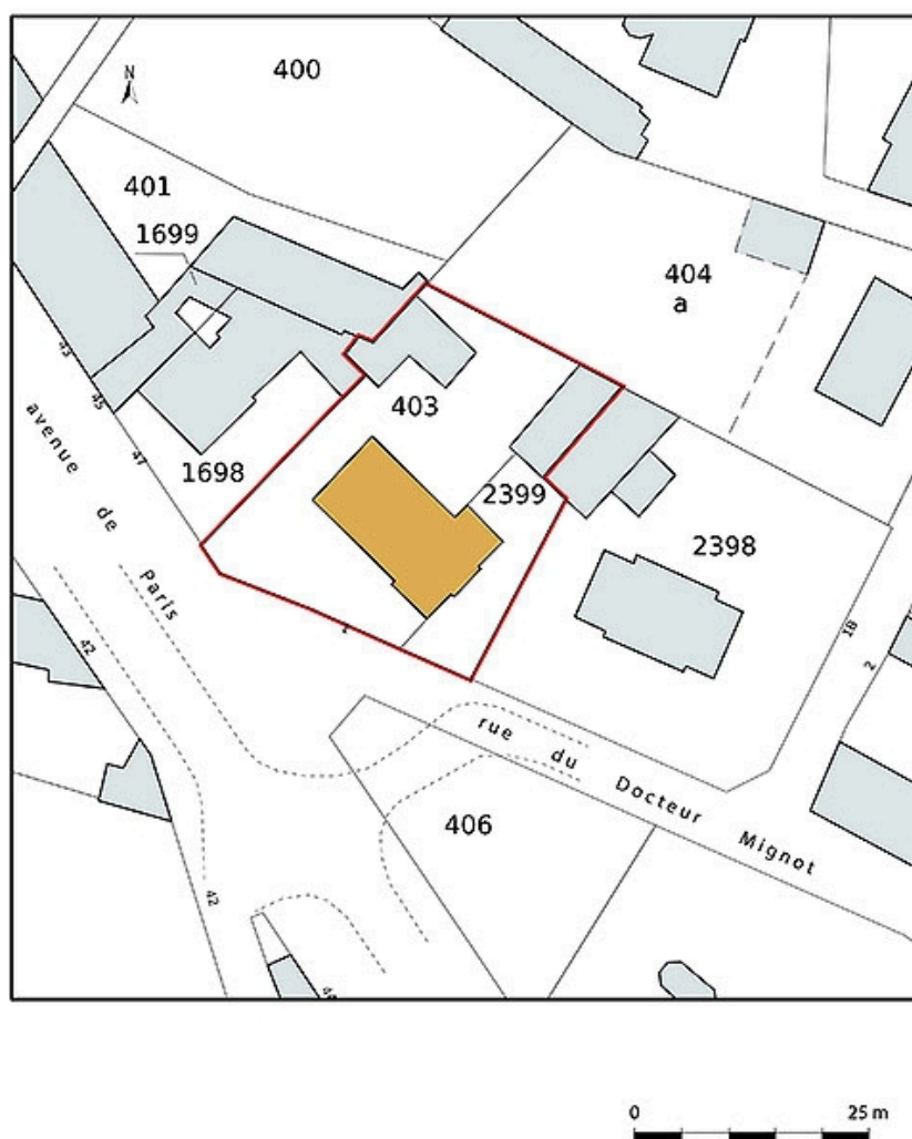
Plan-masse et de situation, extrait du plan cadastral (2021).