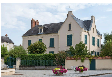
Vue depuis la rue. IVR26_20205800574NUC4A