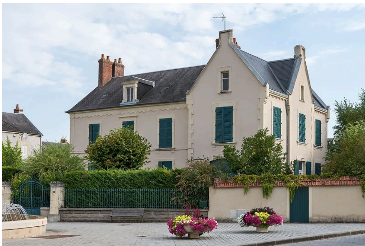
Vue depuis la rue.