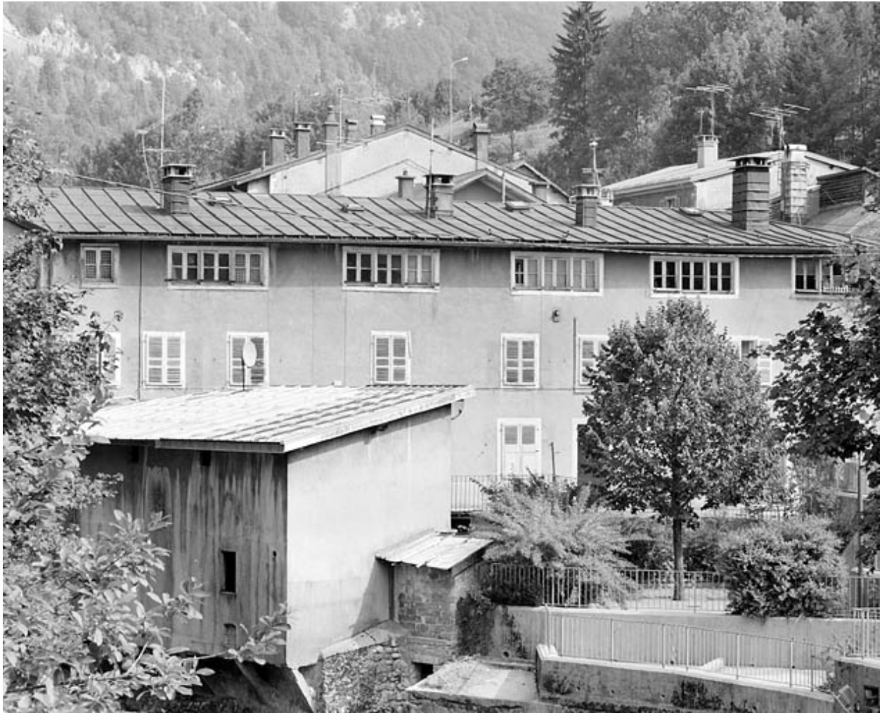
Façade principale : les deux étages carrés.