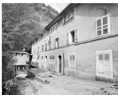
Façade principale, de trois quarts droite. IVR43_20033900171X