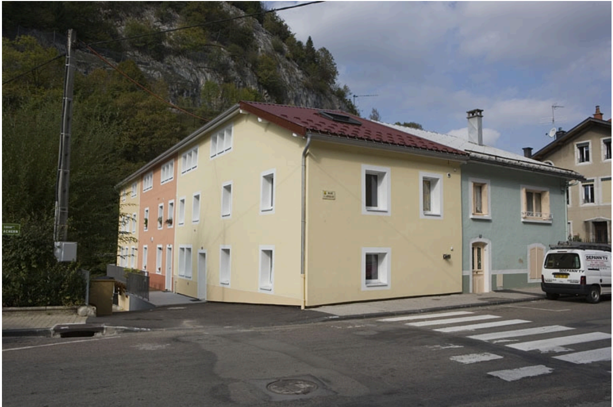
Vue de trois quarts, après restauration.