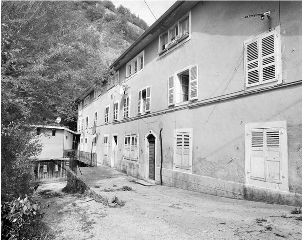
Façade principale, de trois quarts droite.