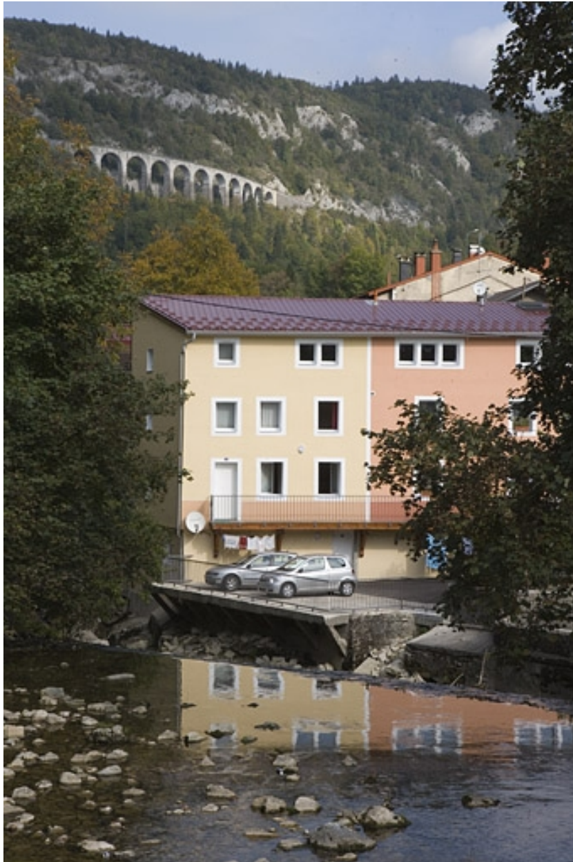
Vue d'ensemble depuis le sud, après restauration.