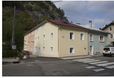
Vue de trois quarts, après restauration.