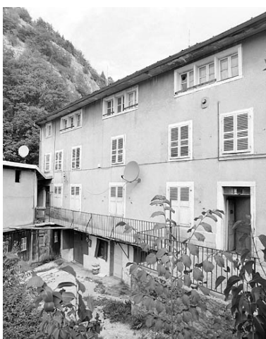
Façade principale : extension de 1861.