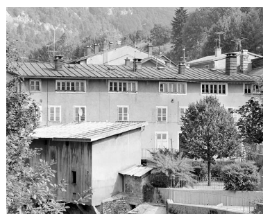
Façade principale : les deux étages carrés.