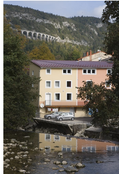
Vue d'ensemble depuis le sud, après restauration. IVR43_20093900092NUC2A