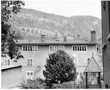
Façade principale : ensembles de baies lunetières. IVR43_20033900175X