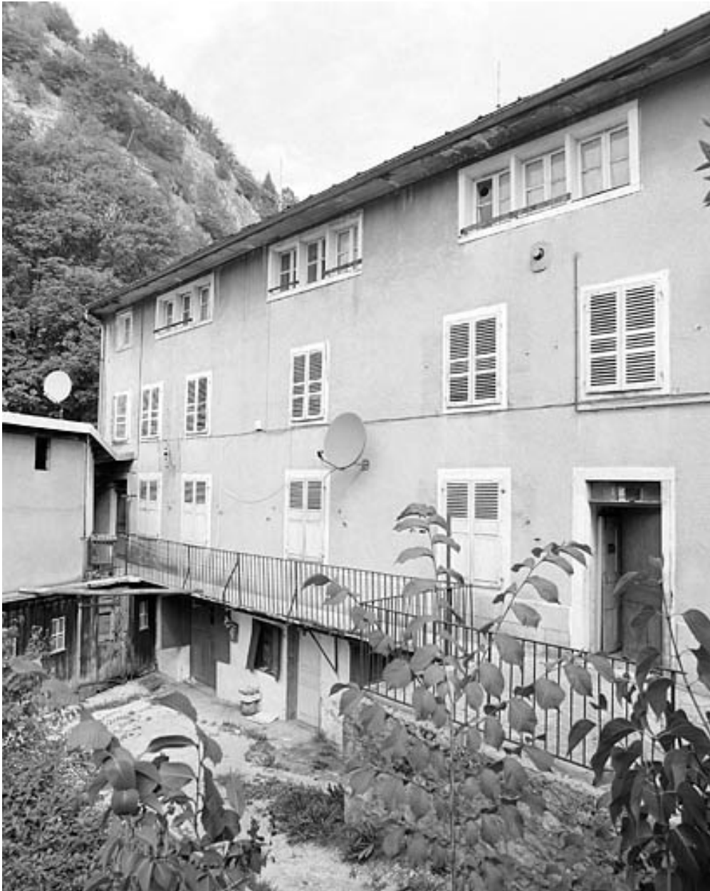
Façade principale : extension de 1861.