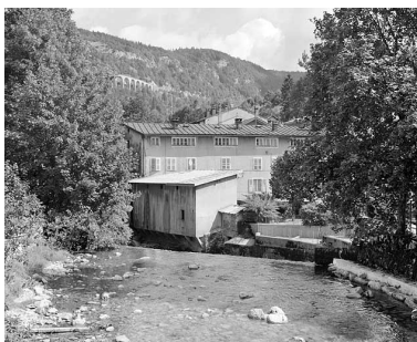
Vue d'ensemble, depuis le sud. IVR43_20033900173X