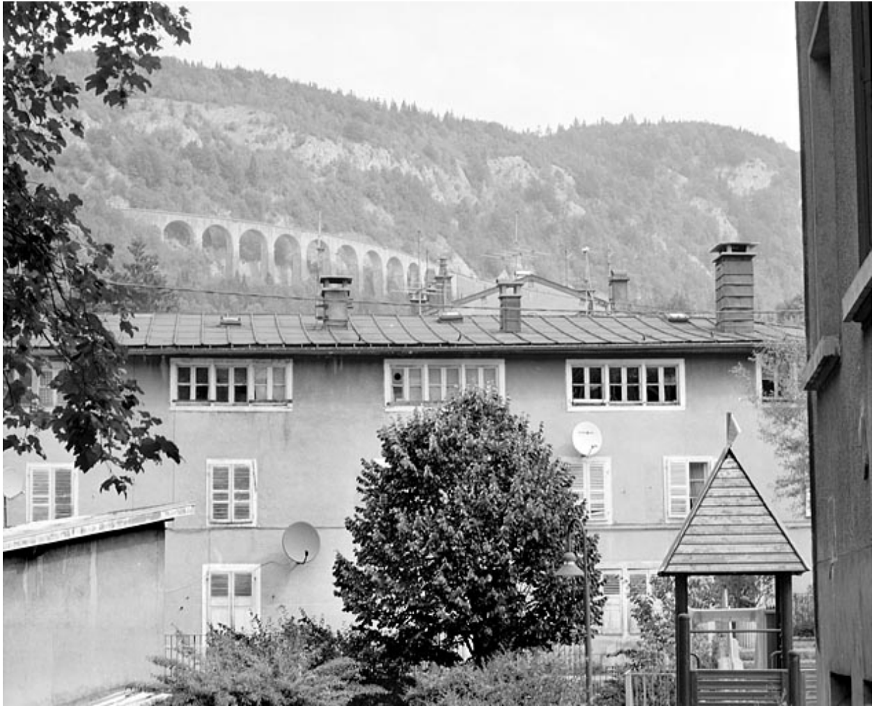
Façade principale : ensembles de baies lunetières.