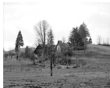
Façades antérieure et latérale. IVR43_19752500437X