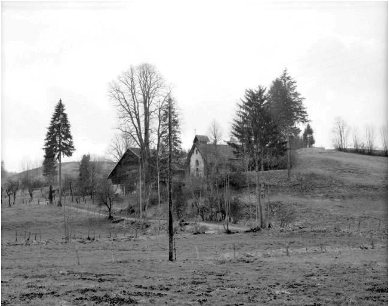
Façades antérieure et latérale.