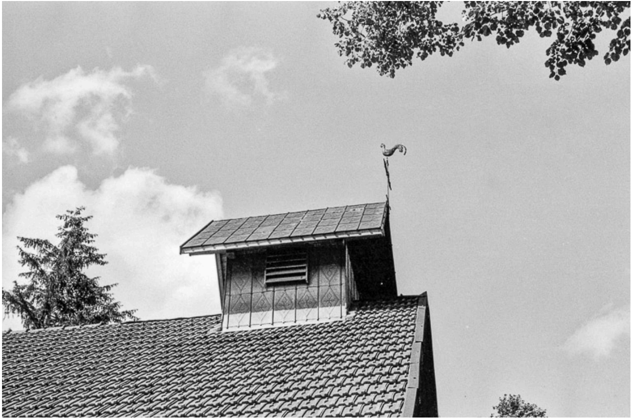
Vue du clocher.