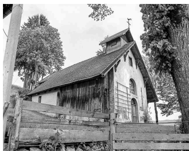
Vue de trois quarts gauche. IVR43_19772500308X