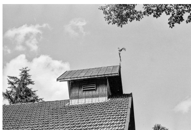
Vue du clocher. IVR43_19742500798Z