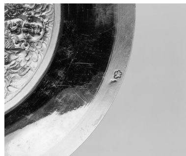
Détail des poinçons. IVR26_19782101550X