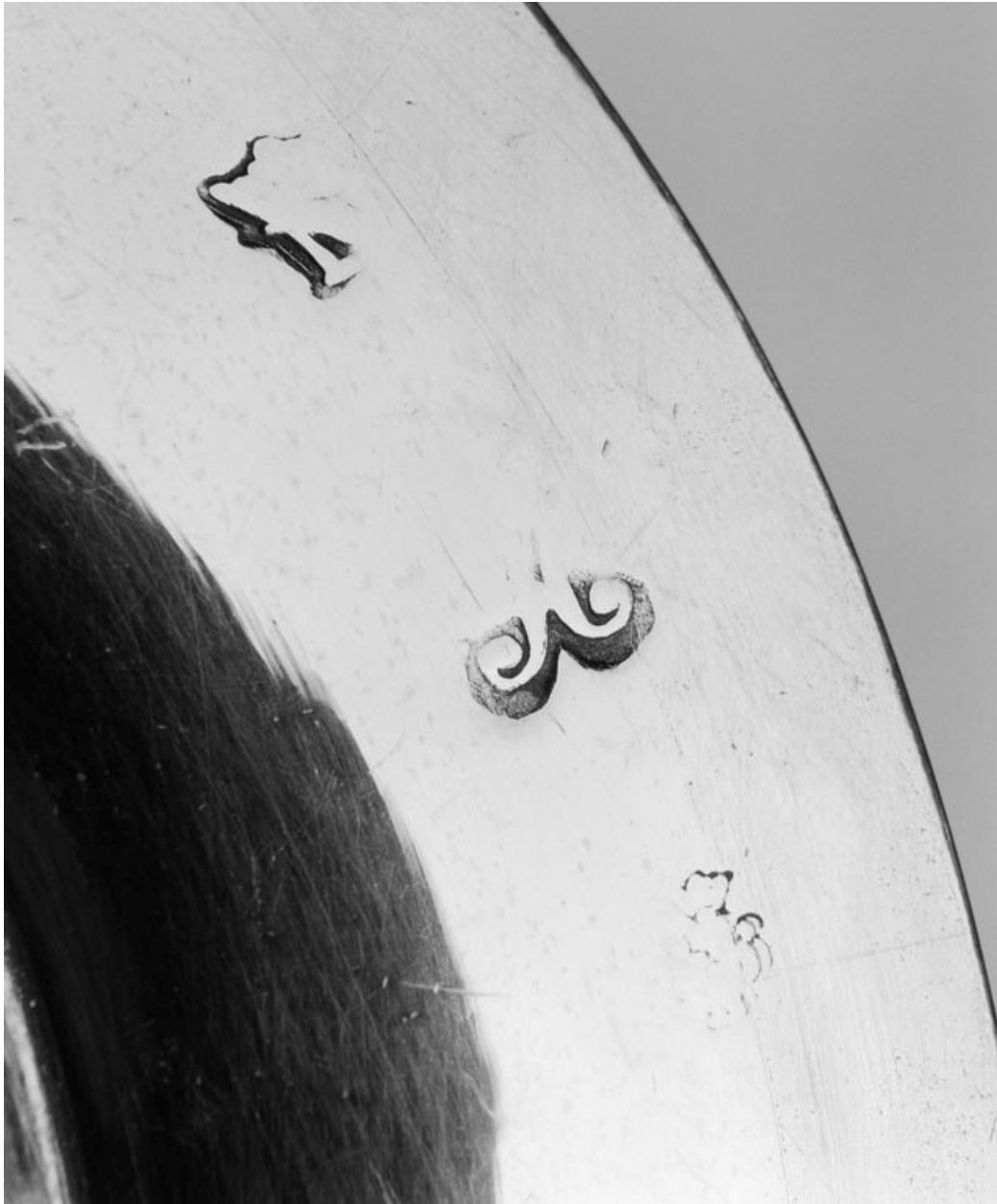
Détail des poinçons.