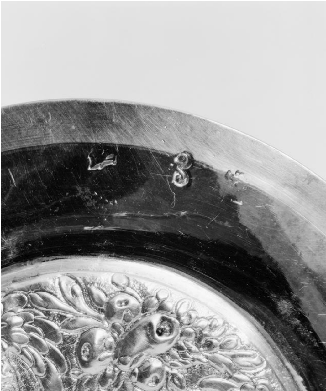
Détail des poinçons.