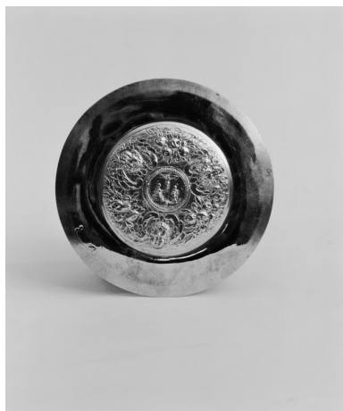
Vue d'ensemble. IVR26_19782101548X