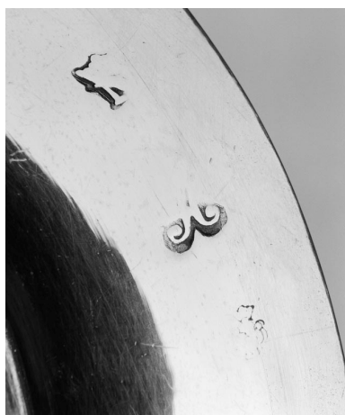
Détail des poinçons.