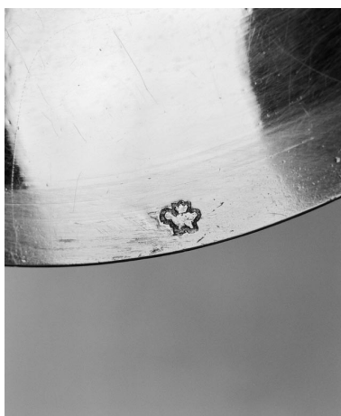
Détail : poinçon de décharge.