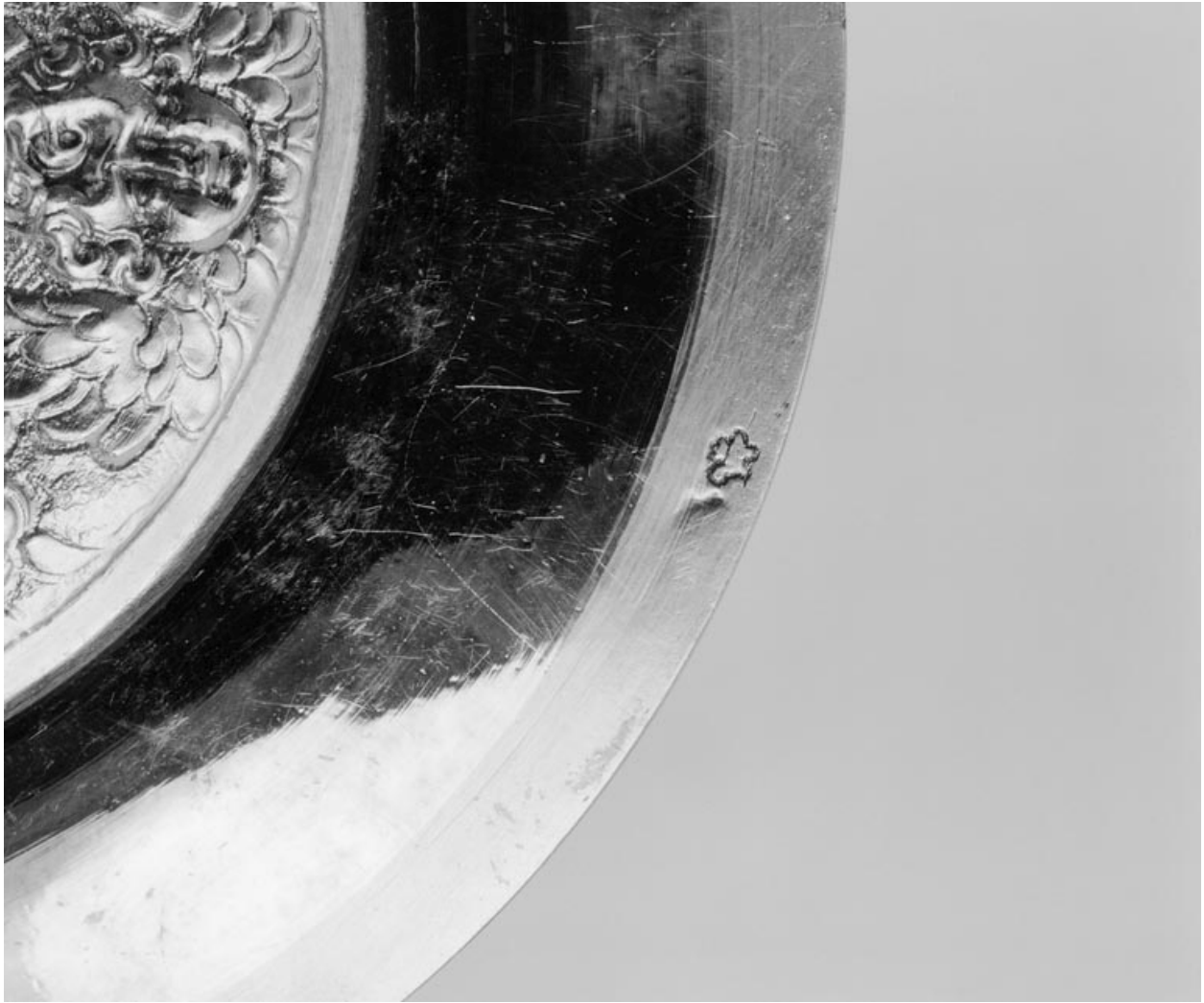
Détail des poinçons.