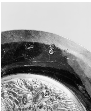
Détail des poinçons. IVR26_19782101549X