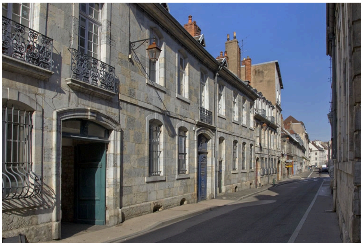
Vue d'ensemble depuis la rue, de trois quarts gauche, vue rapprochée.