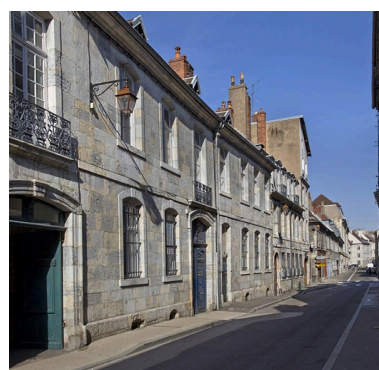
Vue d'ensemble depuis la rue, de trois quarts gauche.