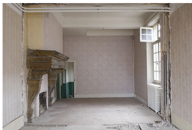
Vue d'ensemble d'une cheminée d'une pièce du premier étage.