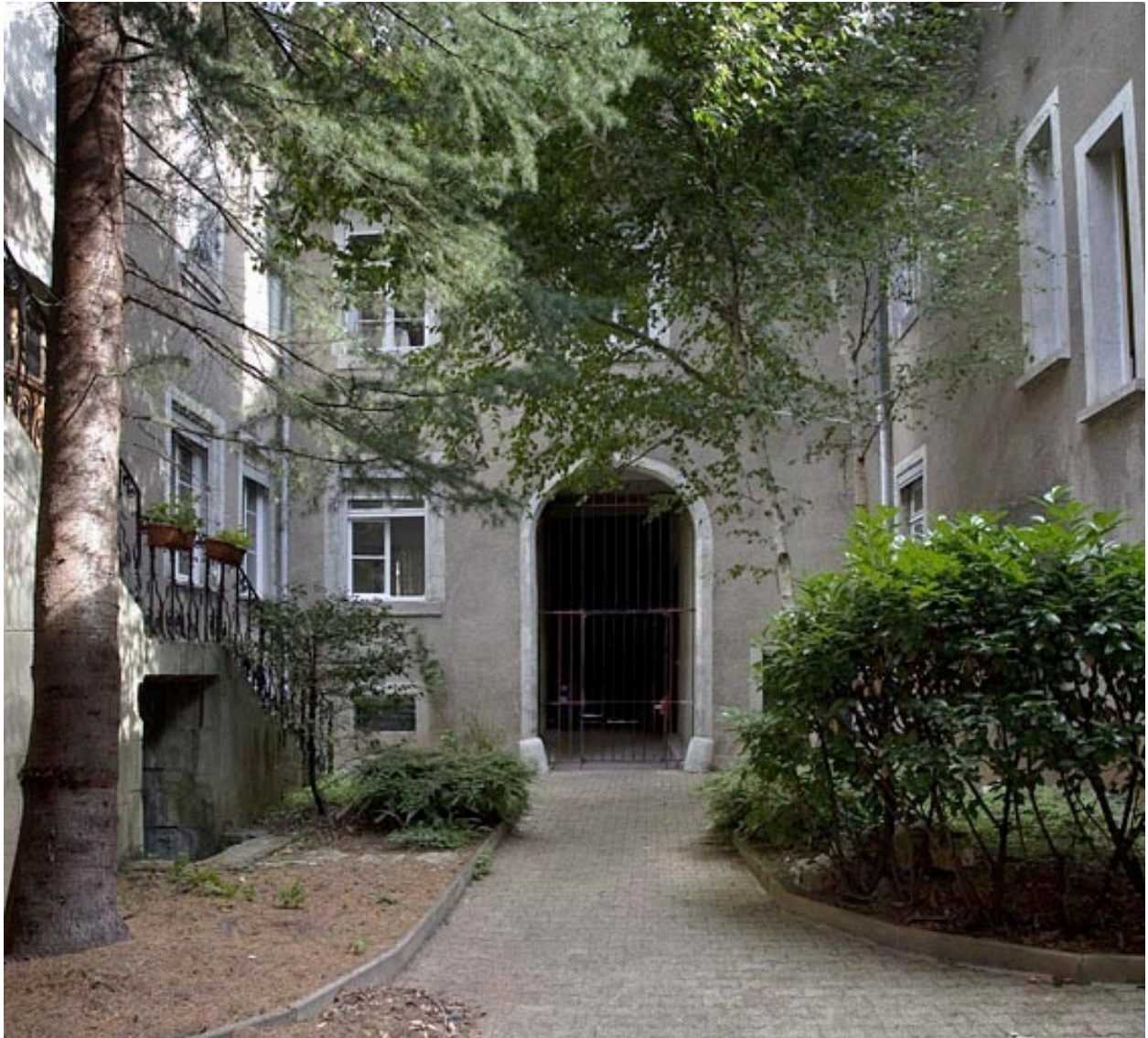
Logis principal, façade postérieure depuis le fond de la cour.