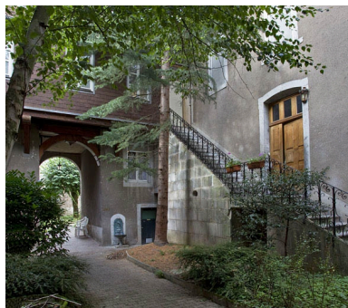
Vue d'ensemble de l'escalier extérieur du premier logis secondaire. IVR43_20112502854NUC2A