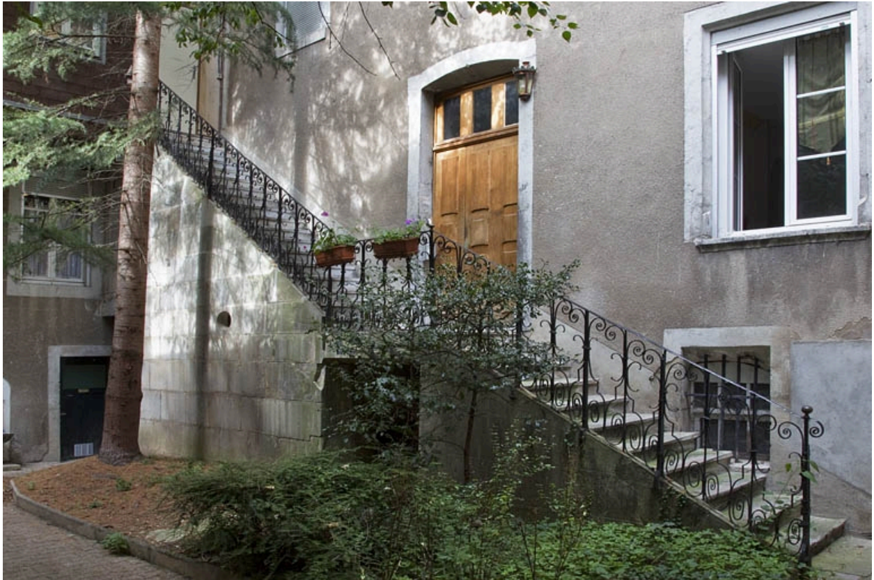
Premier logis secondaire : détail de l'escalier extérieur, de trois quarts gauche.