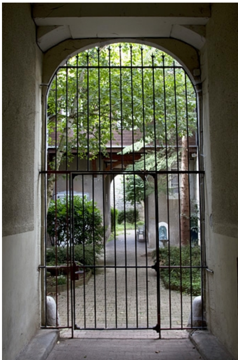
Vue d'ensemble de la cour depuis le portail d'entrée.