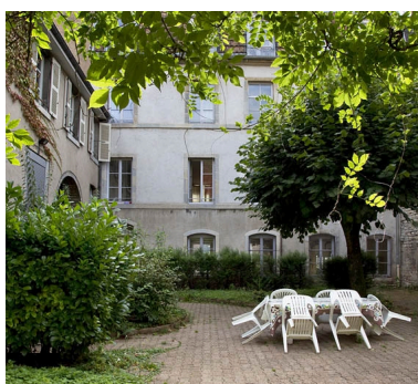
Vue d'une partie du jardin : de face.