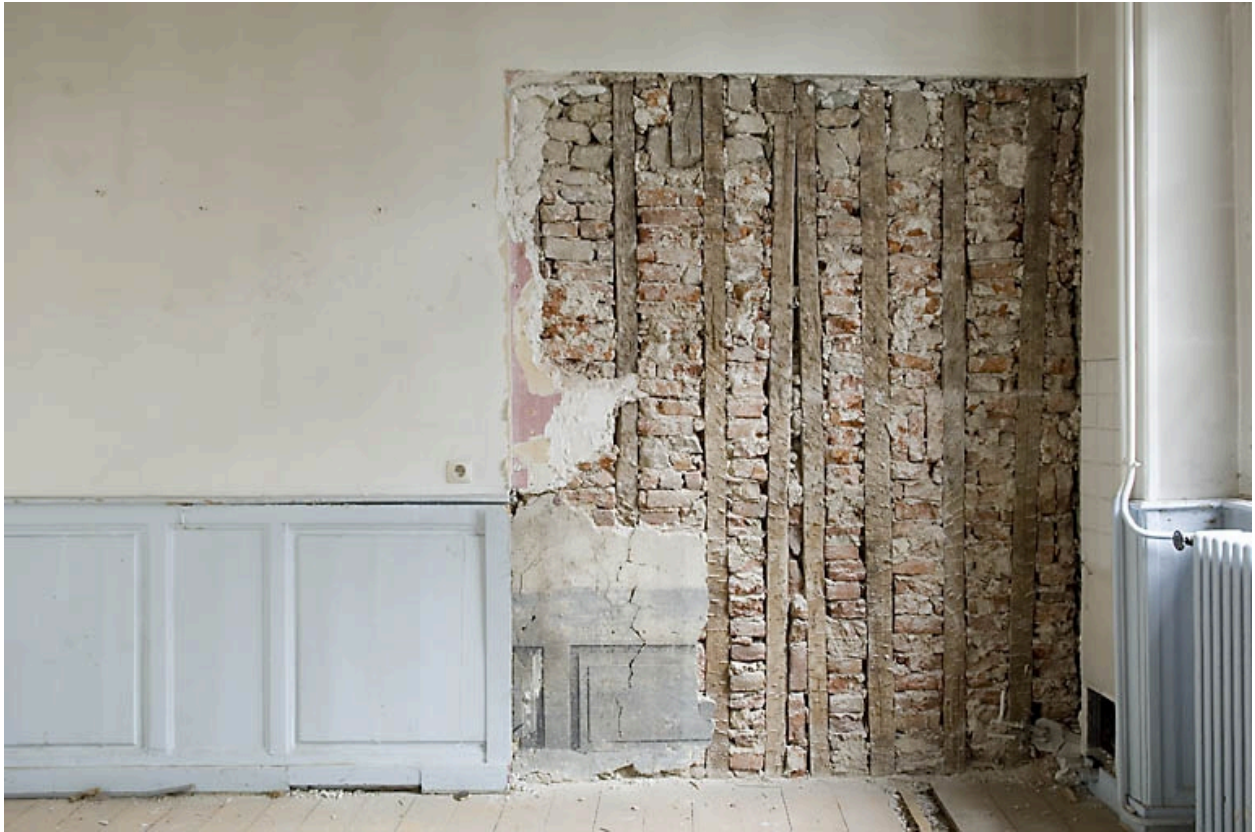
Détail d'une peinture murale sous un lambris d'appui dans une pièce du premier étage.