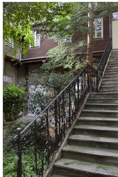
Premier logis secondaire : détail de la rampe en ferronnerie de l'escalier extérieur. IVR43_20112502865NUC2A