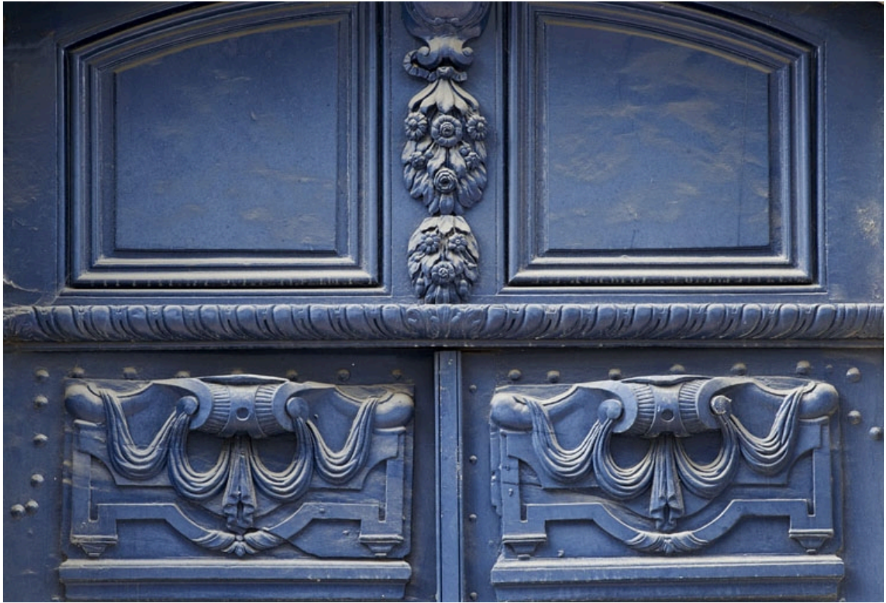
Logis principal, façade antérieure, portail d'entrée : détail du décor des vantaux de la porte.