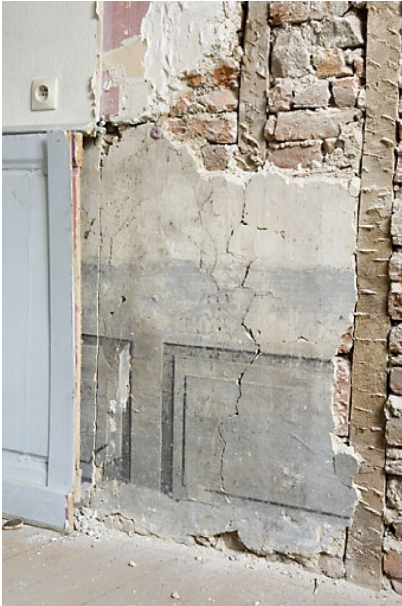
Détail d'une peinture murale sous un lambris d'appui dans une pièce du premier étage : vue rapprochée.