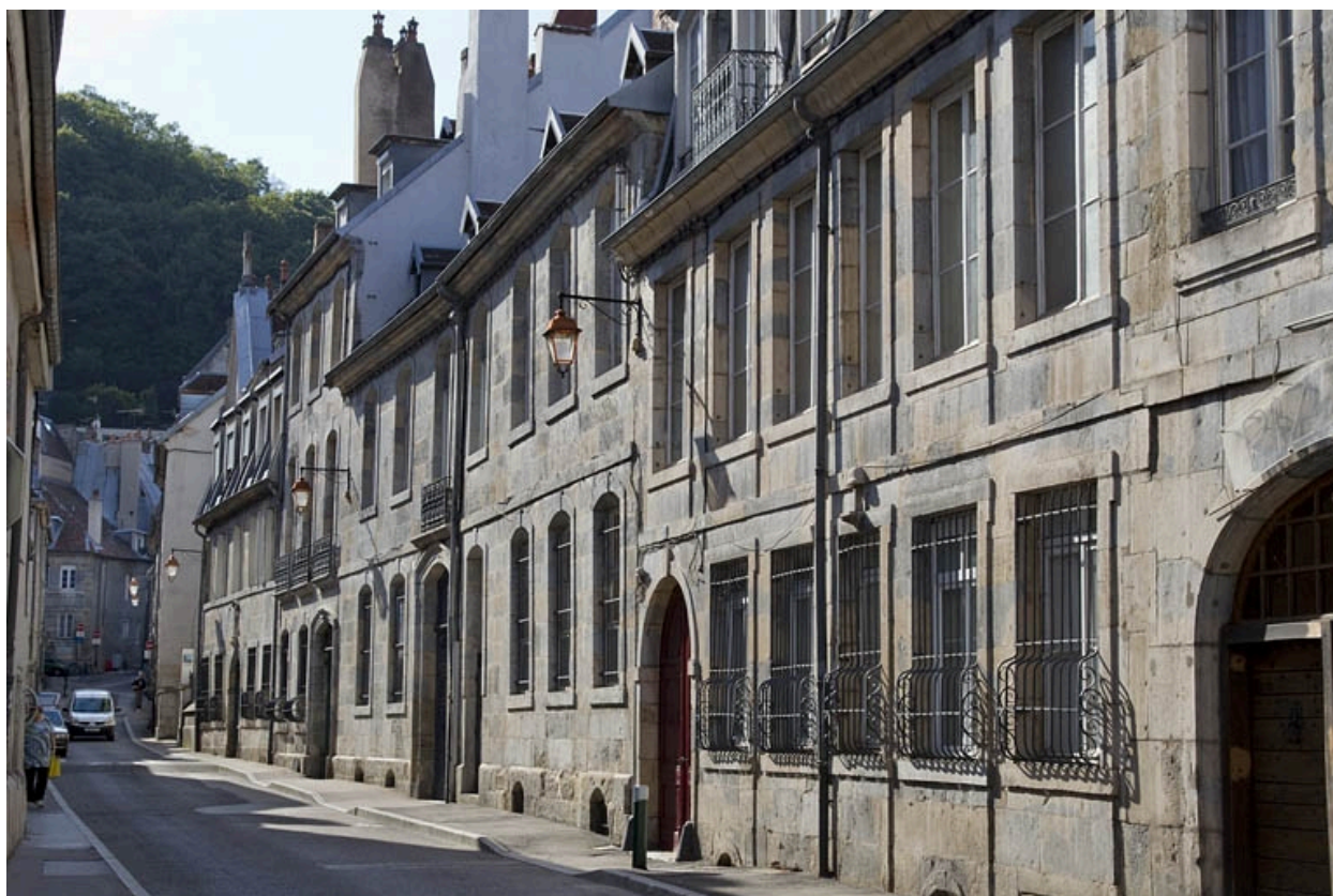
Vue d'ensemble depuis la rue, de trois quarts droit.