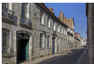
Vue d'ensemble depuis la rue, de trois quarts gauche, vue rapprochée.