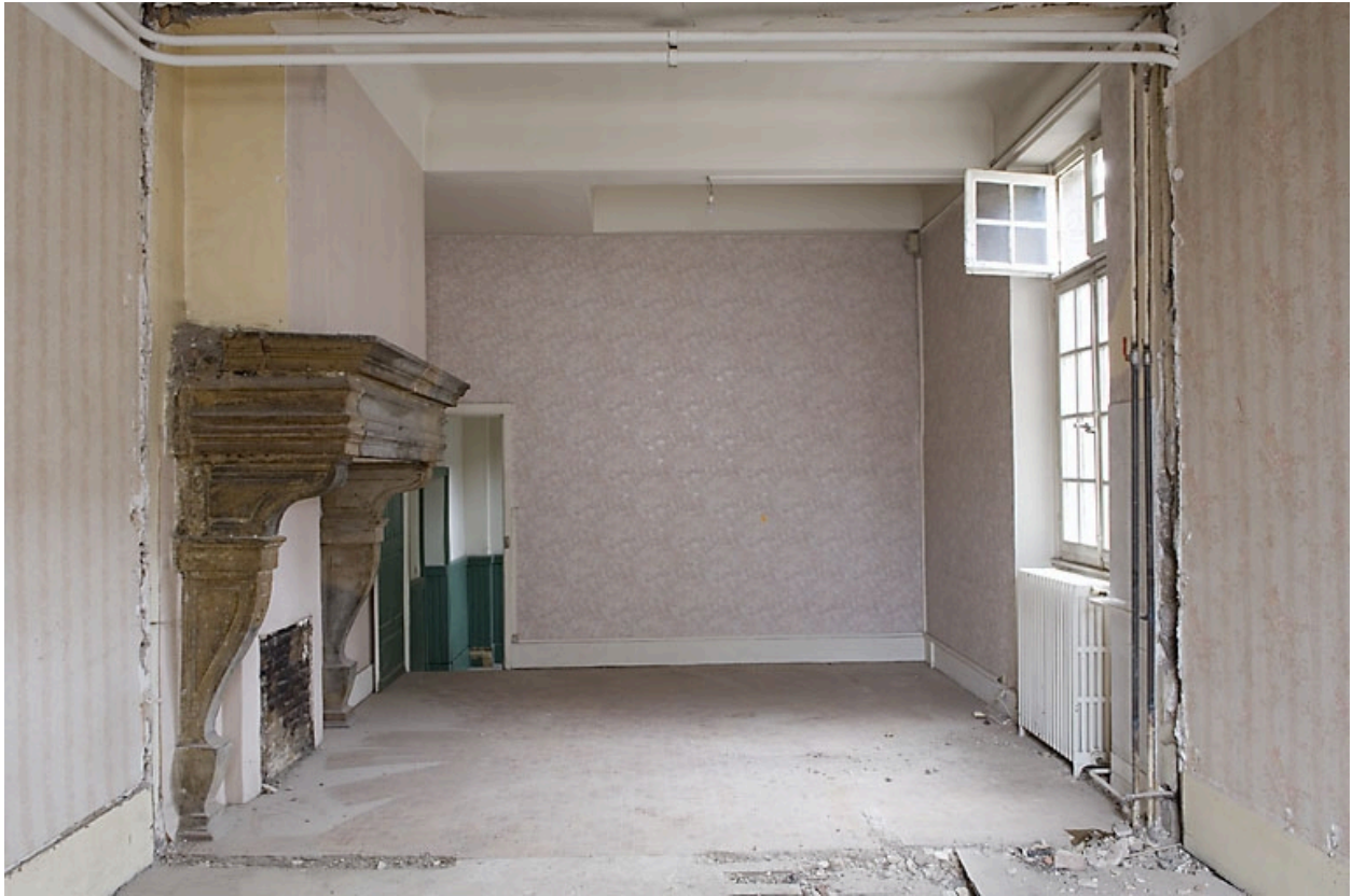
Vue d'ensemble d'une cheminée d'une pièce du premier étage.