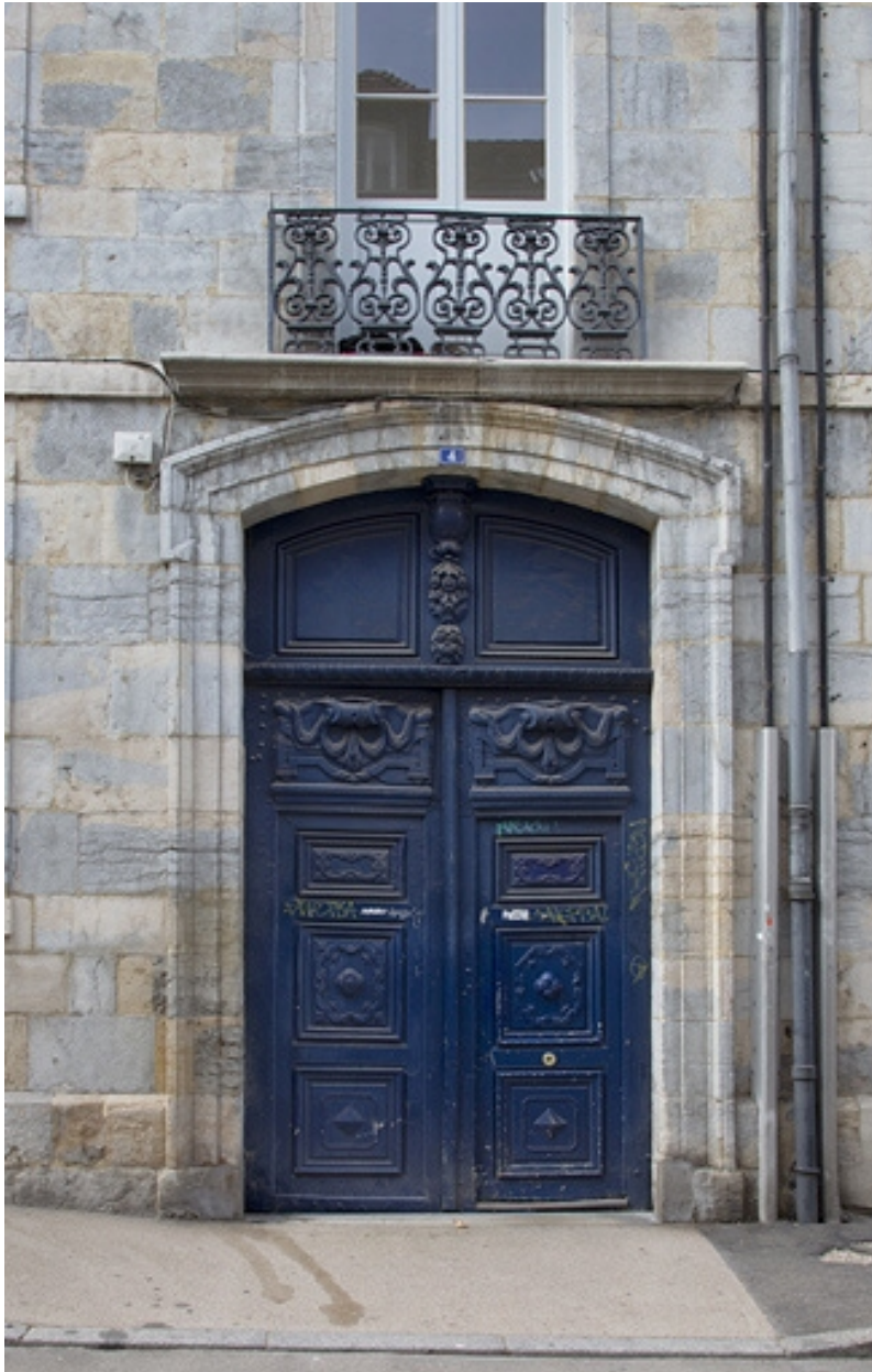
Logis principal, façade antérieure : détail du portail d'entrée.