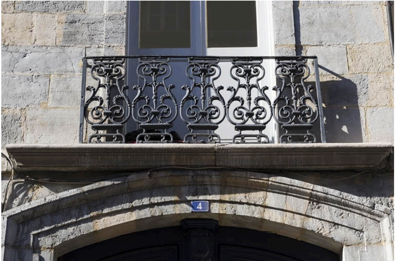
Logis principal, façade antérieure : détail du garde-corps du balcon.