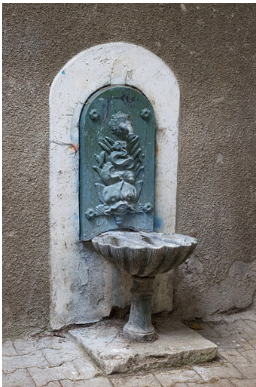
Vue d'ensemble de la borne fontaine située dans la cour.