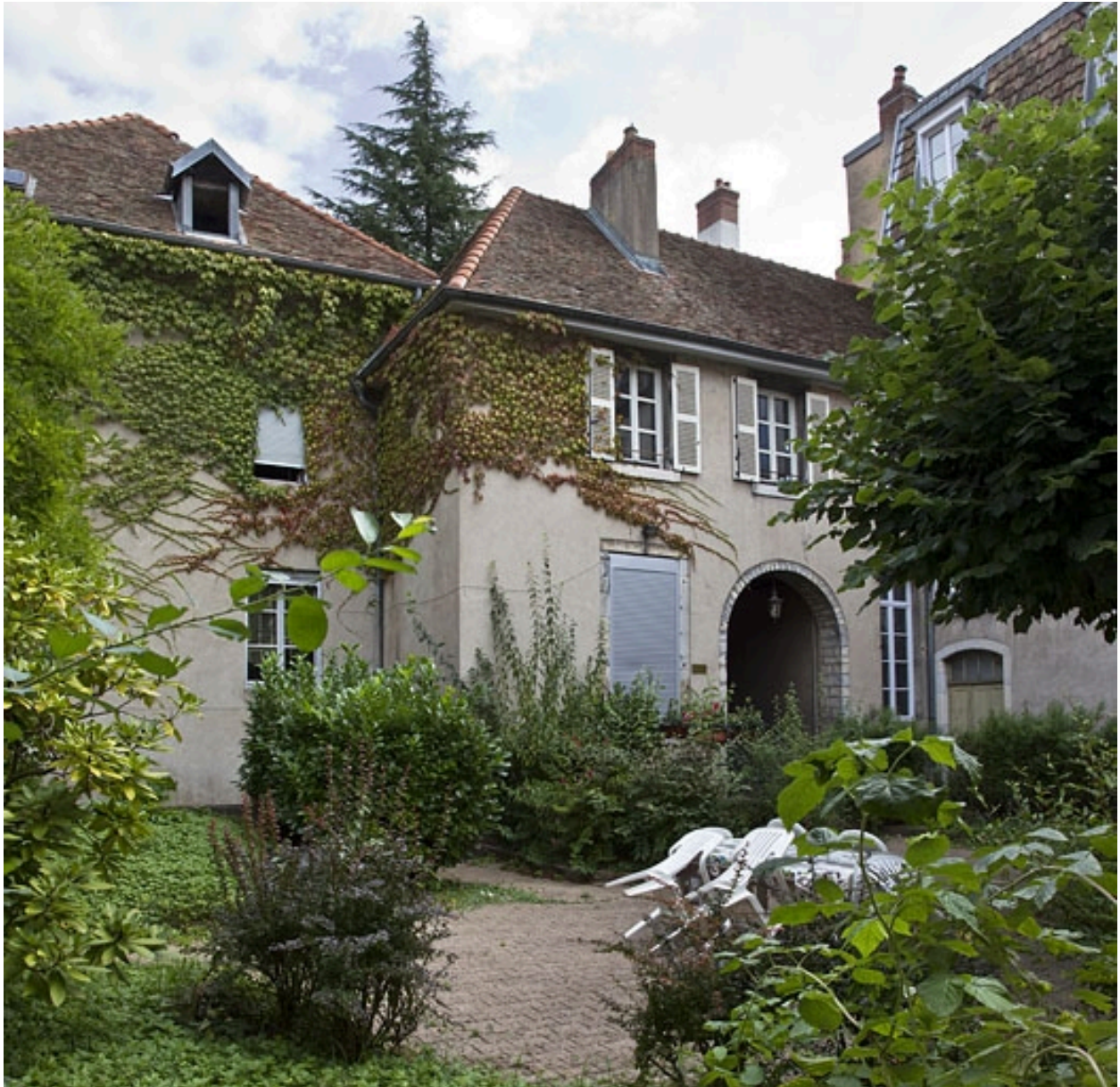
Deuxième logis secondaire, façade postérieure depuis le fond du jardin : de trois quarts gauche.