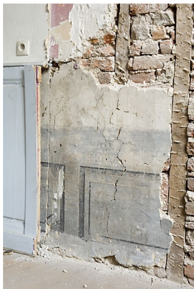
Détail d'une peinture murale sous un lambris d'appui dans une pièce du premier étage : vue rapprochée. IVR43_20072500405NUCA