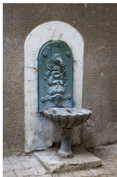
Vue d'ensemble de la borne fontaine située dans la cour.