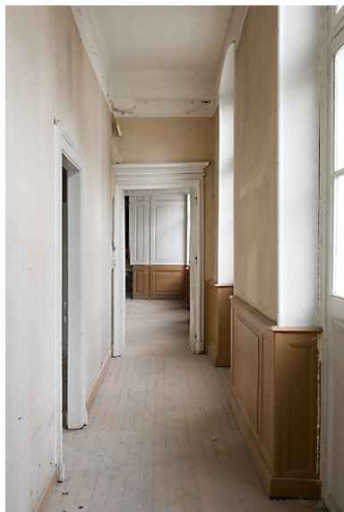
Vue d'ensemble du couloir au premier étage. IVR43_20072500403NUCA