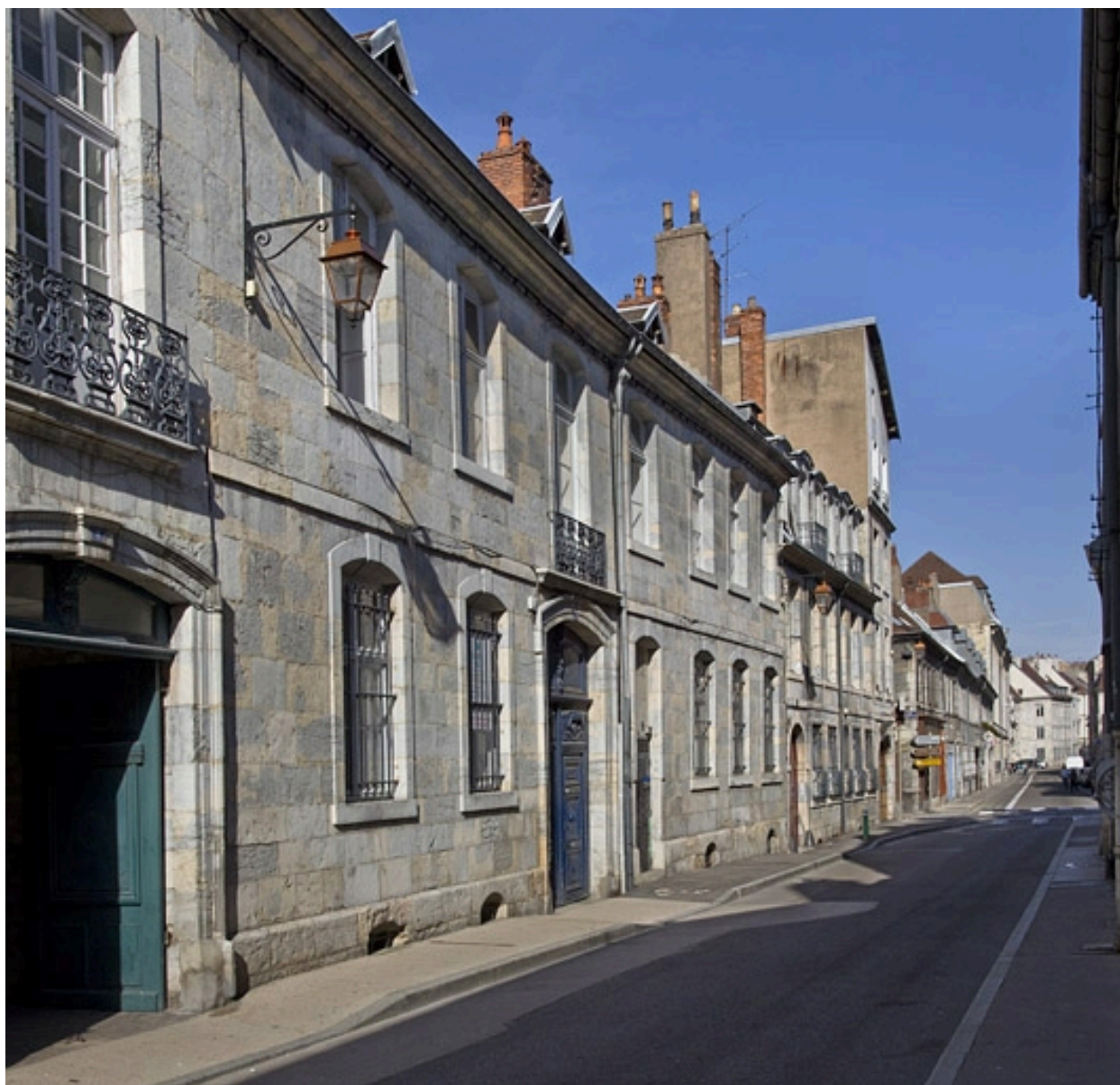
Vue d'ensemble depuis la rue, de trois quarts gauche.