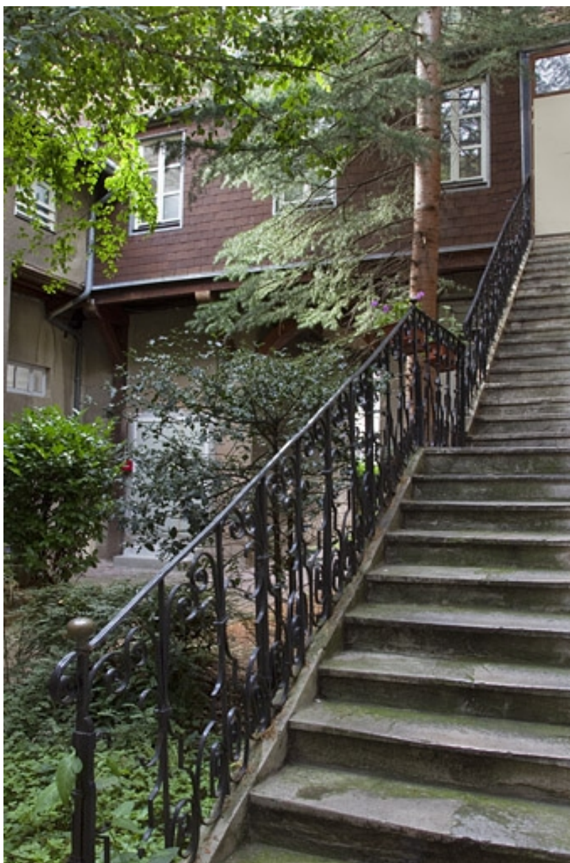
Premier logis secondaire : détail de la rampe en ferronnerie de l'escalier extérieur.