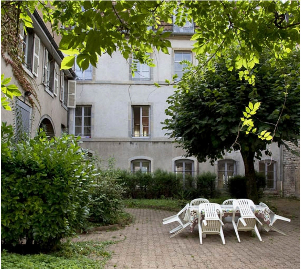
Vue d'une partie du jardin : de face.