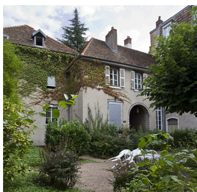
Deuxième logis secondaire, façade postérieure depuis le fond du jardin : de trois quarts gauche.