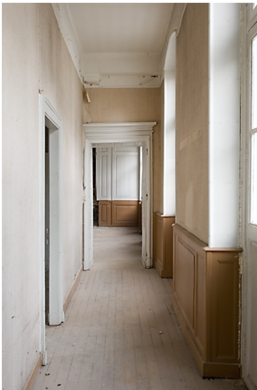
Vue d'ensemble du couloir au premier étage.