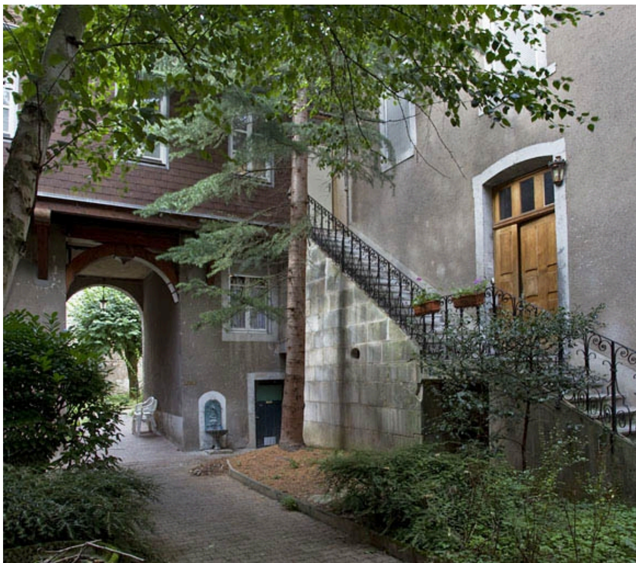
Vue d'ensemble de l'escalier extérieur du premier logis secondaire.