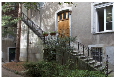
Premier logis secondaire : détail de l'escalier extérieur, de trois quarts gauche. IVR43_20112502864NUC2A