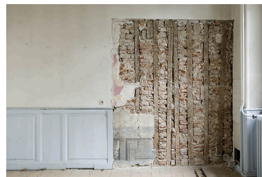
Détail d'une peinture murale sous un lambris d'appui dans une pièce du premier étage.