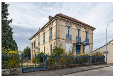
Vue d'ensemble depuis le sud-est (vue actuelle). IVR43_20207000681NUC4A