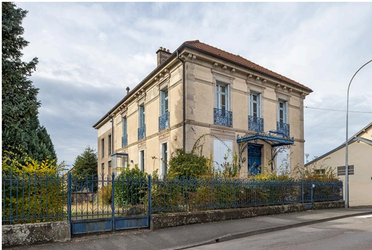
Vue d'ensemble depuis le sud-est (vue actuelle).