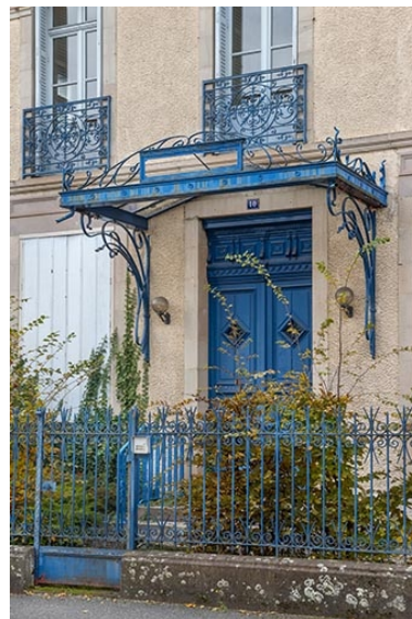
Porte et marquise. IVR43_20207000682NUC4A