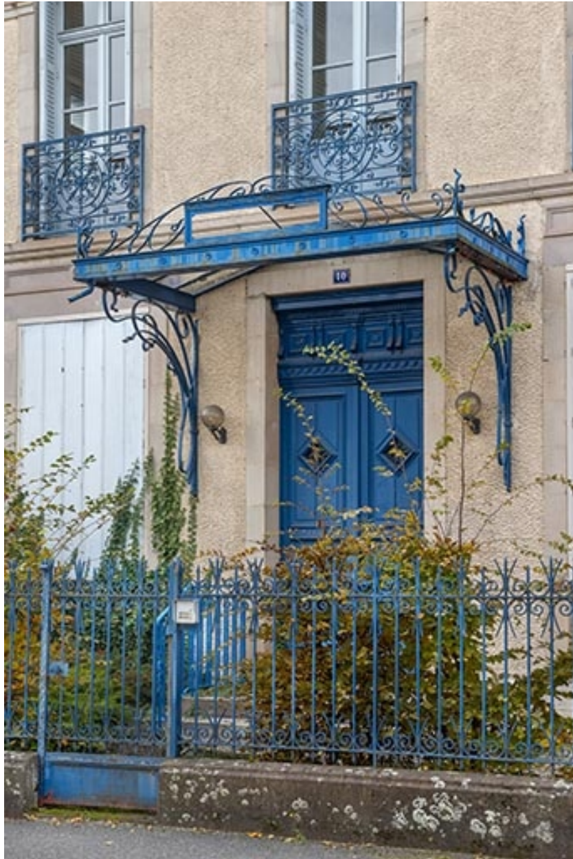
Porte et marquise.