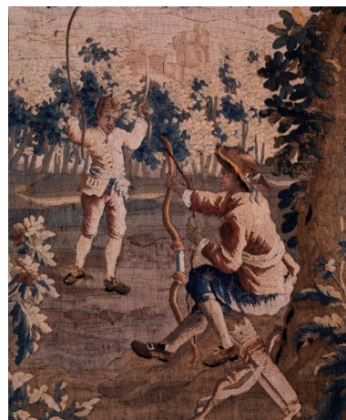
Tir à l'arc et saut à la corde, détail. IVR26_19902101360XA