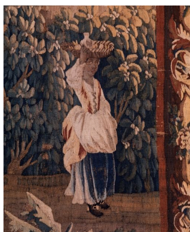
Fermière, détail IVR26_19902101384XA