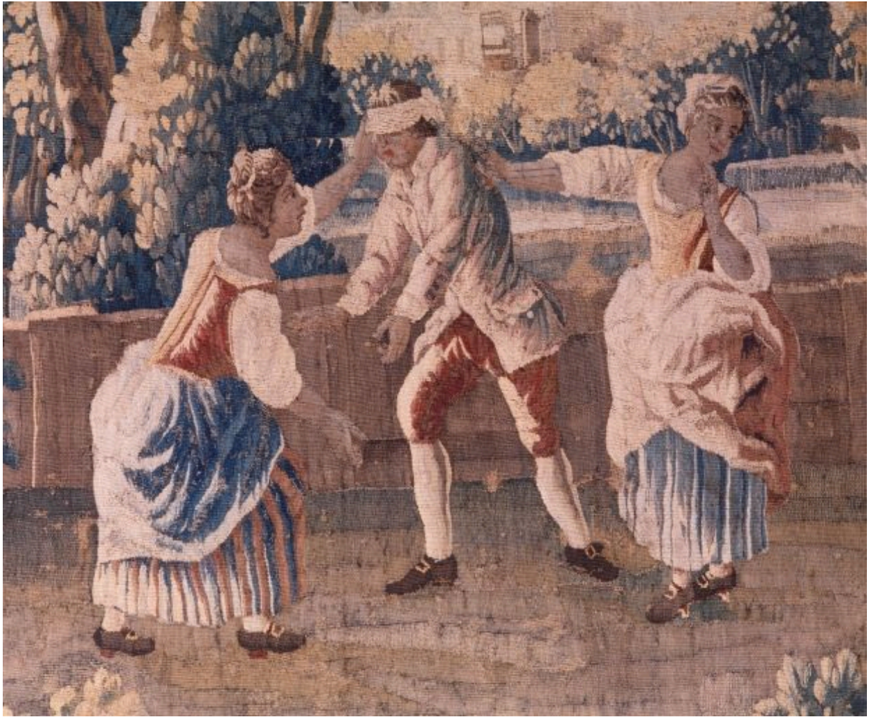
Jeu de colin-maillard, détail.