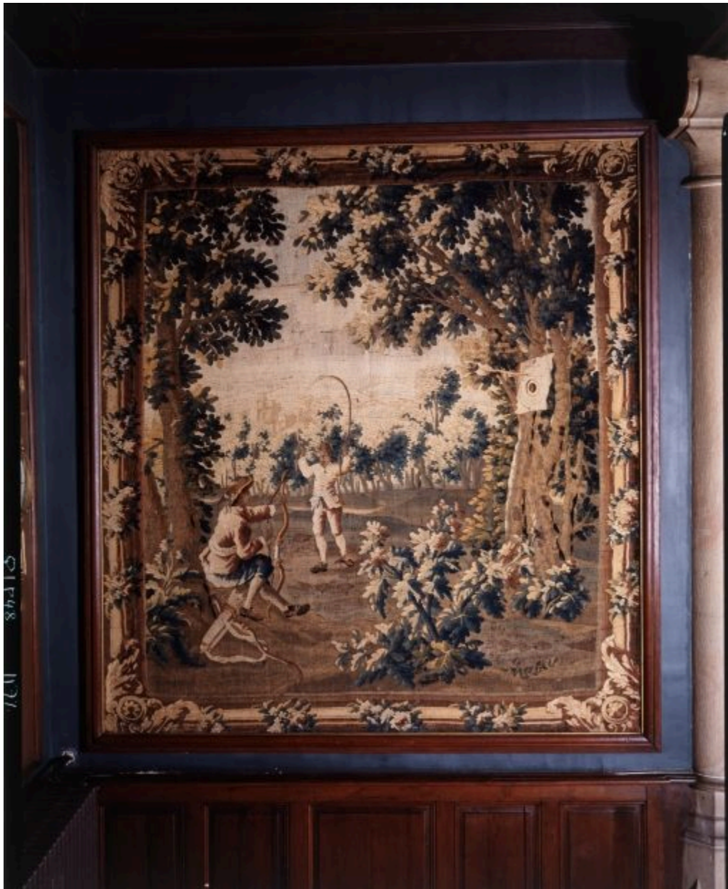
Tir à l'arc et saut à la corde.