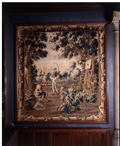
Tir à l'arc et saut à la corde.