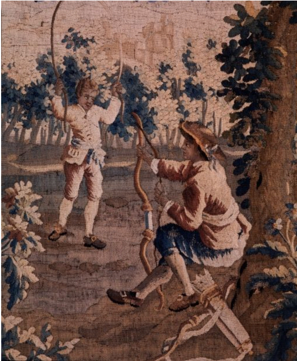
Tir à l'arc et saut à la corde, détail.