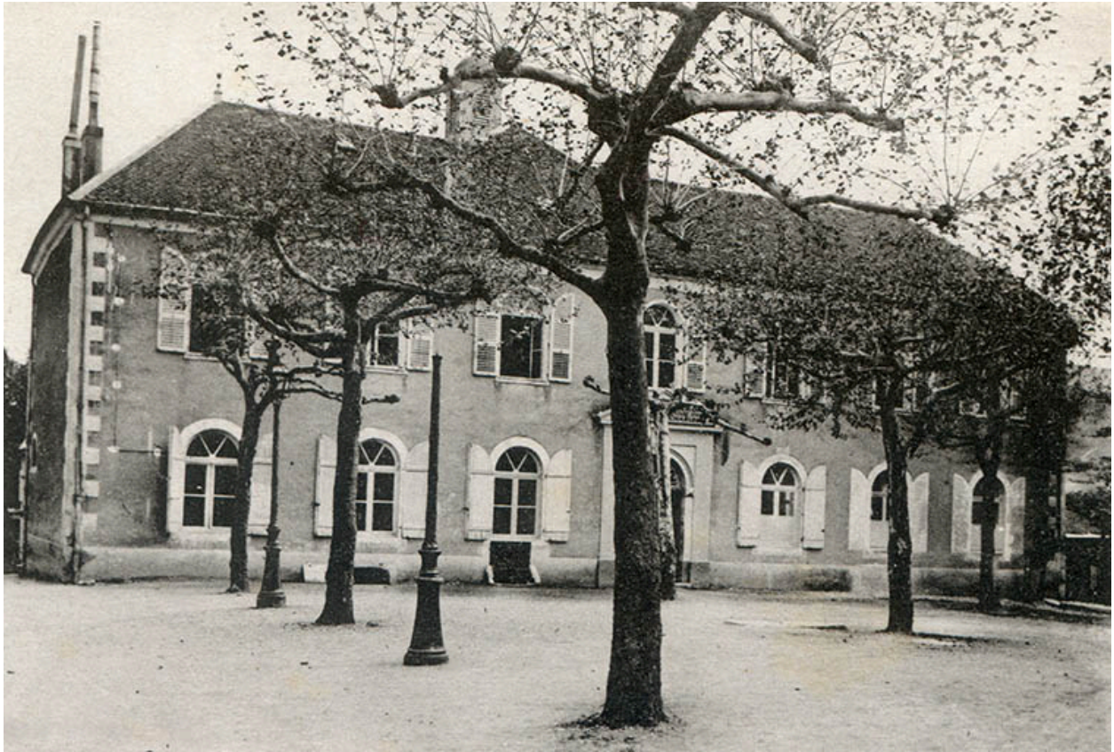
Salins-les-Bains – Ecole supérieure Wilson, s.d. [vers 1920].