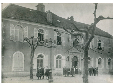
Ecole Wilson, s.d. [vers 1920]. IVR43_20243901011NUC2A