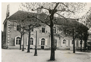
Salins-les-Bains – Ecole supérieure Wilson, s.d. [vers 1920]. IVR43_20243900220NUC4A