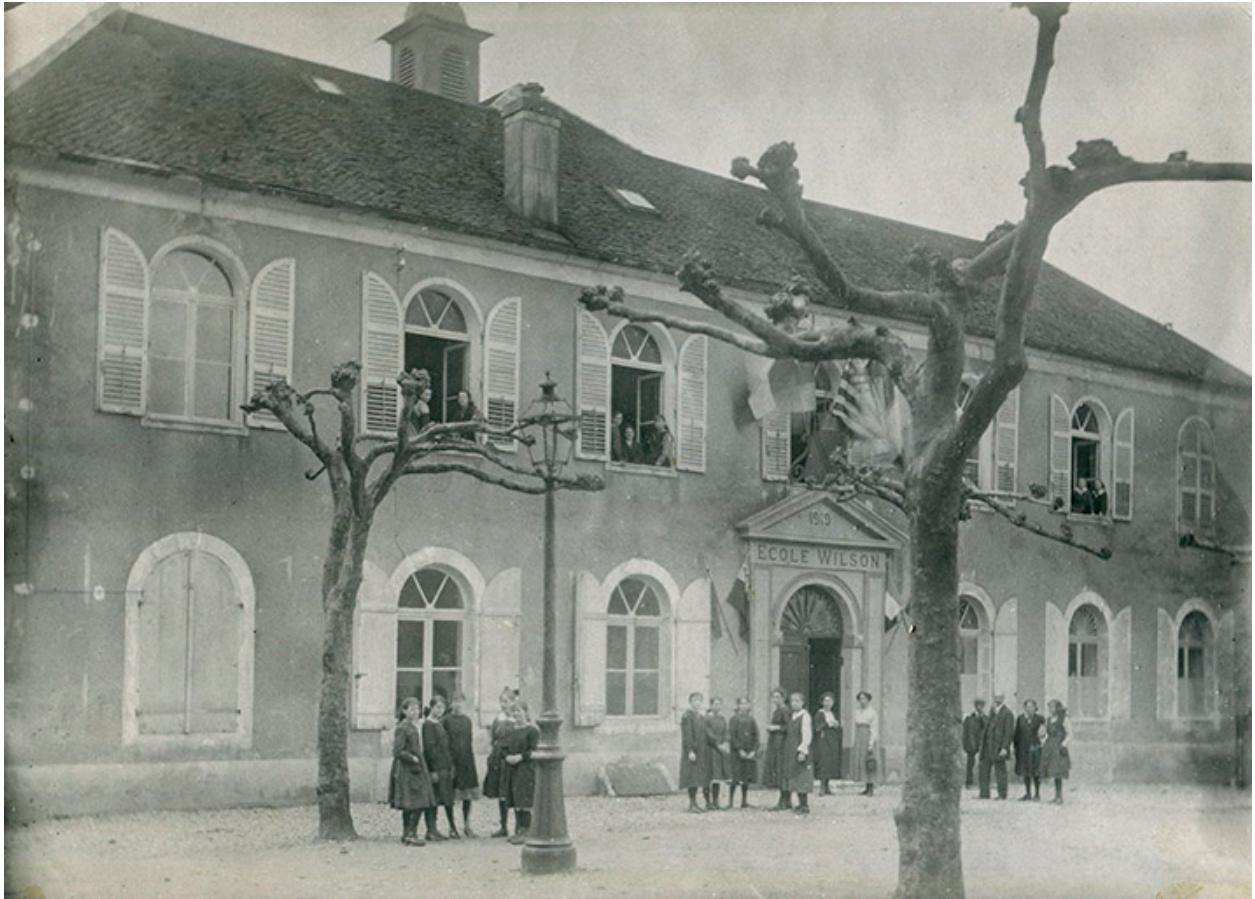
Ecole Wilson, s.d. [vers 1920].