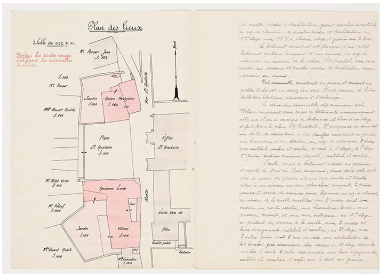
Vente de l'ancienne école Wilson et du presbytère, plan des lieux, 1935.