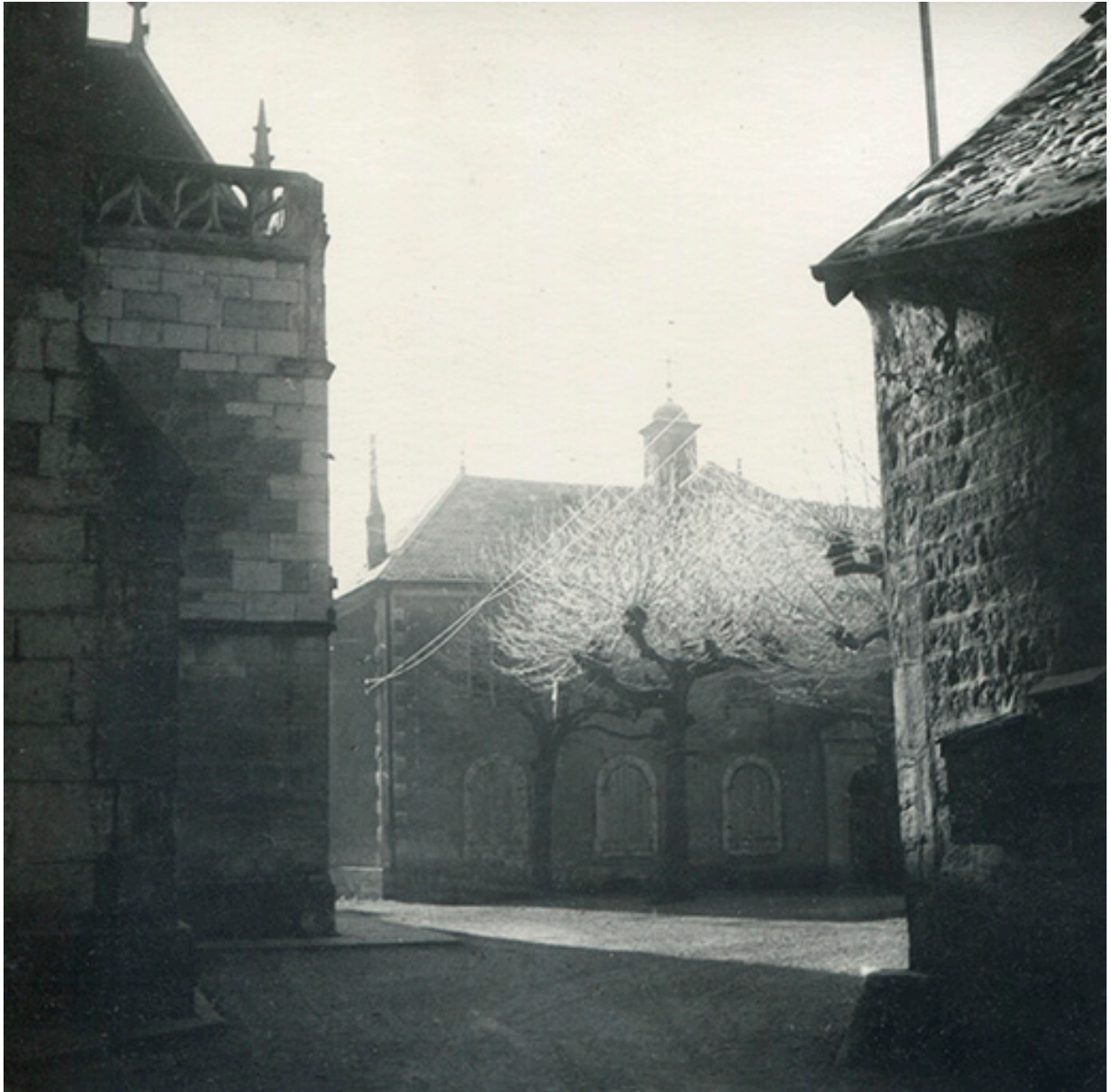
Place Saint-Anatoile et école Saint-Charles, depuis le nord, s.d. [vers 1950].