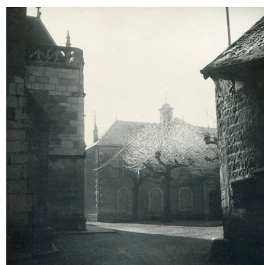
Place Saint-Anatoile et école Saint-Charles, depuis le nord, s.d. [vers 1950].