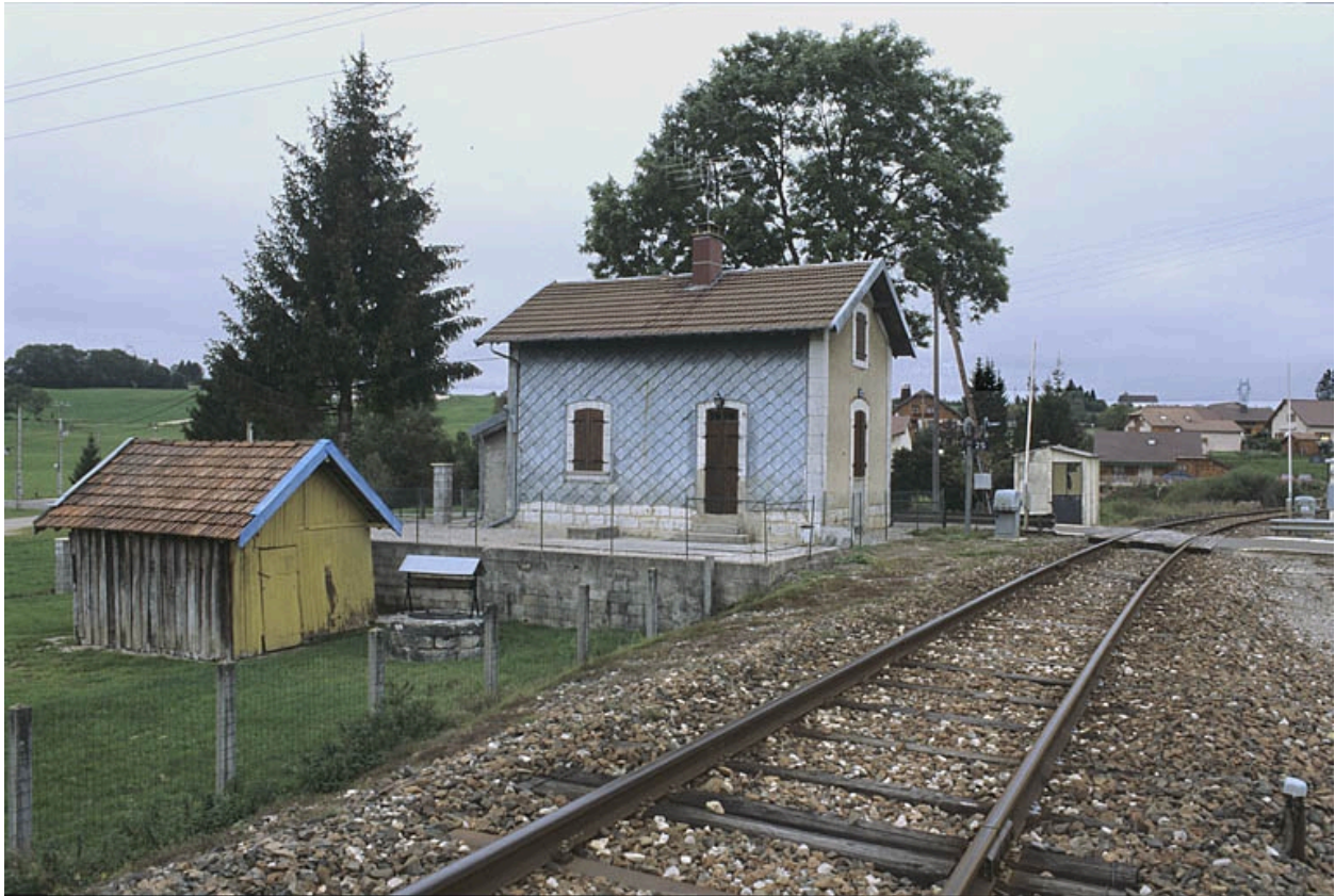
Elévations antérieure et latérale gauche.