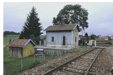
Elévations antérieure et latérale gauche. IVR43_20043900238ZA