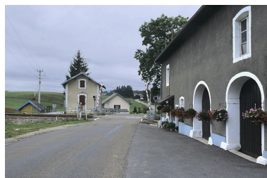
Vue d'ensemble, depuis l'est. IVR43_20043900236ZA