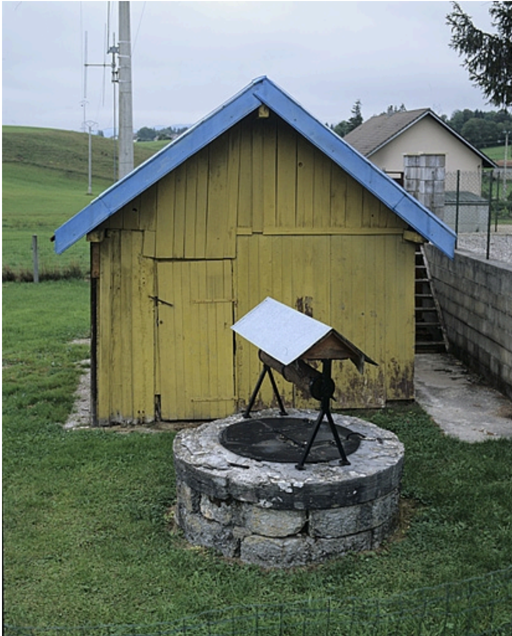
Puits et dépendance.