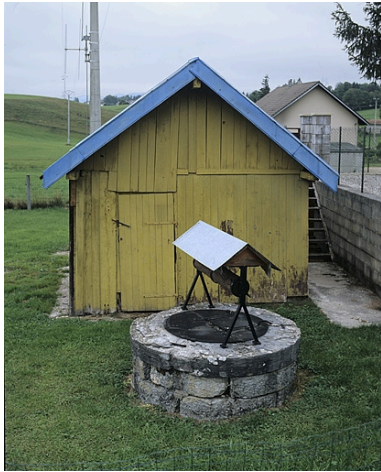
Puits et dépendance. IVR43_20043900240XA