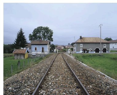
Vue d'ensemble depuis la voie, au sud.