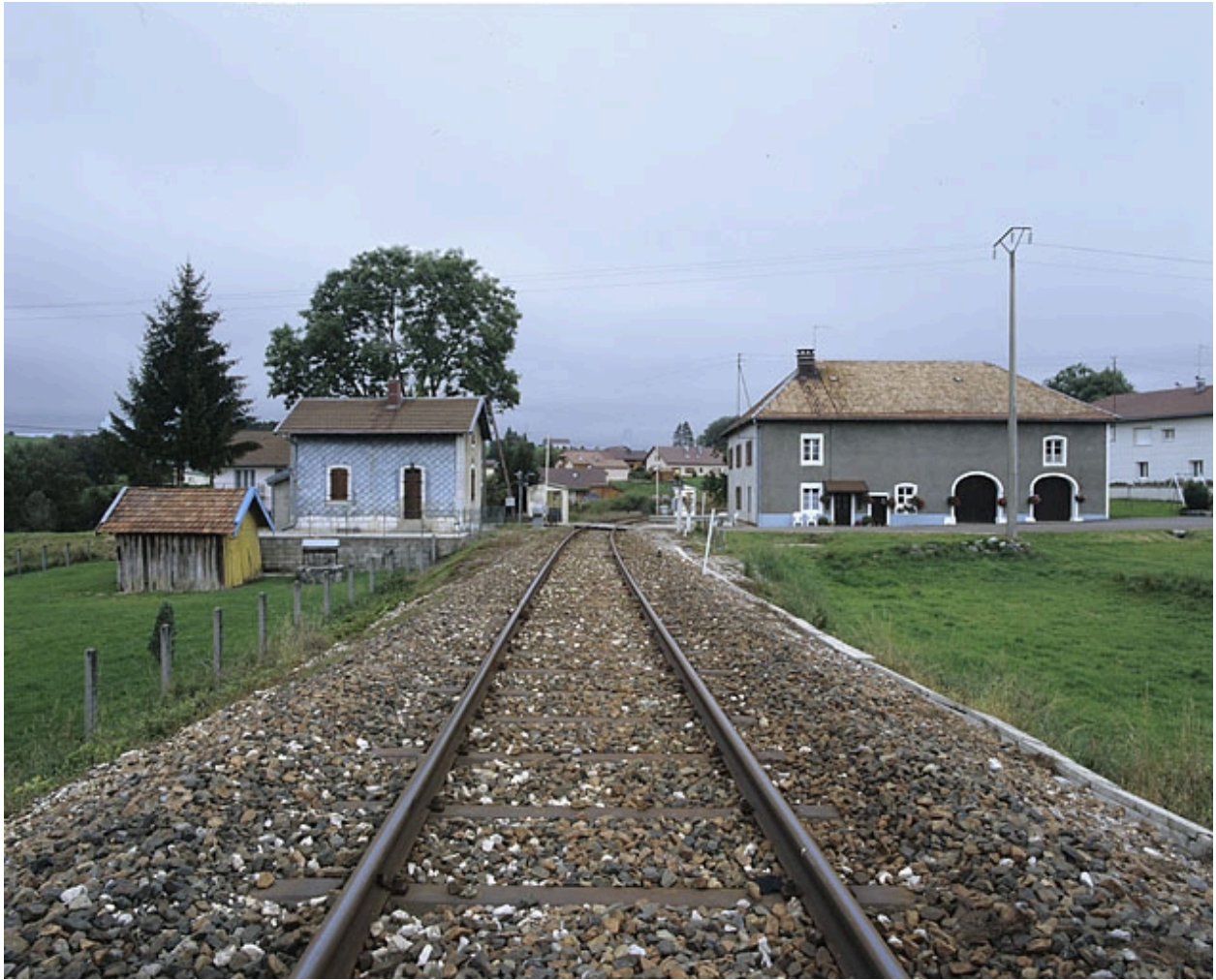
Vue d'ensemble depuis la voie, au sud.