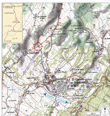
Carte et schéma de localisation. Carte topographique, IGN, 2000, dalle F087_049, échelle 1:25 000. Scan 25, licence n° 2008/CISE/2968. IVR43_20073900432NUDA