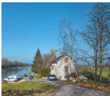
Pignon de la maison éclésièr de Poncey.