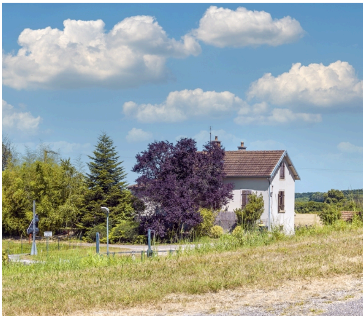
La maison éclusière de Poncey.