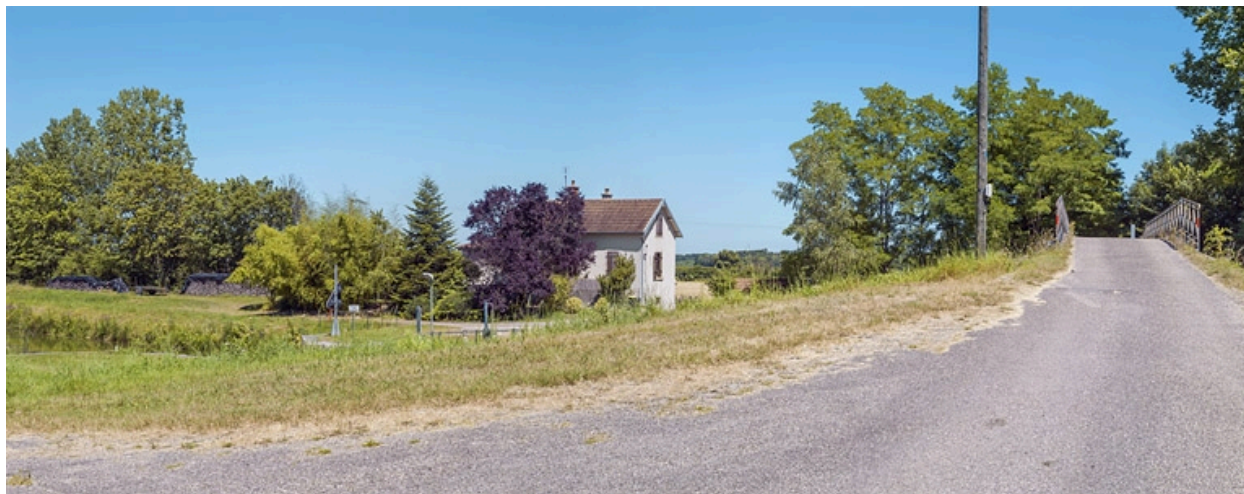
La maison éclusière.