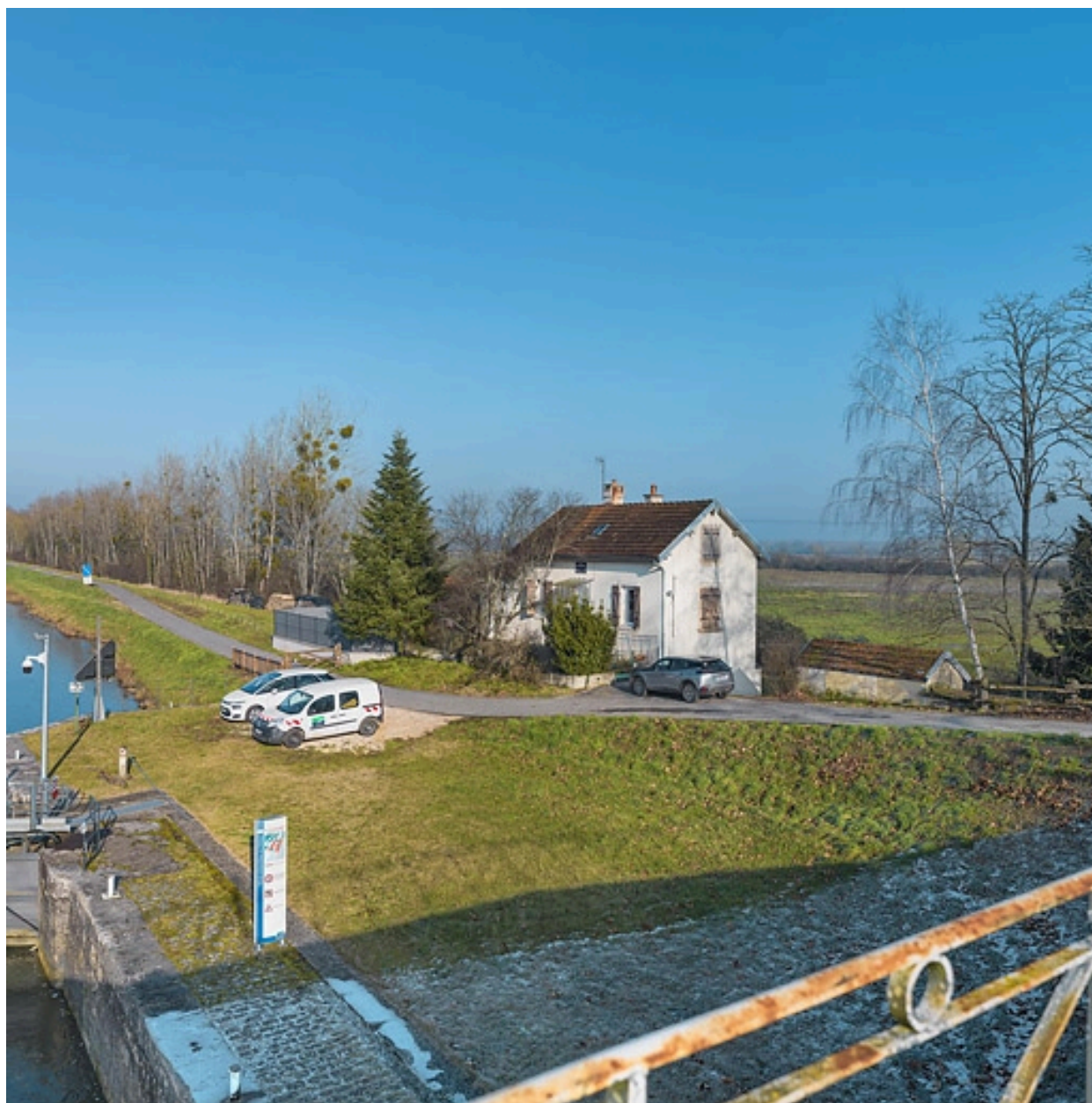
Maison éclusière de Poncey, vue depuis le pont sur écluse.