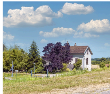
La maison éclésièr de Poncey.