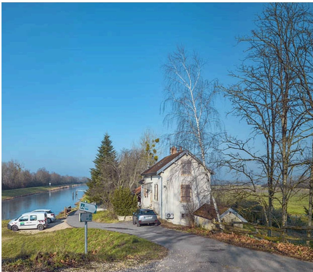
Pignon de la maison éclusière de Poncey.