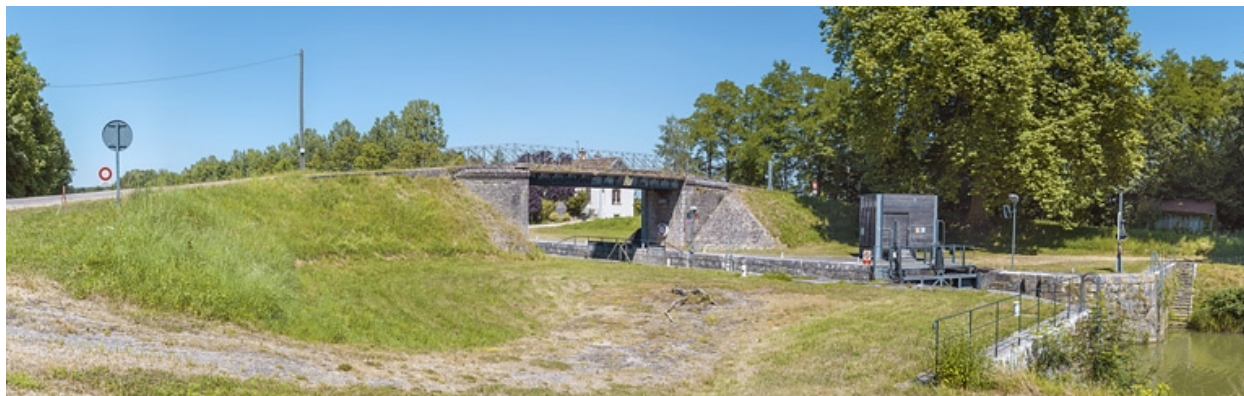
Vue d'ensemble du site d'écluse.